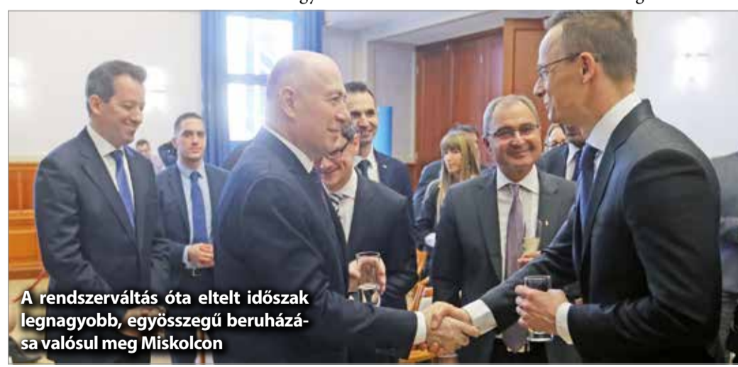
A rendszerváltás óta eltelt időszak legnagyobb, egyszögű beruházása valósul meg Miskolcon

– Az, hogy a világ egyik vezető légitársasága városunkat választotta új beruházása helyszínéül, az komoly elismerése annak a gazdaságfejlesztő munkának, amit a kormány és a városvezetés együtt végzett az elmúlt 8 évben – hangsúlyozta a városvezető. – Az elmúlt években vállalkozásbarát környezetet alakítottunk ki, miközben az élet minden területén fejlesztettük Miskolcot. Ennek ered-