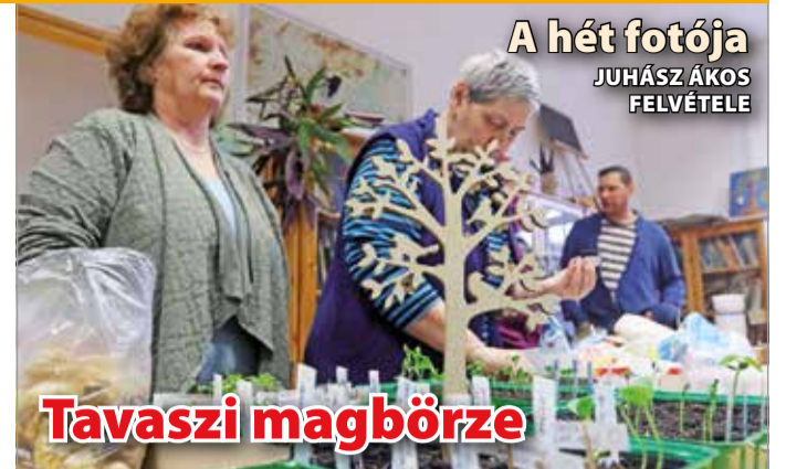
A hét fotója

További rendőrségi, katasztrófavédelmi, bírósági hírek első kézből hírportálunkon, a www.minap.hu honlapon.