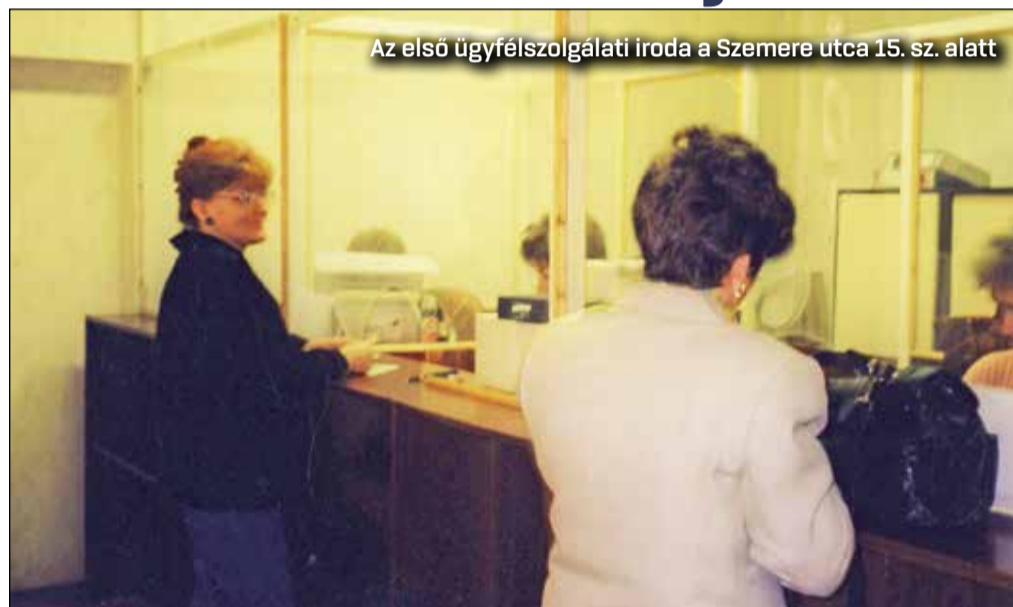
Az első ügyfélszolgálati iroda a Szemere utca 15. sz. alatt

A Tatár utcai Fűtőmű az 1980-as évek végétől az LKM-BORSODTÁVHŐ közös vállalatoként működött.