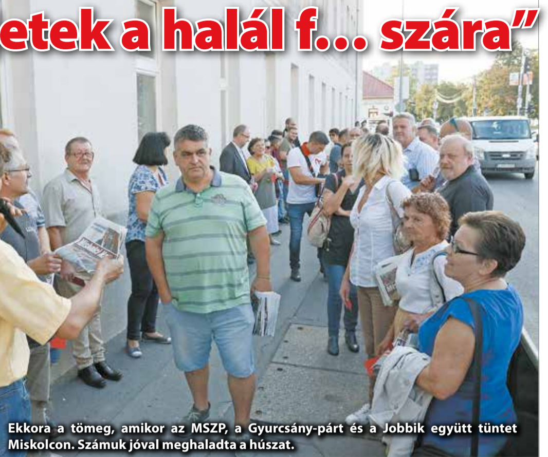
Ekkora a tömeg, amikor az MSZP, a Gyurcsány-párt és a Jobbik együtt tüntet Miskolcon. Számuk jóval meghaladta a húszat.