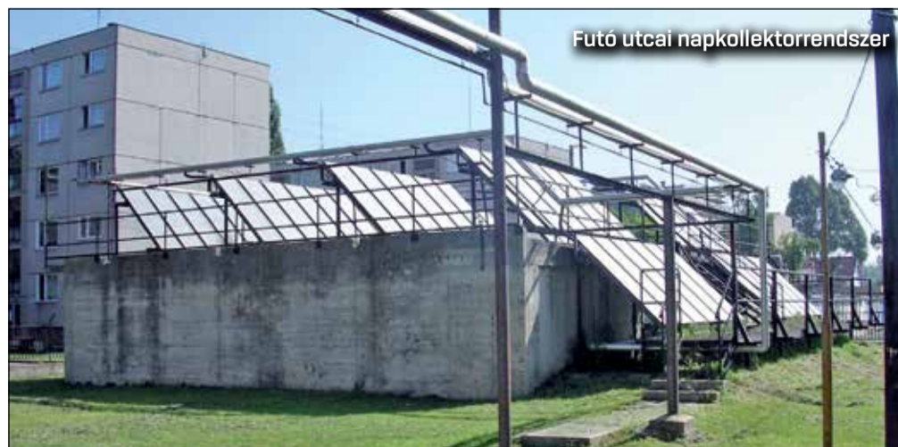
Futó utcai napkollektorrendszer