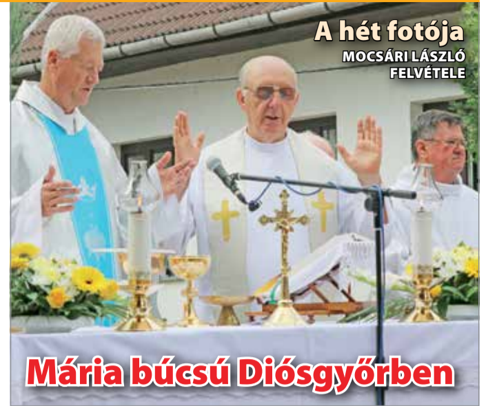
A hét fotója MOCSÁRI LÁSZLÓ FELVÉTELE

További rendőrségi, katasztrófavédelmi, bírósági hírek első kézből hírportálunkon, a www.minap.hu honlapon.