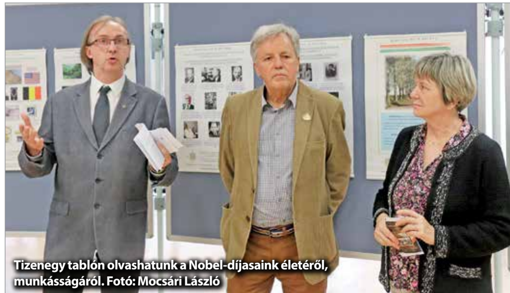
Tizenegy táblón olvashatunk a Nobel-díjasaink életéről, munkásságáról.

A tizenhat, magyar származású Nobel-díjas áll annak a tudománytörténeti kiállításnak a középpontjában, amit szerdán nyitottak meg a megyei könyvtárban. Közel egytucat tábló mutatja be életüket, eredményeiket.