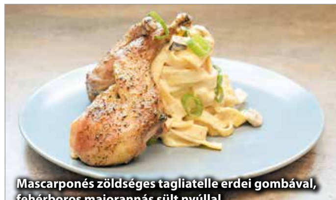
Mascarpone-s zöldséges tagliatelle erdei gombával, fehérboros majoránna-s sült nyúllal

A receptjei legjavát saját maga találja ki, vagy a már