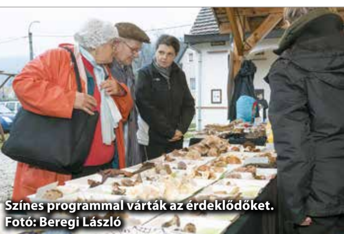
Színese programmal várták az érdeklődőket.