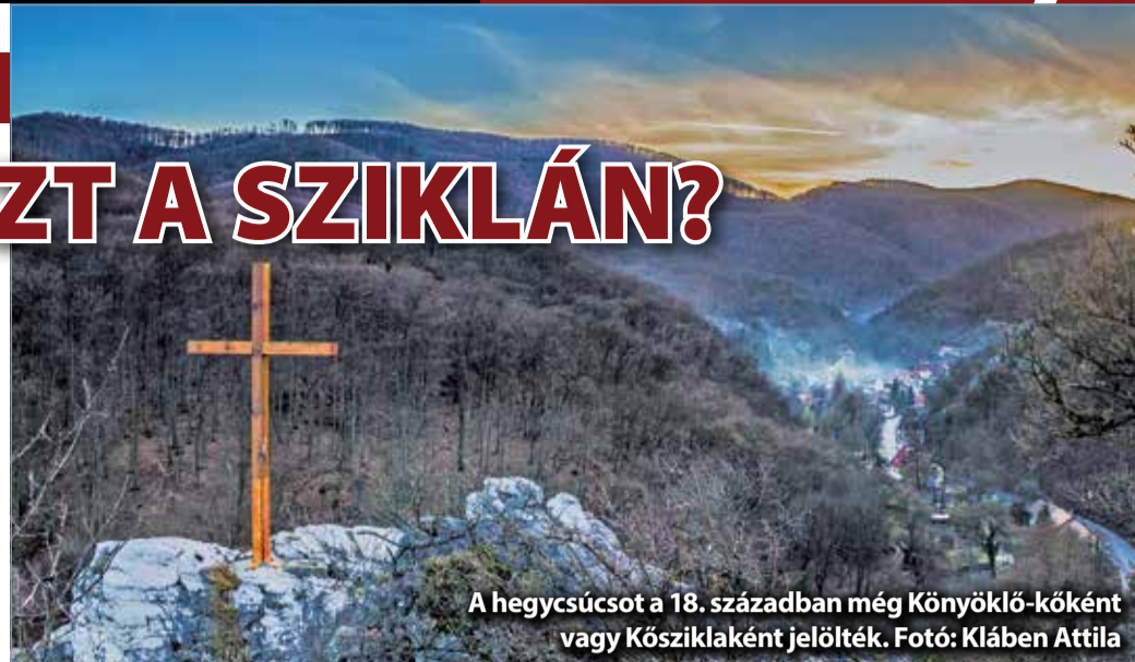
A hegycsúcsot a 18. században még Könyöklő-kőként vagy Kősziklaként jelölték.

gatás után a vidék legszebb hölgyét Mariskát, egy falusi bíró leányát vevé nőül. Hajh de az öreg molnár csak hamar észrevette, hogy Mariska mást szívelel, s őt csak szívből hizelgi körül. A féltés kinja majd nem örülttette a szegény öreget. Miután azonban semmiképp nem tudott nyomába jönni annak: vajjon kiért lánghol az ő gyönyörű Mariskája? Leskelődéshez folyamodott. Molnárunk malma egy meredek kőszikla alatt dübörgött, úgy, hogy a szikla tetejéről a malom udvarába és kertébe igen jól be s alá lehetett látni. Egy ünnepnapon tehát az ősz molnár, azon ürügy alatt, hogy bemegy a városba, elbűcsűzék féltett menyecskéjétől; de a helyett, hogy Diósgyőrbe ment volna, a malma fölötti szikla tetejére mászott, most már bizton tudandó: vajjon gyanúja alapos-e vagy nem? Alig telt el egy óranegyed, s a feszült figyelemmel leskelődő öreg molnár egy, felbokretázott kalapot, gyolcsinget, gatyát viselő hetyke parasztleányt vett észre a malom körül ólálkodni, s egyszersmind azt is látja, hogy neje kiütvén az ablakon, a legényt, kezével csókokat hányva reá, szobájába csalogatja. Amint erre a bokretás barna legény besurrant, az öreg molnár, mintha villám csapta volna meg, dühös lázba jő, s szörnyű idegrángatózás közt felkiáltván: „így jár a vén bolond, ki