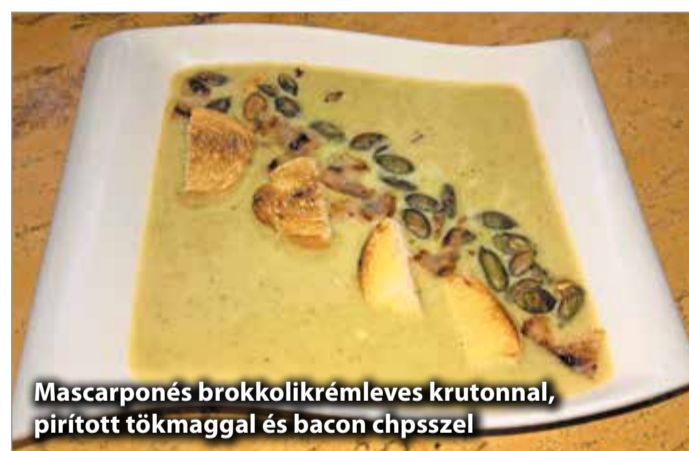
Mascarpone-s brokkolikrémléves krutonnal, pirított tökmaggal és baconchipszel

„A blogomban azt szeretném megmutatni, hogyan is lehet otthon, a rohanó hétköznapokban, az esti órákban is akár rövid idő alatt, egyszerű-