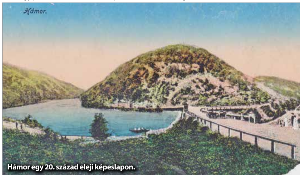
Hámor egy 20. század eleji képeslapon.