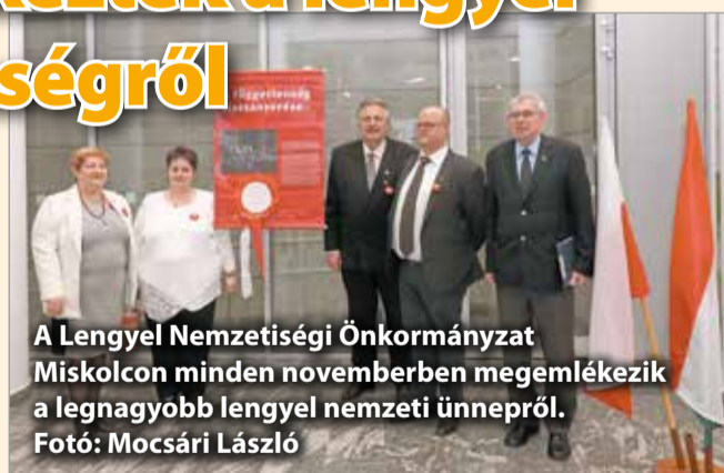
A Lengyel Nemzetiségi Önkormányzat Miskolcon minden novemberben megemlékezik a legnagyobb lengyel nemzeti ünnepről.

1918-ban, az első világháború után 123 évnyi felfosztás után Lengyelország visszaszerezte önálló állami státusát. A Lengyel Nemzeti Önkormányzat Miskolcon minden novemberben megemlékezik a legnagyobb lengyel nemzeti ünnepről. A megemlékezésnek és kiállításnak a városháza aulája adott otthont. A tíz darab molinó Lengyelország eltörlésétől a függetlenség visszaszerzéséig mutatja be a történelmet.