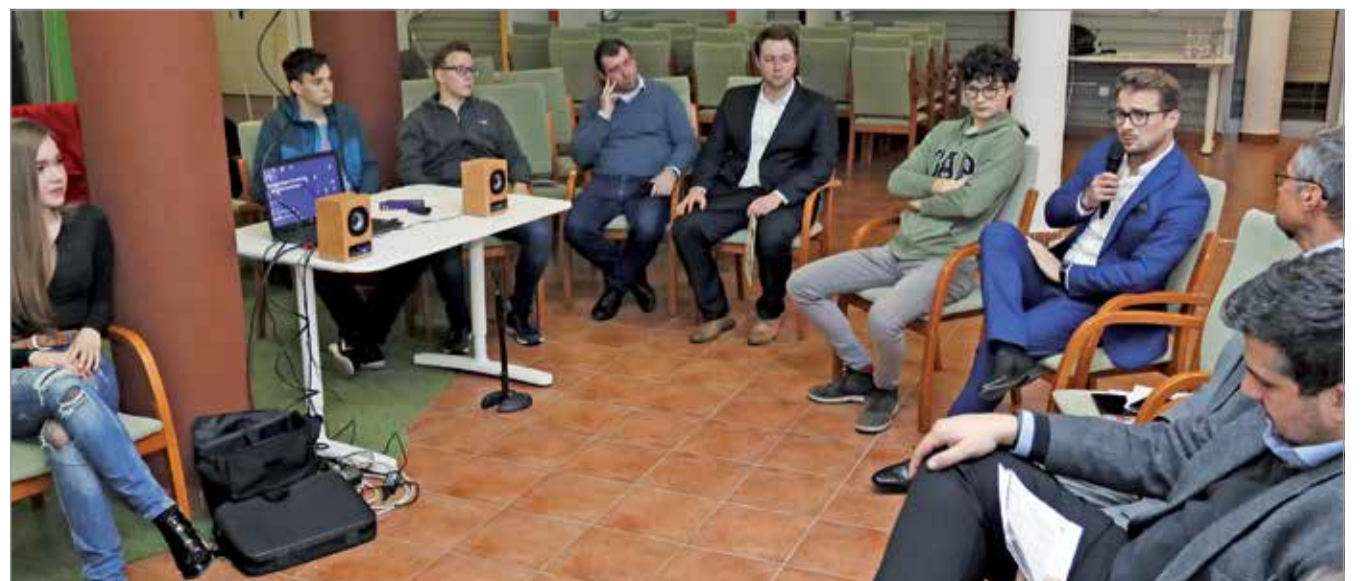
A fiatalok számára különösen fontos az újító szemlélet.

A Miskolci Egyetem az innováció bölcsőjeként különösen számít az újító szellemű, kreatív diákokra, emelte ki a rektorhelyettes. – Az egyetemeknek az innováció motorjává kell válniuk. Ezt segíti, hogy az egyetemeken fenntartója, az Innovációs és Technológiai Minisztérium lett, és megvan az egyetemen az a potenciál, hogy az innovatív ötletekhez a technológiai és a tudományos háttérrel meg tudja adni – hangsúlyozta Czap László. A road show az Ifjúsági Tudományos és Innovációs Tehetségkutató Verseny hírére is elhozta a miskolci diákoknak. A verseny győztese az ösztöndíjon túl a 2020-as Nobel-díj átadón is részt vehet.