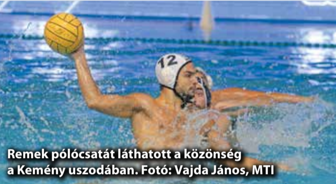
Remek pólócsatát láthatott a közönség a Kemény uszodában.