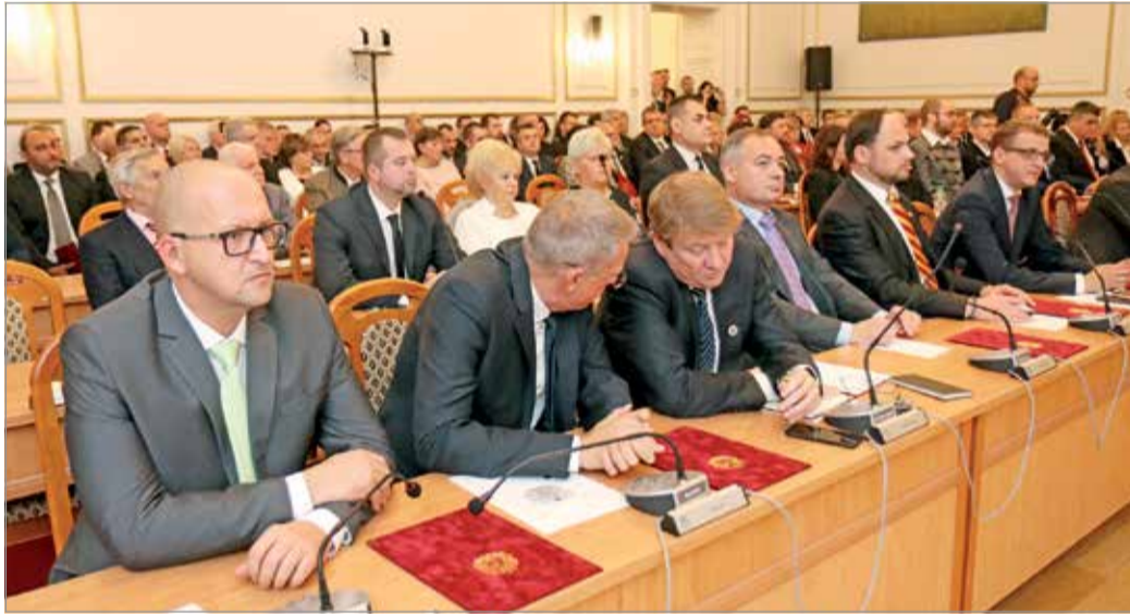
A miskolci közgyűlés 27 önkormányzati képviselőből áll, három frakció alakult: Velünk a Város, Fidesz, KDNP.