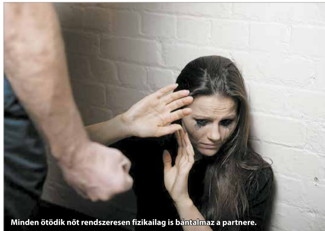
Minden ötödik nőt rendszeresen fizikailag is bántalmaz a partnere.

hetente legkevesebb egy nő hal bele kapcsolati erőszakba, ez évente legalább 52 nőt jelent. A bántalmazott gyerekek számát csak becsülni tudják. Hazánkban több százezer olyan gyerek él, aki hozzátartozó által elkövetett testi, lelki vagy szexuális erőszak áldozata – írja a nane.hu.