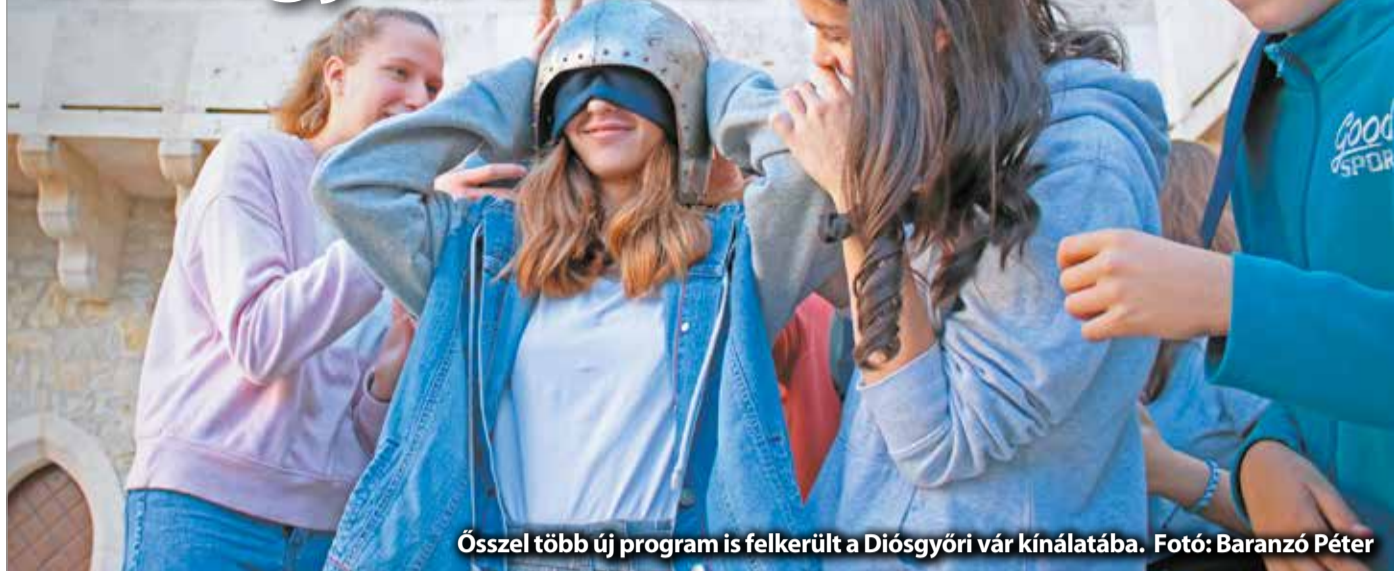
Ősszel több új program is felkerült a Diósgyőri vár kínálatába.