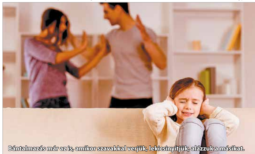
Bántalmazás már az is, amikor szavakkal verjük, lekicsinyítjük, alázzuk a másikat.

– A férfi áldozatok esetében leginkább lelki, szóbeli bántalmazás és gazdasági erőszak figyelhető meg, a nők esetében