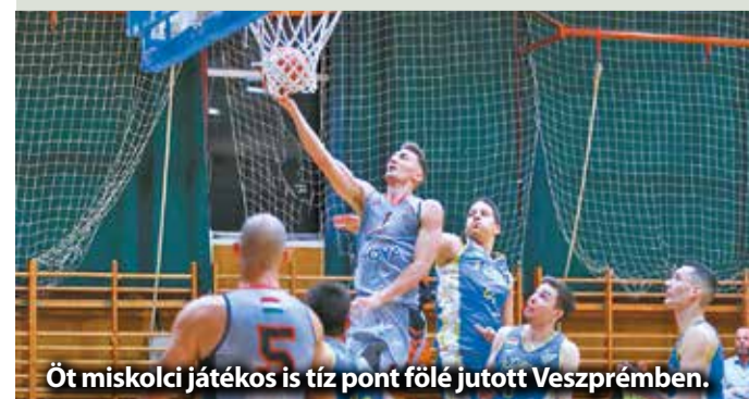
Öt miskolci játékos is tíz pont fölé jutott Veszprémbe.