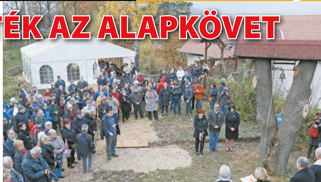
A születésnapon egy kis lélekharangot is felszenteltek.

Az elmúlt két évtized egyik legnagyobb vállalkozásába kezd a Szimbiozis Alapítvány. Uniós és hazai forrásból család-barát panziót építenek a Baráthegyi Majorságban. Az épület alapkövét hétfőn tették le. Az új panzió jövő nyár végére készül el, és 27 hátrányos helyzetű, főleg fogyatékos és meg-