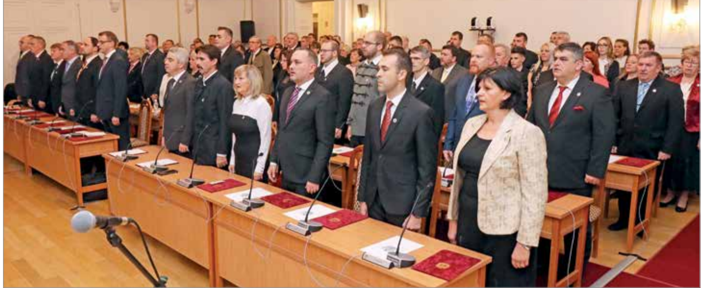
Az alakuló ülésen tettek esküt a városatyák.

Veres Pál megköszönte a választók bizalmát, amivel felruházták őket, gratulált a képviselőknek. A polgármester úgy fogalmazott: a választás nagy felelősséget és felhatalmazást adott számára, a város vezetését szolgálatnak tekinti. Kossuth Lajost idézve kifejtette: „mindent a népért, mindent a néppel együtt, semmit a népről a nép feje felett. Ez a demokrácia.” Azt is elmondta, hogy szeretne méltó lenni Miskolc legendás polgármestereihez, akik megteremtették Nagy-Miskolcot. Hogy miben áll Nagy-Miskolc? Egy olyan települést szeretne, ahol jó élni, ami él a benne rejlő lehetőségekkel, és amire büszkék a városlakók. Programjukat közel félszáz szakértő bevonásával alkották meg, de fontos volt számukra a választópolgárok véleménye is, közel harmincezer javaslat érke-