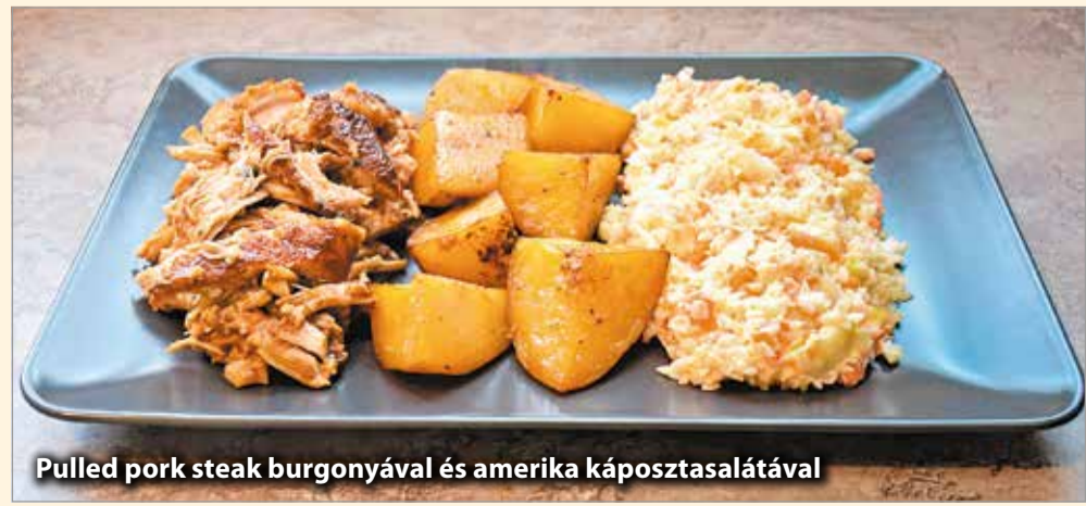
Pulled pork steak burgonyával és amerika káposztasalátával

4. A salátához a káposztát és a sárgarépát apró kockára vágjuk késsel vagy géppel. A hagymát lereszeljük a sajtreszelőn, hozzáadjuk a káposztához. A többi összetevőt egy tálban összekeverjük, majd a káposztára öntjük és átforgatjuk. Köretnek hasáb- vagy steakburgonya az igazi.