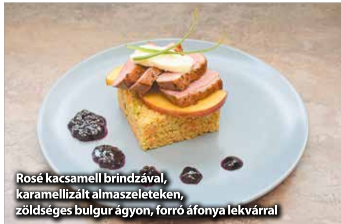
Rosé kacsamell brinzával, karamellizált almaseleteken, zöldses bulgur ágyon, forró áfonya lekvárral