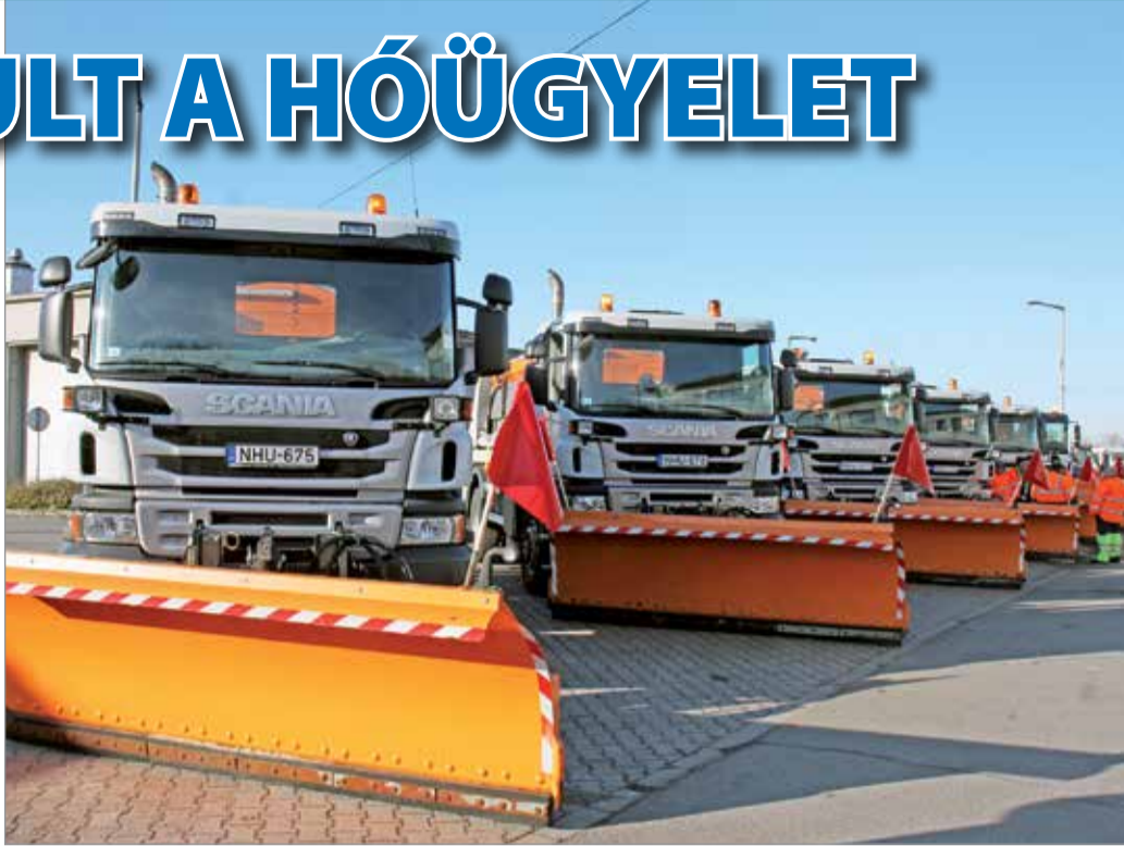
A síkosságmentesítést és a hó eltakarítását a MIREHU végzi hat speciális, tololappal felszerelt szórógéppel.

A hóeltakarítási munkát elsődlegesen a rendőrségtől, a mentőktől, a katasztrófavédelemtől, valamint a Miskolc Városi Közlekedési Zrt. járművezetőitől beérkező információk alapján szervezi meg a hóügyelet diszpécser szolgálat. A munkaszervezésben elsőbbséget élveznek a nagy forgalmú, a közönségi közlekedéssel érintett utak és az autóbúsvonalak, ezek síkosságmentesítését követik a gyűjtő utak, majd a meredek és forgalmas mellékutak és a díjköteles felszíni parkolók. A