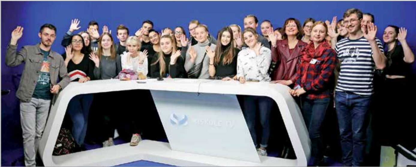
A Miskolc TV stúdióját is görcső alá vették a diákok.

Hogyan indul el a híradó, milyen egy napi adás, hol forgatnak a stábok, milyen témák vannak a honlapon és mi a dolga egy tördelőnek? – ezekre a kérdésekre is választ kaptak az Erasmus + nemzetközi cserediákprogram résztvevői és zrínyis diákok a MIKOM-ban.