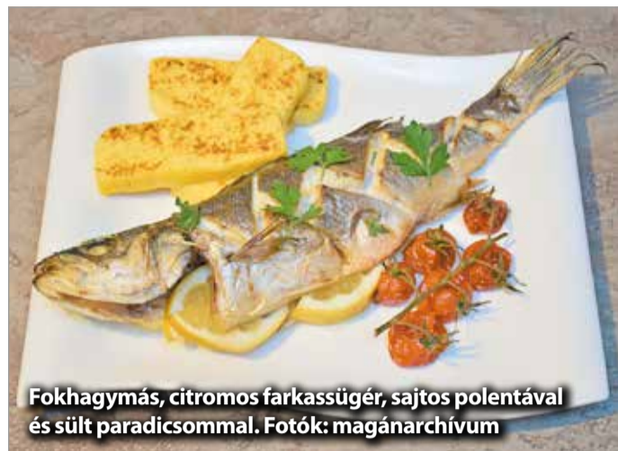
Fokhagymás, citromos farkassügér, sajtos polentával és sült paradicsommal.

meglévőket alakítja át saját ízlésére. – Szeretem a főzős műsorokat, lehet az versenyszerű