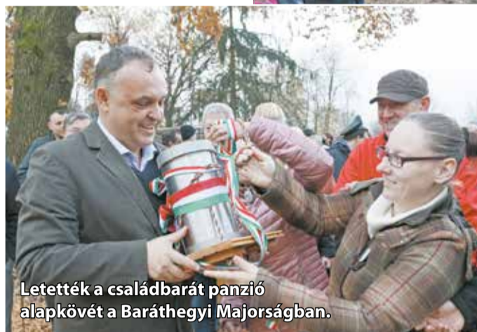
Letették a családbarát panzió alapkövét a Baráthegyi Majorságban.

164 millió forintból család-barát panzió épül a Baráthegyi Majorságban. Az alapkövet már letették. Az épületben wellness részleg is lesz és 27 új munkahelyet is létrehoznak a fogyatékos-sággal élő és megváltozott munkaképességűeknek. Az alapítvány huszadik születésnapjára ünnepségen egy lélekharangot is felavattak a majorság udvarán.