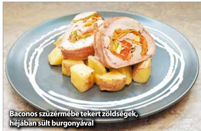
Baconos szűzermébe tekt zöldségek, héjában sült burgonyával

ről tanúskodik, hiszen gyönyörű fotókon láthatunk igényes tálalással kínált étkeket, melyek nevei is arról árulkodnak, hogy valami nagyon bonyolult alkotási folyamat eredménye egy-egy fogás. Szűcs István azonban azt mondja, valóban az egyszerűsége törekszik.