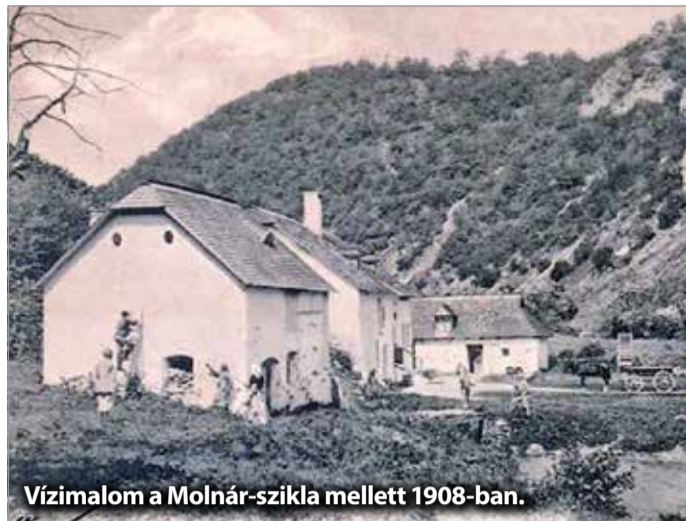
Vízimalom a Molnár-szikla mellett 1908-ban.

Egy igazán jó hírrel szolgálhatok azon olvasóinknak, akik kissé kitekinténe a miskolci helynévteljesítőből, hiszen ezen a héten megvizsgáljuk a város talán legizgalmasabb és vélhetően legismertebb legendáját.