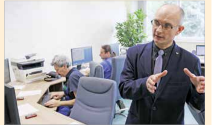
A MIHŐ szolgáltatási igazgatója elmondta, a radiátorokat a külső hőmérséklet alapján szabályozzák.

A bejelentések alapján a MIHŐ Kft. több lakásban is hőfokmérést végzett, melynek eredményeként a helyiségek hőmérséklete 22-24 Celsius fokot ért el. A MIHŐ Kft. azt tanácsolja fogyasztóinak, hogy bejelentés előtt mérjék meg az adott helyiség hőmérsékletét, és amennyiben nem éri el a lakóközösség által elfogadott és kért hőmérsékleti értéket, akkor keressék a közös képviselőt illetve a fűtési megbízottat, aki intézkedhet a fűtési menetrend állításáról.