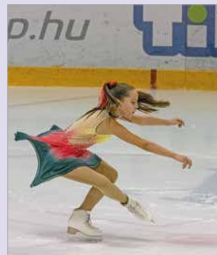
Hazai pályán mutatkoztak be a DVTK tehetségei.