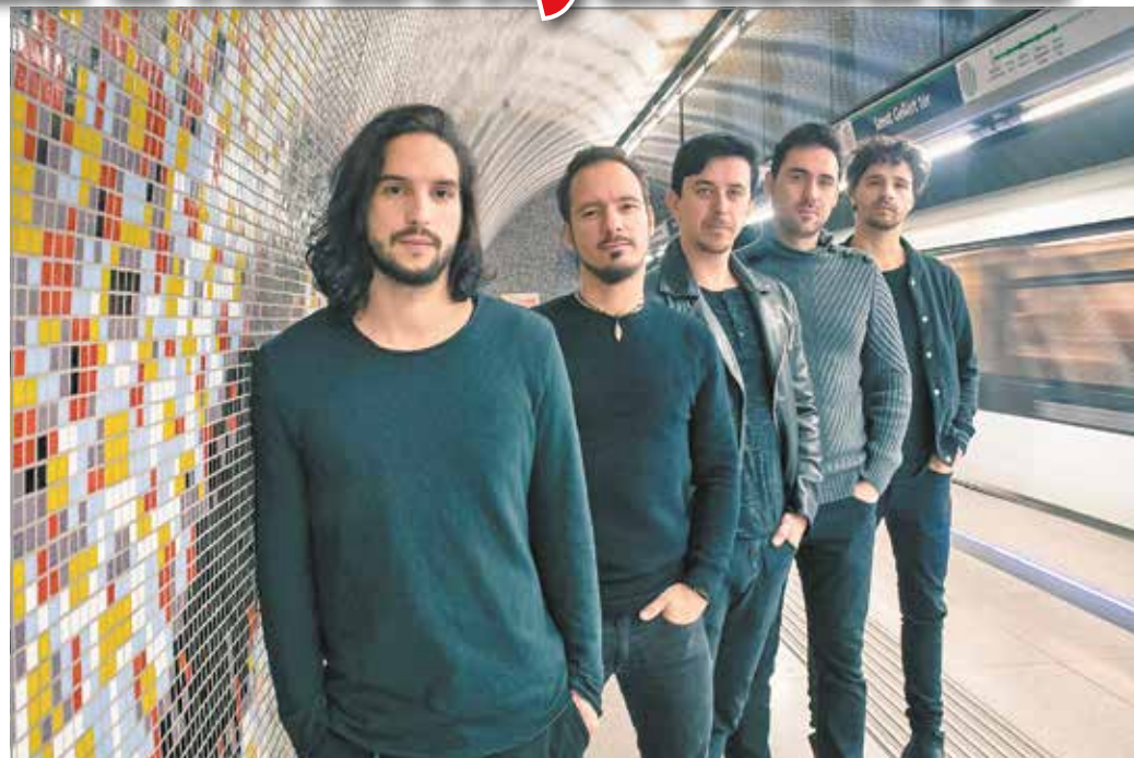
Bagossy Brothers Company

Hét év után újra hasonló különlegességek várják majd a vendégeket a Miskolci Kocsonyafesztiválon, ami – ha már visszatér – igazi közönségkedvenceket is hoz magával. Bagossy Brothers Company, Esti Kornél, 30Y, Anna & the Barbies, Random Trip, Balkán Fanatik, Ladánybene 27, Paddy and