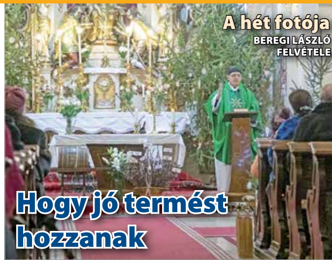
A hét fotója BEREGI LÁSZLÓ FELVÉTELE