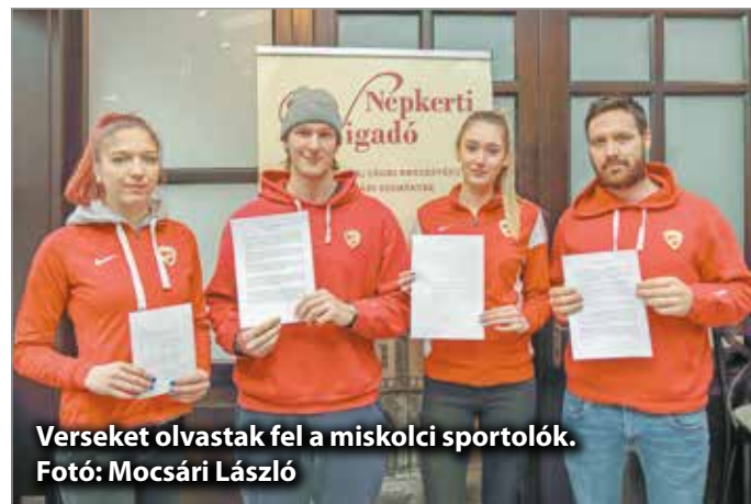
Verset olvastak fel a miskolci sportolók.

– Kultúránk nemzeti fennmaradásunk és megmaradásunk alapköve, hiszen azok az értékek, amelyek a zenében, irodalomban, művészetekben fellelhetők, magyarságunk sokszínűségét és nemzeti iden-