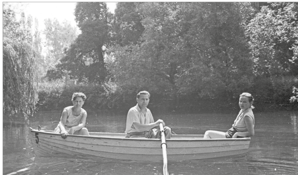
Csonakázó Miskolctapolcán 1957-ben.

Arról, hogy településünk története a tapolcai monostoralapítással kezdődhetett, már Anonymus krónikájából, és későbbi egyháztörténeti iratokból tudunk. De annak, hogy ez pontosan hol állt, nem találtuk nyomát. A régészek és a történészek véleménye is az volt, ha sikerülne megtalálni az apátság romjait, az már egyér-