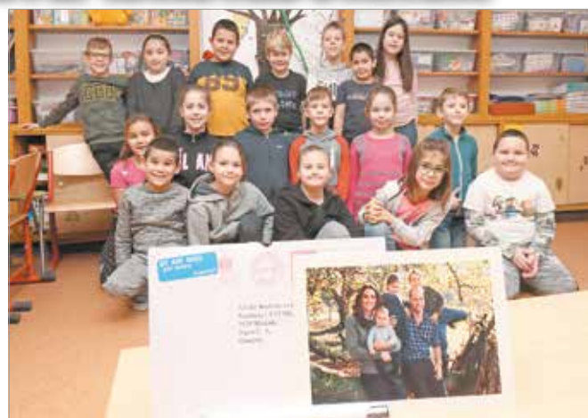
Nagy volt a meglepetés, amikor megérkezett a válasz.

Az osztály azóta lázban ég: több videót megnéztek a hercegi esküvőről, és gyakran téma beszélgetéseik során is a levél. Az egyik kislány, Aranyosi Péter úgy fogalmazott: „nagyon boldogok voltunk, amikor felbontottuk a borítékot, és ott volt benne a válasz. Olyan, mintha a barátaink írtak volna nekünk”, lelkeskedett. Osztálytársa, Mucsi Mar-