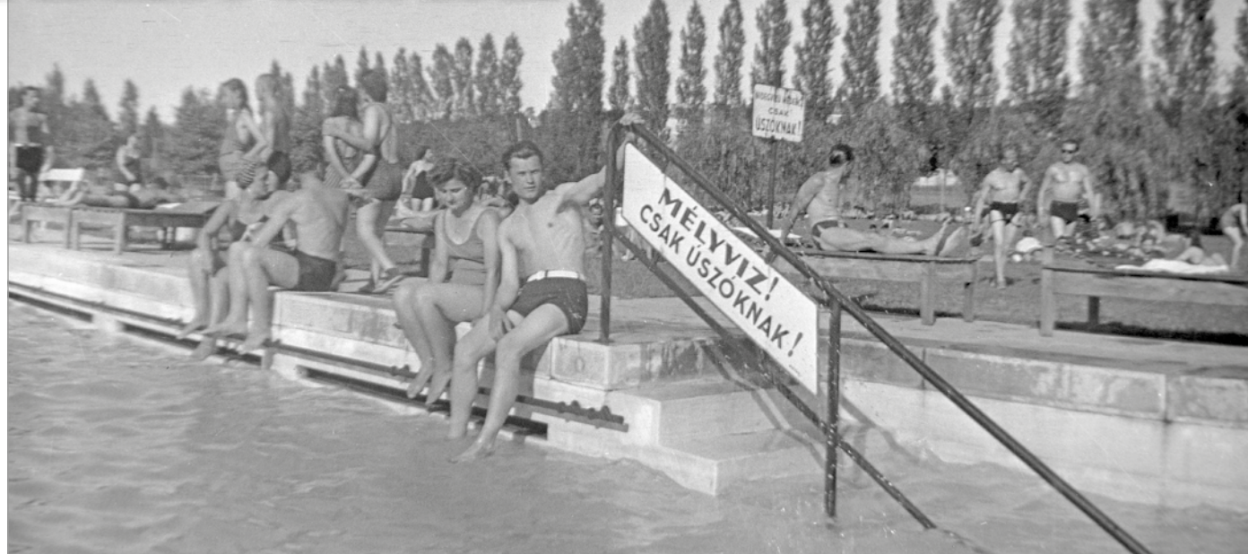
A miskolctapolcai strandfürdő 1931-ben.

telmü bizonyíték lenne arra, hogy igazak a Miskolc eredetere vonatkozó korabeli leírások. És ahogy az lenni szokott, a szerencse mellénk szegődött. 2004 végén Miskolc pályázatot nyújtott be az Európai Unió