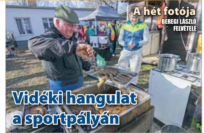
A hét fotója