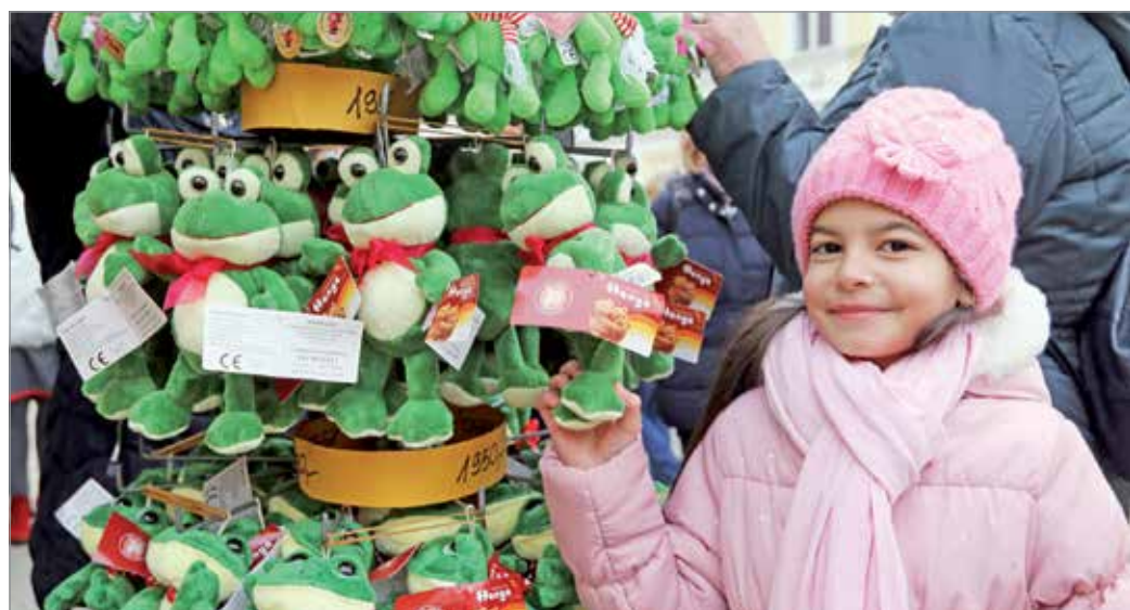
Melyik lesz a hercegem?