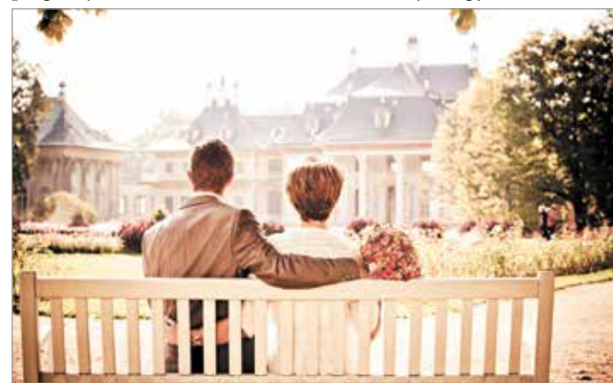
A házasság: szövetség.

belüli együttélés fontosságára hívja fel a figyelmet. Miskolcon is egyházak és civilszervezetek hangoztatták programjaikon a házasság és a család fontosságát. Holtomiglan címmel rendeztek konferenciát sikeres