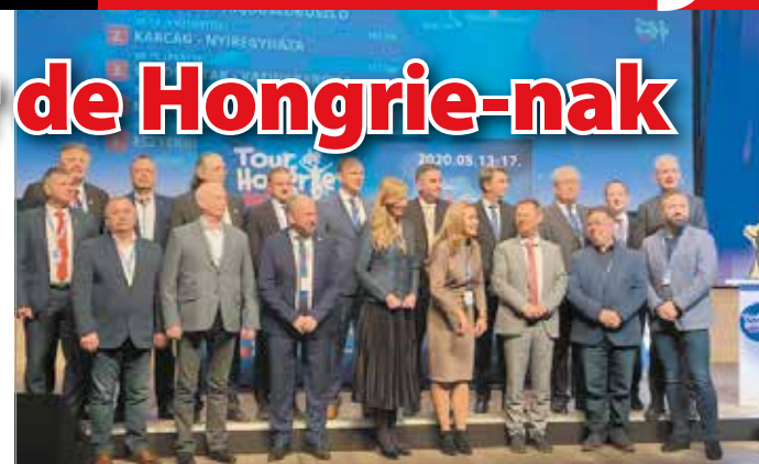
Gála keretében mutatták be a Tour de Hongrie útvonalát.

Az idei Tour de Hongrie május 13-án Debrecenből rajtol. A nemzetközi mezőny 5 versenynap alatt, 7 megyét érintve, ösz-