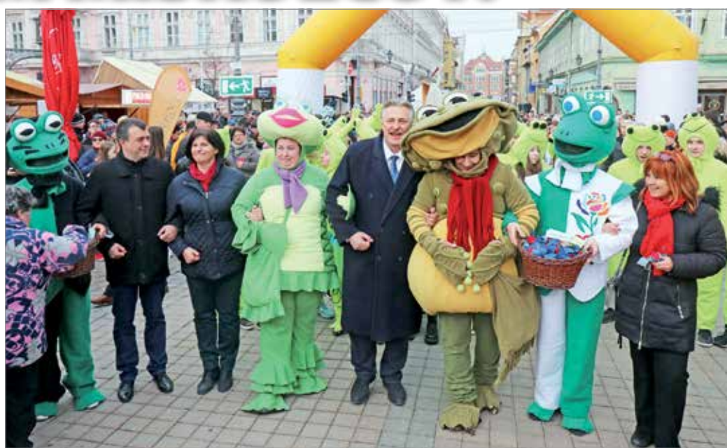
Pénteken délután felvonulással kezdődött a fesztivál.

Szabad ember vagyok, aki nem fél szembeszállni azokkal, akik a miskolciak, a város érdekeit, boldogulását, fejlődését veszélyeztetik. Bárki is legyen az, ahogyan ezt az elmúlt hét évben is bebizonyítottam. Mert az igazi értékekért mindig kész voltam és vagyok harcolni. Az élet és a Kúria engem