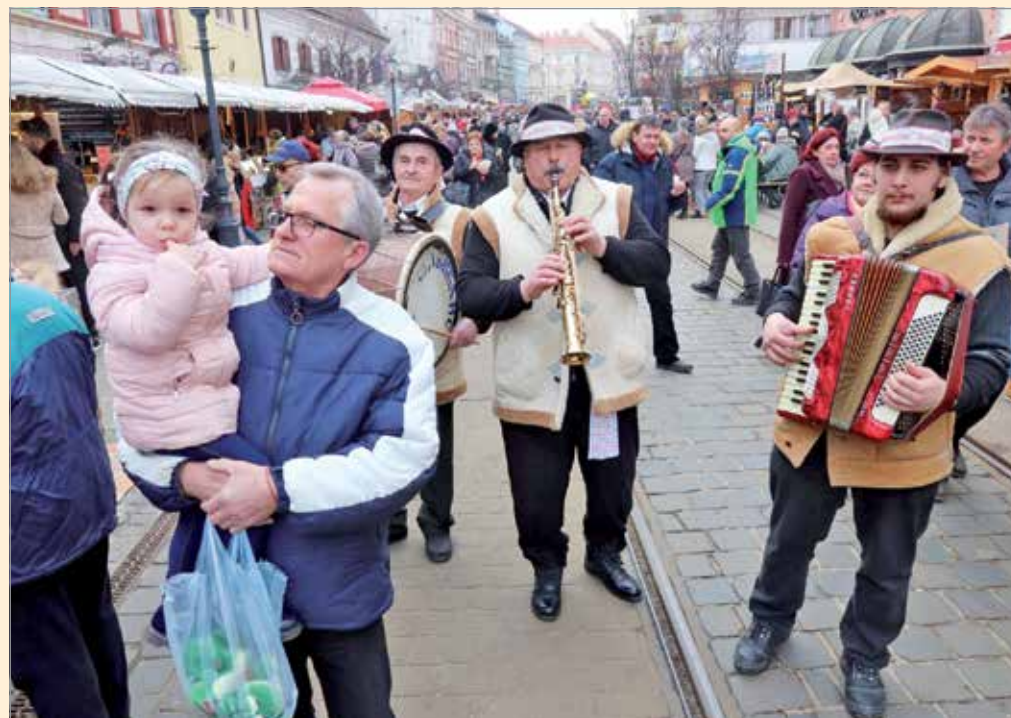
Fesztiváli hangulat a főutcán.

mokat valóban nekik, velük és értük szervezik. Mi, miskolciak tudjuk, milyen végigsétálni a Forinton, várni valakire az óra alatt a Villanyrendőrnél, körbenézni Nagy-Miskolcon az Avasi kilátóból. Ez bennünk van, a zsigereinkben, a szívünkben. Büszkék vagyunk a városunkra, a múltunkra, a legendáinkra. És arra is, hogy a Kocsonyafesztiválnak köszönhetően Miskolc a gasztronómiai és a fesztiváltérképre is felkerült, hogy ma már alighanem mindenki tudja, honnan ered a mondás: pislog, mint miskolci kocsonyában a béka. És arra is büszkék vagyunk, hogy a régi Kocsonyafesztiválok három napig tényleg együtt volt a város, együtt élte újra a legendát, és ezt nem lehet csupán koncertekkel, ringlispíllal meg cellovöldével helyettesíteni, ahogyan ezt az utódrendezvényeken próbálták. A miskolciaknak a magukénak kell érezniük a fesztivált ahhoz, hogy szeressék, és hogy az valóban sikeres lehessen. Az az eredeti Kocsonyafesztivál a miskolci emberek fesztiválja volt, és az a célunk, hogy újra az legyen. Mert hiszünk abban, hogy a Kocsonyafesztivál Miskolcon van itthon, és minden miskolcié.