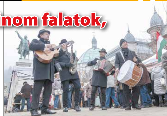
Az Agyagbanda Zenekar koncertje felpezsdíti a hangulatot még a hideg időben is.

képesek voltak a város bármely végéből is elzarándokolni értük. Miután a pékmester az égi sütődébe távozott, a felesége vitte tovább az üzletet. Az özvegy egymaga nehezen bírta az iramot. A türelmetlen vevők viszont nem kímélték, és különböző, nem túl hízelgő megjegyzésekkel illették. Sikertől is egyszer az asszonyt úgy felbőszítette, hogy az cifra káromkodások közepette kikapott egy darabot a kelt tésztából, és a szemtelenkedő vásárló képébe irányozta. Szerencsére elvettette a célpontra. A tészta egy forró olajjal teli lábasban landolt – így készült el az első fánk, amely már a helyszínen nagy sikert aratott.