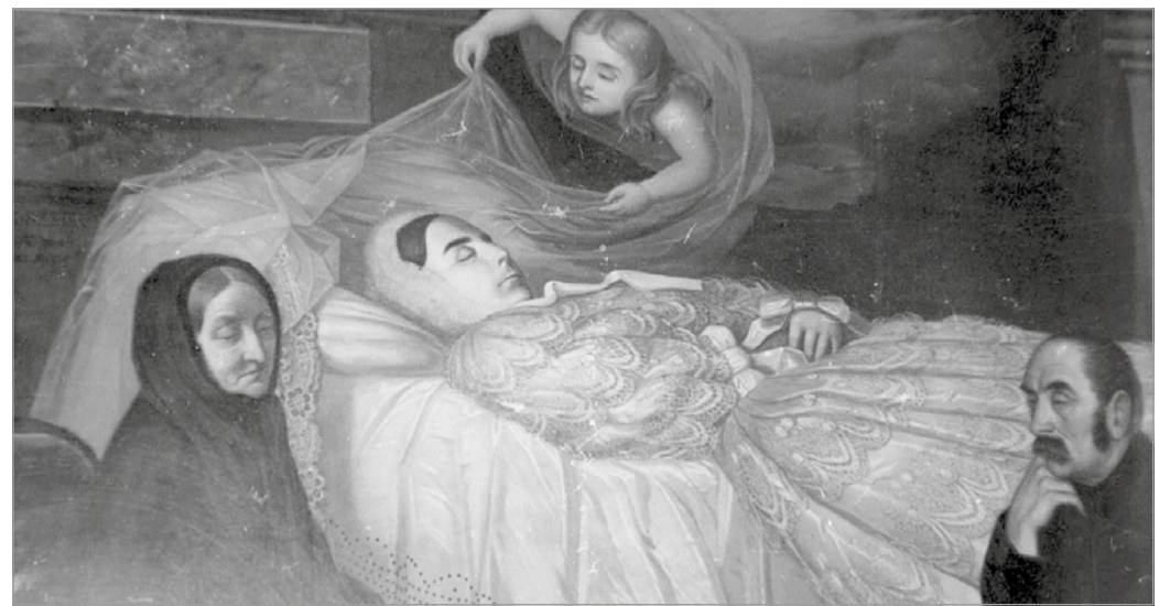
Bató Eszter halálát ábrázoló festmény