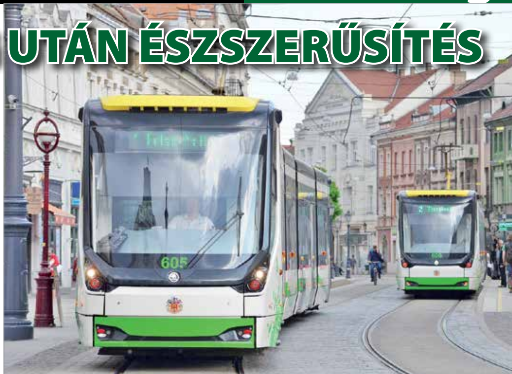
Csúcsidőszakban nem lesz változás, de a második negyedévtől szombaton is vasárnapi menetrend lép érvénybe

– Mintegy félmilliárd forint pluszforrást jelenthet az MVK-