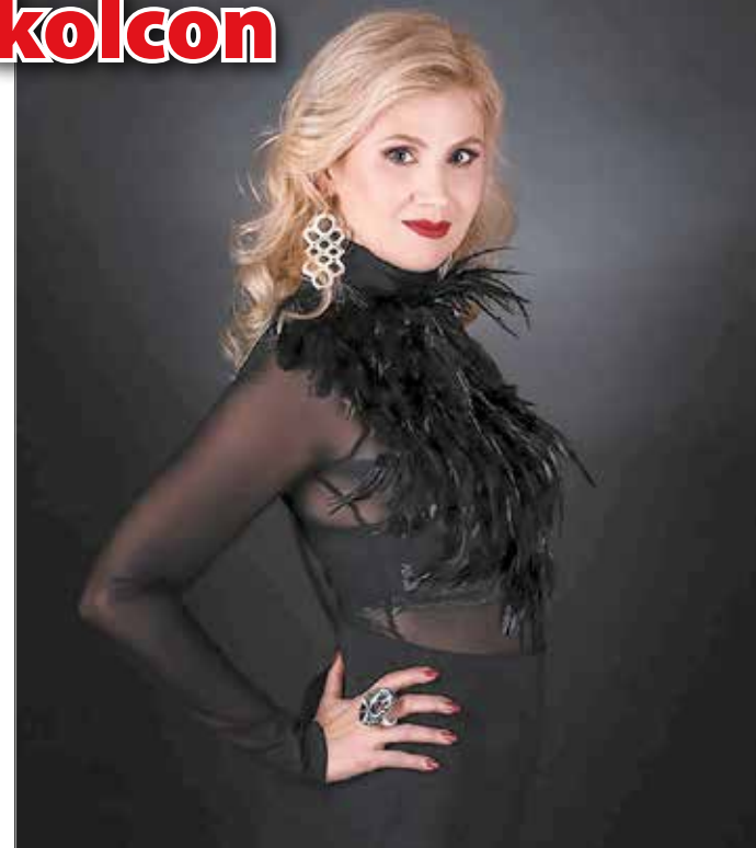
A Görömbölyi Művelődési Ház vendége lesz Kovács Nóri

A Görömbölyi Művelődési Házban, március 20-án rendezésre kerülő est vendége lesz Kovács Nóri, a népzene és világzene műfajának egyik legismertebb, szakmailag is elismert előadója, aki több mint tizenöt éve van a profi előadói pályán. Ezen időszak alatt több mint harminc lemezen működött közre és 13 szólóalbuma jelent meg. Olyan zenekarokkal és előadókkal dolgozott együtt, mint a londoni Transglobal Underground, a BBC Scottish Symphony Orchestra, a 100 Tagú Cigányzenekar, Wolf Péter és a Liszt Ferenc Kamarazenekar (Lelkem szárnyai), az MR2 Szimfonikusok, Berecz András (Sinka ének, Rokonok söre), Motiva (Ez a világ, Neked szól, Átölel a szerelem), a Rajkó zenekar, Balázs Fecó (Összetar-