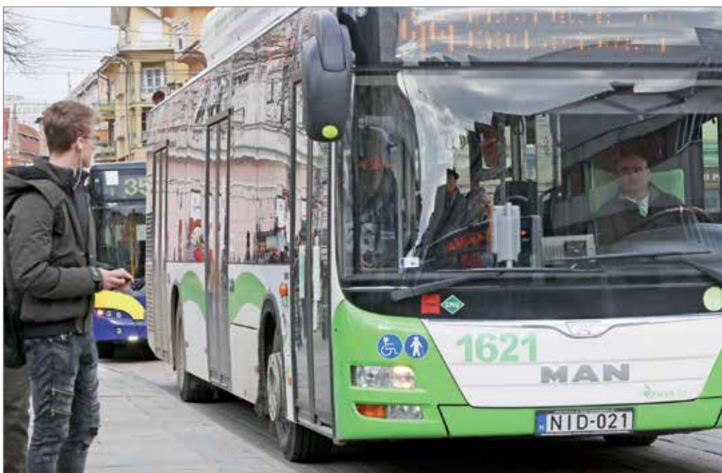
2012. óta nem változtak a jegy- és bérletárak

A még meglévő 70 dízelautóbust is lecserélik új, korszerű CNG-járművekre. Saját forrásból pedig 5 gázüzemű midibuszt vesznek. Az értékesítési rendszert is fejlesztik idén: jegyautomatákat helyeznek ki Miskolc húsz frekvenciáján. Budapest és Tata-bánya után pedig – harmadik magyar városként – bevezetik a mobiljegyet.