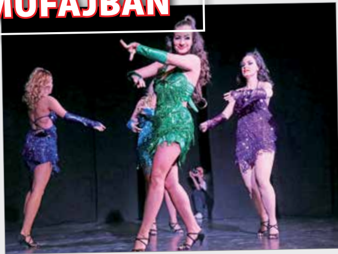
Hastánc, kubai salsa, társastánc, girly street dance és hip-hop – többek között ezeket a műfajokat is felvonultatták a B-Dance Mozgásstúdió gáláján, az Ady Endre Művelődési Házban. A műsorban megközelítőleg ötven fellépő szerepelt, ők a haladótáncos-csoportokat képviselték a hétvégén.