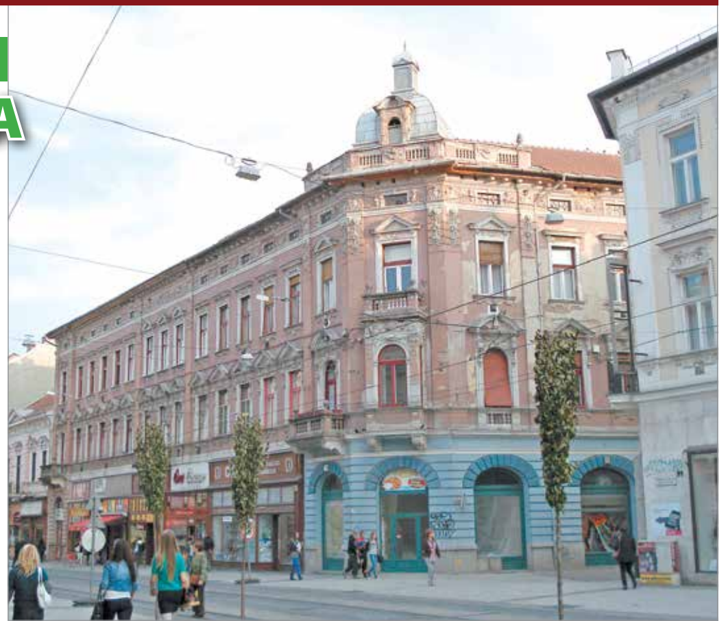
A Széchenyi utca 62-64. szám alatt ma is látható a Rácz-palota

abból, amit holta utánra rendelt el vagyonából.”