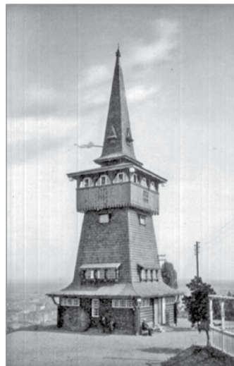
Az 1934-ben átadott épület Rákóczi-kilátóként volt ismert