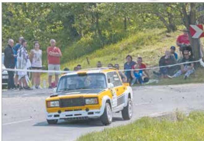
A tavalyi Miskolc Rally is nagy sikert aratott.

A koronavírus-járvány miatt el sem kezdődhetett a rally-szezon, és több futamot is el kellett halasztani. Sokáig kétséges volt mikor és hogyan számulhatnak majd a versenyautók az idei kiírásban. Majd május 12-én megjelent a Magyar Nemzeti Autósport Szövetség közleménye, melyben a rallyszakág vezetője, Berényi Ákos arról adott tájékoztatást, hogy elkészült a versenynaptár. A szezon 6 futamból áll