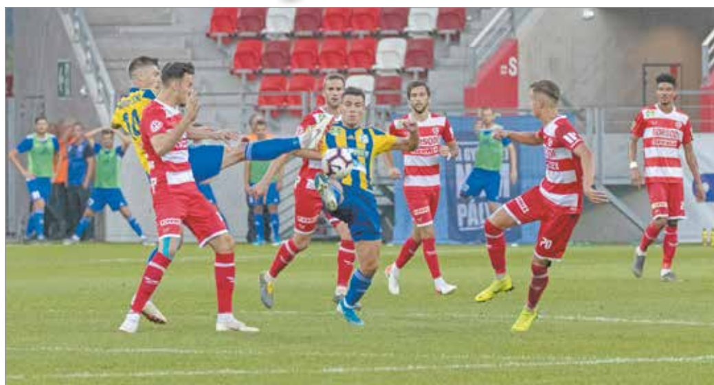
Szombaton is hasonló nagy küzdelem várható a két csapat meccsén.

Kemény összecsapás és nagy küzdelem várható tehát, ahová a vendégek alaposan felpörögve érkezhetnek, mert kedden a Magyar Kupában kiverték a székesfehérvári címvedőt, bejutva így a sorozat döntőjébe. A mezőkövesdiek ráhangolódása a bajnokság újraindulására tehát jól sikerült, míg a DVTK mindhárom felkészülési mérkőzését elvesztette a Honvéd, illetve kétszer a Kisvárdá ellen. De ahogy mondani szo-