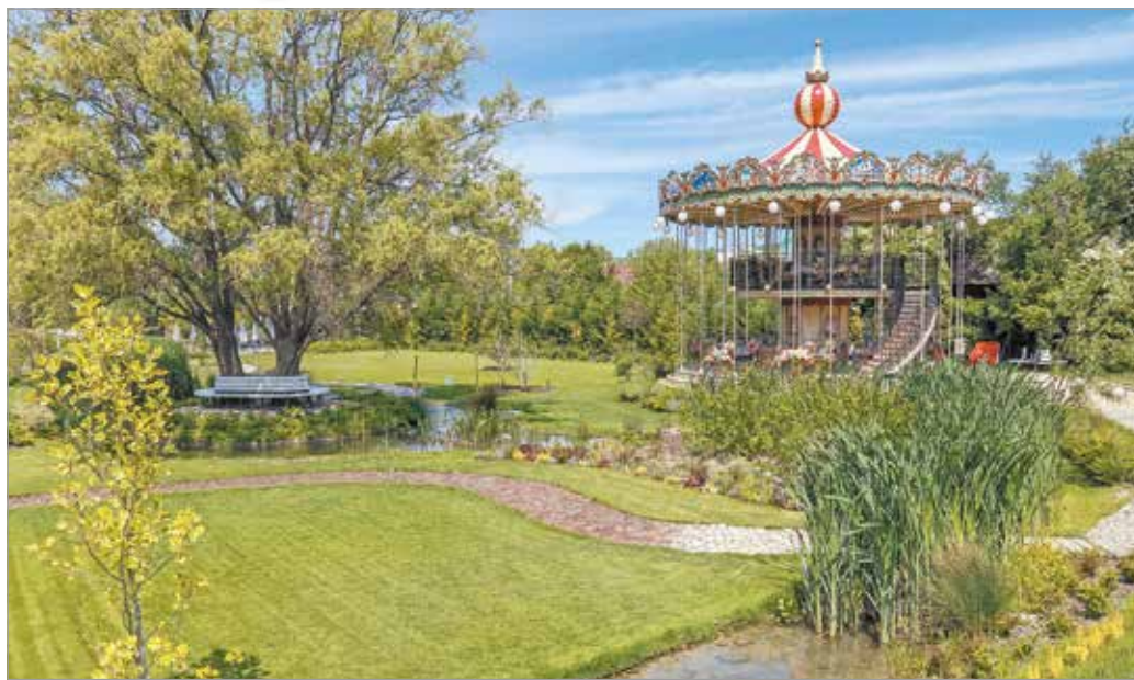
Tudnunk kell, attól lesz szép a világ, hogy mindenki – a maga eszközével – teremthet csodát.

Így jutottam el a titokzatos alkotóhoz. Telefonban a hangja kedves volt, készségesen állt rendelkezésemre, hogy összehozzunk egy beszélgetést,