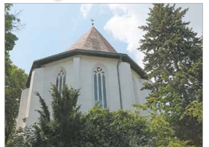
A külső munkálatokkal már végeztek.