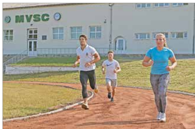
Az MVSC Sporttelep is megnyitotta a kapuit.