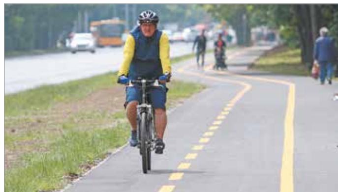
A Szentpéteri kapui bicikliút még nincs kész teljesen, de már elkezdték használni.

Ez részben kerékpáros nyom felfestésével, részben forgalomtól elválasztott új gyalog- és kerékpárút építésével valósul meg. Ilyen új kerékpárút épül a Huba utcától a város határáig. Mintegy hat kilométernyi új út készül a két keréken közlekedőknek.