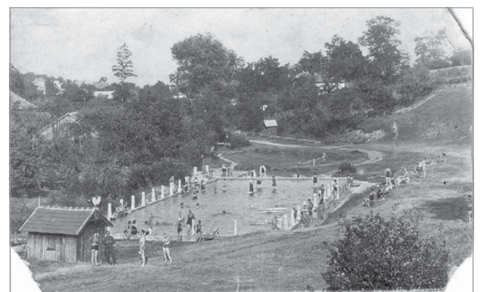
A Bedegh-völgyi strandfürdő

Feltehetően ezzel a véleményével nem volt egyedül, mivel a városvezetés maga is úgy látta, hogy egy olyan rohamosan fejlődő városnak, mint Miskolc, szüksége van egy reprezentatív, a korszak legkorszerűbb technikai színvonalán épült közösségi fürdőre. Az 1878-as árvíz után megindult mederszabályozási munkálatok vége felé, miután a Szinváralól eltávolították a legveszélyesebbnek tartott vízimalmokat, a református egyháztól megvásárolt Pámalom telkének közösségi funkciót kívánt adni a városvezetés. Kijelölték a későbbi Erzsébet tér körvonalát és elhatározták, hogy a tér meghatározó épületként felhúzzák azt a gőzfürdőt, amelyre már oly sokan várnak. Így épült meg 1893-ra Adler Károly vá-