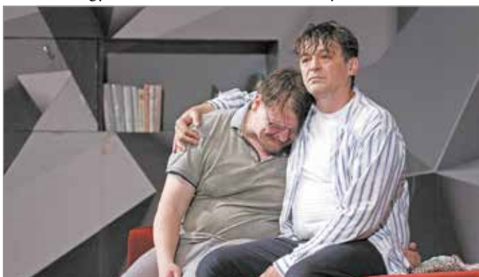
A barátságban és azon is túl