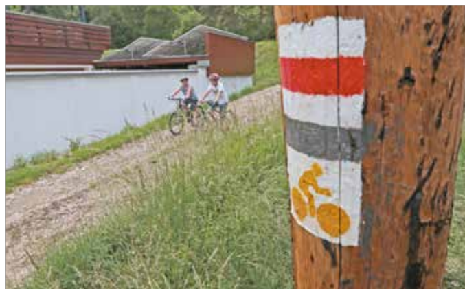
A közel hat kilométeres erdei kerékpárút kivitelezése 2021 tavaszán kezdődhet.

Az új építésű szakasz a Móra Ferenc utca végétől indul majd és a kisvasút nyomvonala felett, lehetőség szerint a már meglévő erdészeti utakon vezet, gyakorlatilag végig erdei kerékpárútként, több pihenőhellyel. „Végpontja a Szent István barlang előtti- és az Ózon panzió melletti aszfaltos nagy parkoló”. A közel hat kilométeres erdei kerékpárút kivitelezése az önkormányzat tervei szerint 2021 tavaszán kezdődhet, és a jövő év őszén már használható is lesz.