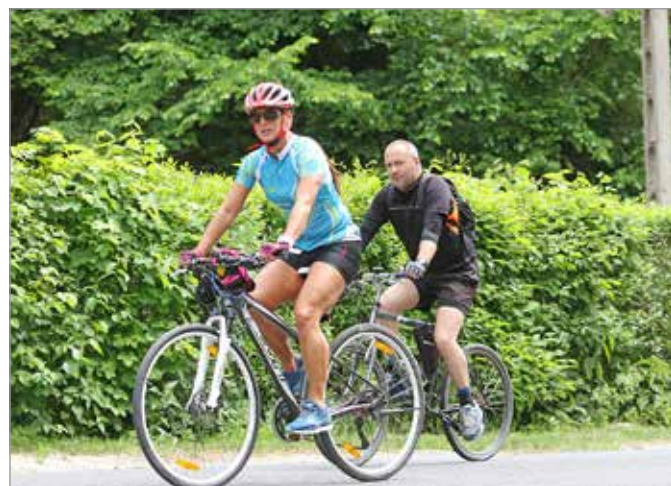
Miskolcon is megugrott a kerékpárosok száma