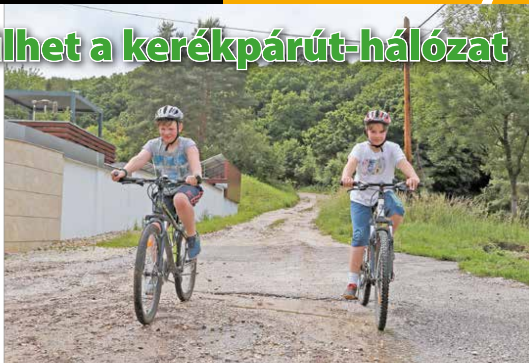
A Lillafüredre vezető új kerékpárút a Móra Ferenc utca végétől indul majd.

Több helyszínen is épülnek majd a közeljövőben kerék-