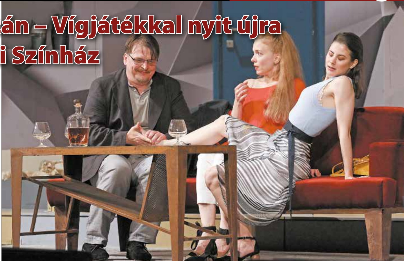
Az ezerarcú szerelem: behódolás, féltékenység, uralkodás

A maguk tragikusságában is vicces szexuális konfliktusok állnak a fókuszban, de a szókimondó dialógusok és 18-as besorolás ellenére se várjon pornográf előadást a közönség. – Még a nagy, pusztító szerelem is elfogy egy idő után, talán nem is lenne létszerű, ha megmaradna. Ugyanígy a szexuális vágy is csökken, ahogy az évek múlnak. De ennek a lángolásnak az emléke, a közösen átélt dolgok képesek összefűzni a párokat továbbra is – vonja le a tanulságot a rendező, hozzátéve: a problémáink felismerésében, a gátlások legyőzésében segíthet a darab, s ha ez megtörténik, „akkor nem csupán színházat csinálunk, hanem varázsolunk”.