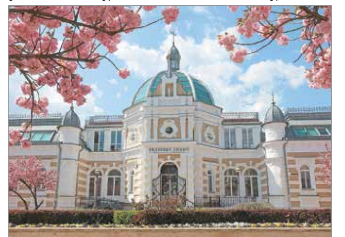
Az Erzsébet fürdő napjainkban.

Bodovics Éva levéltáros B.-A.-Z. Megyei Levéltár