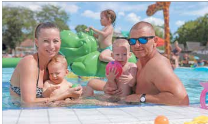
A tapolcai családi medencében 270 fő tartózkodhat egyszerre.

családi medencében például 270 fő tartózkodhat egyszerre. Az úszómedencében mindkét strandon 200-200 fürdőző lehet. Figyelmeztető táblákat is kihelyeztek, ezeken arra intenek mindenkit, hogy tartsák be a másfél méteres távolságot, és rendszeresen fertőtlenítsék a kezeiket.