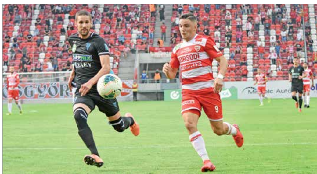
Szerdán döntetlent ért el a DVTK a ZTE ellen.

Nem sok idő maradt a történetek feldolgozására, hiszen szerdán már a ZTE érkezett a diósgyőri katonába. A mérkőzés kapcsán új fogalommal ismerkedhettek meg a futballszurkolók: technikai telt ház. A hatá-