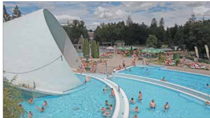
A Barlangfürdő is hamarosan megnyitja kapuit.