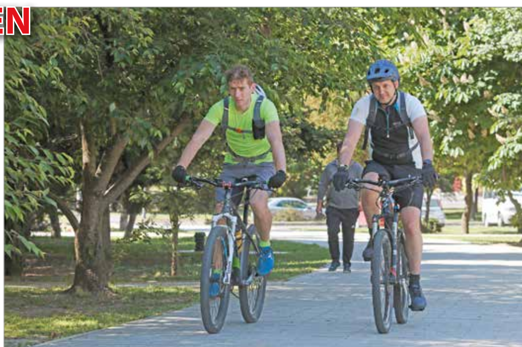
Aki szeretne egy kis emelkedést, az a belvárosból a Bükk felé indulhat.

Hogyan kerékpározhatunk biztonságosan a forgalom-