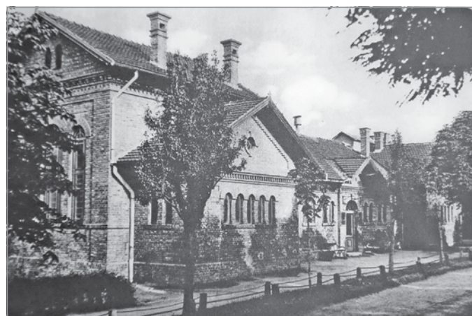
Fürdőház a Vasgyárban