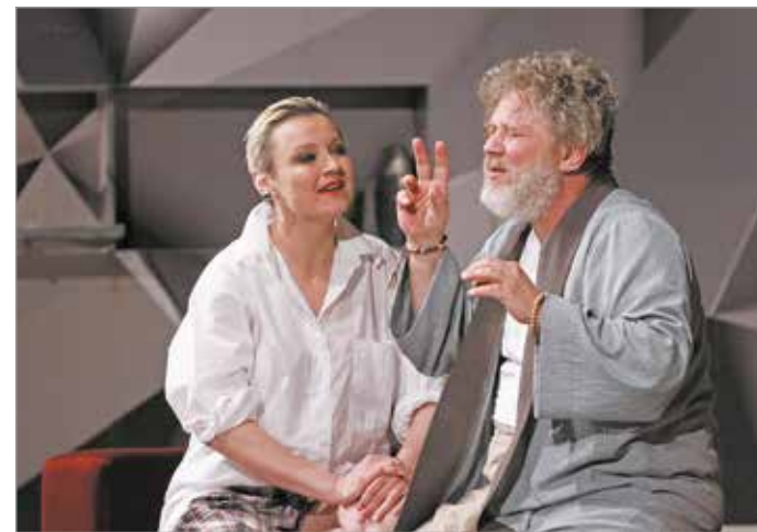
Figyelj a belső hangra, és békére lelsz

és üresség sejlik fel benne. – Sokáig cizelláltuk a szöveget, hogy mindenki saját ízlésének megfelelően tudja hozni a