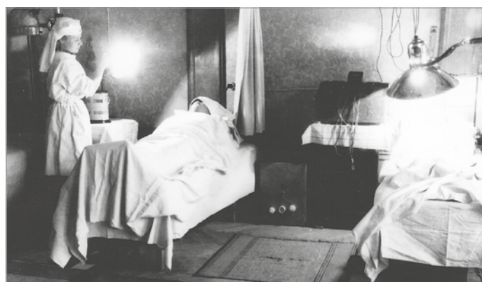
A katonák két vagy négyágyas szobákban lábadoztak

Mivel a fényképésznek nemcsak a belvárosban, hanem a Palotaszálló közvetlen közelé-