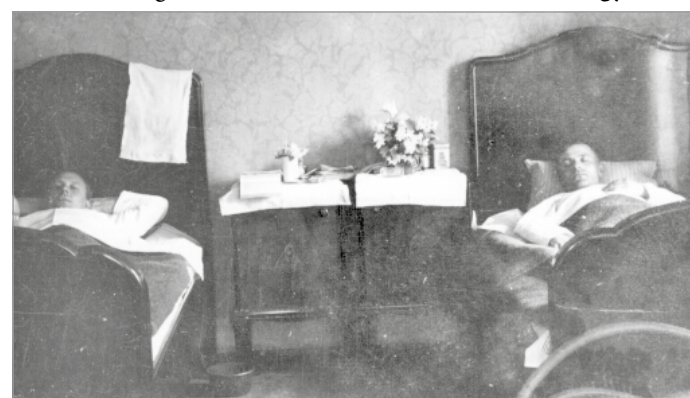
Lábadózás a szállóban