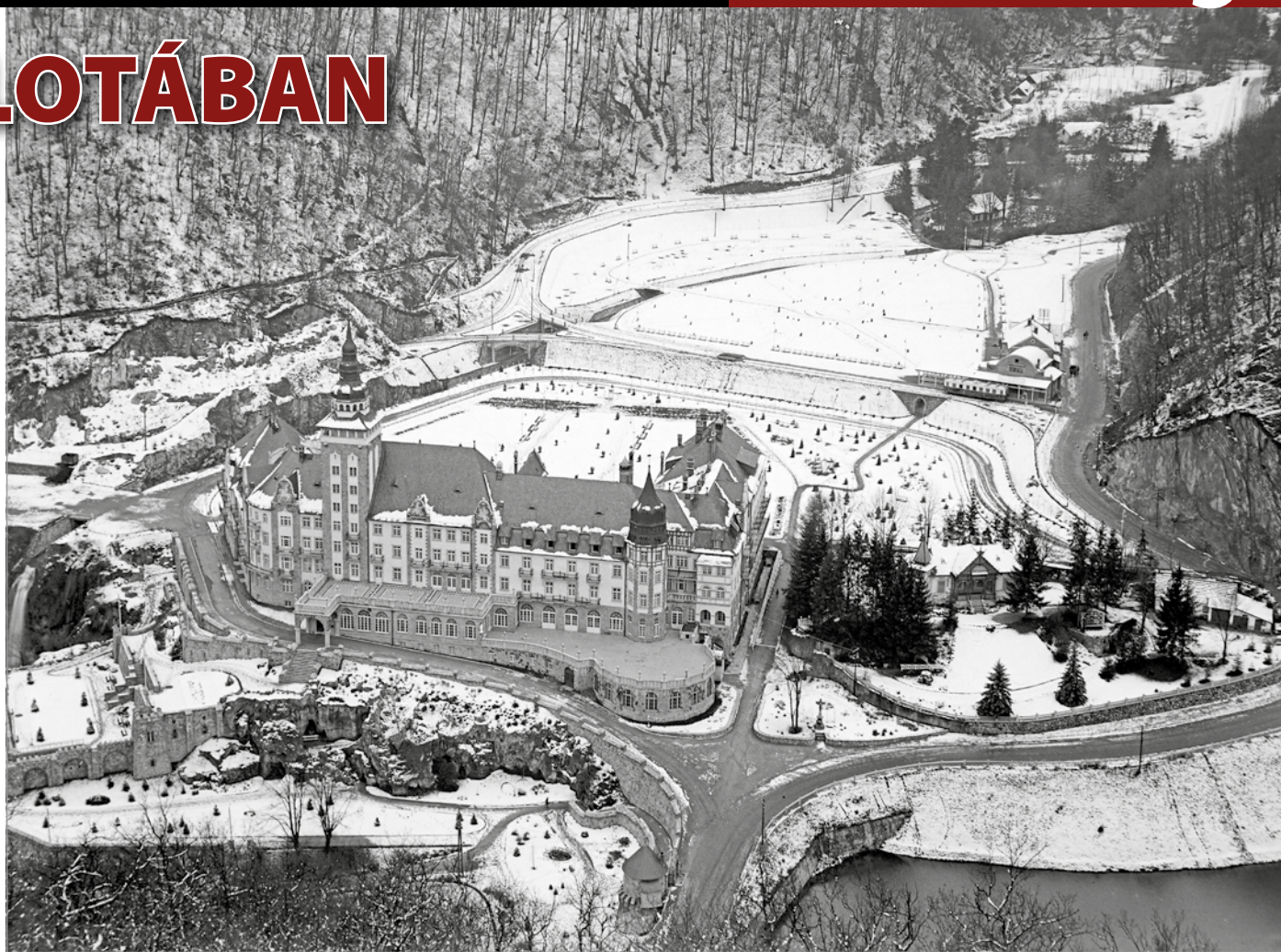
A Palotaszálló 1938-ban a Dolka-tetőről fényképezve.

Az oroszok azonnal kiszúrták maguknak a gyönyör-