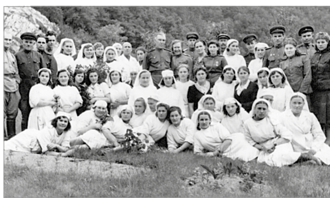
Csoportképen a kórház személyzete

üdülvő alakították. Általában azok a szovjetek voltak itt jelen, akiket a továbbvonuló frontról hoztak ide egy pár napos eltávra.