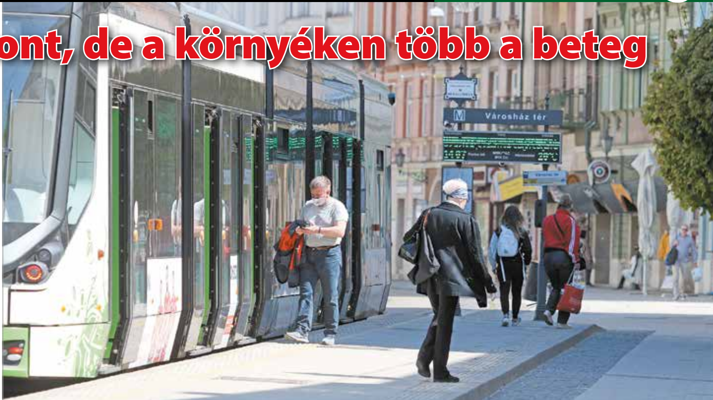
Az MVK járművein kötelező a szájat és orrot eltakaró maszk/kendő/sál viselése.

A telekommunikációs vállalat sajtóosztálya érdeklődésünkre megerősítette a hírt. Azt írták, a vállalat a hír után néhány órával elvégezte a munkatárs kapcsolati hálójának teljes feltérképezését, majd minden elsődleges kontaktszemélyt otthoni karanténba küldtek. „A Vodafone vezetősége teljes mértékben együttműködik az ÁNTSZ-szel és a helyi egészségügyi szervezetekkel, és minden esetben a hivatalos iránymutatás szerint jár el” – hangsúlyozták. Hozzá tették: az ügyfélszolgálat munkája home office-ból biztosított.