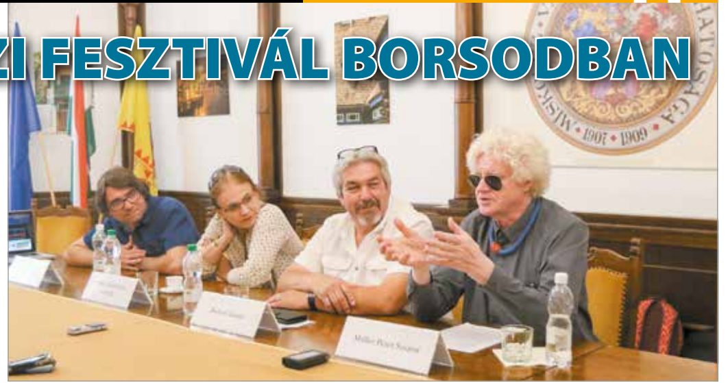
A fesztiválról szerdán tartottak sajtótájékoztatót.

TeatRom címmel rendeznek színházi fesztivált megyénk több, romák lakta településén augusztus 15-e és 23-a között.