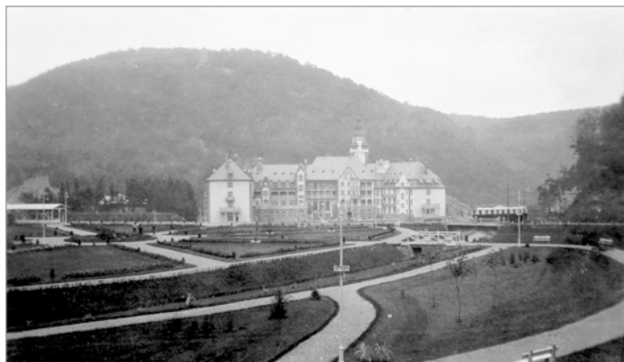
A Palotaszálló a park felől 1933-ban.

Hogy miért érdekes számunkra a fényképész Maksay? Nos, ő volt az, akinek lehetősége nyílt több mint 200 fotónegatívon megörökíteni a szovjet katonákat, ők ugyanis rendszeresen felkeresték – tudjuk meg naplójából.