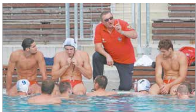
Küzdeni akarásból jól vizsgázott a fiatal csapat.