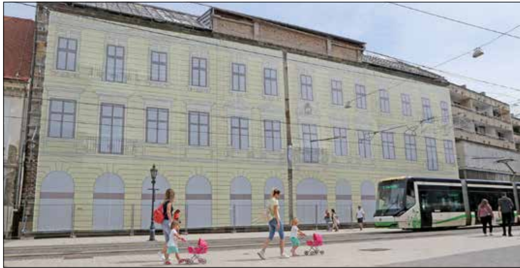
A városnak szüksége van az Avasszállóra, de nem mindenáron az eredeti funkciójában.

– Ezek tények. Tény viszont az is, hogy nem a műemléki vé-