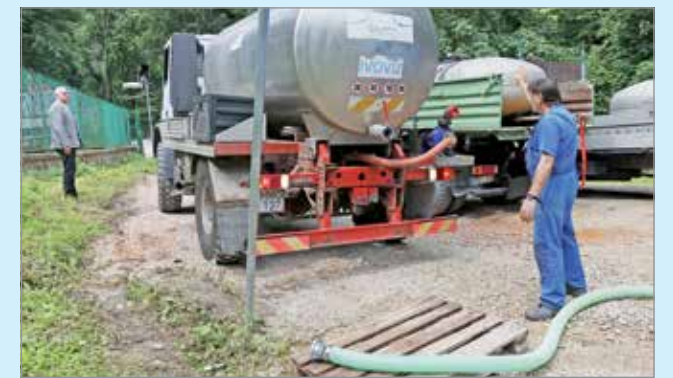
Átmenetileg lajtos kocsikkal biztosítják az ivóvízellátást.

Rövid távú megoldásként mobilizálható víztisztító telepítenek a Szinva-forráshoz, amellyel a mostanihoz hasonló extrém helyzeteket is el lehetne kerülni.