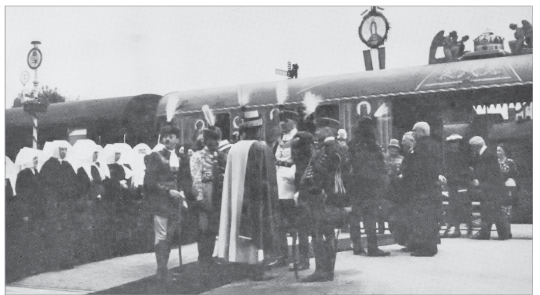
Az „Aranyvonat” fogadása a Gömői pályaudvaron, 1938. (Forrás: Dobrossy István: Miskolc írásban és képekben 8., 170. oldal.)

19 magyar város egyikeként július 4-én Szerencs felől Miskolcra érkezzen. A Szent Jobbot szállító, a köznyelv által csak Aranyvonatnak nevezett szerelvény a Gömői pályaudvaron állt meg, innen indult a 4 órás körmenet. Az eseményről a helyi sajtó így számolt be: „A Gömői pályaudvarra július 4-én délelőtt 10 óra 38 perckor gördült be az Aranyvonat. Az állomáson a katonazenekar ezekben a percekben a Himnuszt játssza. (...) A Szent Jobbot a papok emelik le az Aranyvonatról, majd beállnak a menetbe.” Ezt követően a tömeg a Zsolcai kapu – Király utca – Széchenyi utca – Szemere utca – Görgey utca – Budai József utca útvonalon jutott el a népkerti sporttelepig. A menet élén nemcsak a város és Borsod, Gömör és Kishont (ekkor, mint közigazgatásilag egyelőre egyesített vármegye), hanem Abaúj-Torna és Zemplén vármegye előjárói is elhaladtak, akiket ekkor már a sporttelepen az erre az alkalomra emelt dízsátor és színpad várt. A felvonulók közül külön kiemelték a helyi lakosok a különböző ipartársulatok színes kavalkádját. „A kárpitosok, kalaposok céhjelvényeikkel, többszáz éves céhleveleikkel vonultak. A szabóiparosok hatalmas ollót, tűkkel teletűzdelt párnát vittek. A kőművesek csoportja ezüstös malter kanalat vitt jelvényként. A vendég-lősök, majd csizmadiai menete következett céhlevelekkel, réztáblába vésett céhjelvényekkel. A könyvkötőiparosok díszes könyvet, a lakatosok hatalmas