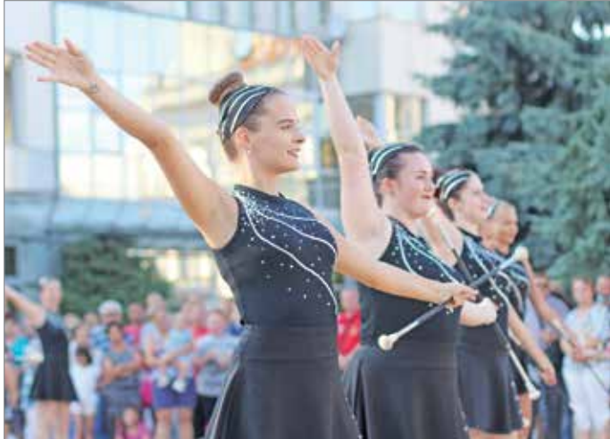
Sokan nézték a mazzorettek bemutatóját

Egész nap – zenével, táncal – programok sora várta az érdeklődőket a Városház téren, a polgármesteri hivatal és a megyeháza közötti területen.