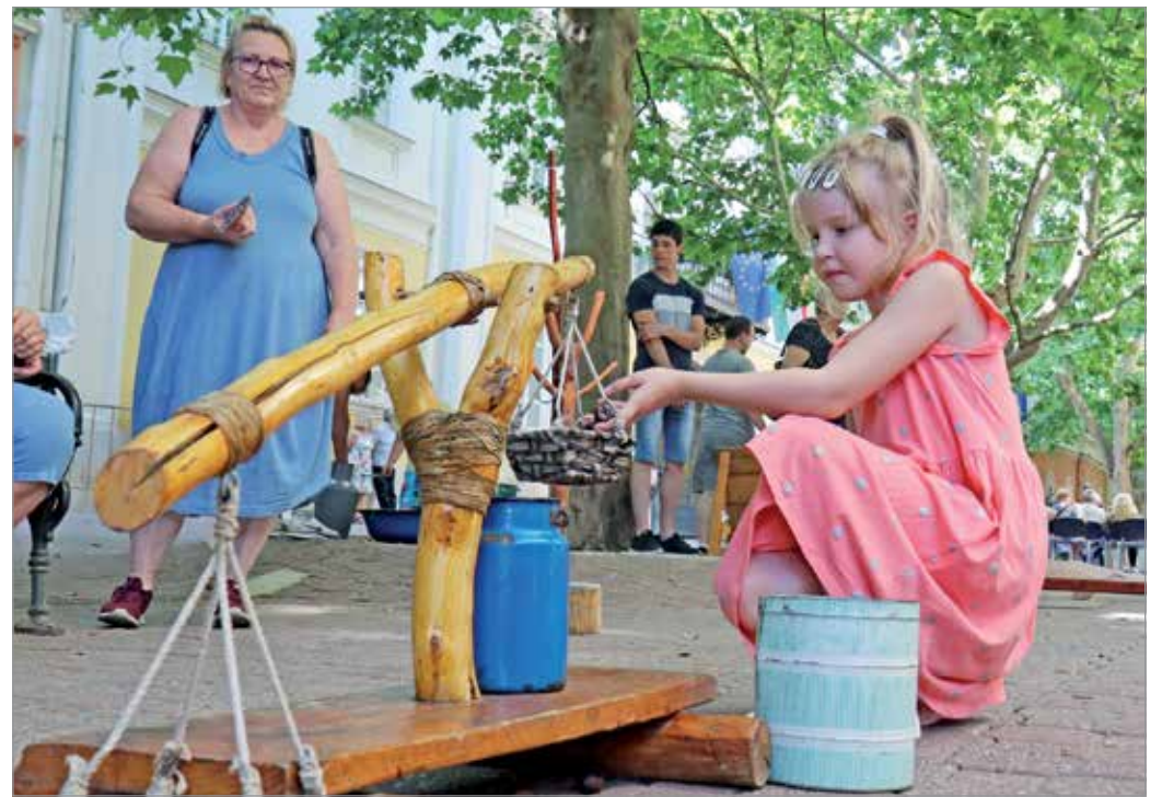
A gyerekek nagyon élvezték a régi népi játékokat.

Most éppen az újbábok készítésébe nyerhettek bepillantást. Némi fejtörés után, kezűgyességüket használva egész jól elboldogultak vele a gyerekek. Addig mi szülőkkel beszélgetünk. Tünde elmondja, hogy augusztus 20-át a miskolci belvárosban való baran-