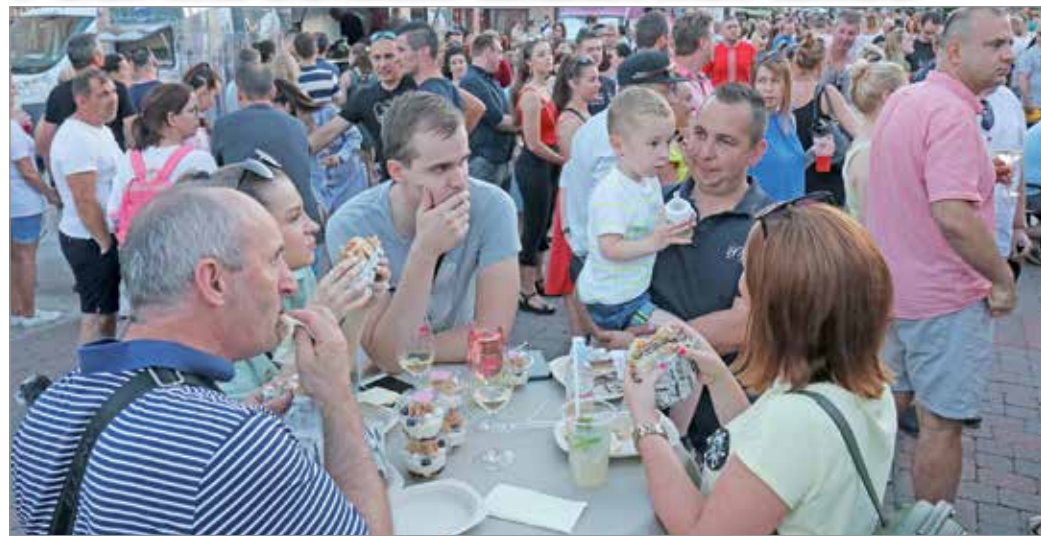
A nyáron szinte mindig telt ház volt a GasztroPlacc új helyszínén, a Diósgyőri vár mellett.

A nyár legnépszerűbb miskolci gasztrosorozata egyértelműen a GasztroPlacc Extra volt, amely megtalálta helyét a Diósgyőri vár mellett. A rendezvény az ősszel a belvárosban folytatódik.