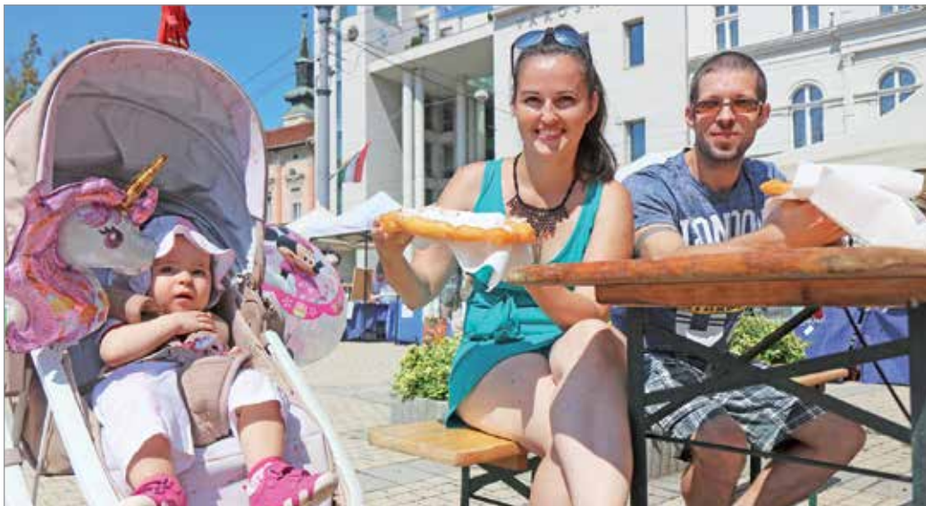
Az Orosz család Hernádnémetiből érkezett megnézni a miskolci programokat