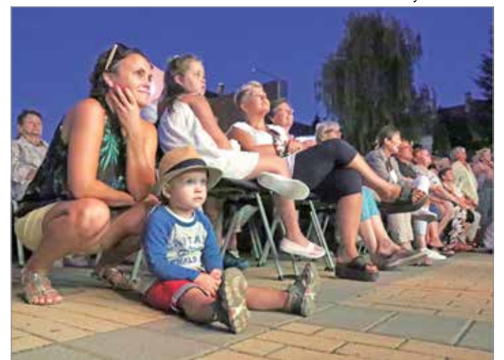
Kicsik, nagyok egyaránt élvezték az esti koncertet