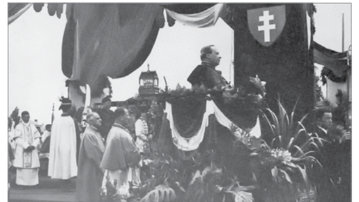
Görgey László beszéde a népkerti stadionban, 1938.