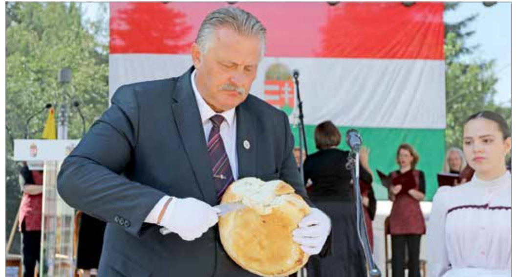
Veres Pál, Miskolc polgármestere felvágja az új kenyeret.

– Ugyanakkor úgy gondolom, hogy a mai nap más üzenetet is hordoz. Ez az első olyan esemény hosszú ideje, amelyen, még ha bizonyos szabályok betartása mellett is, de ismét közösen, együtt ünnepelve vehetünk részt. A kialakult helyzet megmutatta, hogy Miskolc lakossága képes összefogni fejelemzetten, és egy közös célt szem előtt tartva cselekedni. Talán az összefogás és a közös célban való hit az, amely szintén motiválta őseinket az államalapítás időszakában is. Hiszen közös cél nélkül nincs eredmény, összefogás nélkül pedig szándék a cél eléréséhez – jelentette ki, majd hozzátette azt is: