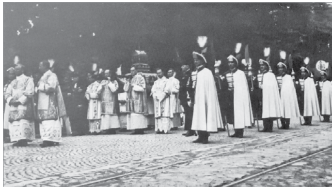
Az ereklyét szállító menet a Csabai kapuban, 1938.

Augusztus 20-án ünnepli a magyarság az államalapítást. Ez a nap egyben a magyar katolikus egyház egyik főünnepje is, hiszen az államalapító I. István király szentté avatásának évfordulója e jeles nap. Sőt, erre a napra esik formálisan az aratás vége is, így az augusztus 20-ai ünnep kihagyhatatlan része az „új kenyér” megáldása, amikor a nemzeti színű szalaggal átkötött, frissen sült kenyeret először ünnepélyesen megszentelik, majd felszelik, és végül szétosztják a darabjait. Joggal kijelenthető tehát, hogy az augusztusi nemzeti ünnepünkön egyházi és világi ceremóniák sorát tartják országszerte.