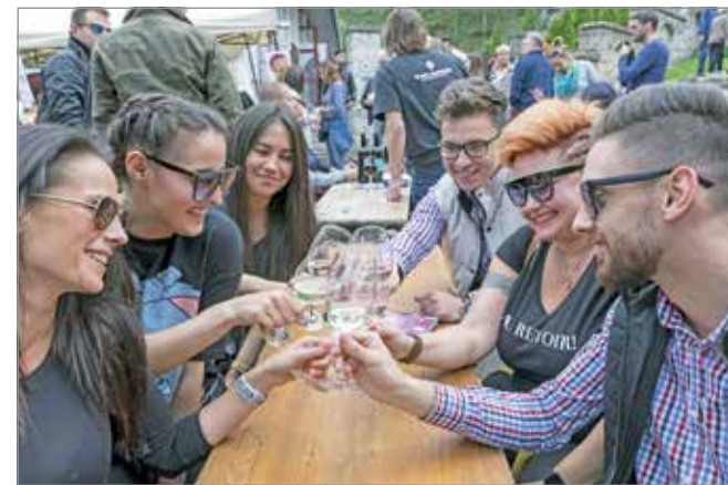
Miskolc egyre több borhoz kapcsolódó rendezvény otthona.

A rendezvény karitatív célokat is szolgál. A résztvevő borászok által felajánlott, egy-egy palack prémiumkategóriás borra lehet majd licitálni, melynek bevételét a szervezők a Miskolci Egyesített Szociális, Egészségügyi és Gyermekjóléti Intézmény (MESZEGYI) részére szeretnék felajánlani.