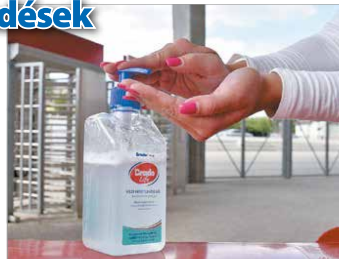
Tartsuk be a higiéniai előírásokat!