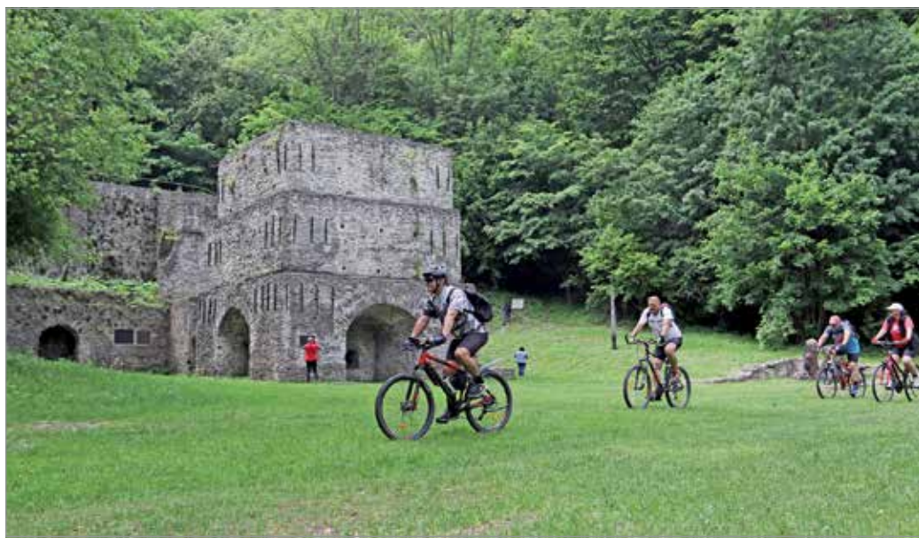
Reneszánszát éli a kerékpározás.

Fontos az is, hol kerékpározunk. A rendőrség azt mondja, hogy ahol van kiépített, az úttesttől elkülönített kerékpárút, ott azt kell használni. „Nem lehet, hanem kötelezően ott kell közlekedni a kerékpárral. Ahol nincs, ott sem a járdán, hanem