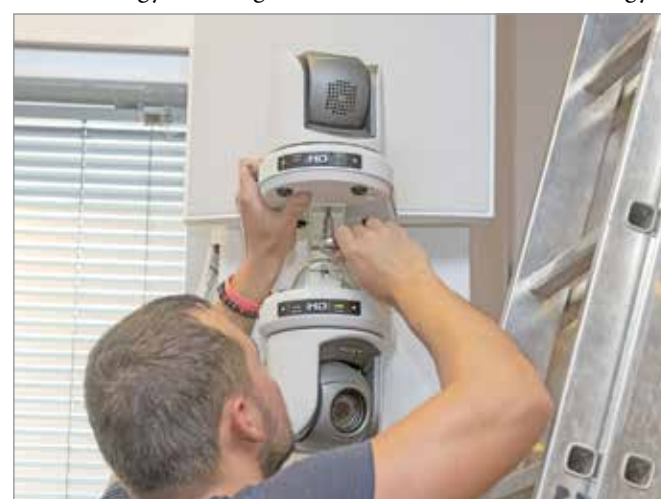
A két rendszer egymástól függetlenül működött.