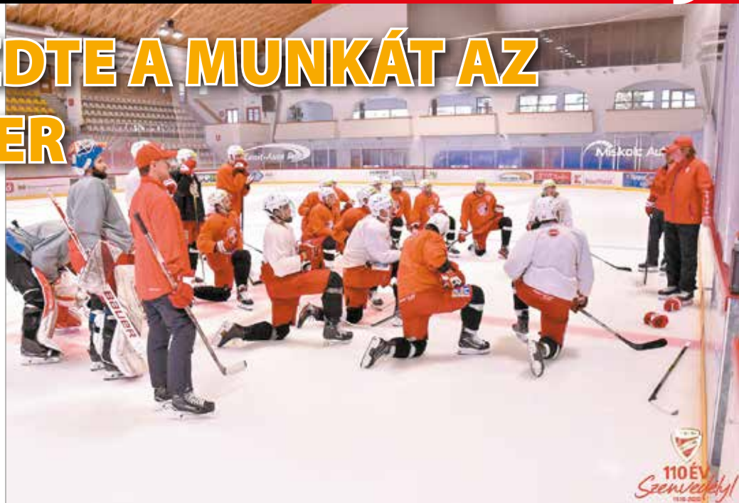
A keret javarészt összeállt, még egy csatárt szeretnének szerződtetni.

„A szlovákok nagyon technikásak és kreatívak, de magunkra kell fókuszálnunk. Gondoskodnunk kell róla, hogy a korong nálunk legyen, az a csapat tud gólokat lőni, amelyik birtokolja a korongot” – fogalmazott Allison. Kifejtette: elsősorban nem tudta megjegyezni a játékosok nevét, a számokra viszont emlékszik, és nála mindenki tiszta lappal indul. „Lesznek olyan srácok, akikre támaszkodni fogunk, de nekik is el kell végezni a munkájukat. Ahogy Bruce Springsteen mondta, „az ajtók nyitva állnak, de az odavezető út nincs ingyen”. Az öltözőben