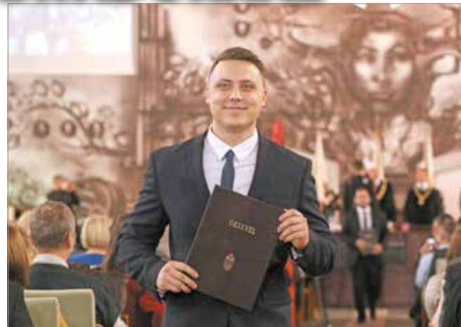
Diplomaátadó ünnepségekkel kezd meg a következő tanévet a Miskolci Egyetem.

Az operatív testület legfontosabb feladata a jövőképi irányok kidolgozása, illetve az ezek eléréséhez szükséges