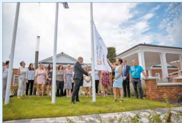
Cambridge-i akkreditációt kapott az Avalon iskolája