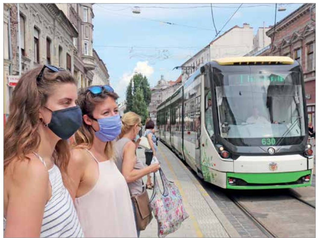
A járműveken továbbra is kötelező a maszk viselése.

– Ezt az új bírságolási eljárást az Információs és Technológiai Minisztérium és a Fogyasztóvédelem is véleményezte, jóváhagyta. Amennyiben az utas nem fizeti meg az 5000 forintos összegű helyszíni bírságot, akkor a bírság összege 7500 forintra emelkedik, amelyet a bírságolástól számított nyolc napon belül tud megfizetni. Ebben az esetben viszont már nem illeti meg az öt vonalje-