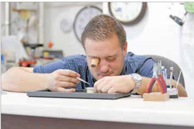
A legnagyobb kihívás, amikor egy nem működő órát életre kell kelteni