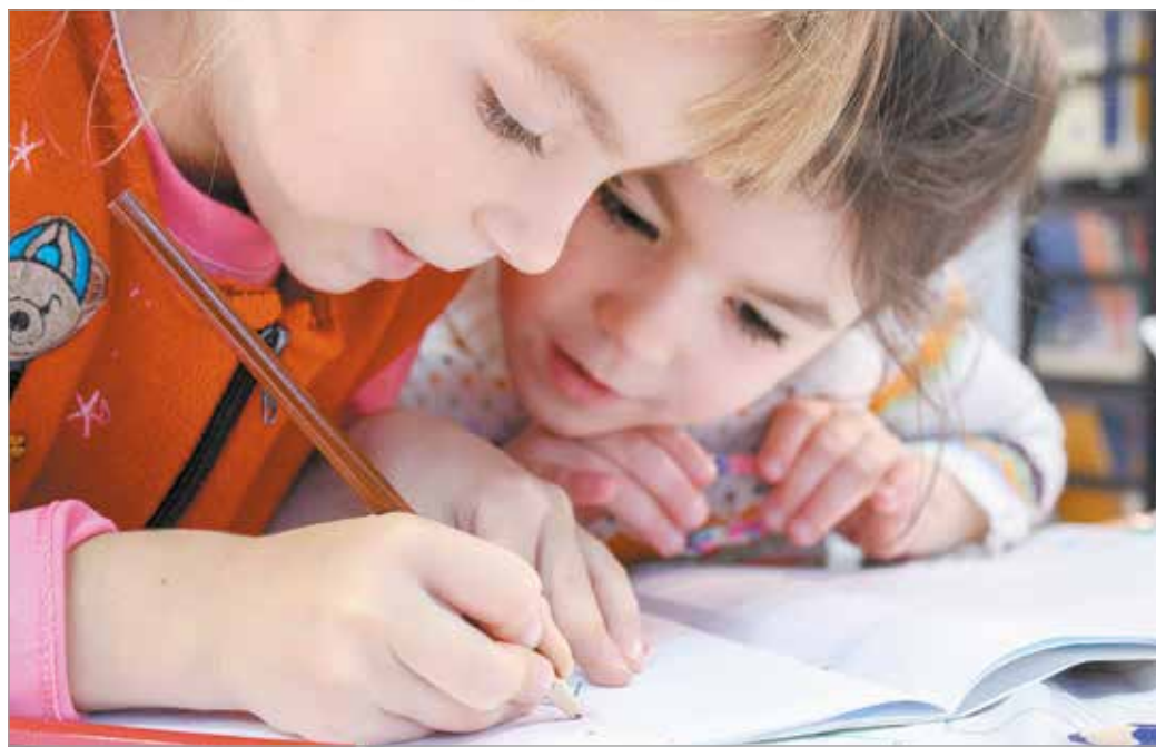
Nagy változást jelent a gyerekek életében az iskolakezdés.

Könnyebb lesz persze azoknak a helyzetek, akik az óvodából ismert társaikkal együtt ugyanabba az iskolába járnak majd. Vagy ha van egy idősebb testvér, akinek közelsége erőt adhat az idegen közegben. De a tanév előtt szervezett iskolai programok is segíthetnek.