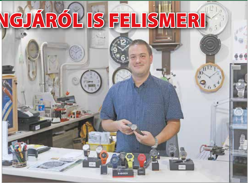
A boltban ma már több ezer órában gyönyörködhet.

Az órás szakember szemével nézve a legjobb darabok mechanikusak. – Azoknak van lelke: tiktakolnak, ketyegnek, fel kell húzni őket, mint nagyapáink idejében – ettől lesz varázsa az óráknak. Az automata is ilyen még, hiszen a kéz mozgására töltődik fel. Persze ez picit pontatlanabb lesz, mint a többi, hétvégén pedig akár le is áll, ha nem érintkezett az emberrel. A klasszikus, csak kézzel felhúzható órákat pedig manapság prémiumkategóriában gyártják, nem véletlenül.