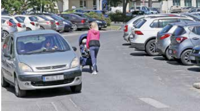
A parkolás ingyenessé tétele is jelentős bevételkiesést jelentett a városnak.