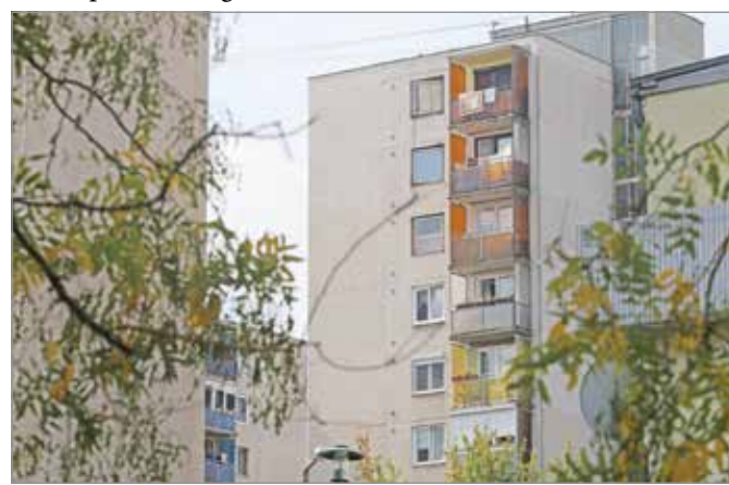
A héten mindazon bérlők megkapták az értesítést, akiknek lakbérére a lakásuk területi elhelyezkedése miatt változik.

A lakbérémelemből befolyó többletbevétel alapot ad arra, hogy elinduljon Miskolcon a megfontolt, hosszútávra tervezett, felelős ingatlangazdálkodás, hiszen a bérleti díjból származó bevételek megfelelő hányadának visszaforgatásával biztosítható a lakásállomány műszaki állapotának fenntartása, értékének megőrzése.