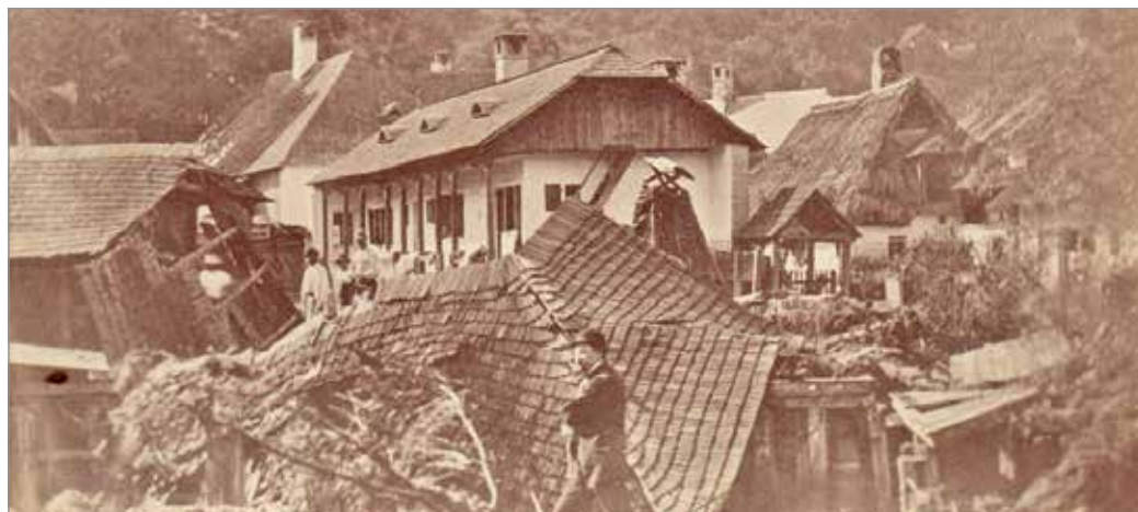
A pusztítás következményei évekre meghatározták a város jövőképét.

Csodával határos megmenekülésről számolt be Gyöngyössi Sámuel 1879-ben, a Miskolcz gyászosa címet viselő emlék-