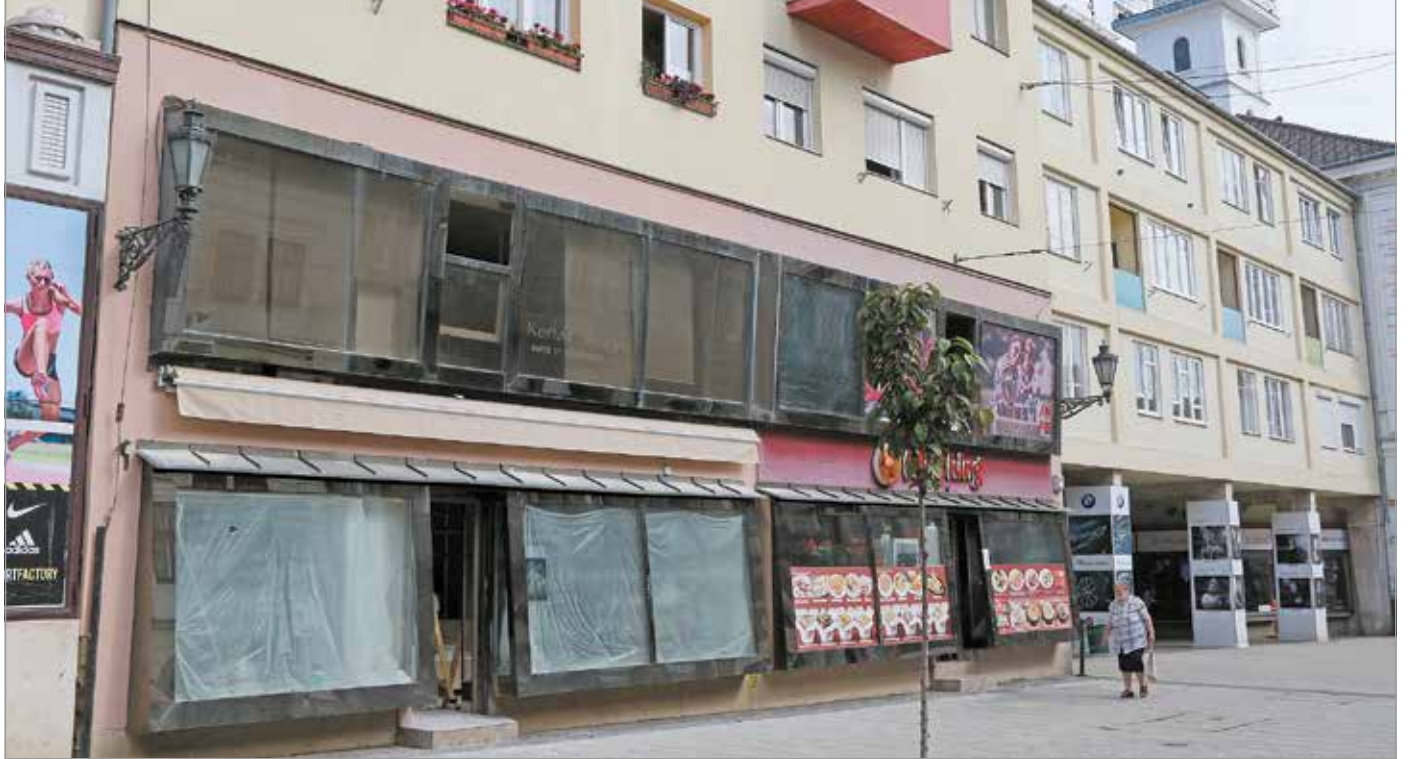
Hetek óta gőzerővel dolgoznak a korábban a Képcsarnoknak otthont adó épületben.

A Képcsarnok 1962-től működtette a Szőnyi István Galériát Miskolcon, egészen 2013-ig, az országos hálózat