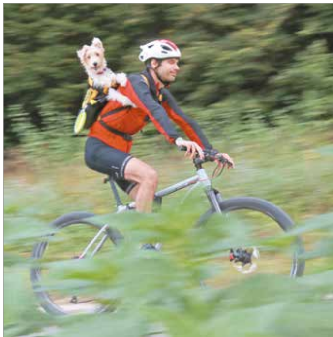
A négy távon több mint kétszázkilencvenen álltak rajthoz