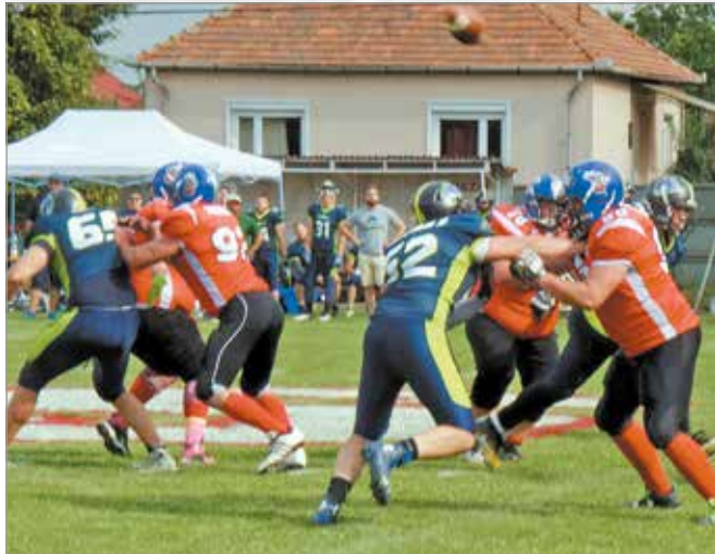
Elővigyázatosságból döntöttek a halasztás mellett

Felelős döntést hozott a Miskolc Steelers szakmai vezetősége, amikor kérték idei első mérkőzésük elhalasztását. Az ok: a koronavírus gyors terjedése.