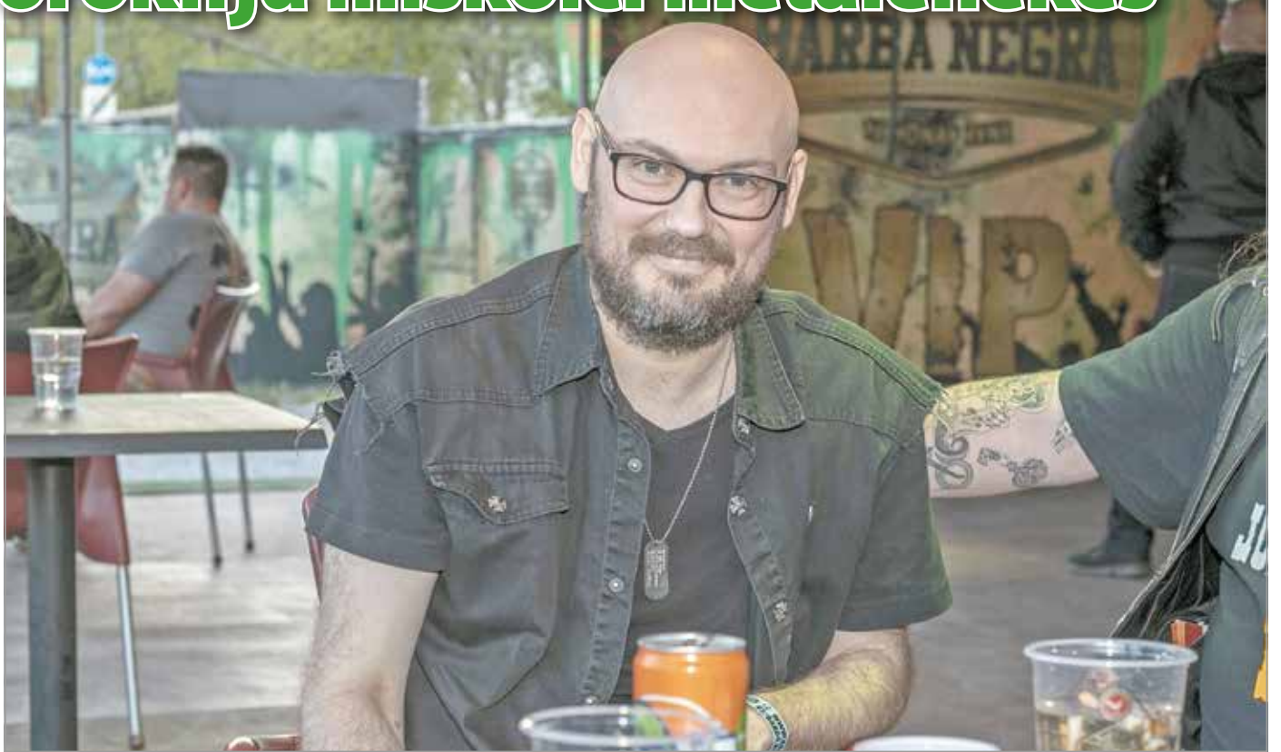
Jelenlegi zenekarát, a Jockey Jokerst egy nagy családnak tartja

– Tipikus „szeretjük a rockzenét, jó csávóknak gondoljuk magunkat, alakítsunk zenekart” együttes volt. Mégis szuperül sült el a dolog. Készült egy demó is, amit a mai napig büszkén hallgatok.