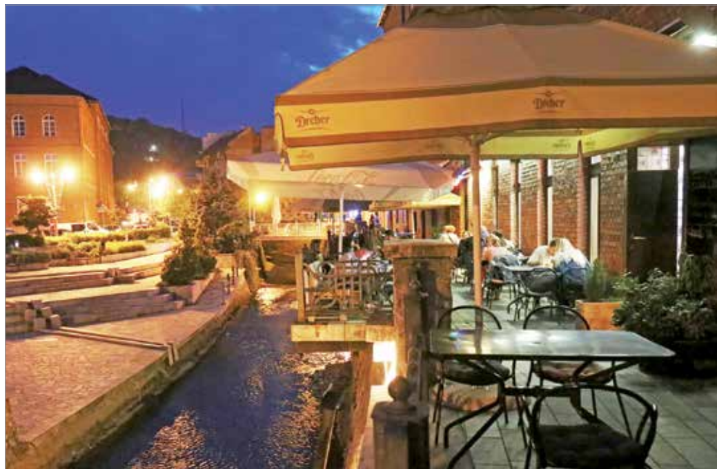
A belvárosi vendéglátásokat is szeretnék bevinni a párbeszédbe.

jelenlét javít ezen a helyzeten. Azonban az egyenruhás hatóságoknak sincs a jelenleginél több embere és ideje éjszakánként mindenhol járőrözni. Elhangzott: a közterületi italfogyasztás tiltott, még akkor is, ha valaki egy kocsmában veszi, de nem fér el bent, ezért kimegy a poharával az ajtó elé – de ha a hatóság emiatt folyton büntetne, bírság lenne bőven, a vendégek viszont félő, hogy elfogynának... ami nem cél. A vállalkozók maguk is fontosnak tartják, hogy a kuncsaftjaik viselkedésére, mozgására odafigyeljenek. „Szomszédok vagyunk mindnyájan, magunknak kell ezeket megoldani, és aztán ott kérni külső segítséget, ahol szükséges” – fogalmazott az egyik megvalósító. Szerencsére megvan a „pszichológiai hatása, a visszatartó ereje” annak, hogy a hatóságok végre „jelen vannak” a területen. Igaz, nem mindenhol, volt, aki a Bazár-tömbből panaszolta hívás esetén késeledő rendőri és rendészeti