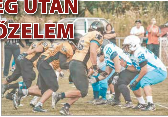
A Renegátok legközelebb október 17-én lépnek pályára.

A váratlan pontvesztés után azonban összekapták magukat a miskolciak. Talán időben jött a pofon, és a Szeged elleni csorbát kiköszörölendő, „csak azért is” hangulatban léptek pályára hazai pályán a jászberényi csapat ellen az elmúlt hétvégén. – Itt már azt játszottuk, amit valóban tudunk. Ismerjük a Wolverinest, nem igazán erősödtek tavalyhoz képest. Egy picit aggódtam persze, hogy a kötelező győzelem terhe nem nyomja-e agyon a gárdát, főleg egy elvesztett nyitány után, de a nagyarányú siker magáért beszél (54-6 lett a vége). Nagyon a csapat mélyére kellett volna nézni, ha ez nem jön össze.