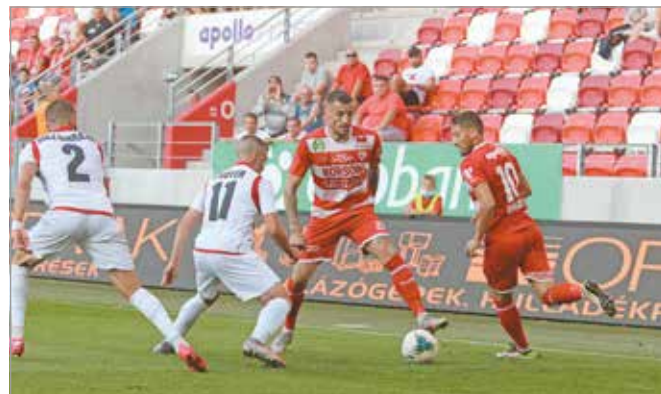
A miskolciaknak ez lesz az idei szezonban az első idegenbeli találkozójuk.

szezonban az első idegenbeli találkozójuk, mivel a Ferencváros elleni meccset elhalasztották, és ennek egyelőre nincs is új időpontja. A három hazai találkozón négy pontot gyűjtöttek a piros-fehérek, miután egy-egy győzelem, döntetlen és vereség került a jegyzőkönyvbe. A zalaai házigazdák négy mérkőzést játszottak eddig, amelyeken egyszer győztek, egyszer kikaptak, kétszer pedig