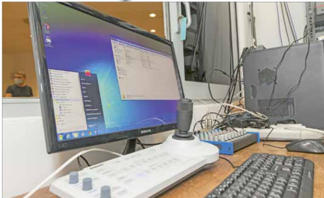
A kamerát és a mikrofonokat augusztus végén távolították el.

Amint arról korábban beszámoltunk, hetekkel ezelőtt bejárást tartottak a közgyűlési teremben. Ezek egyikén derült ki, hogy az ülések és egyéb rendezvények helyszínénél szolgáló teremben olyan kamera és mikrofonok vannak kihelyezve, amelyek nem részei a közvetítőrendszernek. Az ügy vizsgálata során kiderült: Krizsa Ákos polgármester kérésére Alakszai Zoltán akkori kabinetvezető engedélyével, 2016 augusztusában több mint 3,7 millió forintért szereltek be a közgyűlési terembe egy robotkamerát, két termikrofont és a hozzájuk tartozó vezérlőegységet. Ezek segítségével a teremben zajló minden beszélgetés és történés rögzíthető volt. Mivel a rendszer független a közgyűlési üléseit közvetítő rendszertől, emiatt kikapcsolt mikrofonoknál és kameráknál is rögzíthetett mindent. Akár a nem nyilvánosságnak szánt, magánjellegű beszélgetéseket is. Ugyanez igaz a zárt ülésekre is, hiszen a közvetítőrend-