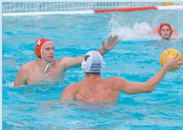
Az FTC elleni bajnoki elhalasztása mellett döntött a miskolci klubvezetés.