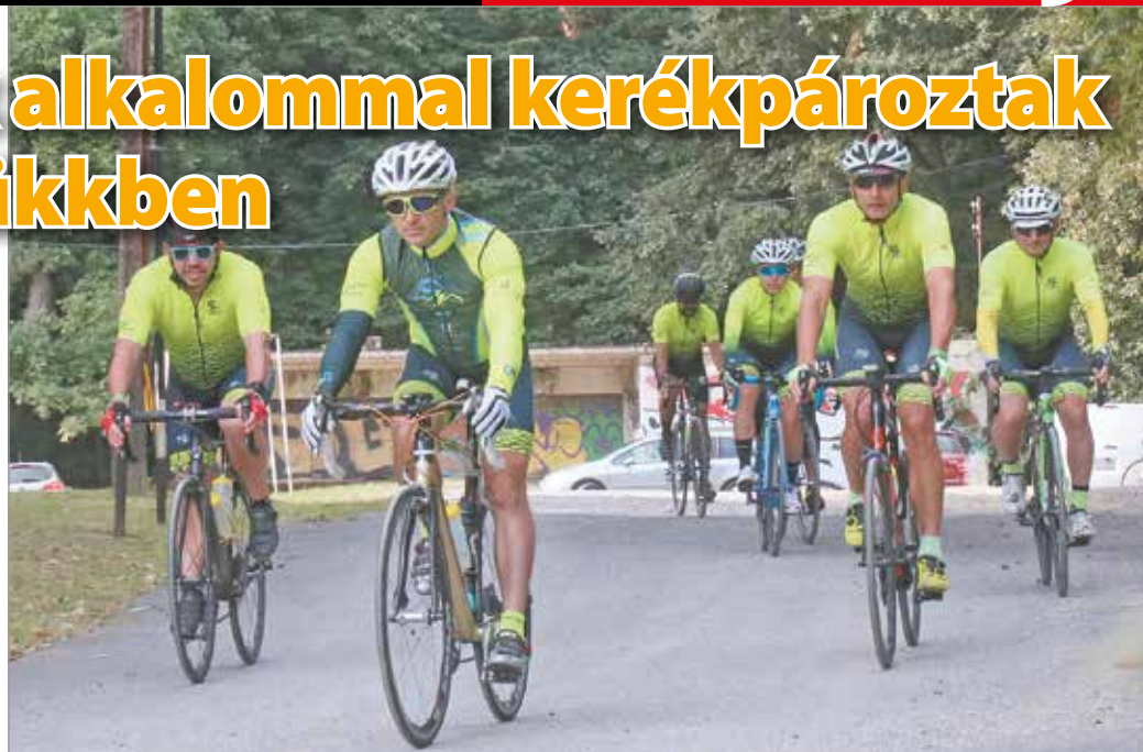
A versenyzők ezúttal is 30, 50, 80 és 110 kilométeres távokon indulhattak.

Idén az ország 58 településéről érkeztek bringások azzal a céllal, hogy a Bükk szerpentinjein az őszi rengetegben hosszasan tekereghessenek. F. Nagy Zsuzsanna elmondása szerint a