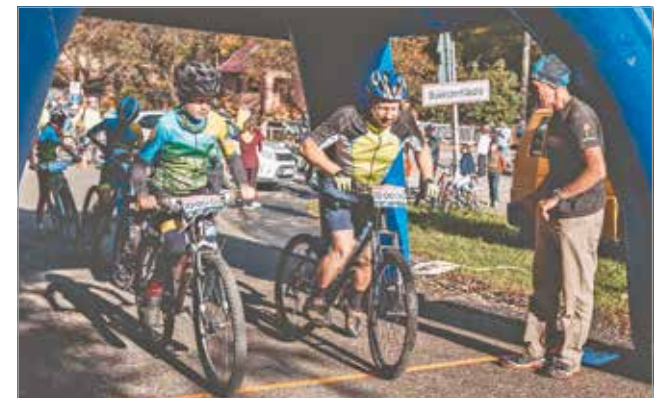
A versenyre maximum kétszáz sportoló nevezését fogadják el.

Az első versenyző Bükk-szentlászlói, 10 órakor rajtol, a nevezési sorrendben folyamatosan követnek a többiek. Becsátolt kerékpáros-fejvédő használata kötelező, hiánya kizárást von maga után. A célt Bükk-szentkereszt határában a kőkeresztnél jelölik ki. Az eredményhirdetést Bükk-szentkeresztben, új helyszínen, a Privát Fogadó és Étterem parkolójában tartják meg. A korcsoportgyőztesek a Császári Éva üvegfestő által készített kupákat, valamint tárgyjutalmat, a 2.-3. helyezettek egyedi kézműves éremet és tárgyjutalmat kapnak.