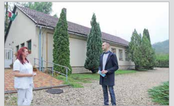
Az intézmény korábban rendszeresen beázott.