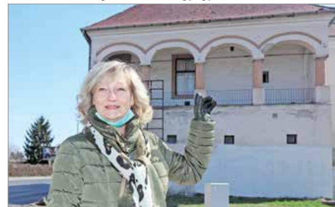
A volt műemlék gyógyszertár környékét is rendbetették.

Az Avason a Testvérvárosok 4-6. számnál rámpát alakítottunk ki, a meglévő lépcsősor kitörézzett lépcsősorait megjavítottuk, az utcában a nem EU-szabványos játékoszközöket eltávolítottuk, a homokozókat feltöltöttük, új padokat helyeztünk ki. A Középszer utca páratlan oldalán parkoló tervezetét finanszírozzuk, a Tapolcai elágazás buszmegállónál a hiányos korlátsort pótoltuk, az odavezető járdaszakaszt felújítottuk. A „Fogadj örökbe egy óvodaudvart!” program keretében a Középszer utcai óvoda 800 ezer forint támogatást kapott új köztéri játékok vásárlására, társadalmi munkában megújultak a régi mászóakák, és elszállítottuk az óvoda udvarán lévő építési törmelékét.