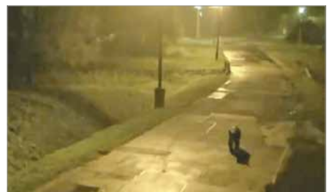
Az állat mozgását a MIÖR kamerái is rögzítették

A Bükki Nemzeti Park Igazgatóság szakemberei mindenesetre továbbra is felhívják a figyelmet arra, hogy a medve nem játék. A lakosságtól kéri, hogy az említett részeken az erdőterületen történő tartózkodás szabályait betartva közlekedjenek, valamint a környéken a kutyákat kizárólag pórázon sétáltassák. Amennyiben pedig barnamedve nyomaira akadnak, tegyenek bejelentést a következő ügyeleti telefonszámon: +36 30 861-3808.