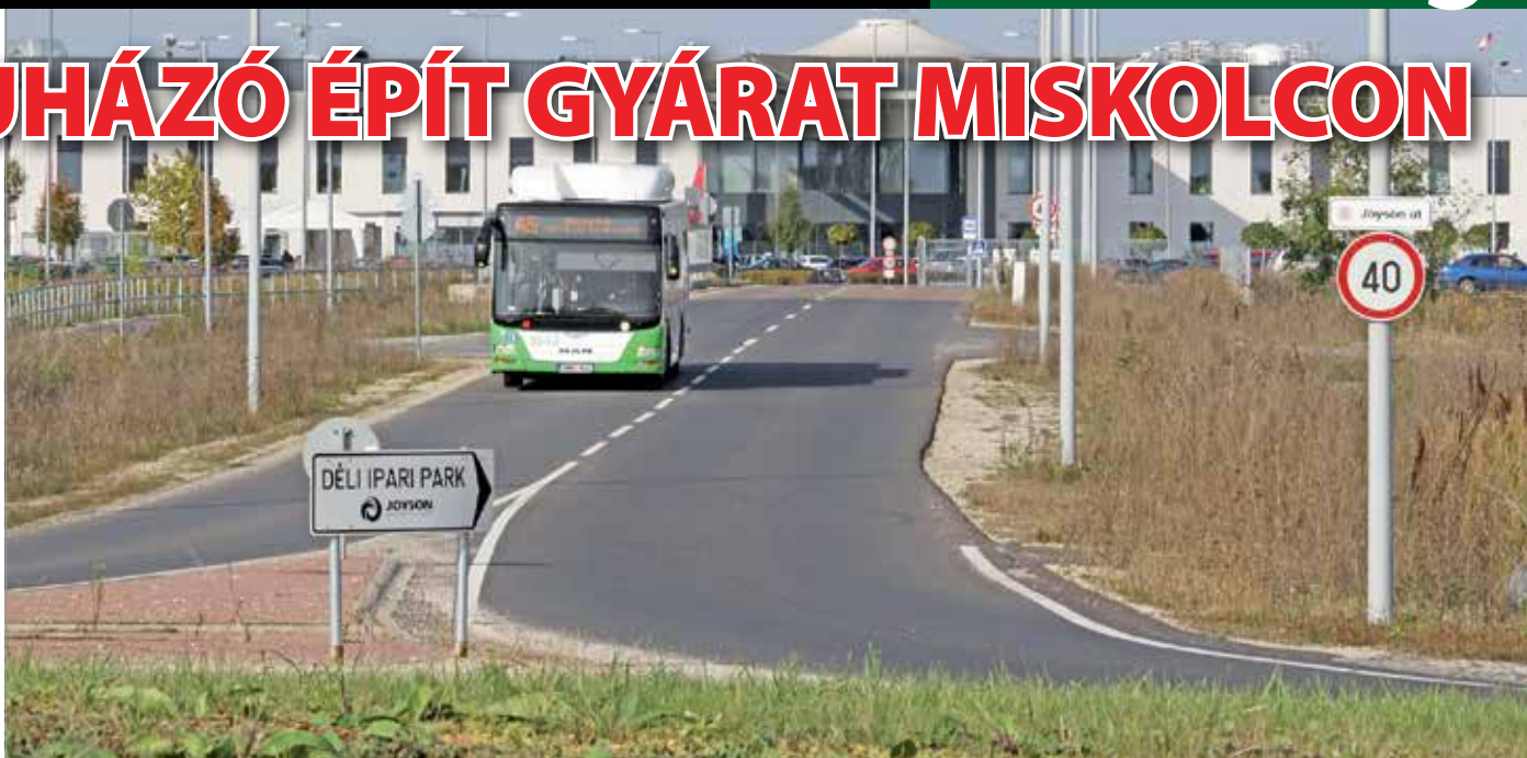
Hogy pontosan hol épülne fel az új gyár, arról egyelőre nincsenek információk.