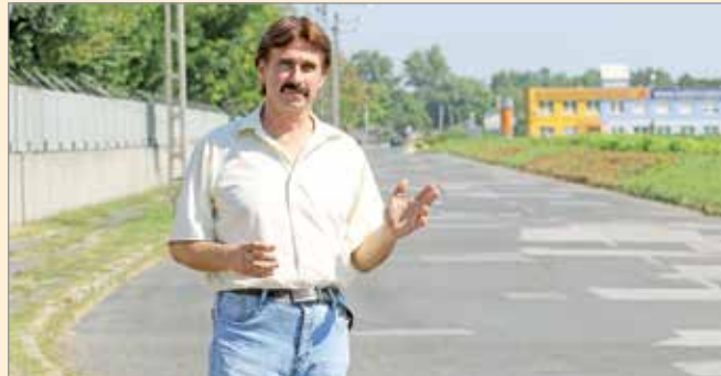
Selyemrét fő gondjait évek óta a prostitúció és a parkolás megoldatlan szabályozása jelentik.