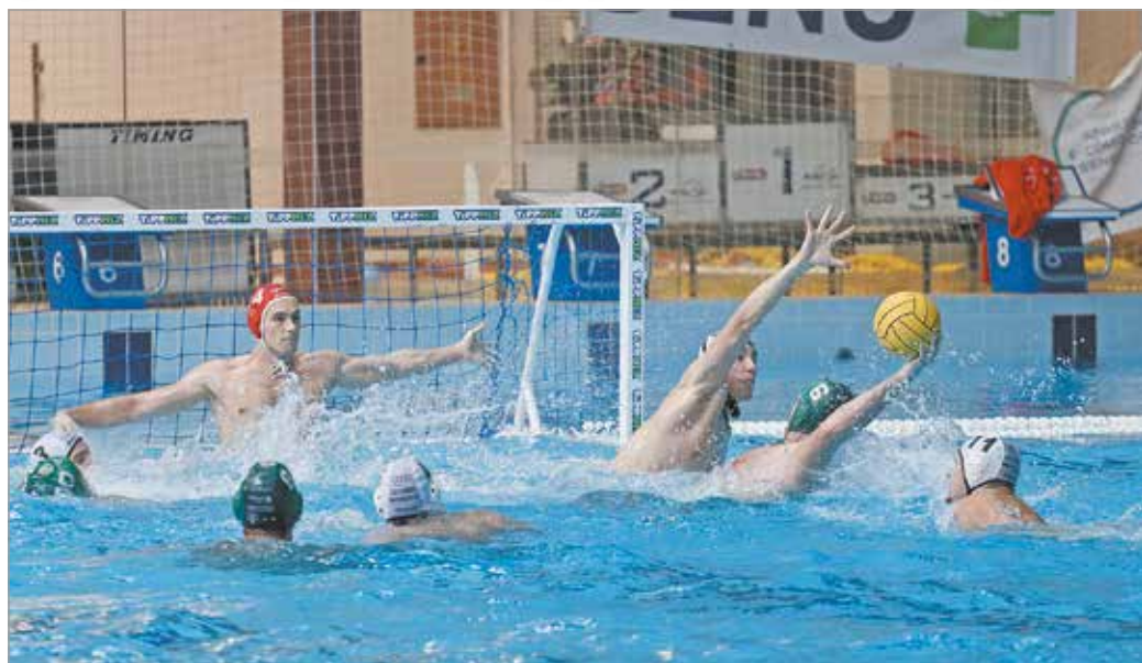
Szerdán a bivalyerős FTC-t fogadta az MVLC.

Most azonban, mint arra tettünk utalást, mások voltak a körülmények: a miskolci csapat meghatározó játékosai közül többen távoztak, őket fiatal