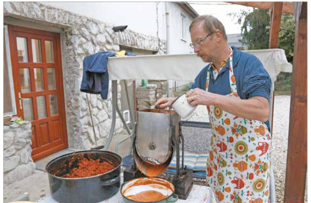
Amit eddig passzióból csináltak, ezentúl tudatosan végzik.

– A kertünk több mint 1000 hektáron fut fel a dombon. Nagyjából három éve készítünk az itteni termésből lekvárt, persze csak kedvtelésből, szeretetből, magunknak. Feleségem gyakran szedett csipkét, abból is főztünk. A környéken ugyanis sok csipkebokr van. Itt nincs akkora hagyománya a csipkeszedésnek, mint Erdélyben, nem sok embert láttunk, aki ezzel foglalkozott volna. Gondolkodtunk, hogy csinálunk egy ültetvényt, de mint mondtam, rengeteg csipkebokr nő szabadon: kértünk tehát engedélyt a megfelelő helyekről,