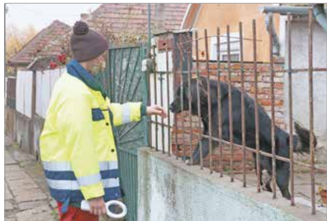
Ellenőrizték az otthon tartott kutyákat is.