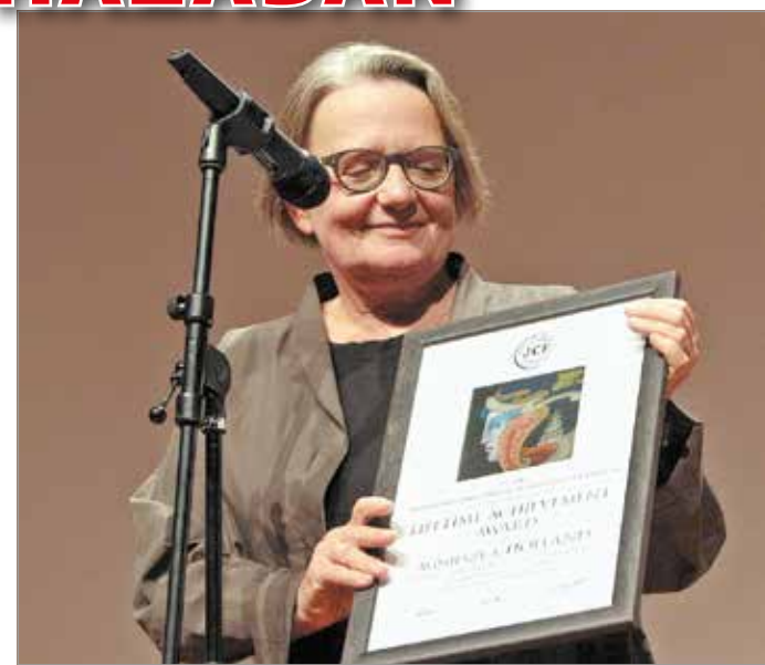
Agnieszka Holland 2012-ben a CineFest Miskolci Nemzetközi Filmfesztivál Életműdíját vette át.

Ezen a napon a programban részt vevő filmszínházak – köztük 26 magyarországi művészmozira – speciális filmkínálattal várják a közönséget, természetesen a jelenlegi helyzethez igazodva fokozott odafigyeléssel az egészségvédelemre.