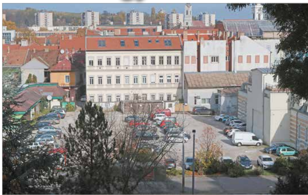
Nem épül a parkoló helyén irodaház.