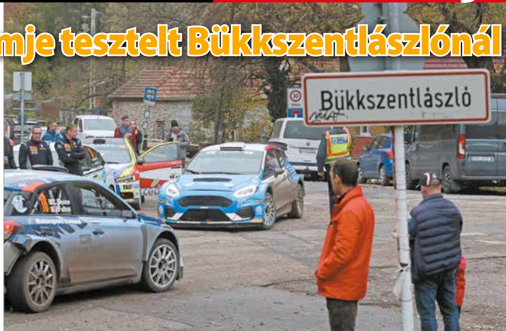
A Bükkzentlászlot Bükkzentkereszttel összekötő szakaszon teszteltek.

Irtózatosan erős mezőny állt össze a november 6-8. között a Zemplénben megrendezendő Rally Hungaryra. Az Európa-bajnokság idei negyedik versenyhétvégéjén az Eb-menők mellett világbajnoki versenyzők is érkeztek a zempléni szakaszokra: itt lesz mások mellett Andreas Mikkelsen , Mads Ostberg és Craig Breen is. A magyarok is képviseltetik magukat a futamon, a négyszeres hazai bajnok Herczig Norbert az Európa-bajnokság