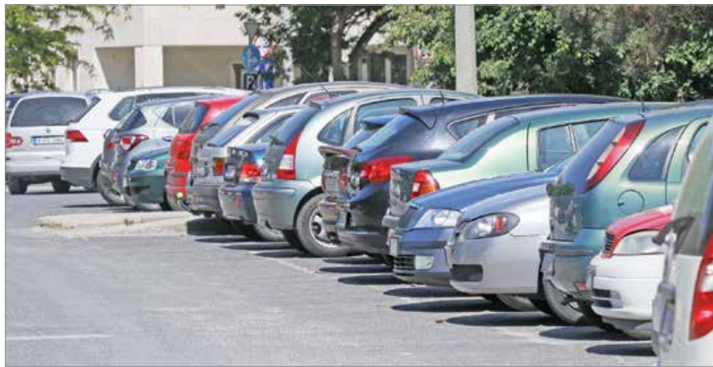
Ismét bevételkiesést jelent az önkormányzatnak a bevezetett ingyenesség.

Emlékeztetünk arra is, hogy az éves parkolóhelyek tulajdonosai esetében – az országban egyedülálló módon – kompenzációról döntött a városvezetés: az április 5-éig megváltott éves