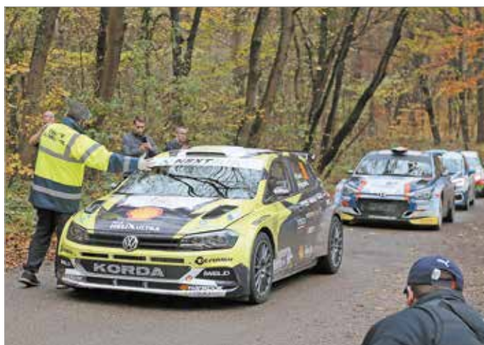
Nemzetközi mezőny gyűlt össze.