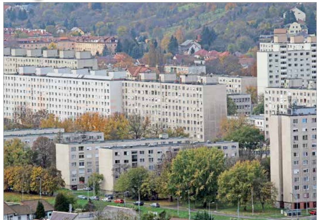
Felelős ingatlangazdálkodást vezettek be az önkormányzati bérlásoknál is.

Az alsó határt az adja, hogy csak olyan kaphat önkormányzati bérlakást, aki képes lesz azt fenntartani, a havi díjat fizetni. Tehát kedvezményre is