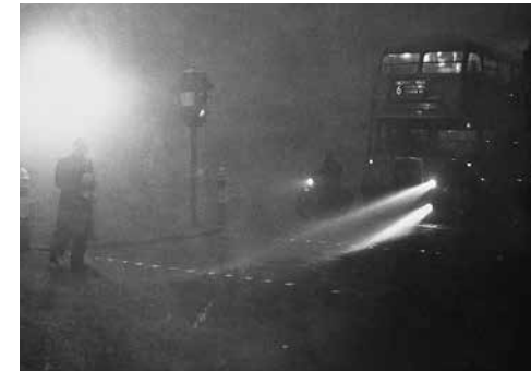
London, 1952. december 14. 14 óra

A szmog angol eredetű szó (a „smoke” = füst és a „fog” = köd szavak összetételéből), jelentése füstköd. Közel 70 éve, 1952 telén sűrű, az orrot és szemet csípő, szénfüstös levegő ült meg London utcáit, csak méterekre lehetett látni. A város életét teljesen megbénította a kialakult mérgező légkör, több ezren haltak meg ezekben a napokban. Kialakulásának oka a légkörbe kerülő nagy mennyiségű por, kén-dioxid és korom, amelyekből a levegő magas nedvességtartalmával reakcióba lépve kénsav tartalmú, sárgás-zöldes színű, maró köd keletkezett. Azóta ezt a jelenséget nevezik London-típusú szmognak.