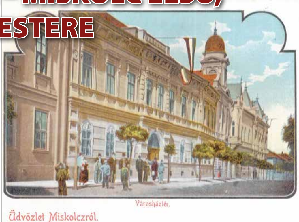
Századeleji képeslap, balra a régi városházával