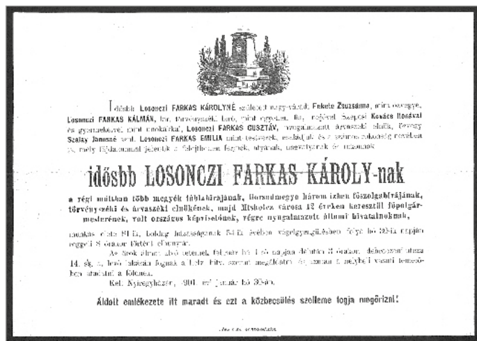
Losonczi Farkas Károly nekrológia

Hogy emléküket ápoljuk, utcákat, iskolákat nevezünk el róluk, évtizedekre bebetonozva őket a városi köztudatba. Ha azonban Losonczi Farkas Károly nevét említjük, akkor hiába keressük a róla elnevezett utcát, teret, intézményt. Holott ő volt a város első polgármestere, és ebben a minőségében fontos lépéseket tett meg annak érdekében, hogy a város az önállósodás rögös útjára lépjen.