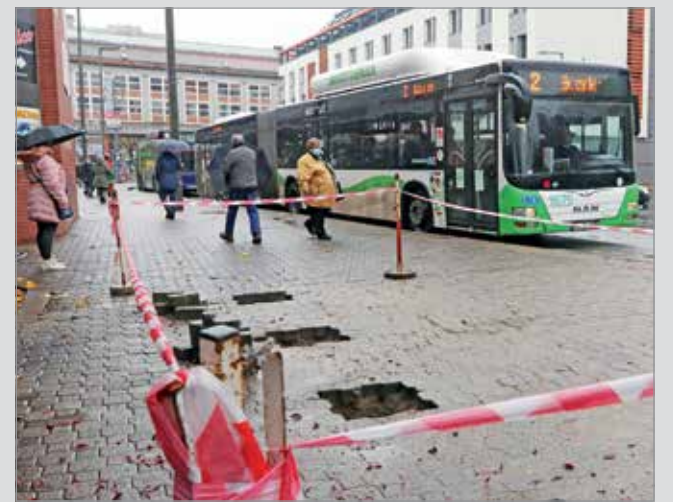
A Centrum szomszédságában már el is kezdődött a munka.

A miskolci buszmegállókat karbantartását a Miskolci Városgazda Nonprofit Kft. végzi, ez elsősorban állagmegóvási munkákat, festést, illetve az időjárás okozta megrongálódások kijavítását jelenti. A most induló projekthez hasonló, nagyszabású utasváró-korszerűsítési program hosszú évek óta nem volt a városban. Az első húsz utasváró átalakítása, korszerűsítése november 16-án kezdődött meg, a munkálatok több ütemben zajlanak majd a város közterületein egy hónapon át.