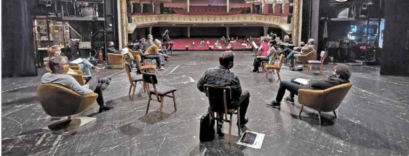
Folyamatos munkával készülnek az előadásokra.

– Amikor kiderült, hogy egyáltalán nem játszhatunk, akkor annak is nagyon örültem, hogy legalább a próbákat folytathatjuk. Rossz tapasztalat volt a tavaszi leállás, és jó, hogy most abban a formában nem kell mindent újra átélni. A Producerek próbáit nagyon izgal-