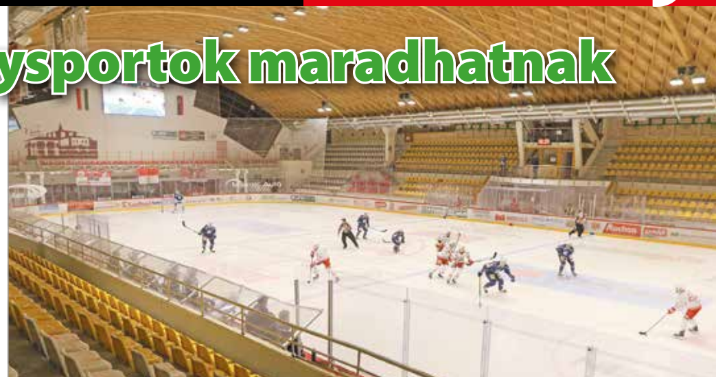
A jégkorongmérkőzéseket is csak zárt kapuk mögött tarthatják meg.

Az amatőr sportolók azonban legalább 30 napig nem vehetik igénybe a szabadidőközpont szolgáltatásait. „Hasonló nagyságrendű az az állandó kör, amelyet most nem tudunk fogadni.