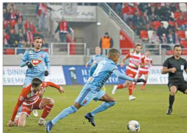
Székesfehérváron vendégeskedik a DVTK.

Vasárnap délután 5 órakor a székesfehérvári MOL Arénában vendégeskednek a piros-fehérek. A házigazdák jelenleg a bajnoki tabella negyedik helyén állnak, 4 győzelem és döntetlen mellett eddig egy vereségük van csak.