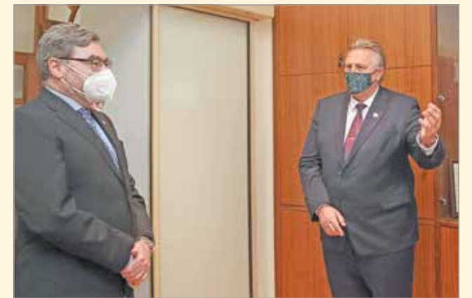
Az új brit nagykövet első hivatalos vidéki úticélja Miskolc volt.