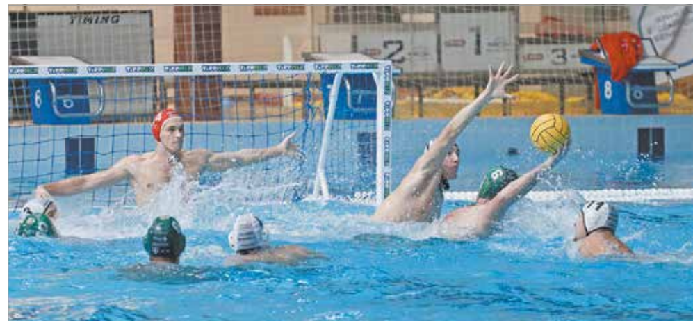
Szardán a Komjádi uszodába látogat a miskolci csapat.