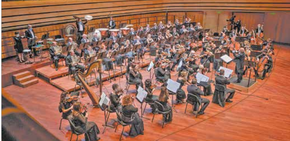
Nyelcvan hangversenyt adtak az ötvenhetedik évadban.

– Egy komolyzenei nagy együttesnek a működése a személyes találkozásokon alapul. Meg kellett találni azokat a lehetőségeket, amelyek által kapcsolatban maradhatunk egymással és a közönséggel. Nem volt egyszerű feladat, de úgy gondolom, sikerült kiaknázni az online teret. Igyekeztünk a kottákat eljuttatni a kollégákhoz, a művészeti vezetőnkkel online konzultációkat tartottunk, egyeztetettünk a ze-