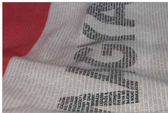
Egyedi grafikájú darabokat tervez

– Trianon 100. évfordulójának alkalmából egy teljesen unikális zászlót is készítettünk, amire a békediktátum előtti Magyarország összes településneve rákerült. Ez nagyon komoly, három hónapon át tartó kutatómunkát igényelt, mert sehol nem gyűjtöték pontosan össze, hogy hány település volt a múlt század elején hazánkban. Végül találtunk egy könyvet, amiben mindezt felsorolták. Egyesével másoltam ki belőle a több mint 12000 településnevet, amik korhű helyesírással kerültek a zászlóra. A kész trikolor végül másfél méterszer egy méteres lett, az 1920-ban elcsatolt települések, valamint a jelenlegi 3155 magyar település neveivel, összesen 12650 helynévvel.