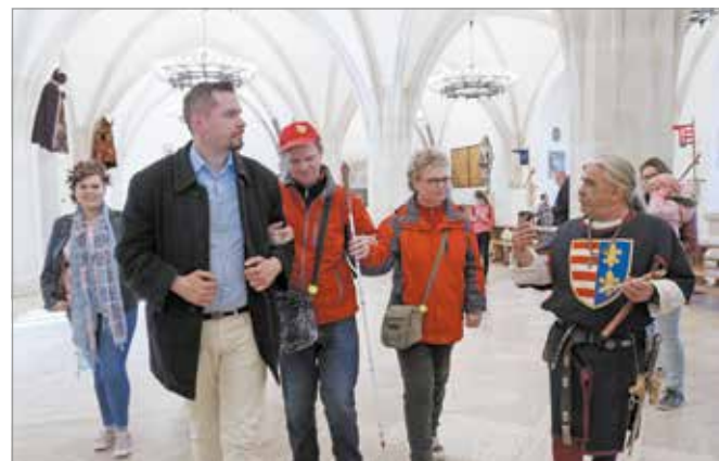
Tapintható tárlatvezetés a várbán.

A szakmai műhely éppen azzal a céllal jött létre, hogy ezeket a javaslatokat, elvárásokat megfogalmazza és közvetítse. Szeretnék felhívni