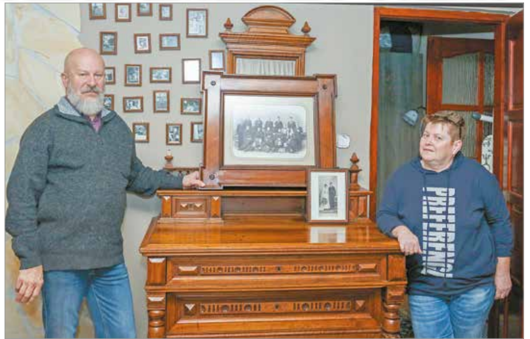
A házaspár számára kiemelten fontos a családi hagyományok megőrzése.

hivatkozva – nem tettek eleget, így a cég azt elvileg szétszereltette, és egy raktárba pakolták el. Azért csak elvileg, mert a sajtó képviselőinek ígéretük ellenére sem mutatták meg sem azt a bizonyos raktárt, sem az üres üzlethelyiséget. Információink szerint az ügyön jelenleg is dolgoznak az önkormányzat jogásza, a cél ugyanis az egykori patika bútorzatának megőrzése, Miskolcon tartása.