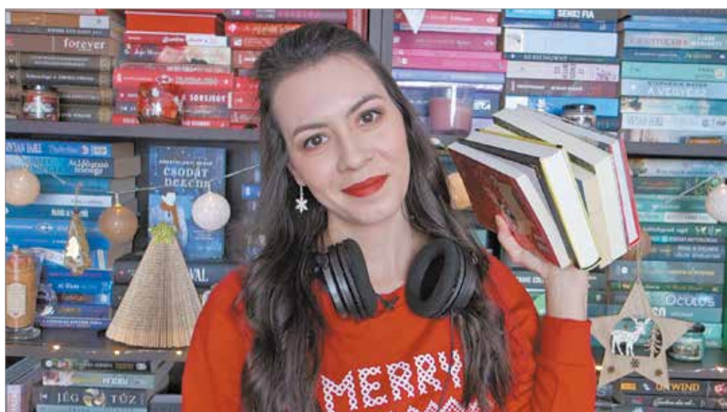
Venczel-Tóth Evelin vlogjában osztja meg könyves tapasztalatait

Szvetlana Alekszijejics orosz újságíró 1985-ben egyszerre két könyvet jelen-