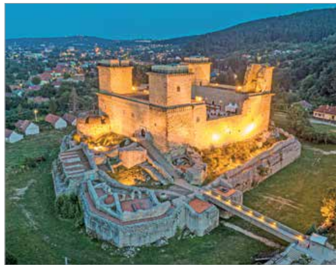
Elkezdődhetnek a vár második ütemének munkái