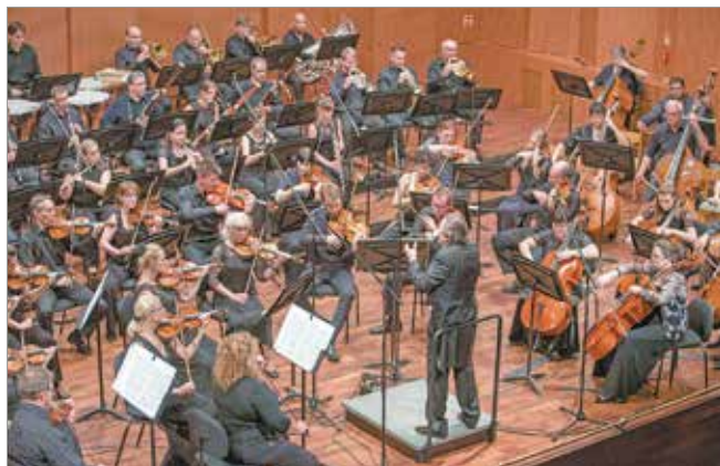
A zenekar a novemberben tartotta utolsó koncertjét