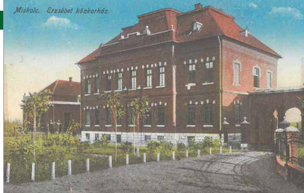
Az Erzsébet Közkórház egy századeleji képeslapon

Még 4 éve sem üzemelt a kórház, a helyi sajtó máris egy óriási szenzációról számolt be, miszerint számai ikreket szült egy szirmai béres felesége. A tanulmányozásukra rögtön tudományos bizottság alakult, de a kórház nem tudta finanszírozni önerőből a