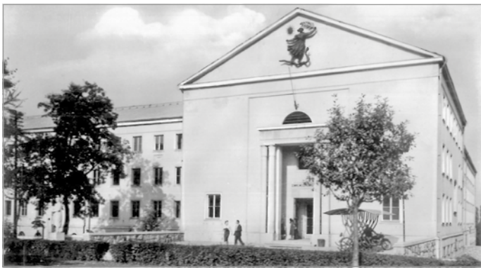
A frissen átadott rendelőintézet

Kórház történeti sorozatunk kronológiájában 1900-ra jutunk el ahhoz a ponthoz, amikor már egy ma is álló komplexum történetét tudjuk bemutatni, a Csabai kapuban megtalálható Borsod vármegyei Erzsébet Közkórházat ugyanis ekkor adták át a lakosságnak. Ezt a kórházat ma „Semmelweis-ként” ismerjük, ami az 1856-ban megnyílt közkórház jogutódjának tekinthető.