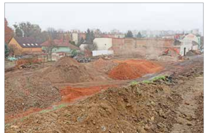
Az épületbontásokat is az előre egyeztetett tervek szerint végezték.

burkolatlan mezőgazdasági útként folytatódik egészen az ún. szennyvíztelepi út vasúti átjárójáig. Az elképzelés alapján ezt az utat építenék ki, ami a Fonoda utcába csatlakozva vállalható hosszúságú eljutási alternatívát jelentene a belső városrészek irányába.