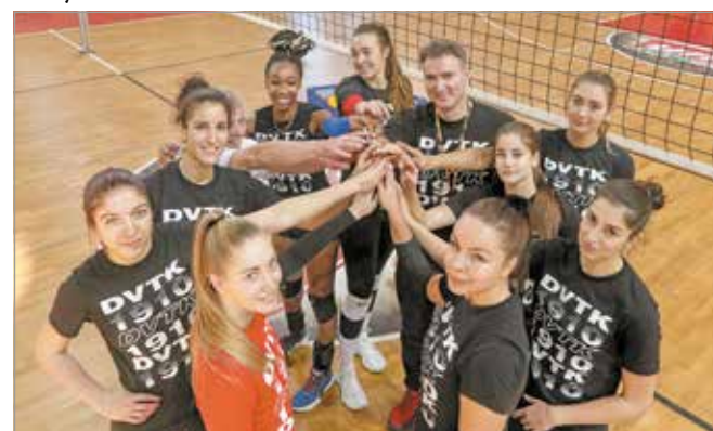
Komoly erőpróba előtt állnak.

Toma Sándor szerint jelenleg az a realitás, hogy két-három csapattal tudják felvenni a versenyt, a rájátszásban már szeretnének egyenrangú ellenfeleik lenni. De addig még előttük áll a tavaszi bajnokik sora. Január 23-án hazai pályán kezdenek a piros-fehérek, a balatonfürediekkel mérkőznek meg. – Ha minden rendben van a csapat körül, nem lesz megbetegedés, sérülés, akkor jó eséllyel várjuk a meccset. Egy győzelem, illetve majd idővel a szurkolóink visszatérése nagy energiát adna nekünk. Szeretnénk bent maradni az Extraligában, megmutatni, kik is vagyunk valójában, és hogy helyünk van a legjobbak között.