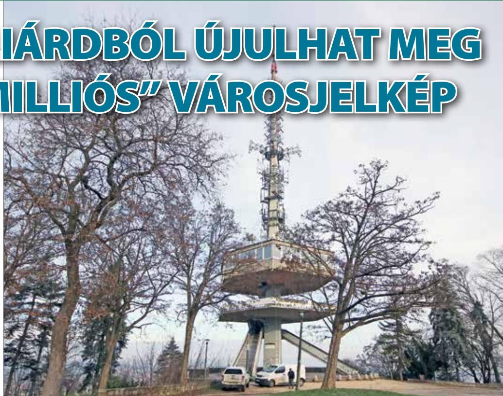
A toronyról várhatóan lekerül a „tányérok” jelentős része.

A 72 méter magas, a több mint fél évszázad során egyre népesebb antennaállománnyal megterhelt toronyról egyébként várhatóan lekerül a „tányérok” jelentős része, és a közvetlen környezet is átalakul, megszépül. Az előtte elterülő parkoló megszűnik, lesz helyette – egy későbbi projekt keretében – színpad, söröző, park, az oda vezető utat is javítják, sétányt alakítják (parkolókkal). Újra-