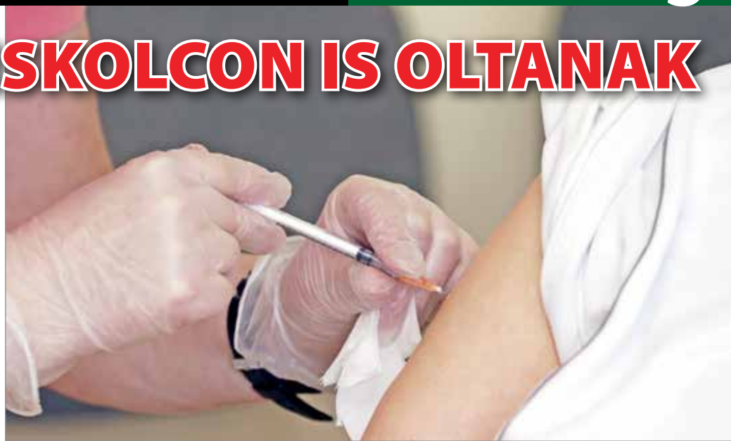
A hét második felében a miskolci időszobában is megkezdtek a vakcinációt.

A hét második felében a miskolci időszobában is megkezdtek a vakcinációt, mintegy száz