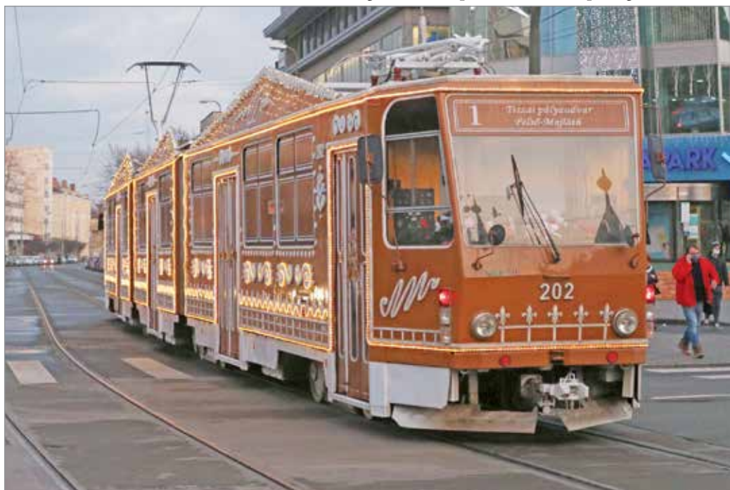
Több mint 3,45 millió szavazat érkezett a miskolci villamosra.

Lényeg, ami lényeg: sikerült! 2017, 2018 és 2019 után 2020-ban is a miskolci adventi villamos lett Európa legszebbje. Tavaly év végén egyébként már kilencedik alkalommal indította el ünnepi szerelvényét az MVK, ami azt is jelenti, hogy 2021-ben jubilálni fog a miskolci adventi szerelvény.