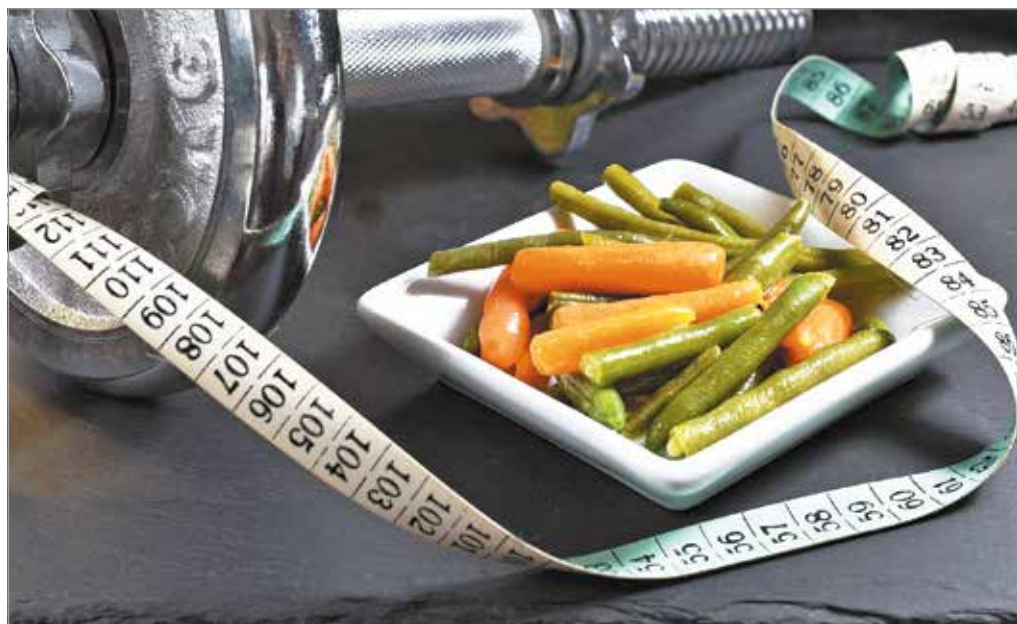
A megfelelően felépített étrend a legfontosabb.