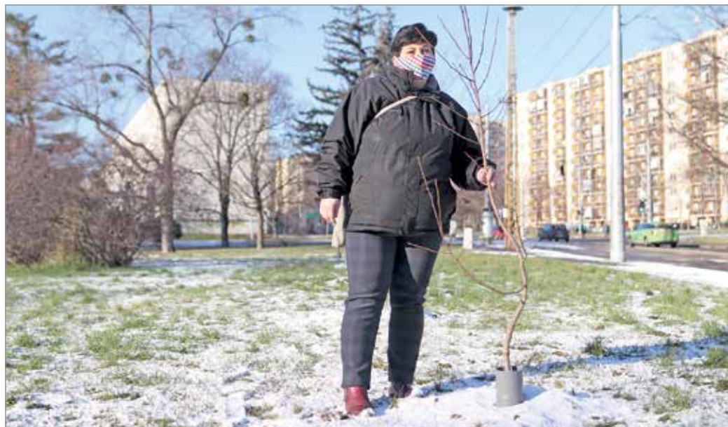
A Díszterén szinte minden megtalálható, ami a város zöldterületeit jellemzi.

Ez azt jelentené, hogy a város a beérkezett igényeken túl is folyamatosan vizsgálja a városi növényállományt, és amennyiben elvégzendő feladatot látnak, arról tájékoztatják az ott élőket, majd elvégzik a munkálatokat. Ilyen volt egyébként bő egy évtizede a Madarász Viktor és a Baththyány utcai fasorok fiatalítása vagy ép-