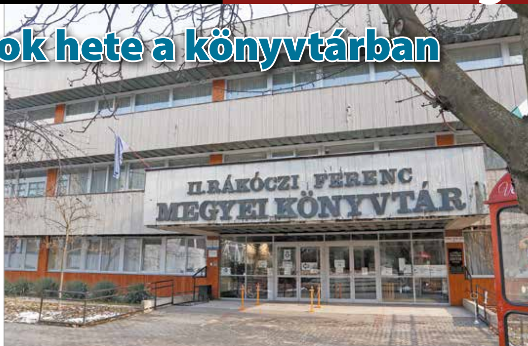
A könyvtár szolgáltatásai egyelőre korlátozottan vehetők igénybe.