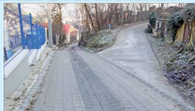
A kivitelező vállalta, hogy a fagyok után a hiányzó javításokat megcsinálja.