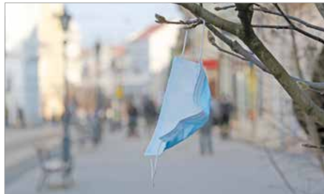
Az egyszer használatos védőfelszerelések gyártása elképesztő méreteket öltött.

Bár november óta tart a veszélyhelyzet, nem állt le annyira szigorúan az élet, mint tavaly tavasszal, és ez érzékelhető környezeti terhelést okoz. Az olajszektor pedig úgy tűnik, gyors áremelésekkel szeretné behozni az eddigi veszteségeit. A repülőforgalom terén még nem jelent meg ez a kompenzációs törekvés, de úgy vélem, amint nyáron lehetőség lesz a külföldi turizmusra, a társaságok ott is pótolni akarják majd a kiesést.