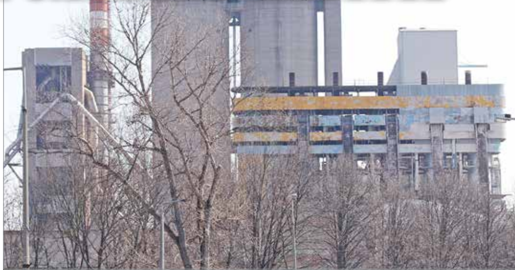
Az ítélet után felmerül a kérdés, újraindulhat a cementgyártás Miskolcon?

Az új munkahelyekben reménykedőknek is rossz híreink vannak. A környékbeli nagyobb cégek ugyanis már éveken keresztül jelezték a város felé, nekik tiszta levegőre van szükségük. Olyannyira, hogy mielőtt elkezdtek volna beruházásukat, a Miskolc Holding Zrt.-nél érdeklődtek, mi a város szándéka a cementgyárral. A városnak persze nincs ezzel szándéka, a város