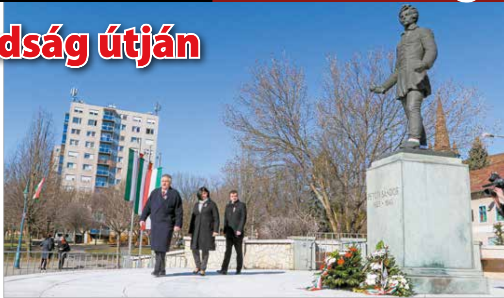
Rajtvonalhoz a Petőfi térnél állhatunk, ahol máris ott magasodik a költő szobra

Itt kell tennünk némi kitérőt, ha meg akarjuk találni a már emlegetett Szemere Bertalan szobrát és a róla elnevezett kertet. A vattai születésű, ám Miskolchoz ezer szállal kötődő reformkori politikus egész alakos