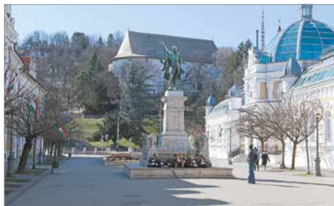
A Kossuth-szobor az Erzsébet téren.

készült kis oszlop is kiépítésre került. Egy 2000-ben kelt újságcikk számol be arról, hogy a posztamenszre a 13 aradi vértanú képmását tervezték, az azonban a mai napig várat magára. A környék romanti-