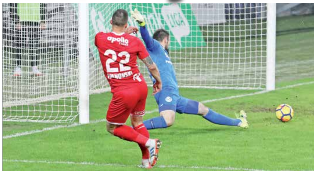
Ha egy csatár elkapja a fonalat, akkor a rossz lövésből is gól születik.

Többször hangsúlyozta már, hogy el kell bírni a terhet, javult a csapat teljesítménye ezen a téren, amióta Miskolcon van? – kérdeztük az eddigi mentális felkészüléséről. – Nincs más lehetőségünk. Minden nap beszélünk arról, hogy senki sem fog a segítségünkre sietni, csak mi vághatjuk ki magunkat ebből a nehéz helyzetből. Most kell igazából okosan játszani mind támadásban, mind védekezésben. Az elmúlt néhány forduló meggyőzően arról, hogy Magyaror-