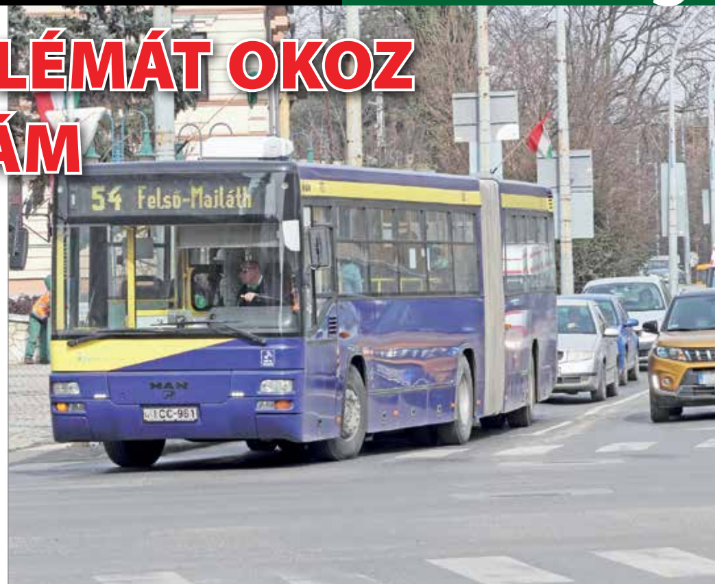
Miskolcon csütörtökön lépett életbe egy újabb menetrend-módosítás.

Miskolcon csütörtökön üzemkezdettől lépett életbe egy újabb menetrend-módosítás, néhány hivatásforgalmat ellátó járat kivételével jellemzően ritkábban járnak a buszok és a villamosok (lásd keretes írásunkat). Az MVK villamospályák üzemeltetése igazgatója szerint minderre azért volt szükség, mert azt tapasztalták, hogy az óvodák, iskolák és üzletek bezárása, valamint az egyre több helyen jellemző otthoni munkavégzés miatt a