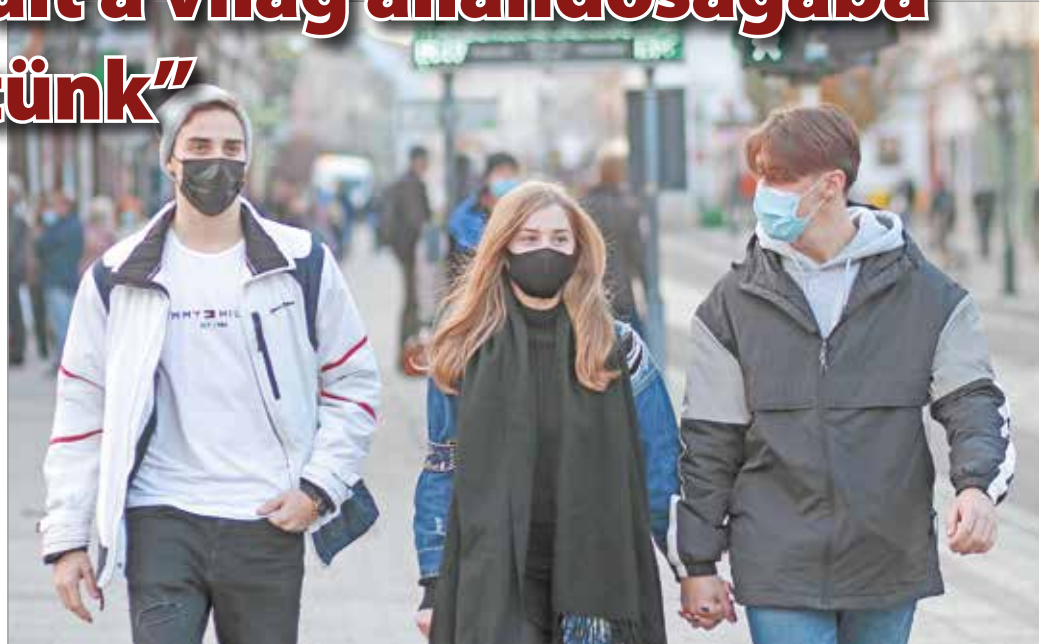
A kamaszokat érintheti meg leginkább, hogy az online térbe kényszerülnek.