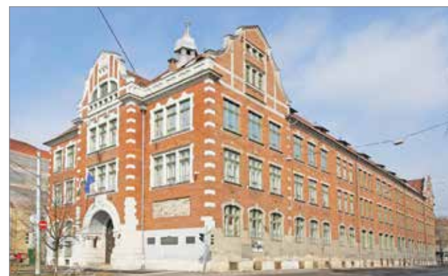
A Földes az elmúlt kilenc évben féltucat pályázati eljárás van túl.