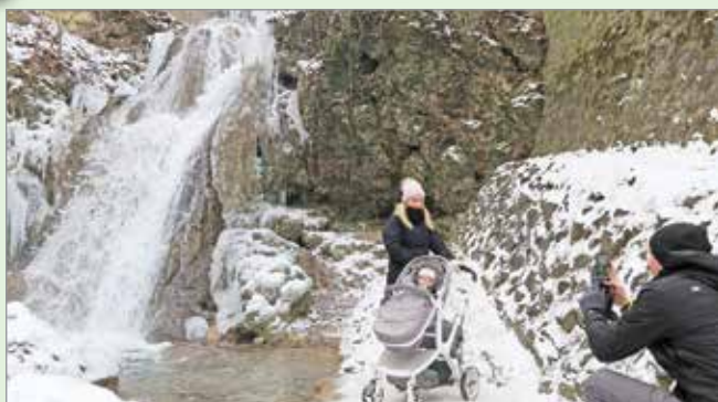
Lillafüred is népszerű úticél.

Mivel a pandémiás szabályok javarészt csak beföldi turizmusra adtak lehetőséget, így tavaly a kikapcsolódni vágyó honfitársaink beföldi úticélok után néztek. Ennek hatását láthatjuk a hazai turisztikai települések toplistáján is: a budapesti kerületek többsége jóval hátrébb került az élményből, számos vidéki nagyváros pedig akár 5-10 helyet is ugrott előre. Még ebből a mezőnyből is kiemelkedik Miskolc, amely az előző évi 23.-ról 12 helyet javítva, a 11. helyen landolt 2020-ban, olyan hagyományosan nagy vendégforgalmú városokat is megelőzve, mint Gyula vagy Eger.