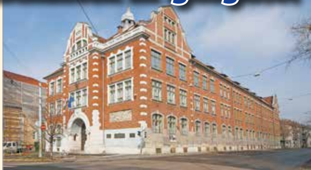
Az igazgatói pályázat elbírálásáról legkésőbb június 28-áig döntenek.