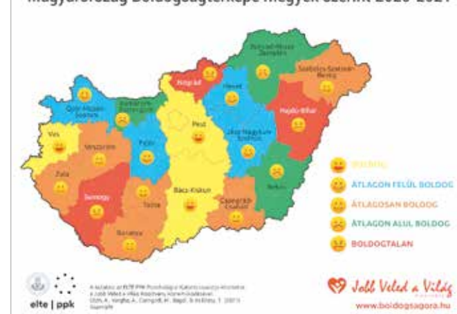
Magyarország Boldogságtérképe megyék szerint 2020-2021