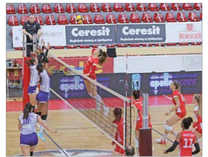
Nyomás alatt tudták tartani ellenfelüket, de egy sérülés eldőlt a találkozó sorsát.