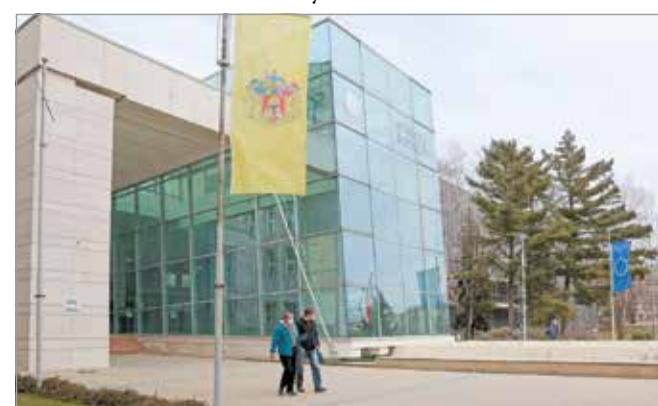
Egyre népszerűbb a Miskolci Egyetem.