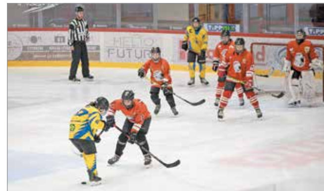
Döntőbe szeretnének jutni.

Hogy ez a sikertörténet továbbíródjon, ahhoz le kell győzni a KSI-t. Az elődöntő második mérkőzését vasárnap fél öttől rendezik a Miskolci Jégcsarnokban.