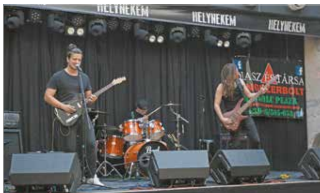
A jelentkezőknek minikoncertet kell adniuk.

könnyűzenei tehetségkutató és tehetséggondozó program miskolci állomása, vagyis a győztes továbbjut az őszi, budapesti döntőbe, ahol a legmodernebb fény- és hangtechnikai berendezéseken mutathatják be a műsorukat. Az országos verseny győztese hárommillió forint értékű fődíjjal térhet haza. A miskolci Helyfoglaló Zenei Tehetségkutató kiemelkedő versenyzői számos értékes különdíjat is elnyerhetnek, köztük hangszereket és hangszerkiégszítőket, fesztiválfelépési és előzenekari lehetőségeket, kedvezményes videoklip-készítést, profi stúdiófelvétel-készítési lehetőséget, stúdiós próbaidőt, rádiós, televíziós és egyéb médiaszerepléseket, pályázatírói támogatást, valamint ajándécsomagokat.