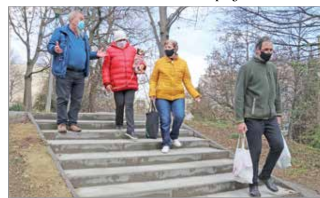
Lépcsők és járdák újulnak meg a hármas ütemben.