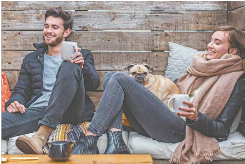
A hangsúly a családi kapcsolatokra, a munkára és a lakhelyünkre került.

A koronavírus miatt az örömforrások beszűkültek: a hangsúly a családi kapcsola-