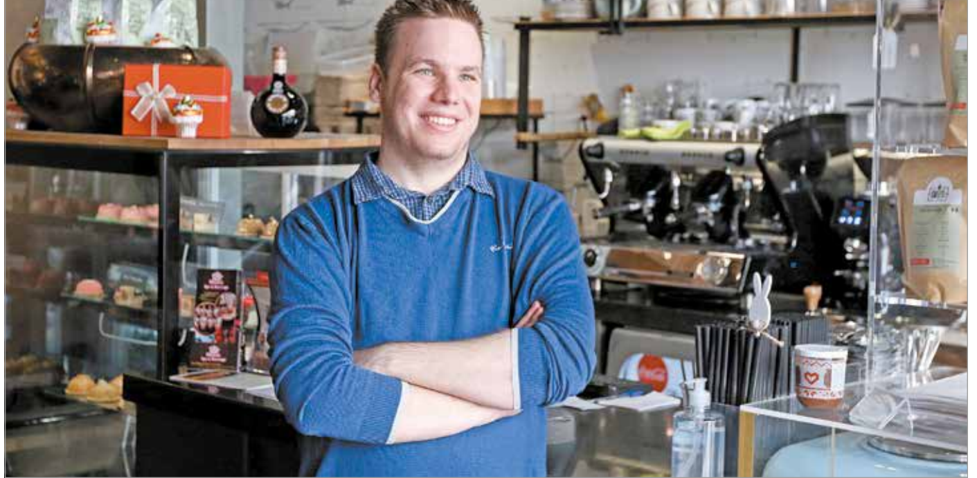
Jelenleg a belváros egyik legújabb kávézójában is ő felel a kávéért.

Mivel egyetemre első nekifutásra nem vették fel, az Egy Kávé viszont bezárt, Laci egy nyáron át a Magyar Tudományos Akadémia Energiatudományi Kutatóközpontjában dolgozott 3D nyomtatótechnikusként. „Itt viszont délután kettőtörk végeztem, és rengeteg időm volt. Szóval a szabadidőmben Budapest belvárosát jártam, és mivel a gasztronómia, a jó ételek, italok mindig is érdekelték, kávézókat és street food helyeket látogattam, többnyire a Google-, a Facebook- és Instagram-posz-