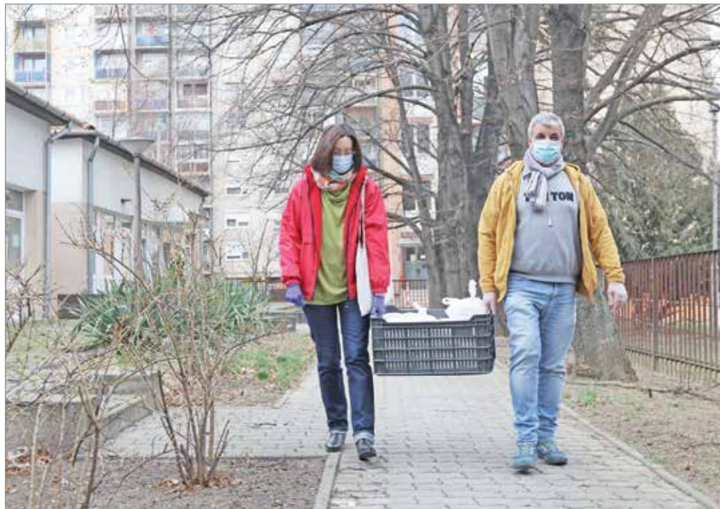
A MESZEGYI munkatársai házhoz viszik az idősek ebédjét.