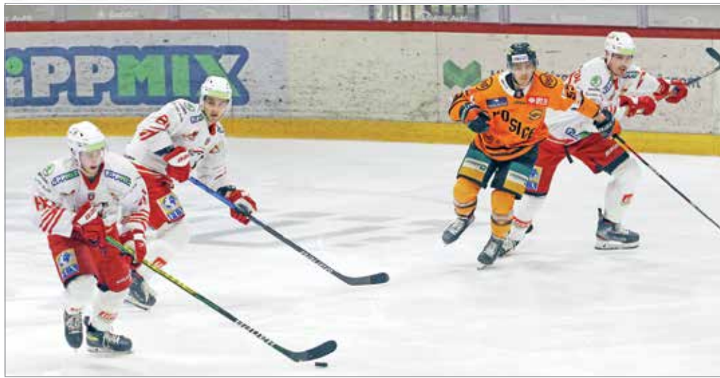
Magyar fiatalok és rutinos légiósok alkothatják a jövő csapatát.

Egri István beszélt az edzőkérdésről is. – Nem árulok el titkokat