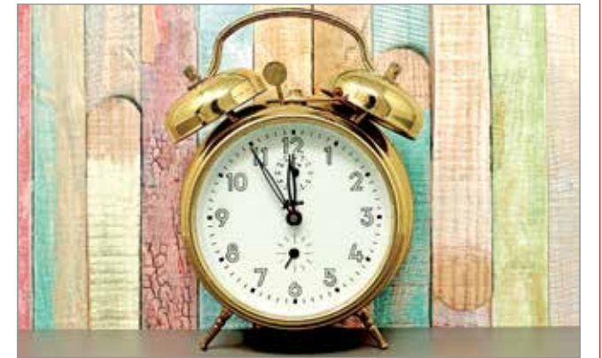
A klasszikus rézből készült ébresztőóra.

Bizonyos szteroidhormonja-ink szintje másképp alakul a nap mozgásával: hat és kilenc óra között vannak leginkább jelen a vérben, éjfélkor pedig a legalacsonyabb a koncent-rációjuk. A biológiai óránk ingadozása felboríthatja az alvás-ébredés ritmusát, ami kihathat az egészségre is. A téli-nyári átállás azonban kis- mértékű eltolódás.