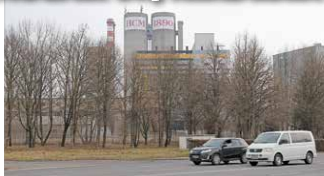
Sokan attól tartanak, a várt hátrányok biztosan jelentkezni fognak.

Nos, a beérkezett válaszok túlnyomó része elutasító, de legalábbis félelmekkel teli. A hejőcsabaiak majdnem mindegyike a korábbi sérelmekre emlékezik: hogy évtizedeken át milyen nagymértékben rontotta a levegőt a gyár közelsége, különösen az utolsó időszak gumiégetése; hogy úgy érezték, egészségtelen környezetben kénytelenek élni; hogy milyen terhelést jelentett az alapanyagokat szállító teherautók mozgása az utcákon, a szállítószá-