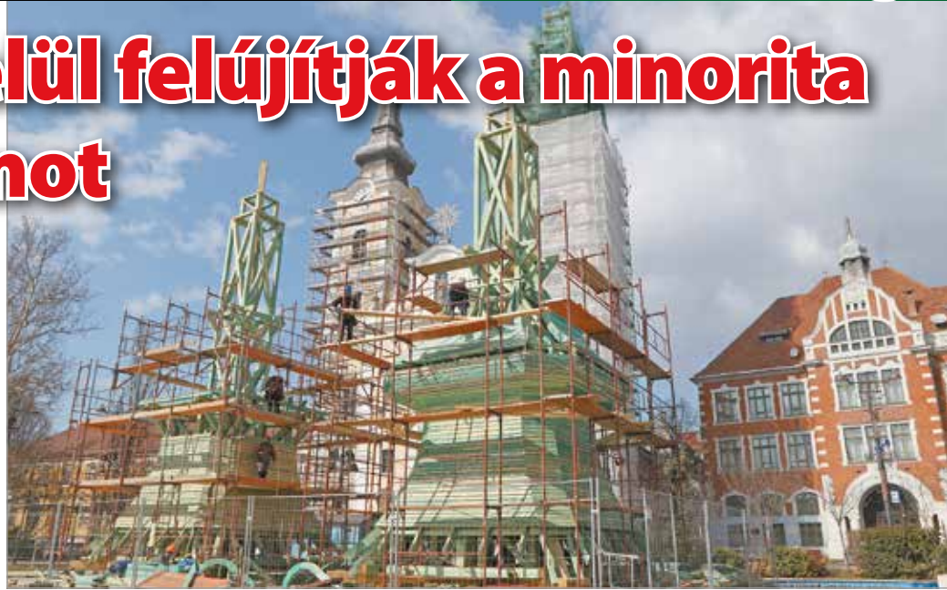
A sisakot a templom előtt készítik el.

Amint azt a szakemberektől megtudtuk, az első ütem befejezése a nyár végére várható, az új toronysisakokat speciális daruk segítségével emelik majd a helyükre. A felújítás második ütemében már a belső terekben