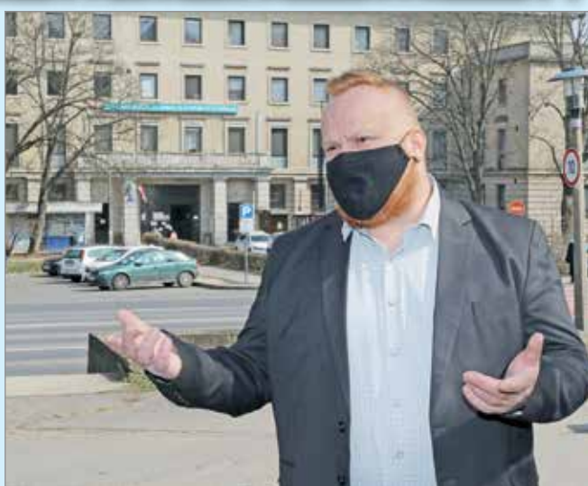
Szeretné tehermentesíteni az egészségügyi dolgozókat.

Jelentkezésénél tudatta, hogy oltást eddig még nem kapott, de ennek hiányában is vállalja a rábízott feladatot, nyilván védőfelszerelésben. – Amennyiben a beoltottság az önkéntesség feltétele, bármilyen típusú oltást elfogadok, és a szüksé-