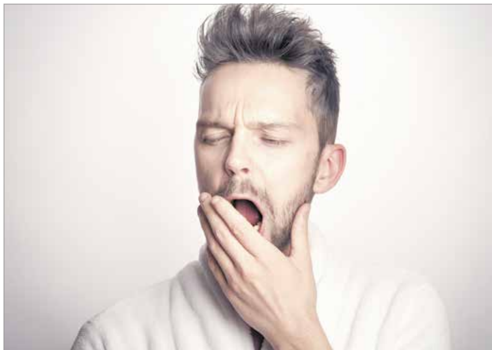
A tavaszi fáradtság hátterében is gyakran vitaminhiány áll.