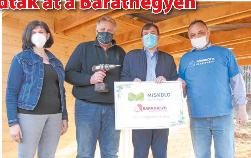
Lezárult az alapítvány „Baráthegyi Szociális Farm fejlesztése” nevű projektje.

A Baráthegyi Majorságban az elmúlt időszakban jelentős fejlesztések valósultak meg: új közösségi tereket alakítottak