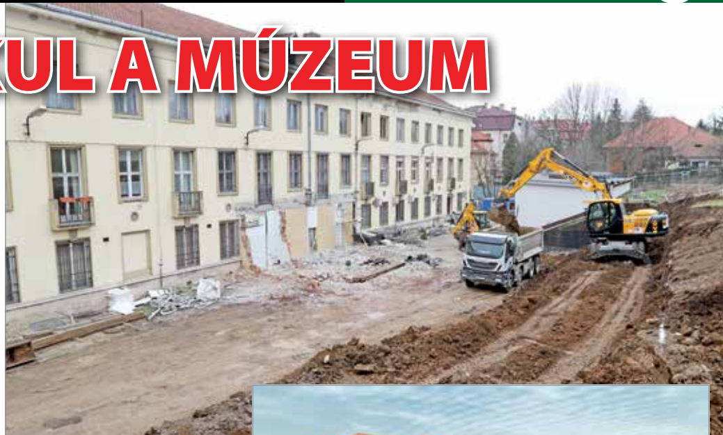
Dolgoznak a munkagépek.

Az átalakítás során nem csak külső munkák zajlanak. Arculatot vált a Herman Ottó Múzeum főépületének földszinti fogadótere is. A leírás szerint az új épületrész az aulához kapcsolódik, ahol az emeletre vezető lépcső alá kerül egy nagy kapacitású új vizesblokk, akadálymentes mosdókkal, kismama- és babakarát kialakítással. Mindemellett új ruhatár és a meglévő információs-vagyonőri pultról elkülönített új látogatói pénztár készül. Az emeletre érkező egy galériás kialakítású, tágas közlekedő tér nyílik. Innen közelíthetőek majd meg a képzőműv-