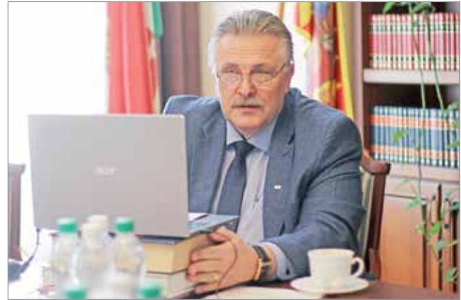
Nem emelik az étkezési díjakat.