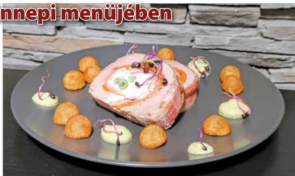
A főétel füstölt, főtt békebeli sonkával és blansírozott sárgarépával bélelt, ricottával töltött, baconbe tekert, egészben sült szűzérme. Fotók: Szűcs István

A húst mossuk meg, és hártázzuk le, vágjuk le az ún. fejét és a végét, hogy