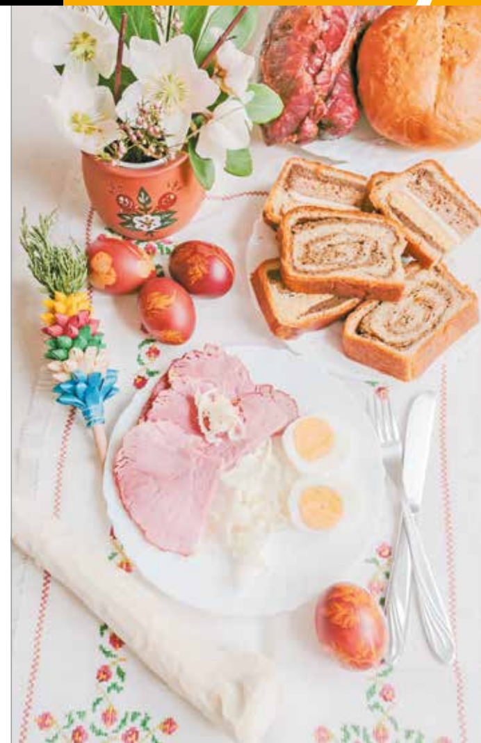
A húsvét a sonka-tojás-torma szentháromsága

A sárgatúró régen a húsvéti ételszentelés elengedhetetlen tartozéka volt a görögkatolikusoknál.