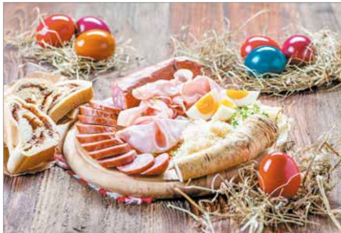
A tradicionális húsvéti reggeli