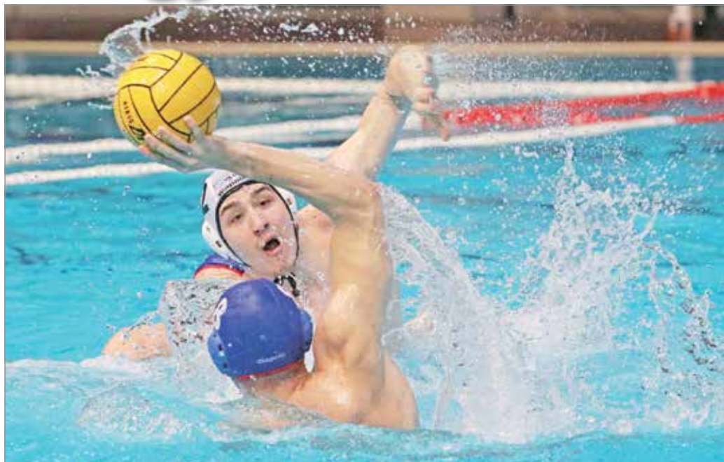
Végig az MVLC irányított a mérkőzésen.