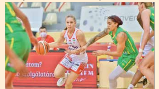
Miskolcon élesebb meccset vívnának a diósgyőri kosarasok.

A két győzelemig tartó párharcban szombat délután 5 órakor Miskolcon találkozik a két csapat.