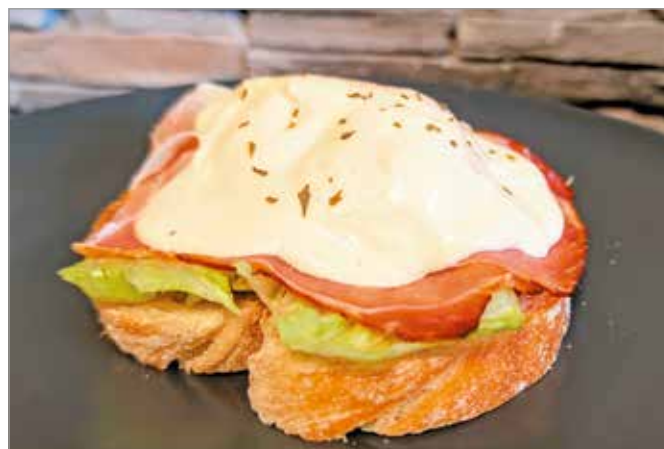
Reggeli-re húsvéti Benedict-tojást készít a rendőrséf