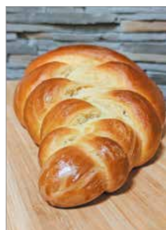
A rendőrséf idén kipróbálta a kalácslisztet

egy szép hengeres darabot kapjunk! Ezt vágjuk fel úgy, hogy szép téglalapformájú, kigöngyölt szeletet kapjunk! Szórjuk meg borssal és