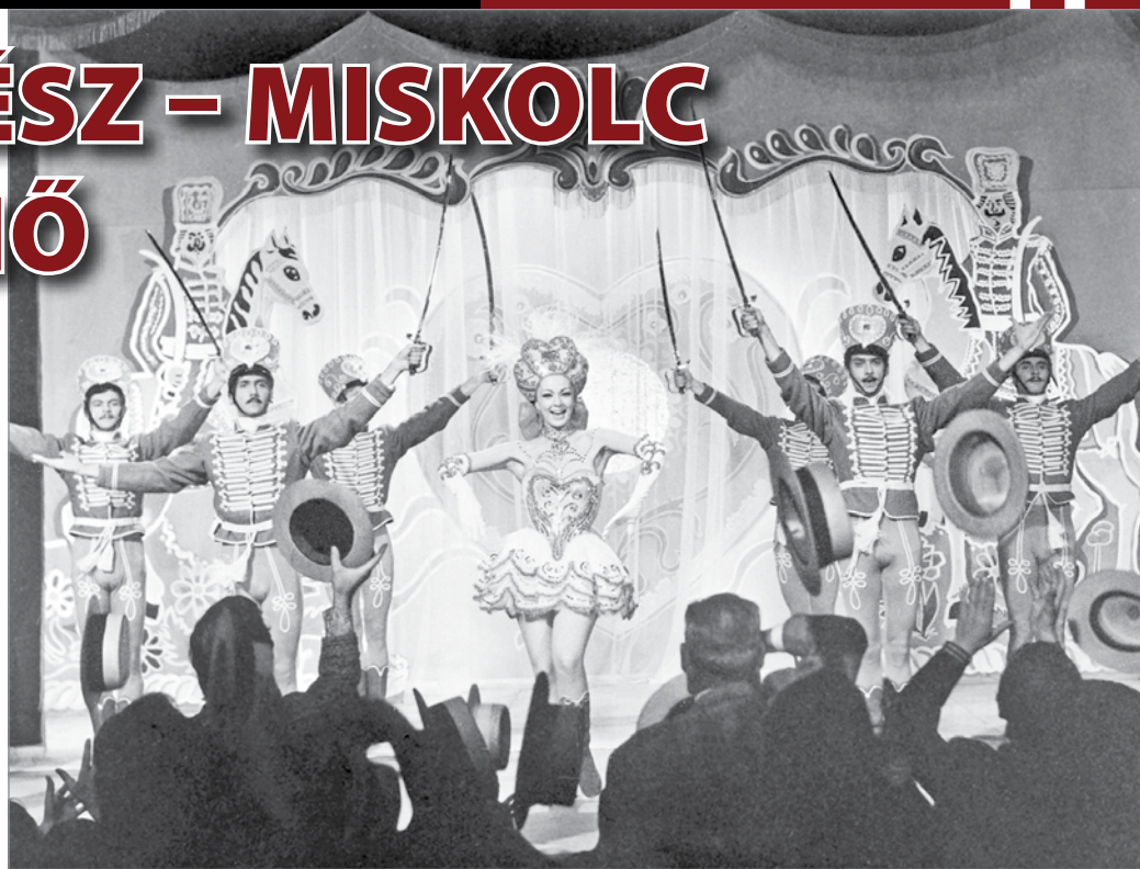
Német nyelvterületen a színházak a mai napig az eredeti szövegkönyv szerint játsszák A csárdáskirálynőt

...ahogy haladtunk előre a cselekményben, úgy születtek