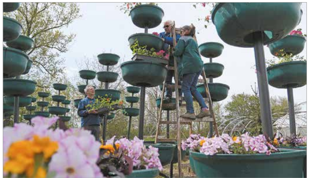
Huszonkét virágfa kerül vissza a belvárosba.