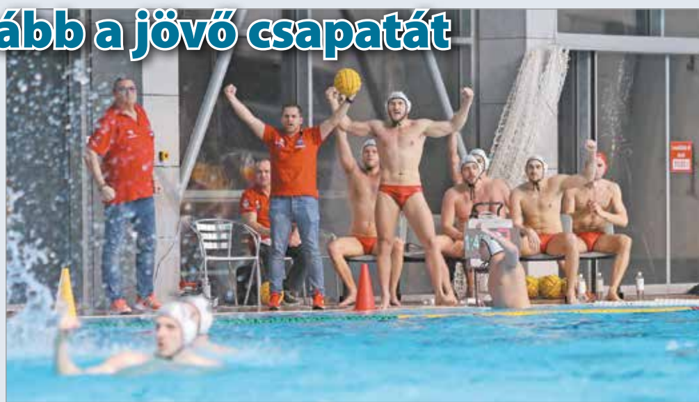
Bravúrokra készülnek.