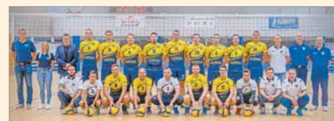
Fiataltva erősítenének.