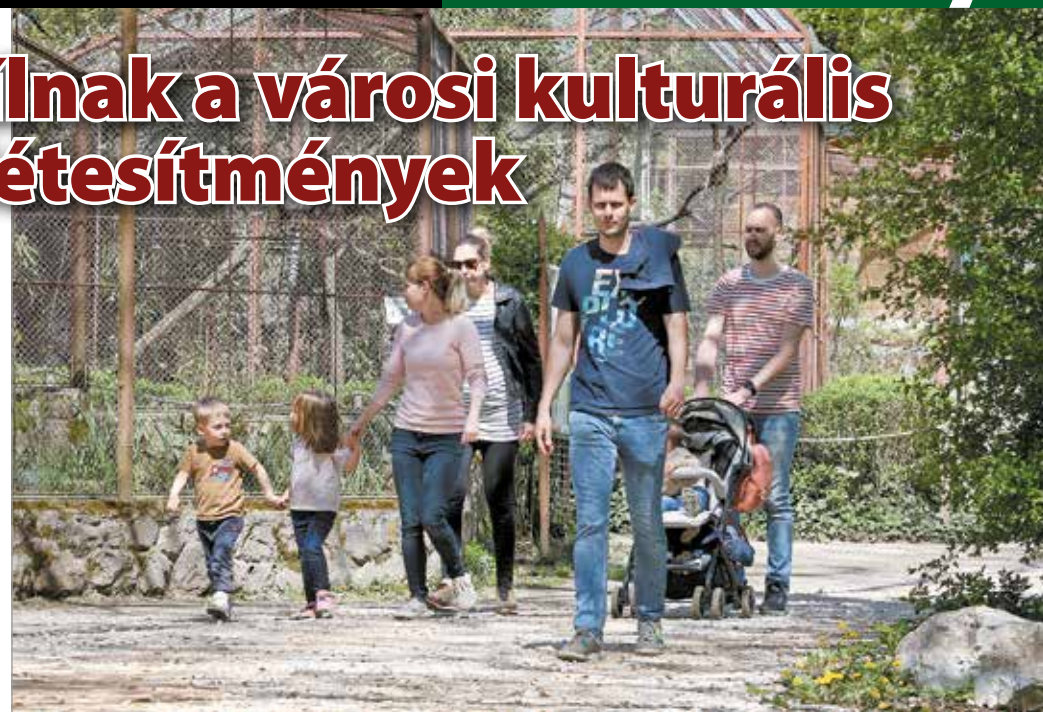
A Miskolci Állatkert és Kultúrpark május 1-je óta látogatható védettségi igazolvánnyal.