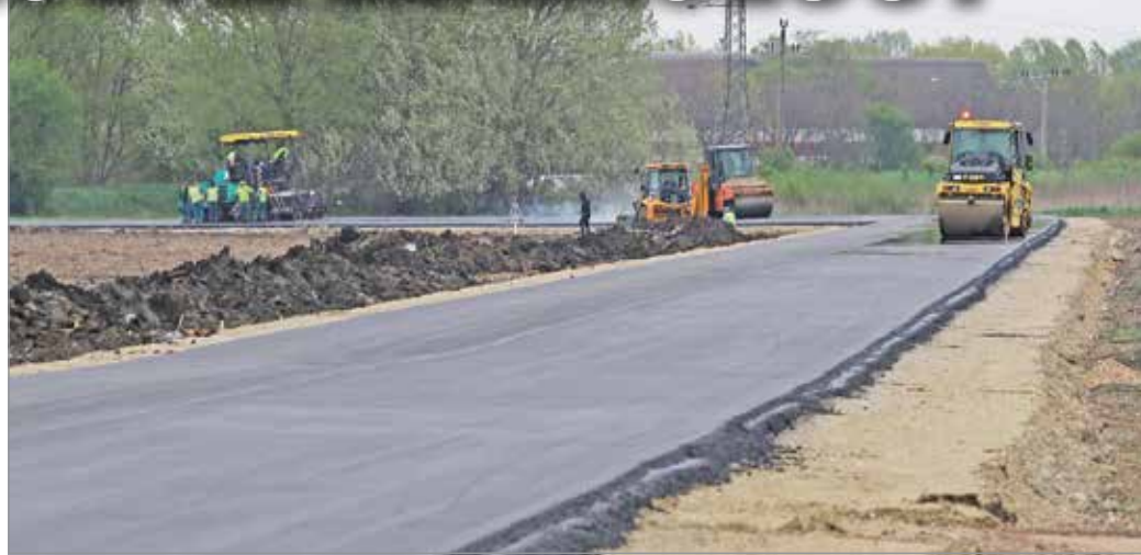
A terelőút jelentősen segíti majd elviselni a forgalom miatti közlekedési nehézségeket.

– Sikerült meggyőzni az Y-híd építését beruházó Nemzeti Infrastruktúra Fejlesztő Zrt. képviselőit és a kormányzati illetékeseket, hogy a martinkertvárosiaknak és a miskolciaknak is szüksége van erre az elkerülőútra – idézte fel a pénteki sajtótájékoztatón a Velünk a Város frakcióvezető-helyettese, a DK önkormányzati képviselő-