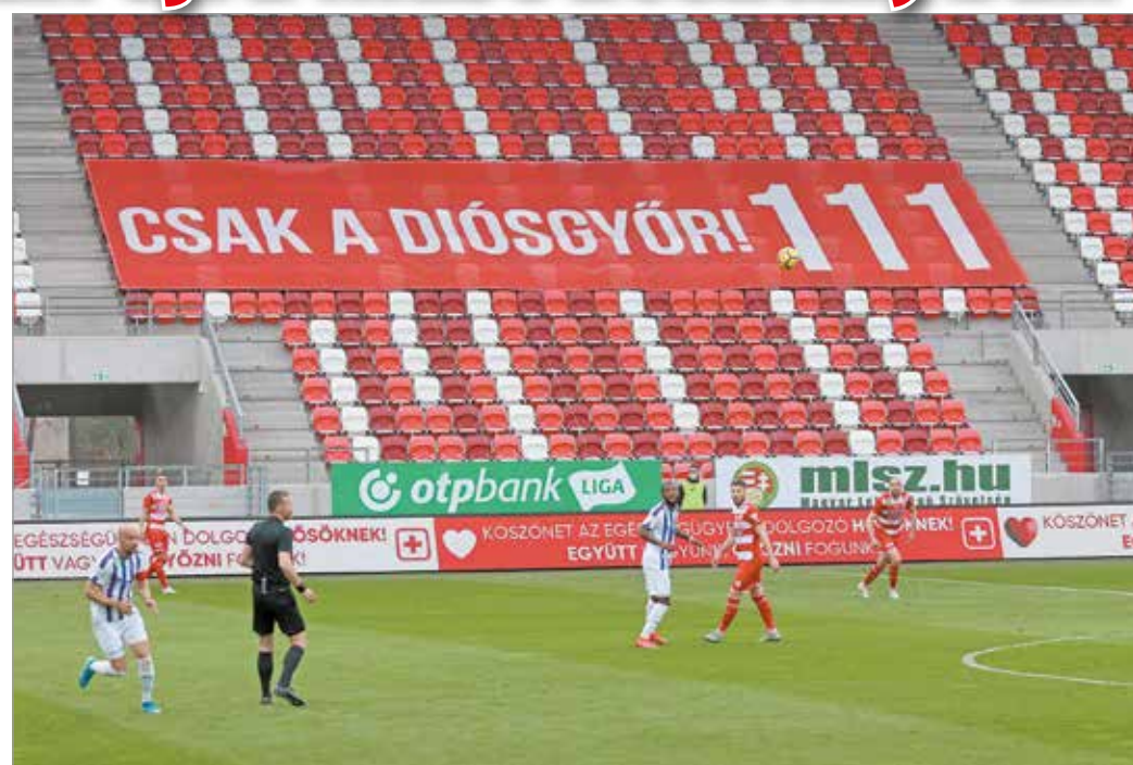
Az NB II-ben is: csak a Diósgyőr!