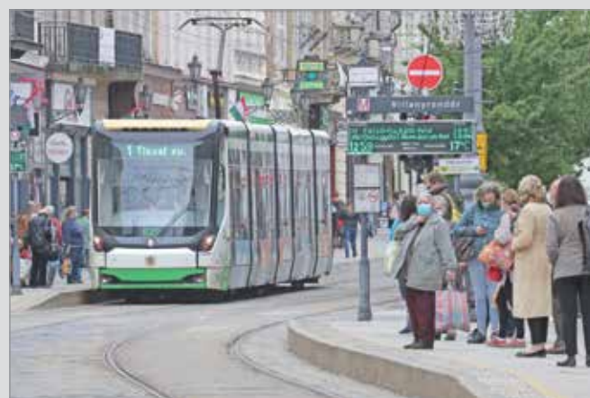
Májusban több alkalommal vágányzár lesz a villamosvonalon.

Az MVK a hétről hétre alakuló járványhelyzet, az iskolába és munkába járás révén felmerülő utazási igények, a tapasztalatok folyamatos bővülése alapján év eleje óta többször is változtatta a menetrendjét. Márciusban, a szigorú lezárások – digitális oktatás, home office, boltzár – miatt egy rendkívüli menetrendet léptettek életbe, a járványügyi szabályokra azonban azóta is figyeltek: amennyiben a járatokon az ötven százalékos meghaladja a kihasználtság, rászigorítja a