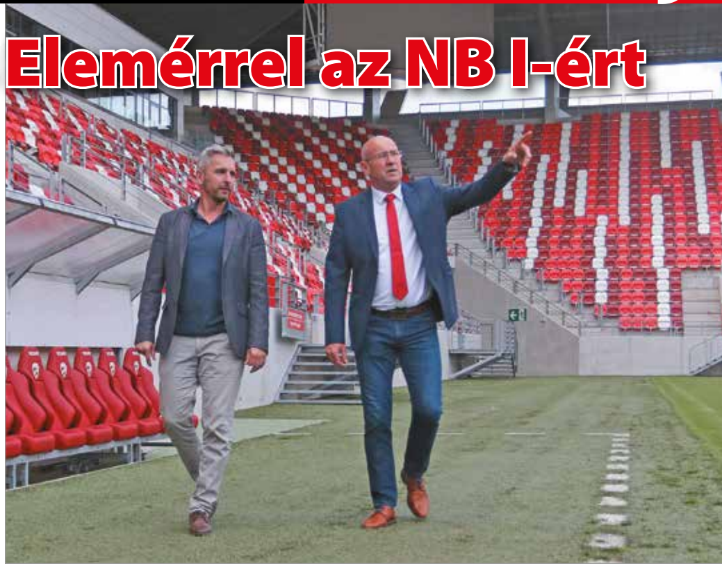
Az új vezetőedző győztes mentalitását játékosokat akar látni.

– Nagyon örülök a megkeresésnek. Egyszer már volt tapogatózás a klub részéről, akkor nem jött össze a fúzió. Ugyanakkor nagyon sajnálom, hogy a