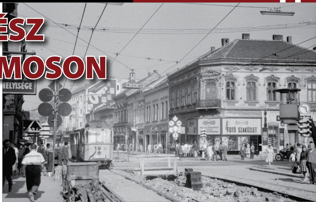
A régi villamossínek bontása és újakra cserélése a Villanyrendőrnél.

A naptár 1967-et írt, amikor egy kora tavaszi napon megkezdődött a miskolci főutcán a régi villamossínek bontása és újakra cserélése. Bihary Bélát már reggeltől nem hagyta nyugodni