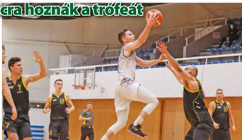
Négyes döntőben a miskolci férfi kosarasok.