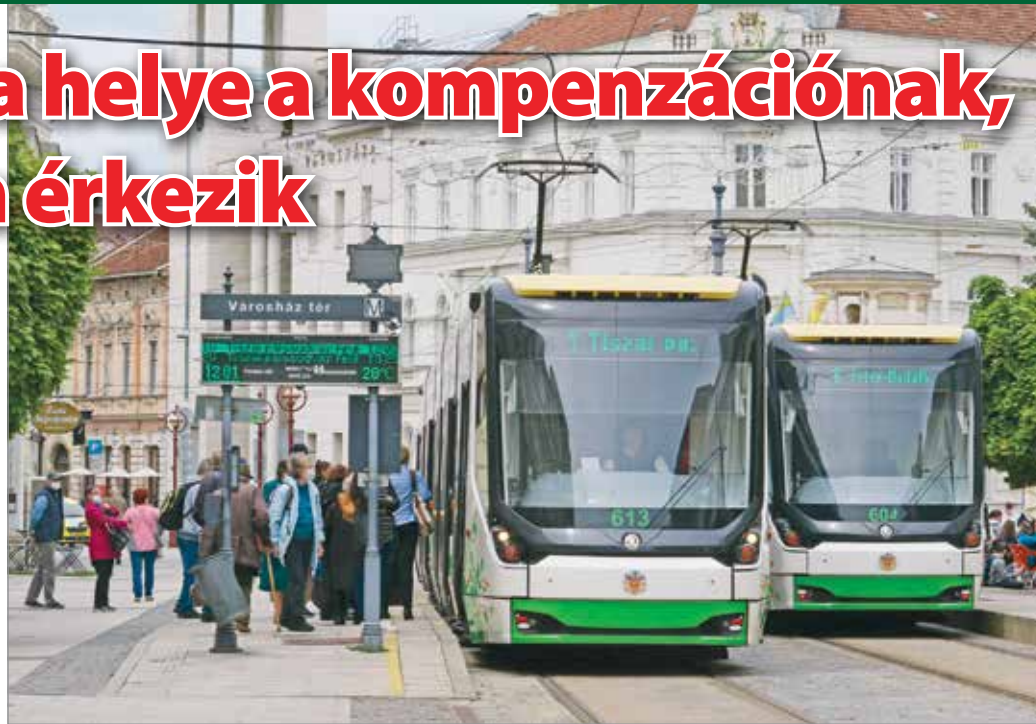
A városvezetés a közösségi közlekedést támogatná meg egy jelentős összeggel.

A főosztályvezető felelevenítette: tavaly csak a gépjárműadó elvonásából 450 millió forinttal volt kevesebb a városi büdzsé bevétele. Az idegenforgalmi-