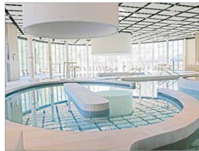
Már csak a vendégeket várja az Ellipszum.