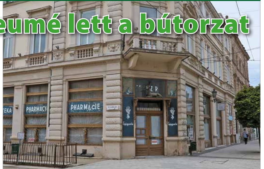
Az Aranyaszarvas Gyógyszertár egyike a város legrégebbi patikáinak.

Az Aranyaszarvas Gyógyszertár egyike a város legrégebbi patikájának. Kezdetben a Kossuth utca 7. szám alatt működött, a mai helyére, az Erzsébet téri sarokházba 1897-ben költözött. Komolyabb felújítása 1980-ban volt, amikor restaurálták az 1990-