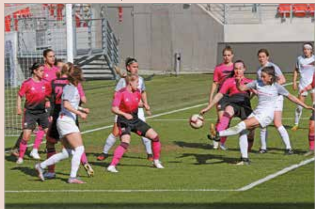
Nem adták fel, dobogós helyért küzdenek.

– Ma egy olyan csapat lépett pályára, amelyik az elmúlt öt évben sok örömet szerzett. Láttam a lányokon