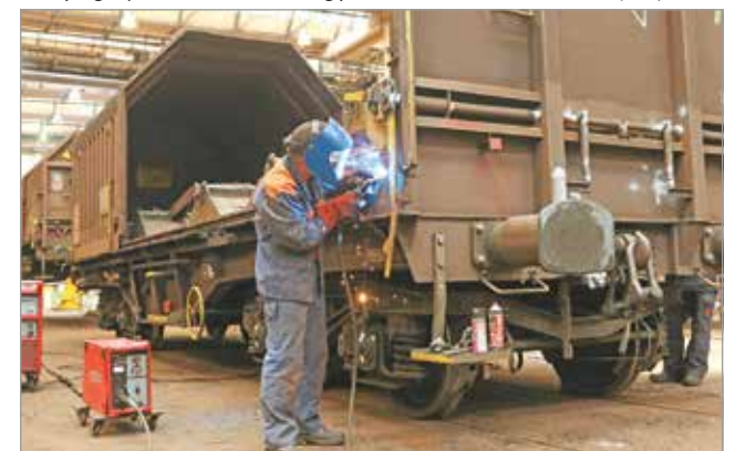
A miskolci járműjavító munkájának csaknem a felét a Rail Cargo Hungária adja.