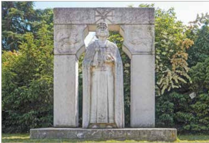
A Szent István-szobrot is az ő keze és képzelete formázta

Végül a Gábor Áron Szakközépiskolába került, ami koráb-