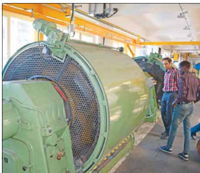
Külföldről érkezett kollégák ismerkednek a FUX-nál folyó munkával

„Az utánpótlásképzésbe, az oktatásba energiát kell fektetni, ami a napi termelési feladatok mellett természetesen többletként jelentkezik kollégáink számára is, azonban sok előnye van ennek a tevékenységnek. A duális képzésben résztvevő mérnökhallgatók például megismerhetik az adott szakterületet, a vállalatnál folyó munkát, képet kapnak a termelési folyamatokról, és ha megtetszik nekik a munka, és mi is elégedettek vagyunk a teljesítményükkel, akkor komoly esély van arra, hogy új kollégaként üdvözölhetjük őket” – kezdte az okok boncolgatását a vezérigazgató. Hozzátette: ez talán