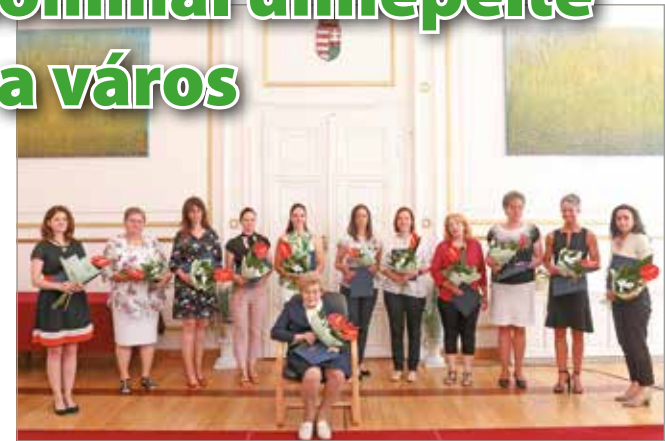
Ünnepi keretek között köszöntötték a védőnőket.