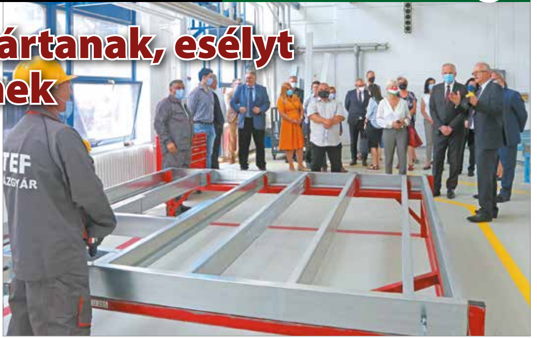
Komfortos lakóházakat gyártanak hátrányos helyzetű családoknak.

– A szociális rászorulókról való gondoskodás az önkormányzat számára kiemelt fon-