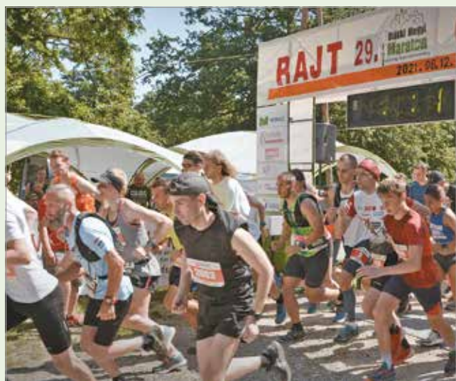
Mintegy négyszázan álltak rajthoz.

Az eredményeket a minap. hu-n közzöltük.