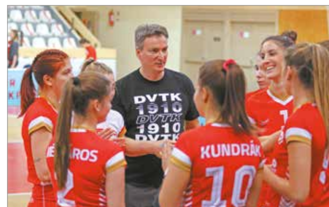
A nulláról építette fel a csapatot.

A DVTK Jegesmedvék Jégkorong Akadémia első között szerezte meg az államilag elismert és támogatott státuszt. – A miskolci jégkorong történetében egy nagyon fontos lépcsőfokhoz érkezünk – mondta a klub honlapjának