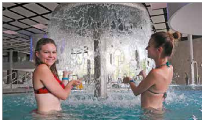
Számos vízi attrakció szolgálja a fürdőzők kényelmét.