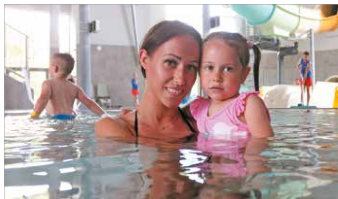
A gyermekeknek saját játszótér is készült.