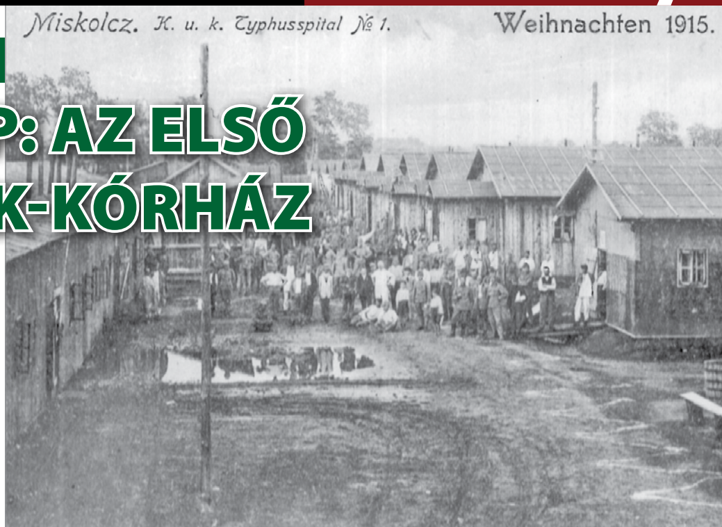
Korabeli német nyelvű képeslap a barakk-kórház épületeiről