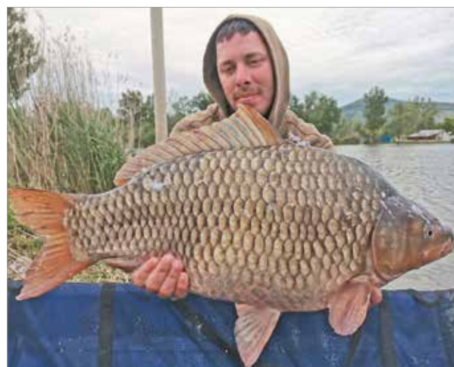
Fotó után visszakerült a tóba a hatalmas hibrid

- Többen mondták, az sem kizárt, hogy ez egy világrekord hal. Igazából fogalmam sincsen erről, hiszen még nem kaptam erre hivatalos választ, azt sem tudom egyelőre, hogy létezik-e olyan lista, ami a ponty-kárász hibrideket állítja sorba. Persze nagyon örülnék neki, ha bekerülne a horgásztörténelembe ez a fogás - mondta lapunknak a szerencsés horgász.