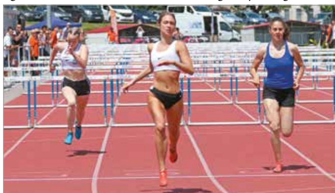
Miskolc adott otthont az ob-nak.