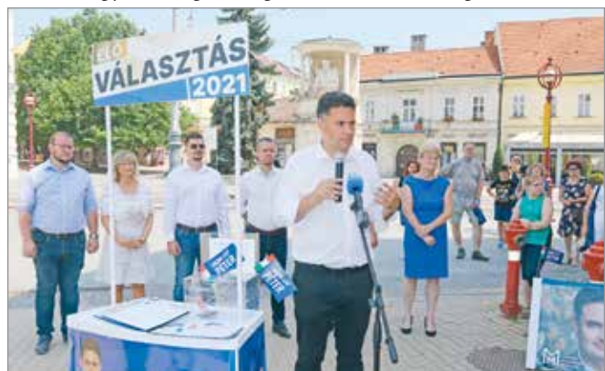
Márki-Zay Péter bemutatta a Mindenki Magyarországa Mozgalom által támogatott jelölteket.