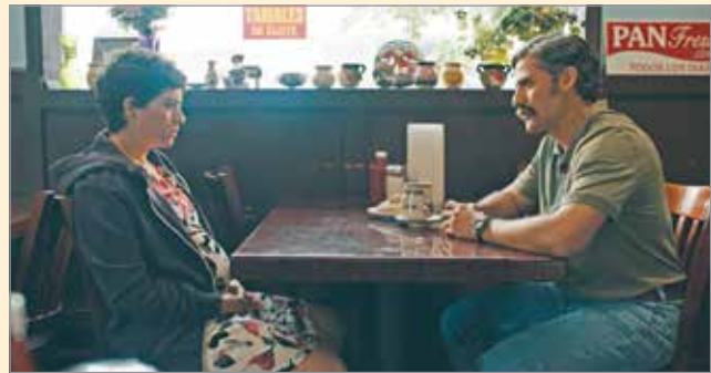
A versenyprogramba a 2021-es Oscar-jelölt Börtönlevelek is bekerült

A fesztivált szeptember 10-18. között rendezik meg. A CineFest programjainak további részleteiről, újabb információkról a www.cinefest.hu-n, illetve a fesztivál Facebook-oldalán tájékozódhatnak.