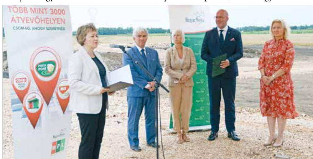
A már épülő létesítmény alapkövét hétfő délelőtt rakták le.

A miskolci logisztikai depó bruttó alapterülete 4747 négyzetméter lesz, mely magában foglalja az üzemcsarnokot, az irodákat és a szociális helyiségeket, emellett további 12 100 négyzetméter kiterjedésű lesz a külső burkolt területet. Az üzem a postai elvárásoknak megfelelően épül fel: két oldalán hét dokkoló és nyolc szint-beli ipari, valamint extra kaput helyeznek el, melyek segítik majd a kézbesítő járművek, illetve a kamionok kezelését, a csomagok rakodását. Az épület kialakítása a modern logisztikai követelményeknek megfelelő lesz, ideális munkakörülményeket biztosítva ezzel az ott dolgozó mintegy kétszáz munkatársnak. Tajthy Ákos