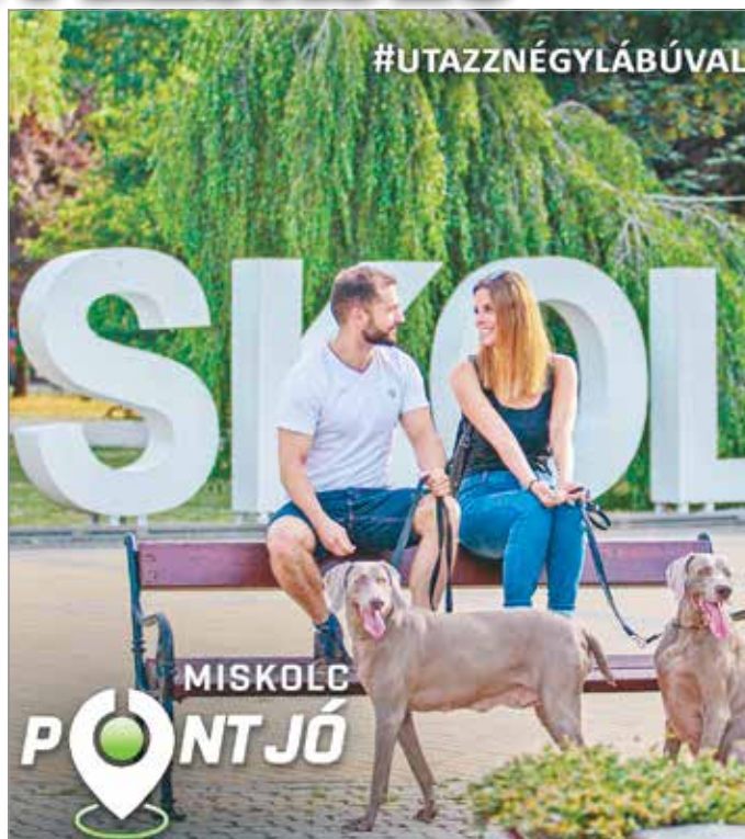
Külön invitáló készült a kutyájukkal együtt utazóknak

A tavalyi évhez hasonlóan az idei turisztikai főszezon is a pandémia árnyékában zajlik. Emiatt különösen felértékelődnek azok a desztinációk, ahol számos, szabadterén elérhető programkínálat is várja a turistákat, akár több generáció együttes kikapcsolódására is lehetőség van. Miskolc remek választás ebből a szempontból, mivel rendkívül sokszínű város, minden korosztálynak tartogat élményeket. Erre hívja fel a figyelmet a város Miskolc pont jó! nevet viselő nyári turisztikai kampánya. Mivel idén is nélkülözünk kell a jelentősebb számú külföldi turistát, ezért az online, közösségi felületeken megjelenő kampány a belföldi lakosságot szólítja meg. A rövid, egyszerű, de játékos üzenet egyben Miskolc komplexitását is kifejezi, hiszen a város négy, eltérő hangulatú, más-más élményt kínáló városrészrel rendelkezik. A kultúra és a gaszt-