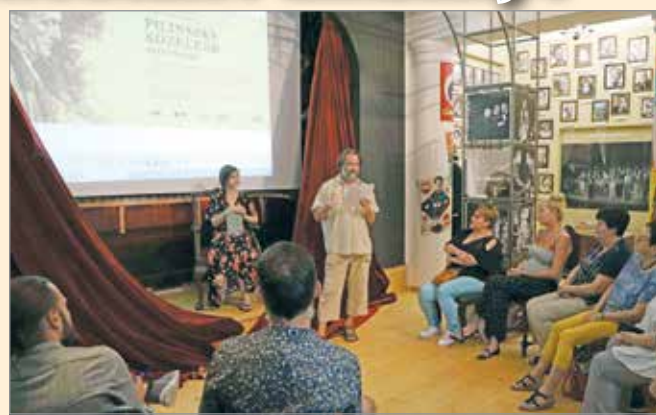
Az előadást a Színészmuzeumban tartották.

A Nap születése, Kalandozás a tükörben, Ének a kőszívű királyról – meséiben a teremtképzületnek mindig is kitüntetett szerepet tulajdonított Pi-