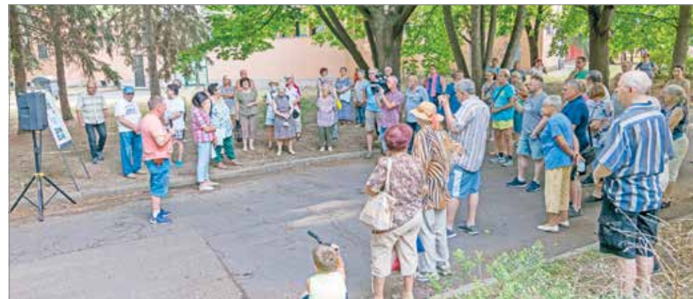
Az épülő egészségház munkálatairól tájékoztatták a városrészben élőket.