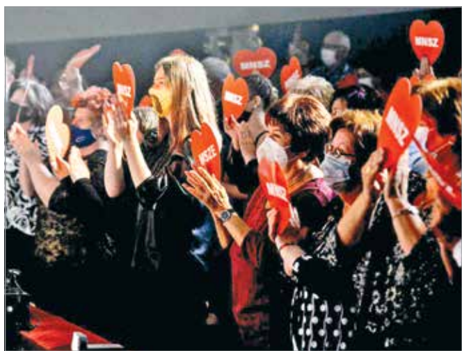
Az egyesület a pandémia utáni első előadásnak, a Deja vu-nek a tapsrendje alatt különleges figyelemmel készült

Mivel épp a járvány Magyarországra való betörésekor alakultak meg, csak