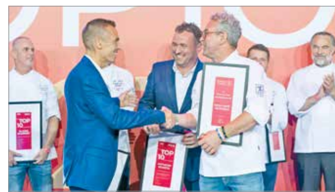
A Pizza, Kávé, Világbéke lett az év alternatív vendéglátóhelye