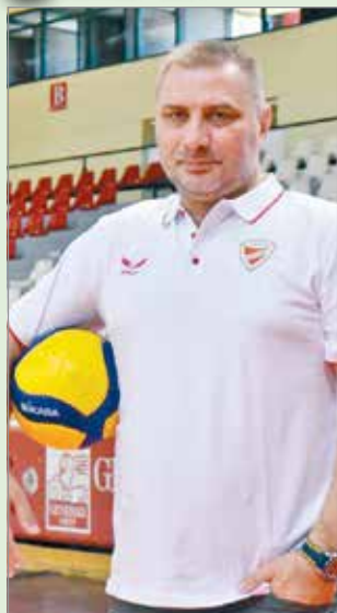
Bízunk a fiatalokban az új vezetőedző.

– Örülök, hogy idekerültem a DVTK-hoz. Hosszabb távra szerettem volna tervezni, így fontos volt, hogy itt lehet nyugodtan építkezni, hiszen 2+1 éves szerződést kötöttünk. 3-4 lányt felhozunk az utánpótlásból, egy-két igazolást tervezünk, valamint a Miskolcon maradókból alkotnánk olyan csapatot, amellyel egy-két éven belül visszajuthatunk az Extraligába. A gyors játékot preferálom egy-két figurával