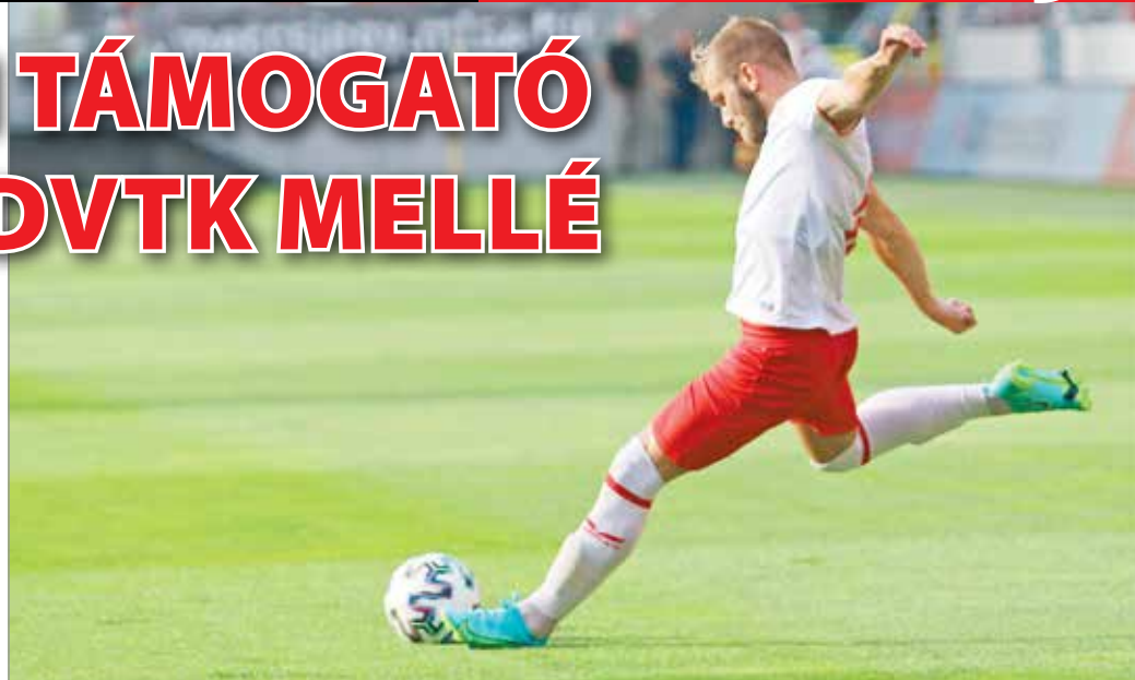
Hamarosan bemutatják az új hazai mezt is.