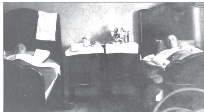
Szovjet katonák pihennek a Palotaszállóban

lentésük szerint ekkor már több épület román és orosz katonák fennhatósága alá került, akik ezen túl is komoly követeléseket támasztottak a város irányába, így hadikórházak kialakítására is. Így lett szovjet hadikórház a Fémipari és a Mezőgazdasági Iskola a Sol-tész Nagy Kálmán utcában, az Erdőigazgatóság épülete a Deák téren, a Pénzügyigazgatóság egy része a Fazekas utcában, a Tóth Pál Leányliceum és Tanítóképző a Palóczy utcán, a mai Herman Ottó Gimnázium épülete, a Kun József elemi és ugyanitt a polgári fiúiskola, a Zenepalota a Bartók téren, a Hunyadi utcai Érseki leánynevelő intézet, a Kálvin utcai izraelita iskola épülete, a Vörös-