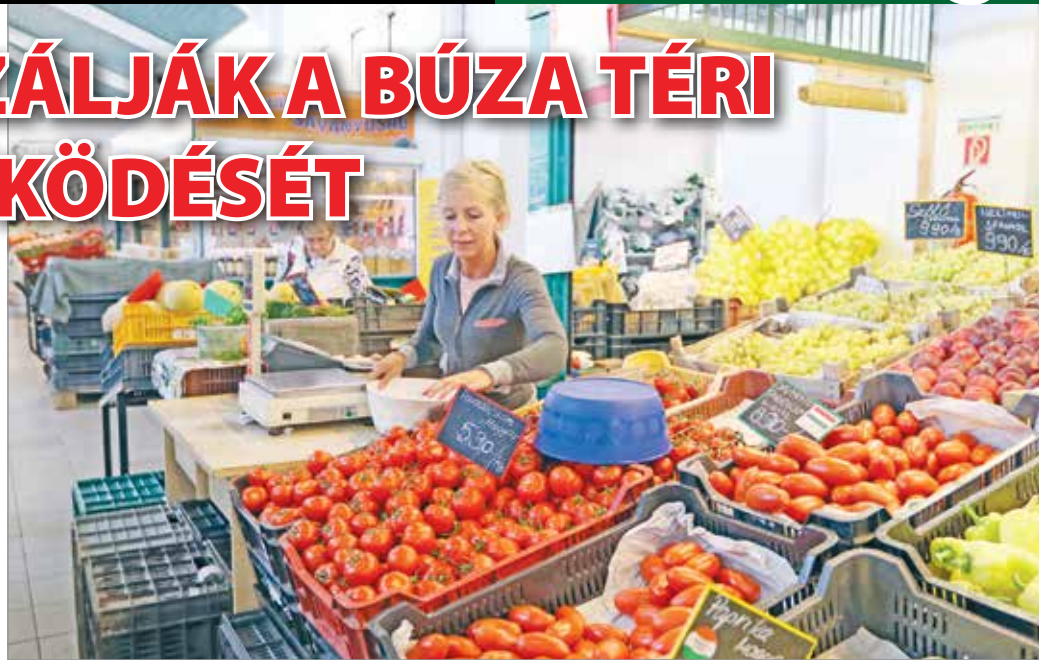
A létesítmény változatlan formában működik tovább.

– Az önkormányzat a 2019-es átadás-átvétel után azzal szem-