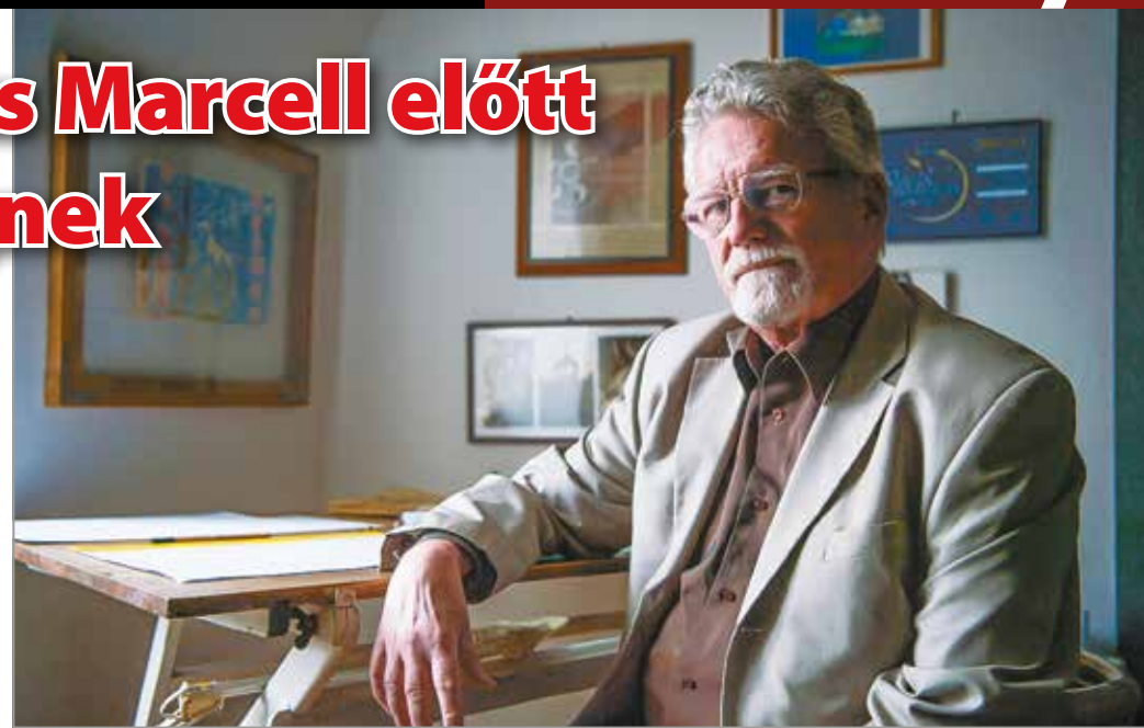
Jankovics Marcell a magyar filmművészet egyik legjelentősebb alkotója

Az Algírban született Tony Gatlif rendező alkotói munkásságát mindenekelőtt a szabadság, az igazságszeretet és a zabolátlanság vezérli. Szenvedélyes filmjeiben az úton levésnek, a gyökerek felkutatásának, a létezés gyönyörűségének titkait kutatja. Pont, mint a CineFest programjában szereplő - a Cannes-i Fesztiválon 2004-ben a legjobb rendezés díjával kitüntetett - Száműzöttekben is. Emlékezetes filmjei - a Gadjo Dilo , a Transylvania , a Szabadság , a Geronimo , az idén Cannes-ban bemutatott Tom Medina és a Latcho Drom - örökre bevésődnek a nézők emlékezetébe, csodálatos képei, dallamai felejthetetlenek. Gatlif Indiától Egyiptomig, Törökországon, Szlovákián, Románián és Magyarországon át Spanyolországig járja végig a roma nép életének színhelyeit, filmjei egy örökké tartó, hatalmas utazás részletei, melyen megtiszteltetés a rendezővel együtt utazni. A CineFest Miskolci Nemzetközi Filmfesztivál idén Életműdíjjal tünteti ki Tony Gatlif rendezőt, aki a fesztivál nyitóünnepségén veszi át az elismerést.