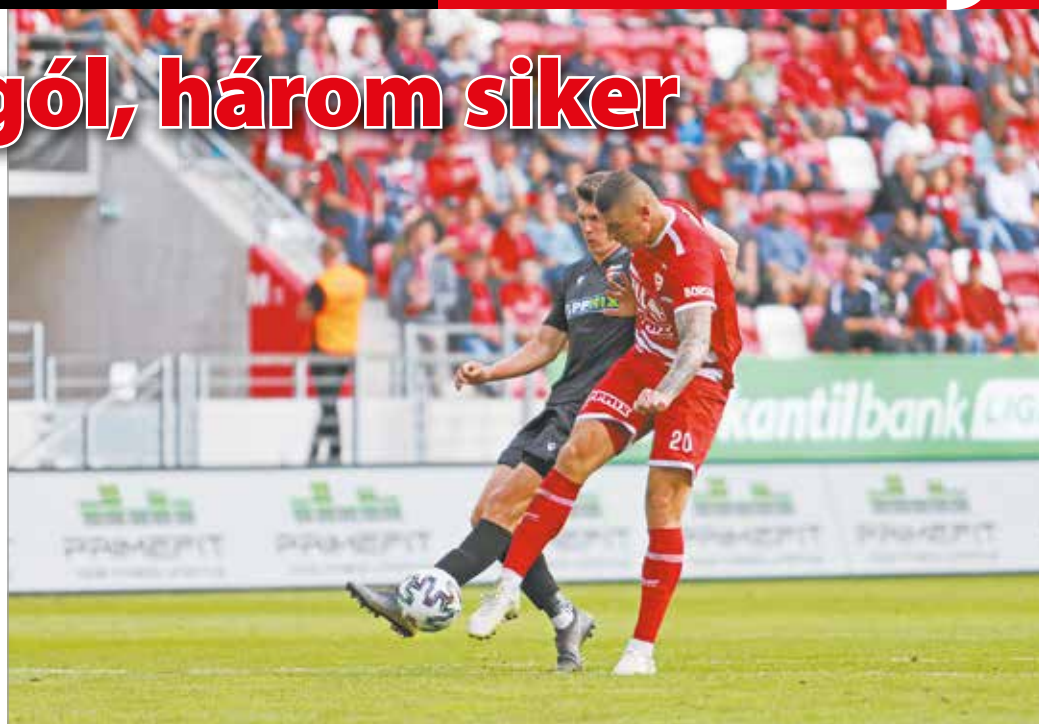
Ezúttal a gólszerzéssel sem volt probléma.

– Az öt védő nem feltétlenül defenzív, szélesebbek voltunk,