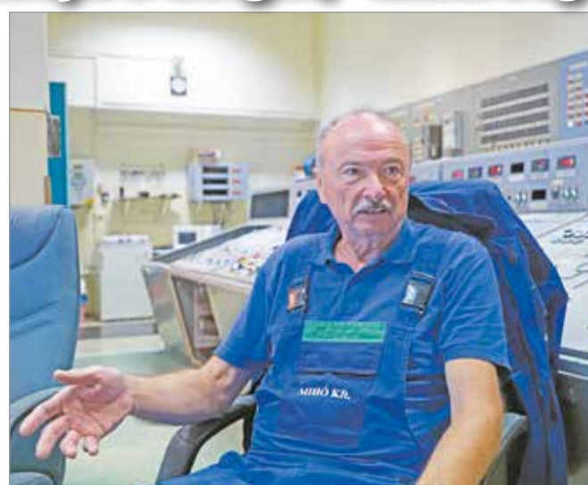
Már gyermekkorában a fejébe vette, hogy „karószereelő” lesz.

Juhász László a 2-es szakcsoportban műszerésznek tanult, mert már gyermekkorában a fejébe vette, hogy „karószereelő” lesz. – Ez a villanyszerelőt jelentette, csak így fogalmaztam meg, mert azt láttam, hogy a szakember az oszlopra mászik fel. Ez tetszett meg benne, de végül én soha nem végeztem ilyen feladatot, és nem is vágytam rá később – mondta. 1976-ban végzett a középiskolában, ezt követően villanyszerelőként, mára pedig elektrikus, távhő-