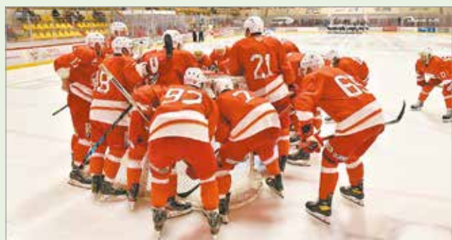
Mindenkit bevetnek majd.

Akik mégis a helyszínen tekintenek meg a Fehérvár elleni mérkőzést, azoknak – a jelenleg hatályos szabályok szerint – rendelkezniük kell védettségi igazolvánnyal, amennyiben el-múltak 18 évesek. Az ennél fiatalabbak – felnőtt kíséretben – védettségi igazolvány nélkül is szurkolhatnak.