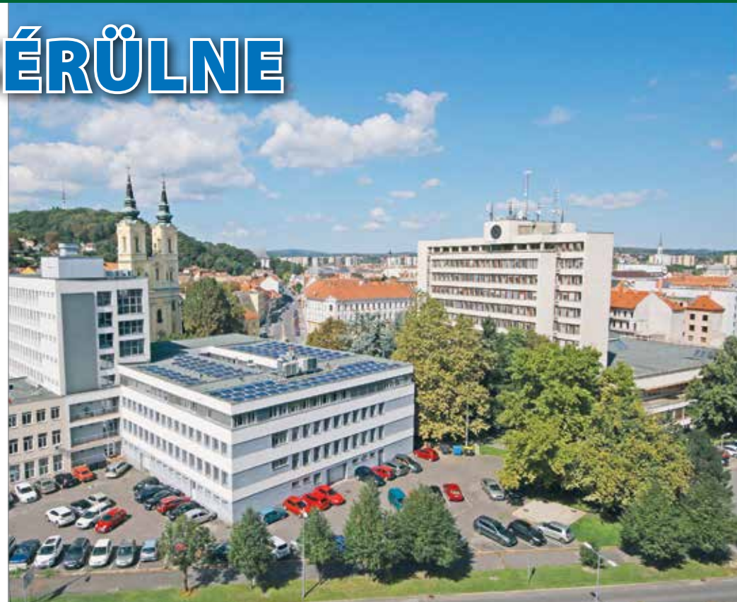
Városterkezeti és várostörténeti okból is érdemesebb lenne a bontás helyett megtartani és felújítani az ITC-székházat.

Az épület helyére tervezett közpark létének jogosságát is megkérdőjelezi az építész.