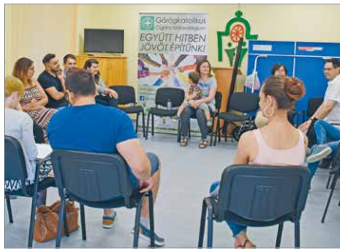
Családi nap a Görögkatolikus Roma Szakkollégiumban