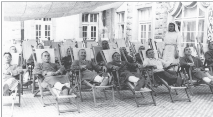
Tuberkulotikus betegek a Palotaszálló teraszán

Aki nyomon követte városunk egészségügyi intézményeinek történetét bemutató sorozatunkat, láthatta, hogy mind a háborúk, illetve az azzal szorosan összefüggő vagy attól függetlenül kialakuló járványos megbetegedések időszakai komoly próbátételek elé állította Miskolc betegellátását. Ennek tökéletes példája volt akár az első világháború idején, részben a városi kórházak tehermentesítésére épült barakk-kórház krónikája, vagy az Erzsébet közkórházból az Avas pincébe menekített betegek izgalmas, de nélkülöző története.