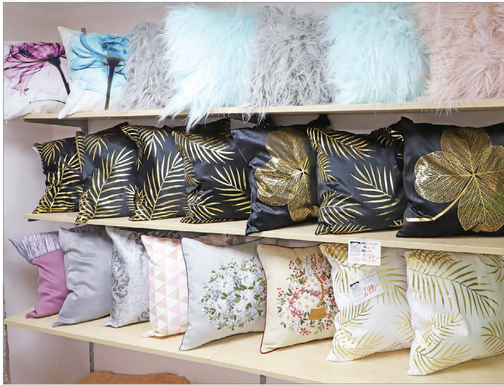
A boltban található lakástextil termékek nagy százalékát saját varrodájukban készítik

A karácsony a kereskedelemben mindig erős, ilyenkor