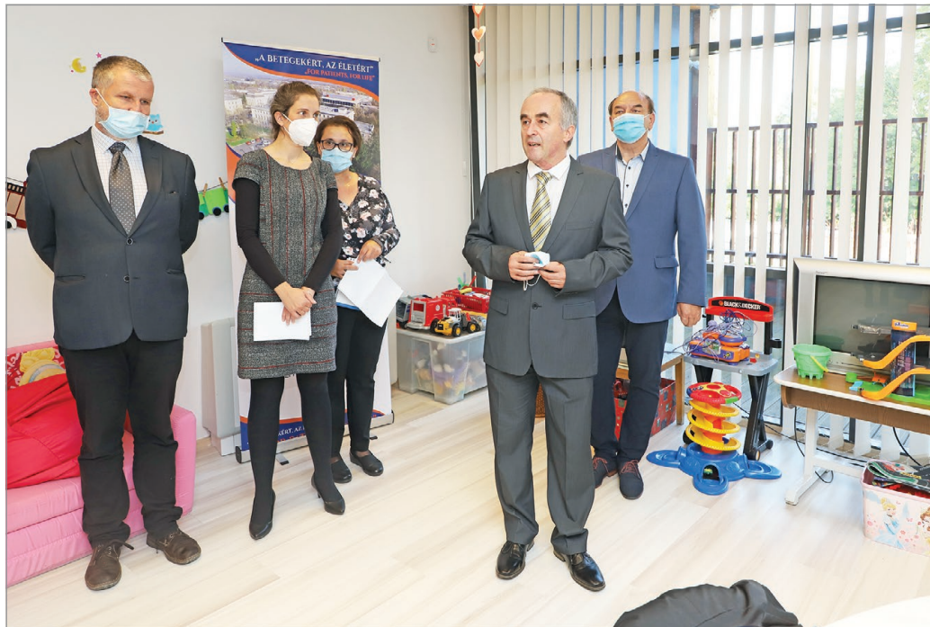
A jövő generációt kívánták segíteni a támogatással.

A gyermekrehabilitációs osztály komfortosabbá tételéhez a Nestlé Hungária Kft. 20 millió forinttal járult hozzá, a kórház pedig ezt ugyanennyivel kiegészítette. Ennek köszönhetően a közel 400 négyzetmétert érintő fejlesztés során szélesebbek lettek a folyosók, így kényelmesebb az épületen belüli közlekedés. Továbbá kicserélték a burkolatokat, a kórtermek részlegesen komfortosabbá váltak – akadálymentesítették őket, és vizesblokkot is kaptak –, létrejött egy gyermekkelülönítő rész, új műanyag- és üvegfalak határolják el a terület egyes részeit, és megújult a teljes villamoshálózat. Breitenbach Sándor műszaki