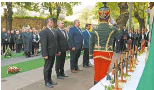
Főhajtás a Batthyány Lajos-emléktáblánál.