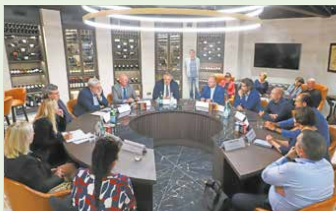
Harmonikus együttműködésre törekednek.

Kifejtette: amikor egy befektető eldönti, hogy valahol