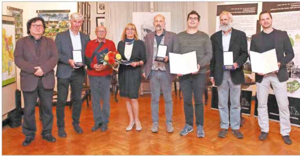
Emelik a megye építészeti kultúráját.

A Szeghalmy Bálint nevével fémjelzett elismerések közül a