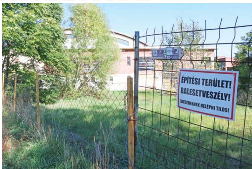
Jelenleg torzóként pusztul a tornacsarnok.