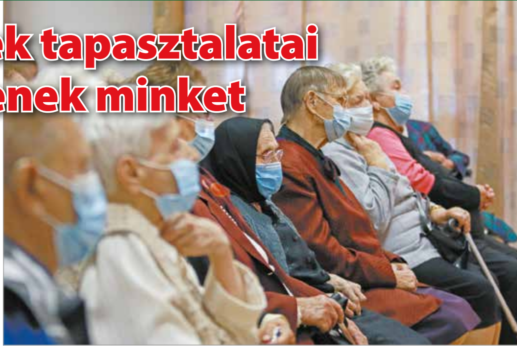
„Tanulunk kell a korábbi generáció tapasztalataiból”.