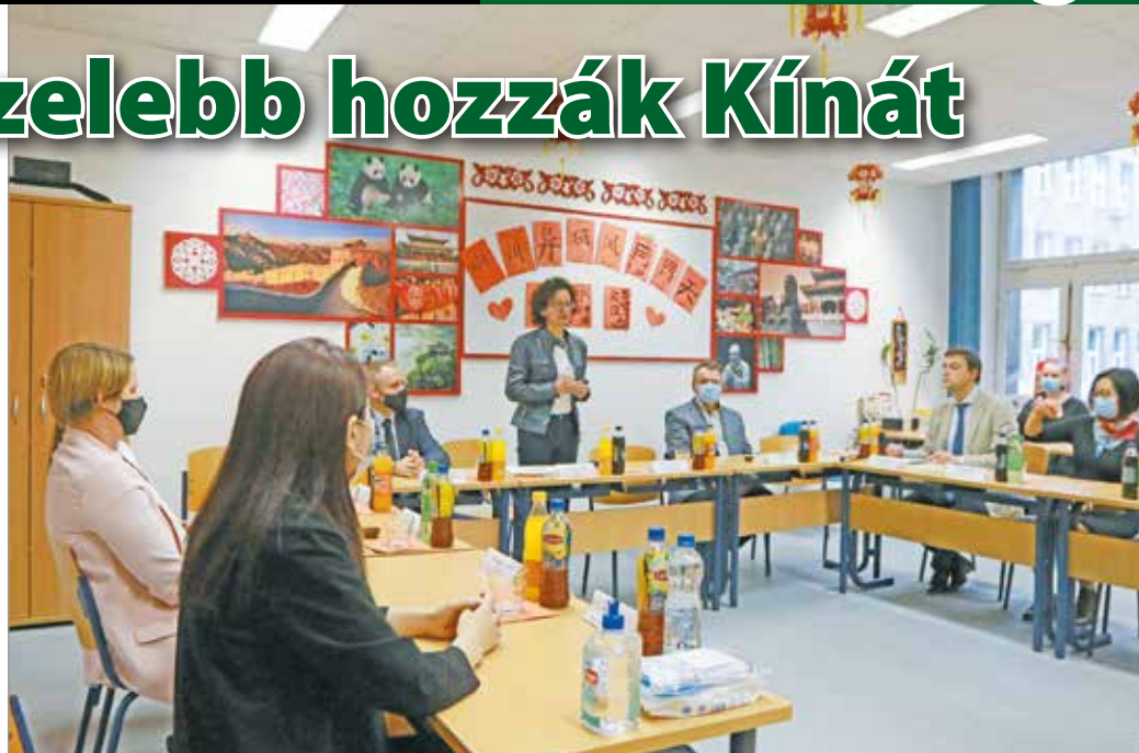
Eddig is számos kutatási és képzési területen működtek együtt.

Az előző tanévben az oktatás fizikális és virtuális infrastruktúrájának kiépítésén és megújításán dolgoztak, melynek eredményeként mind az egyetemen, mind Miskolc középiskoláiban fenn tudták tartani. Alkalmazások előfizetésével (videokonferencia, felhőtárhely), valamint hardverek (okostábla, laptop, tablet, e-toll, fejhallgató, mikrofon) beszerzésével igyekeztek új tanulási élményt adni a különféle kurzusok résztvevőinek.