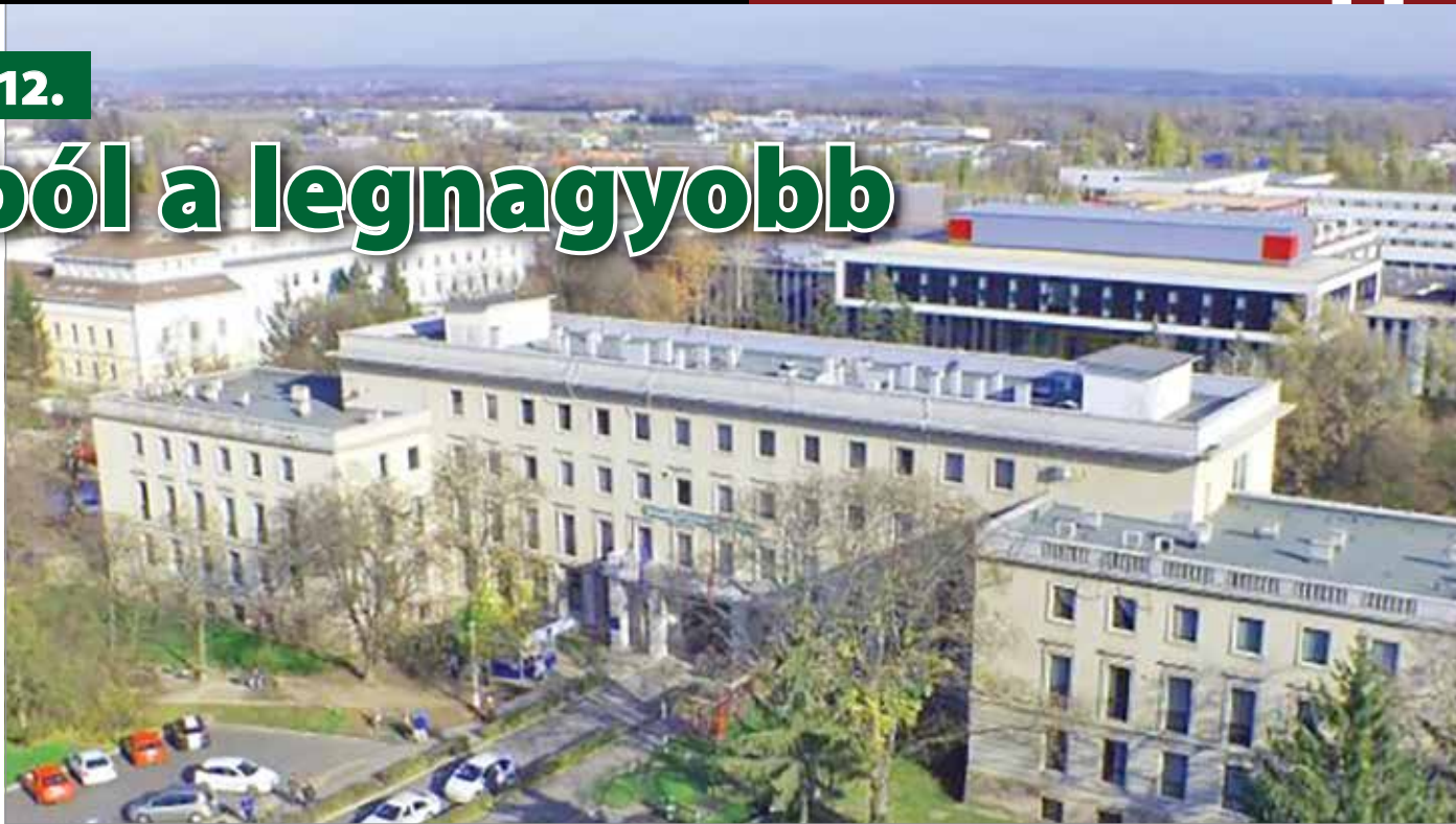
A 2000-es évektől újabb integráció és fejlesztések történtek a kórház életében.

Közben a pénzügyi korlátok ellenére előbb a sebészeti, majd a belgyógyászati épü-