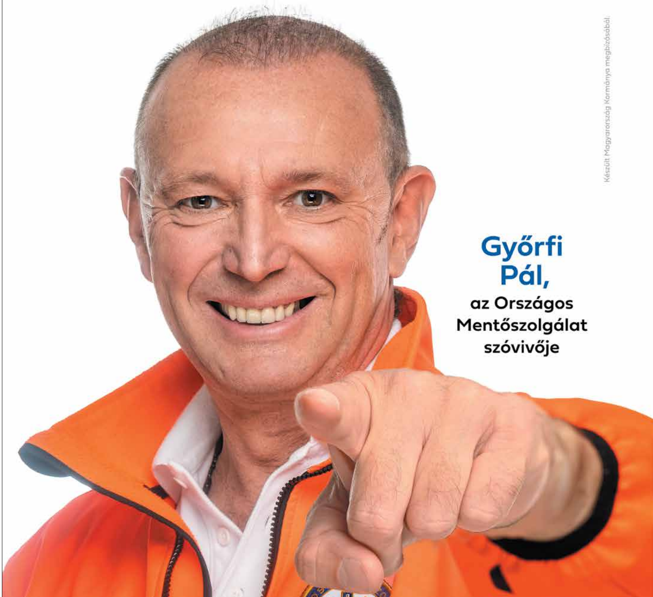
Győrfi Pál, az Országos Mentőszolgálat szóvivője

Készült Magyarország Kormányának megbízásából.