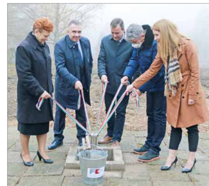
Letették a Szeleta Park alapkövét.