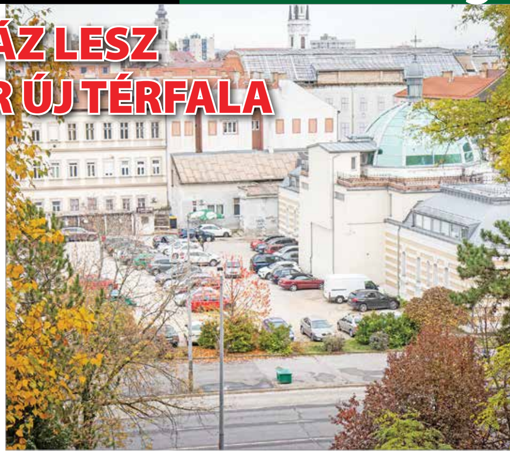
A közönség is megismerheti majd, mi épül a parkoló helyére.

A részletekbe már Szunyogh László főépítész avatott be minket. „Az nem volt kérdés, hogy a terület a város legértékesebb ingatlanjai között van, viszont az egyik legbonyolultabb is, mert igazodni kell a tervezés során a történeti környezethez, az Avashoz, a belváros léptékéhez is. Az Avalon korábban tervezett épülete is rendkívül színvonalas volt, egy dolog hiányzott az épületből: ez a fen-