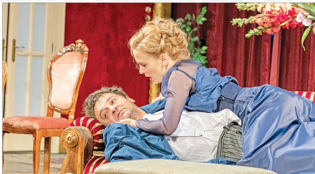
Egy vad szerelem története a darab.

Szomory Dezső darabját most a Mohácsi testvérek teljes átírásában, Mohácsi János rendezésében láthatják a nézők. – A Hermelin egy rettenetesen jó alapanyag, viszont szerintem nem igazán szokták olvasni, pedig fantasztikus nyelvezte van