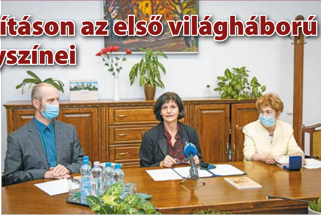
A Tízeshonvéd háziezred miatt Miskolc is érintett a múltidézésben.

A kezdeményezéshez az 51 éve működő Helyőrségi Hagyományőrző Egyesület is csatlakozott. Cél Ferencné elnök elmondta, hogy a katonák emlékét ápolják sírok gondozásával, vagy éppen olyan túsákkal, amelyek során hősi helyszíneket látogatnak meg. Felhívta rá