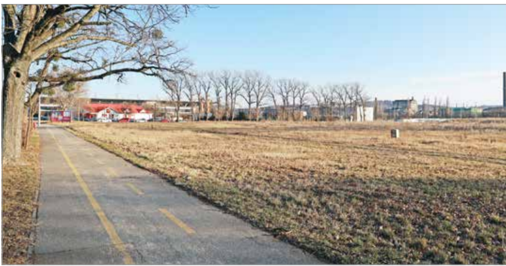
„Miskolc-szerzte, így Bulgárföldön is emberközeli települési alközpontokat akarunk létrehozni.”