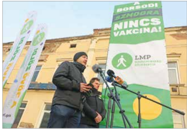
Visszaszorítanák a légszennyezettséget.