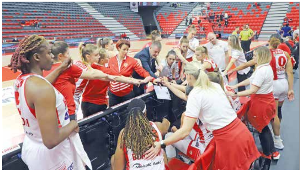
Hazai pályán a kupában a DVTK női kosárlabdacsapata.

KOSÁRLABDA MAGYAR KUPA FEBRUÁR 18., PÉNTEK 13:00: TFSE-MTK-SOPRON BASKET 15:30: NKA UNIVERSITAS PEAC-UNI GYŐR MÉLY-ÚT 18:00: ELTE-BEAC ÚJBUDA-ATOMERŐMŰ KSC SZEKSZÁRD 20:30: LUDOVIKA-FCSM CSATA-DVTK