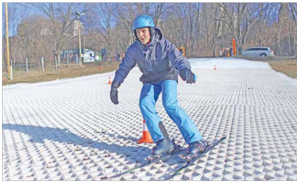
Elsajátíthatják a megfelelő sítechnikat.

– A téli időszakban sajnos kevesebbet mozgunk, ezért indítottuk el a műjégpálya-programunkat. Az Országos Brin-gapark Program mellett pedig meghirdettük az Országos Futópálya-építési Programot, melynek keretében Miskolcon is el fog készülni egy legalább 1 kilométer hosszúságú rekortán borítású futópálya – taglalta Révész Máriausz . Hozzátette: a Sítanpálya-építési Programban Miskolc után a tavalyi évben még Székesfehérváron és a Velencei-tó mellett hoztak létre ilyen létesítményeket.