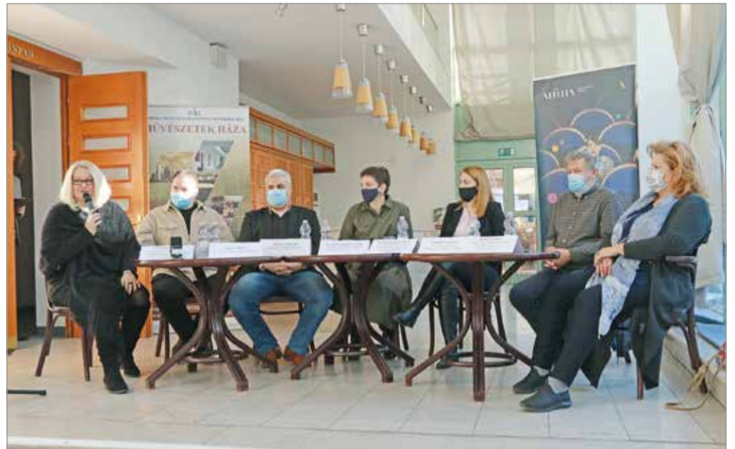
A MÜHÁ tavaszi programjairól tartottak sajtótájékoztatót.

Elmondta még, a közeljövőben zeneorientált, tematikus események helyszínévé változik az egykori kávézó. „A hely alapvető atmoszféráját megtartva, a vendéglátós saját ízlése szerint alakítja ki akár egy dallamos jazzest, akár egy hétköznapi kockélezés exkluzív színterévé. Rendszeres rendezvénye-