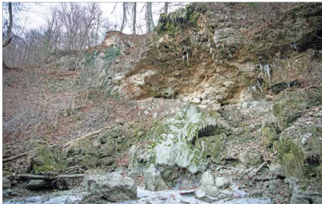
Egyelőre nélkülözünk kell a turisztikai attrakciót.