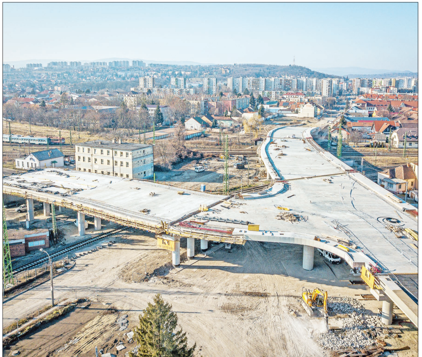
A híd és az odavezető utak kontúrjai is jól kivehetőek már.

A munka az idő javulásával, tavasszal gyorsulhat fel újra, a projekt első két üteme várhatóan októberre készülhet el.