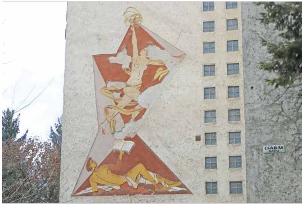
Az Allegória málló állapota ellenére még ma is élvezetes közterületi alkotás.

Szunyogh László városi főépítész Miskolc növekedésének történelmi adalékaival segített még többet megtudnunk az Allegóriáról. A városhatár a 19. század közepéig nagyjából a mai Mindszent tér környékén volt – legalábbis a minket most érintő irányban. Ezt követően épült meg a Népkert, ami a miskolci polgárok kirándulóparkja volt, az oda vezető útvonal pedig tulajdonképpen korzóként funkcionált. Ez az időszak jelentette a Csabai kapu irányába