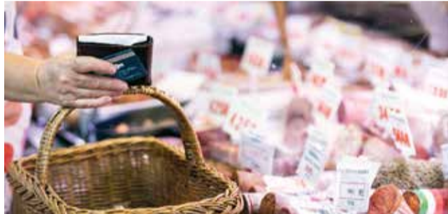
Az intézkedés február 1-jén lép életbe