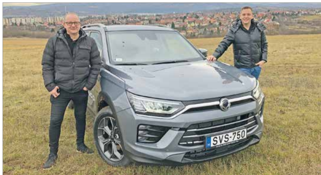
Jó hangulatban nem lesz hiány.

Ahogy eddig, úgy most is lesz nyereségyjáték, ahol tesztvezetést és értékes ajándécsomagot lehet nyerni. Ehhez nem kell mást tenni, mint nézni a műsort, követni a minap.hu Instagram-oldalát, lájkolni a posztot, és helyesen válaszolni az ott elhangzó kérdésre. Öveket becsatolni! Suhanásra fel! MN