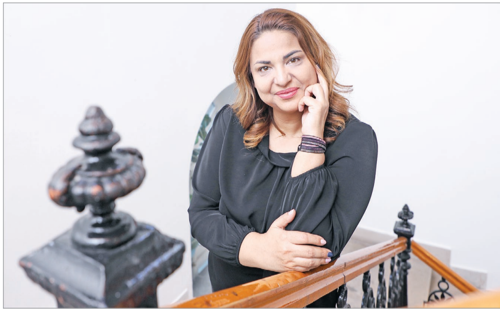
„Azzal, hogy a felsőoktatásban tanítok, nagy álmom valósult meg.”

Az egyéves kihagyás alatt a Karrina Szakképző Iskolába járt ifjúságvédelmi szakra. – Ez már beleszámított a felsőfokú tanulmányokba, amiknek első lépcsőfoka az említett Debreceni Egyetem szociálpedagógiai szakja volt. Itt több olyan kurzust vettem fel, amik a roma kultúrához kapcsolódtak. Ezt a diplomámat kiemelkedő tanulmányi eredménnyel szereztem meg, mint ahogy a többi is. Az alapdiploma után tehát következett mesterképzésben a Szegedi Tudományegyetem kiemelkedő szakja, amit azért választottam, mert nagyon érdekelt a társadalom működése, főleg a társadalmi különbségek okai. 2013-ban lánytestvér között ő a középső.