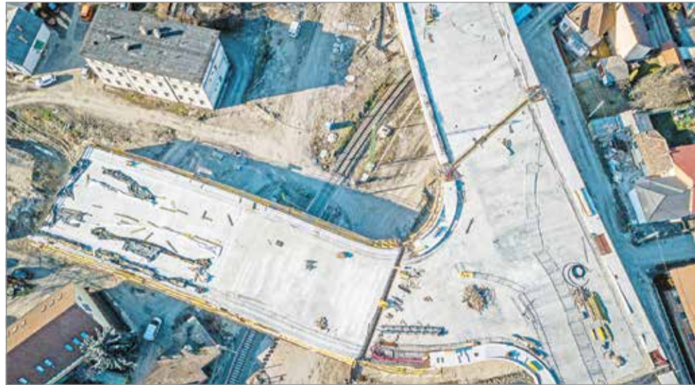
Tavasszal újraindulhat az utépítési munka.

A beruházás első két üteme várhatóan októberre készülhet el, a további ütemek tervezőjének kiválasztására kiírt közbeszerzési eljárás jelenleg folyamatban van.