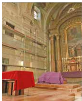
Már a második ütemben járnak.