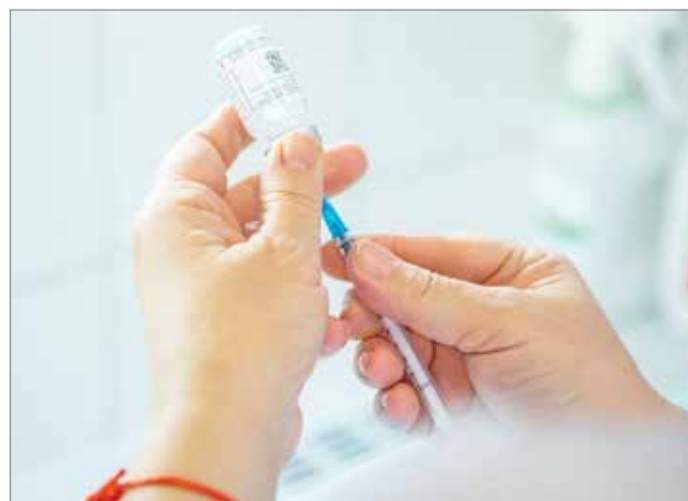
Hamarosan lehet kérni a negyedik oltást.