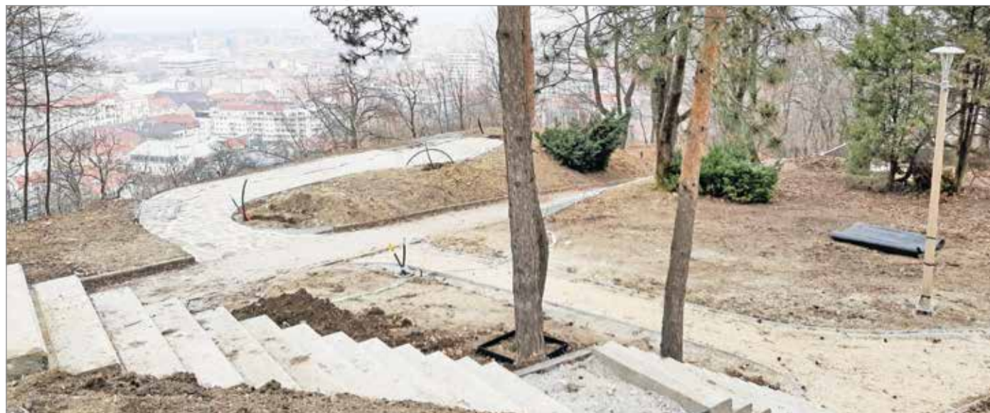
Épül a Horváth-tető – olyan beruházások valósulnak meg, amelyek a miskolciak életét könnyebbé, jobbá és kényelmesebbé teszik

Egy több tízmilliárd forintos fejlesztési forráskeret sorsa fog eldőlni az elkövetkezendő hónapokban Miskolcon.