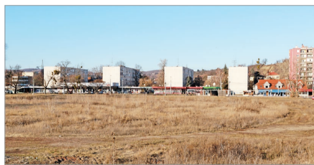
Közös a szándék a fejlesztésre.

Sífelvonó könnyíti meg a feljutást a pálya tetejére, és sötétedést követően pályavilágítás biztosítja a megfelelő látási körülményeket. Az érdeklődőknek szakképzett oktatók segítenek elsajátítani a sportág alapjait – átadták a Miskolci Síiskola sítanpályáját szerda délelőtt a Fényi Gyula Jezsuita Gimnázium udvarán. Az órákon résztvevő tanulók számára a Miskolci Síiskola ingyenesen biztosítja a legmodernebb felszereléseket. Cikk a 9. oldalon