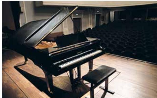
Az országban csak két ilyen példány van.