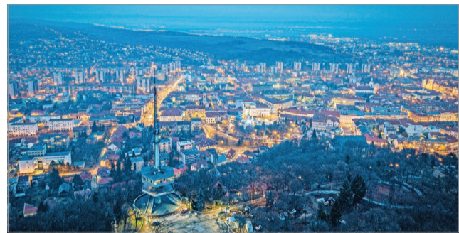
Nehéz helyzetben az önkormányzatok.