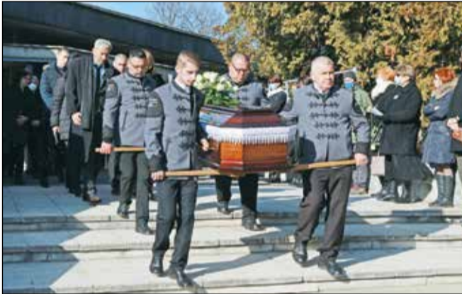
Örökre hazatért szeretett városába.

– Idén lesz harminc éve, hogy a bölcsészettudományok oktatása megjelent a Miskolci Egyetemen. Kimondhatatlanul fáj, hogy ezt már nem fogjuk együtt ünnepelni, pedig nagyon készült rá. Halála pótolhatatlan veszteség minden egyetemi polgárnak.