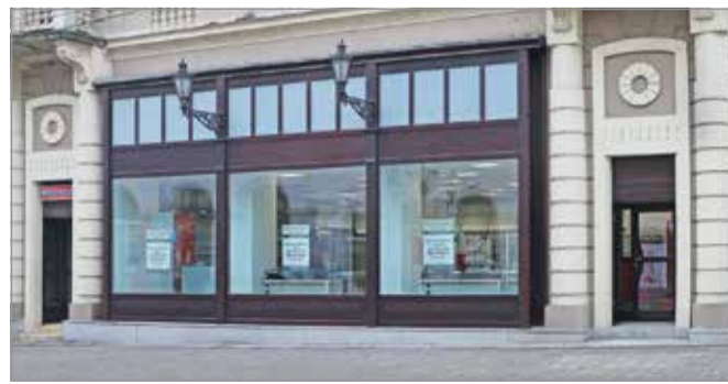
Az üzlethelyiség teljesen átalakult.