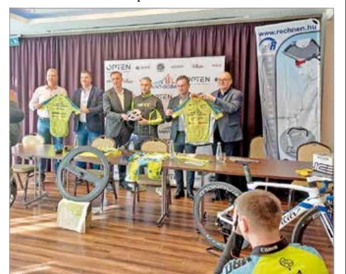
Harminc csapataggal harminc versenyen indulnak.