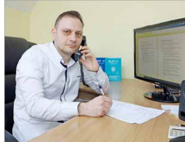
„Engem is napi szinten keresnek a munkavállalók”.

Számos sorsot ismerek. Örömmel tölt el és pozitív visszaigazolás számomra, hogy még a régi dolgozók is gyakran visszajárnak hozzám tanácsért – mondta. R. O.