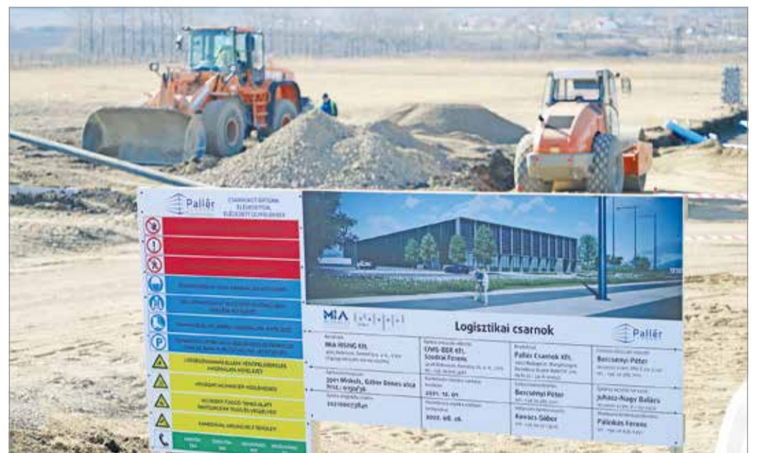
Hosszú távú együttműködés kezdődött meg a cég, az egyetem és a város között.

– Emellett így, hogy már fizikailag is megkezdődik a beruházás, be tudjuk tenni ezt a csarnokot portfóliónkba, melyet azoknak az érdeklődőknek, befektetőknek szoktunk kiajánlani, akik ehhez hasonló, már konkrét, meglévő csarnokot keresnek hosszú távú bérlet céljából – tette hozzá.