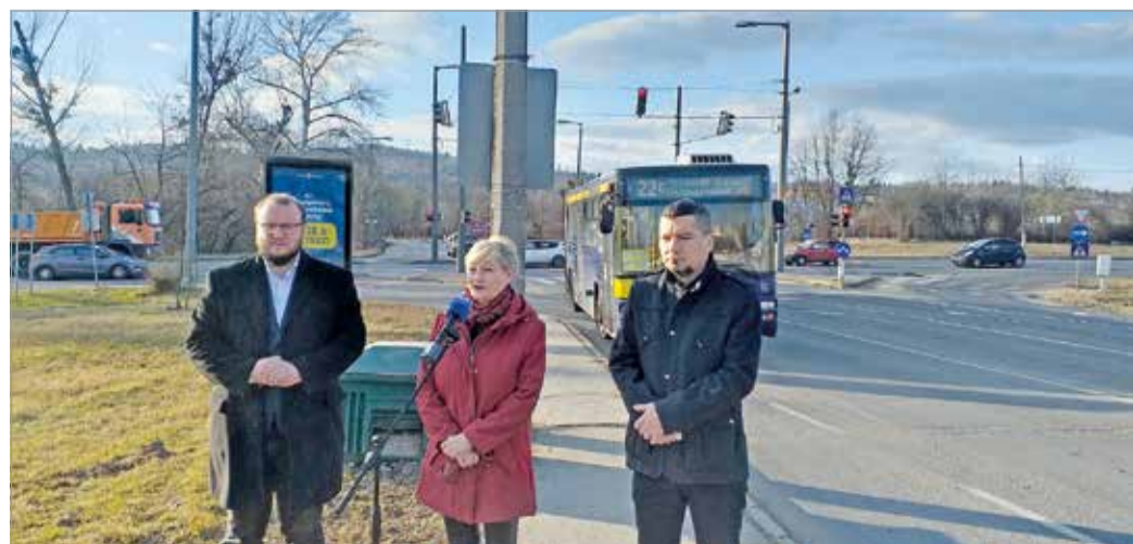
Megoldanák a keresztveződés hosszú évek óta húzóódo problémáját.