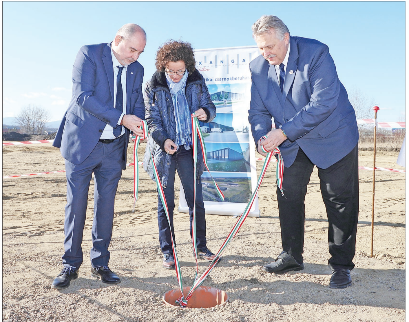
Az első ütemben egy hatezer négyzetméteres logisztikai csarnokot építenek.

Letették az alapkövet kedden annak a logisztikai inkubátorháznak, amelyet a Xanga cégcsoport épít több mint tízmilliárd forintból a Miskolc Déli Tudományos és Technológiai Parkban.