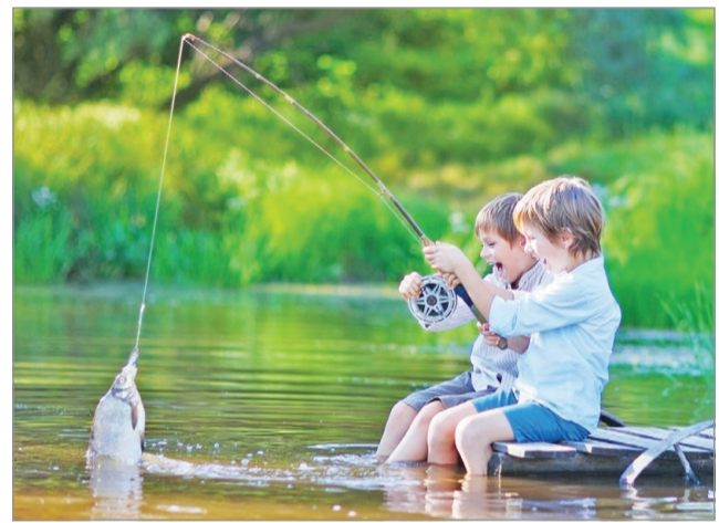
Bár egyre drágább a horgászat, de még mindig jó szórakozás

Továbbra is kötelező az állami vizsgabizonyítvány megléte – 2019-től ingyenes, 2021-től pedig digitális formában történik a vizsgáztatás. Kell a horgász regisztráció és a Magyar Horgászkártya, valamint az egységes állami horgászmánymű (EAH). A tétel legnagyobb részét az egyesületi tagdíj jelenti, ami egyesületenként változó, de minimum 2 ezer forint. B. M.