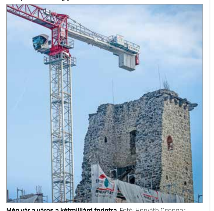
Még vár a város a kétmilliárd forintra.