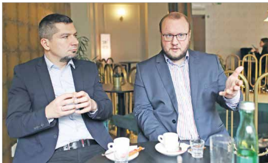
2010 után elkezdtek szűkülni a megyeszékhelyek bevételi lehetőségei.

– Sorolhatnám még, a vége az, hogy a 3 milliárd forintot is bőven meghaladja a bevételkiesés. És akkor a többletkiadásokról még nem is beszélünk! Az energiaárak emelkedése, az infláció, valamint a minimálbér és a garantált bérminimum emelése összességében újabb bő 3 milliárddal terheli meg a büdzsét. Hogy miből fogjuk kigazdálkodni ezt a több mint 6 milliárd