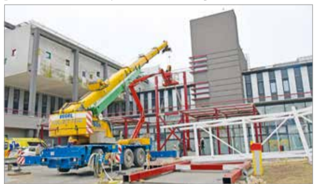
Rövidebb sürgősségi betegutát biztosít a híd

A betegközlekedést biztosító híd a Gyermekegészségügyi Központ és a központi betegellátó épületének első emelete között építik ki, innen közvetlen liftkapcsolattal érhető el az MR- és CT-vizsgálatokat biztosító diagnosztikai egység, a mentőhelikopter betegszállítás. MN