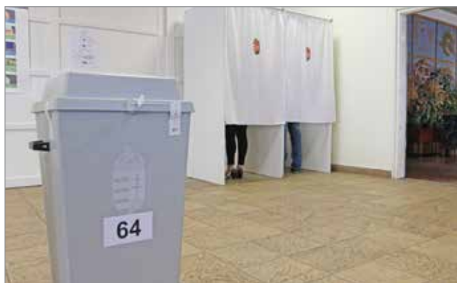
Szavazni április 3-án, vasárnap 6 órától 19 óráig lehet.

Ha valaki mozgásában vagy egészségi állapotában korlátozott, fogyatékossgal él, illetve fogva tartása miatt gátolt, igényelhet mozgóurnát. Ezt a helyi választási irodának kell jelezni postai vagy elektronikus levélben legkésőbb március 30-a 16 óráig; személyesen vagy elektronikus azonosítással legkésőbb április 1-je 16 óráig; elektronikus azonosítással, elektronikus úton legkésőbb április 3-a 12 óráig; a szavazatszámmláló bizottsághoz meghatalmazott vagy