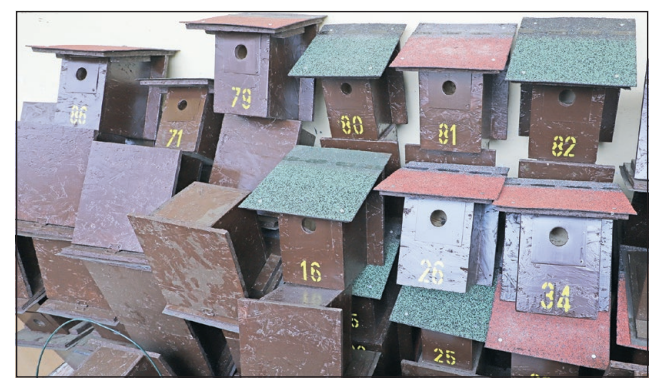
A mesterséges odúk szinte bárhol alkalmazhatóak.