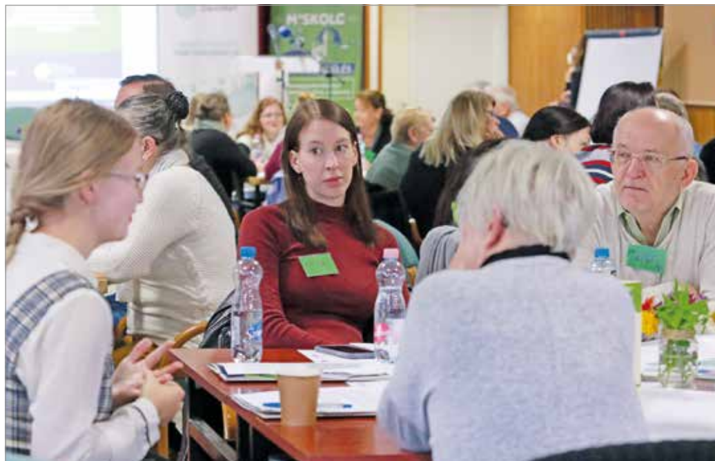
A Dialóg a DemNet Alapítvánnyal és a város önkormányzatával közösen valósította meg tavaly az első miskolci közösségi gyűlést.

Roppant érdekes egyébként maga a fogalom: a társadalmi vállalkozás. A nonprofit szervezetek Magyarországon legnagyobb részt pályázati finanszírozásból tartják fent magukat, esetleg némi adományból, aminek idehaza nincs túl nagy kultúrája. Pár éve kezdett el terjedni egy alternatív önfinszírozási forma, amelynek értelmében olyan bevételszerző tevékenység-