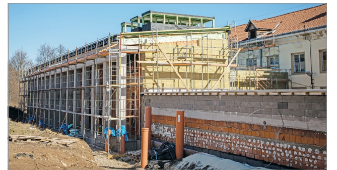
A új kiállítóter kapcsolódik majd a régi épülethez.