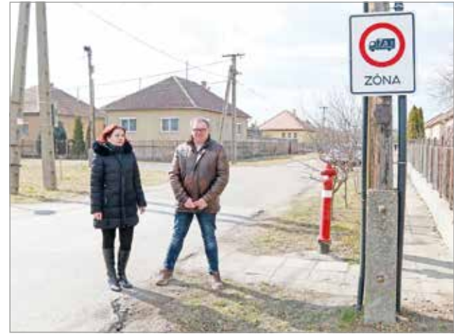
Szükségessé vált a teherforgalom szabályozása.