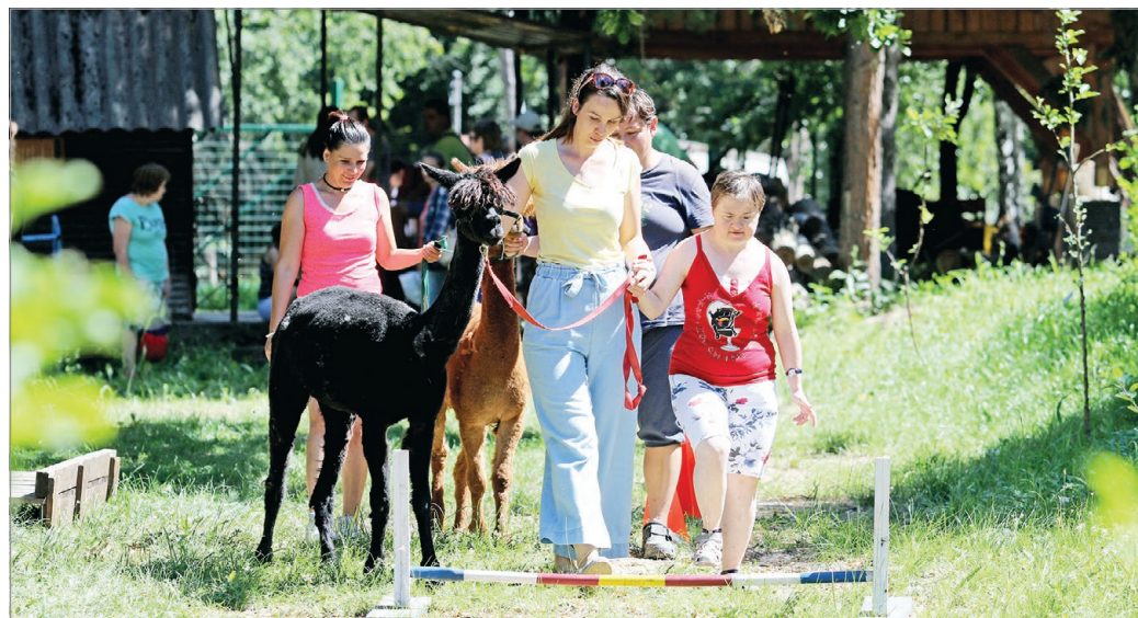
A Szimbiózis Alapítványt a legjobb társadalmi vállalkozás kategóriájában jelölték Civil Díjra.