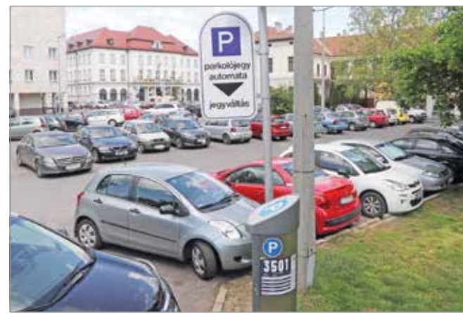
Hétfőn a szombati rend szerint parkolhatunk.

Ennek megfelelően a díjfizetési kötelezettség 8-tól 13 óráig tart az alábbi területeken: Búza tér, görögkatolikus templom északi és keleti oldali parkoló; Búza téri piac nagyparkoló; Zsolcai kapu páratlan oldal az Ady Endre utca kereszteződéstől a Hatvanötösök útja kereszteződésig; a Zsolcai kapu 1. előtti parkoló - Szendrei utca és Zsolcai kapu között található összekötő utca; Szendrei utca; a Szeles utca Huszár utca – Lehel utca közötti szakasza; Hatvanötösök útja Zsolcai kapu –