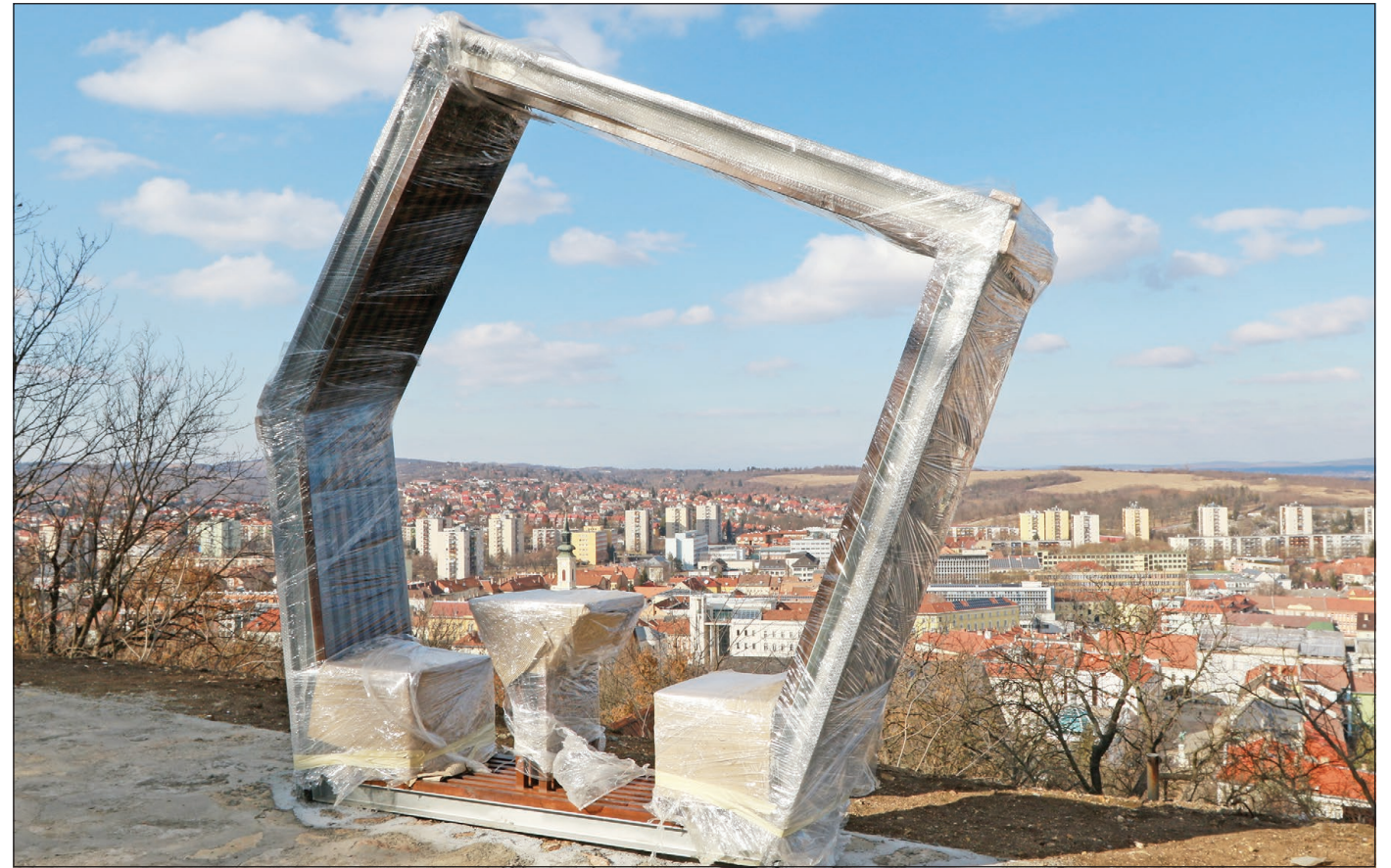
Jó ütemben halad a beruházás a Horváth-tetőn.

A megújuló teraszokat hétfőn bejárás keretén belül tekintették meg városvezetők a városüzemeltetésben dolgozó szakemberekkel.