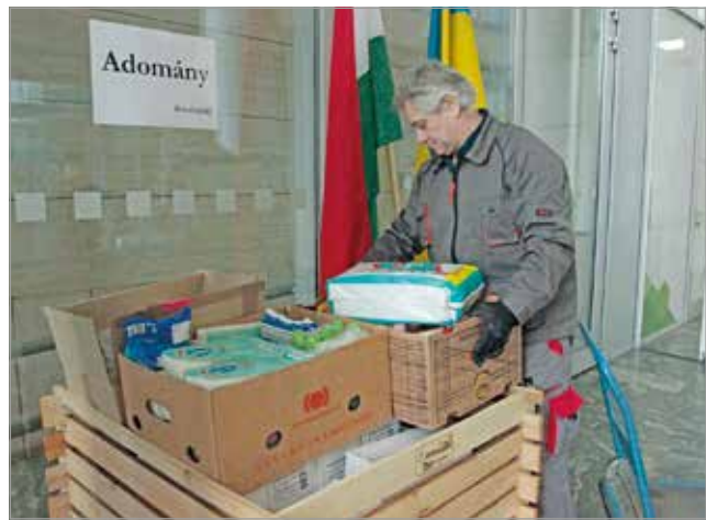
A gyűjtőpontot a városháza mindaddig fenntartja, míg szükséges.