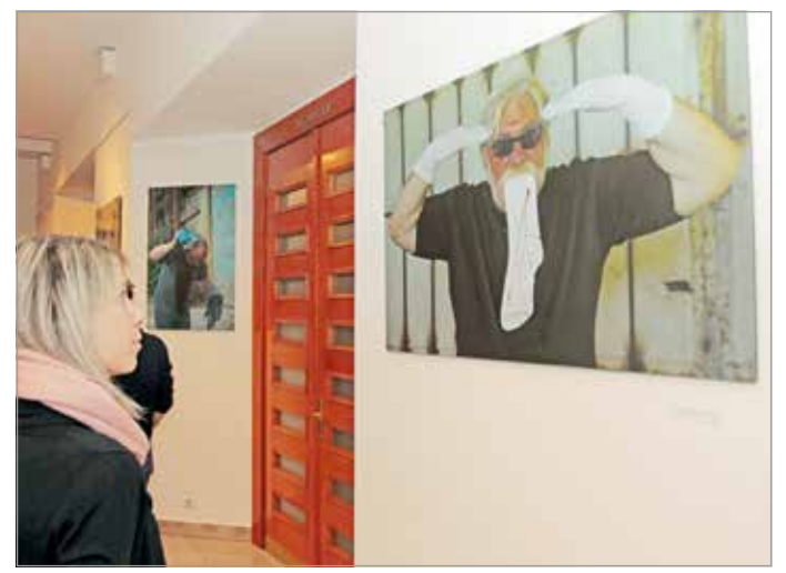
A kiállítás április 10-éig tekinthető meg.

– Rendkívül erős érzelmekeket váltott ki belőlünk a vasgyári környezet, az illusztrációs romok, egy régi, elhagyott,