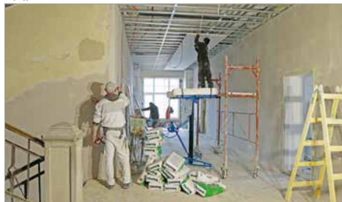
A teljesen megújuló épületet várhatóan májusban adják át.