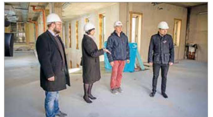
A múzeum új épületében pénteken tartották bejárást.