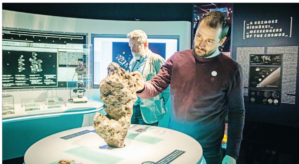
Egy több mint harminckét kilogrammos, földbe csapódott vasmeteoritot is megvizsgálhatunk, sőt meg is tapogathatunk.

Egyedi élményeket nyújtanak az ide fejlesztett VR-eszközök,