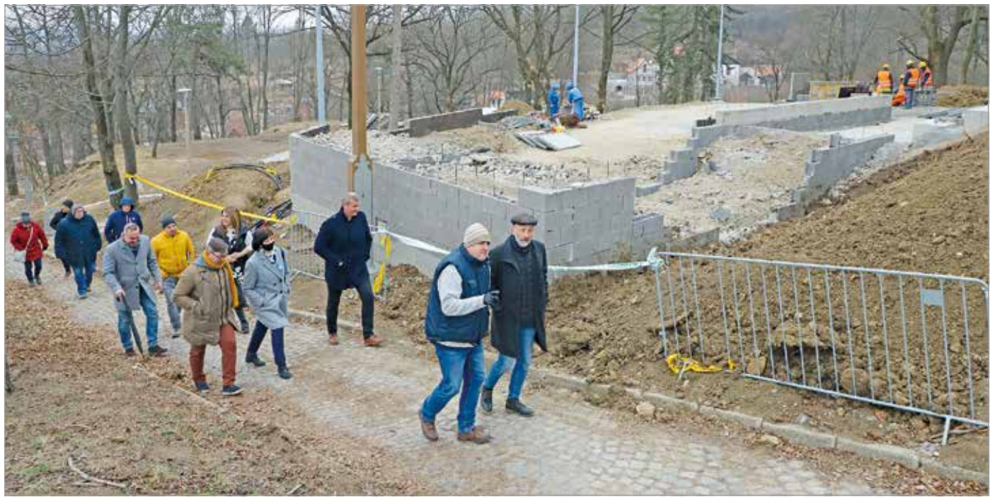
Az enyhe télnek köszönhetően a kivitelező folyamatosan tudott dolgozni a területen.

A megújuló teraszokat hétfőn bejárás keretén belül tekintették meg városvezetők a városüzemeltetésben dolgozó szakemberekkel.