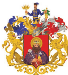
MISKOLC MEGYEI JOGÚ VÁROS

Tisztelettel meghívom Önt és kedves családját, 2022. március 15-én, az 1848/49-ES FORRADALOM ÉS SZABADSÁGHARC EMLÉKNAPJA tiszteletére rendezett ünnepi megemlékezésekre.