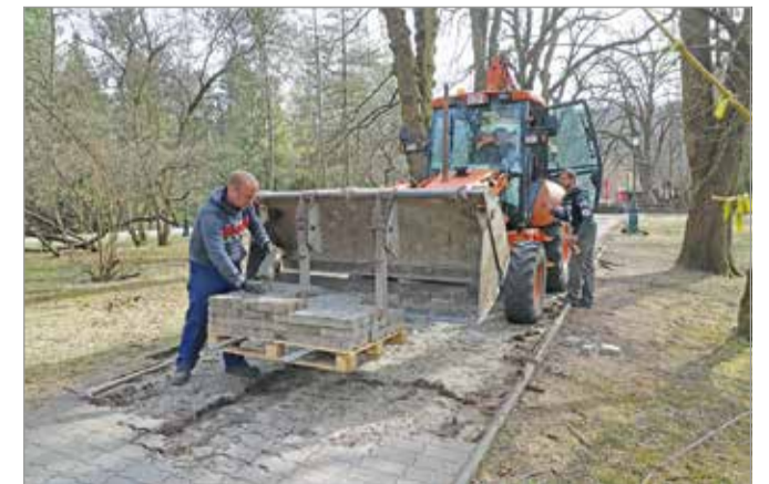
A burkolatok bontásával a munkálatok is megkezdődtek.

Térköveznek, felújítják a közműveket, új utcabútorokat, kandelabereket és tájékoztatótáblákat is kihelyeznek majd. „Ha végzett a kivitelező az ősparkkal, utána tud továbbhaladni a geometrikus parkrésze, ezt követi a csónakázó partfalának