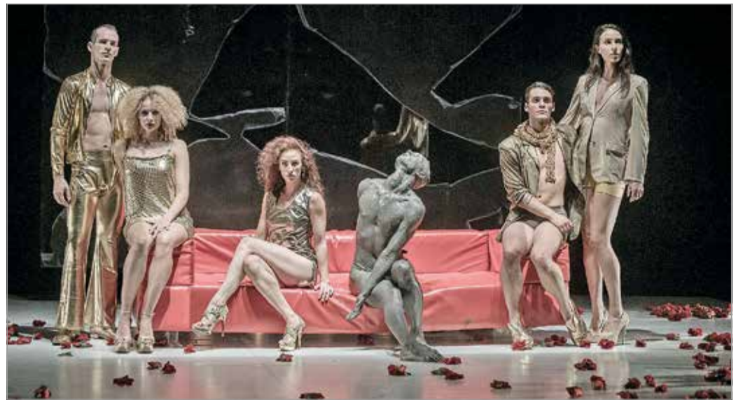
A FrenÁk Társulat az InTime című előadást tartogatja a fesztivál utolsó napjára.

– Csehországból, Finnországból és Lengyelországból is érkeznek produkciók. A Miskolci Nemzeti Színház és a Miskolci Balett egyaránt részt vesznek az Imre Zoltán-programban, ami alapvetően feltörekvő koreográfusok számára biztosít lehetőséget megmutatni. Ennek keretében szintén meghívunk pár fiatal höl-