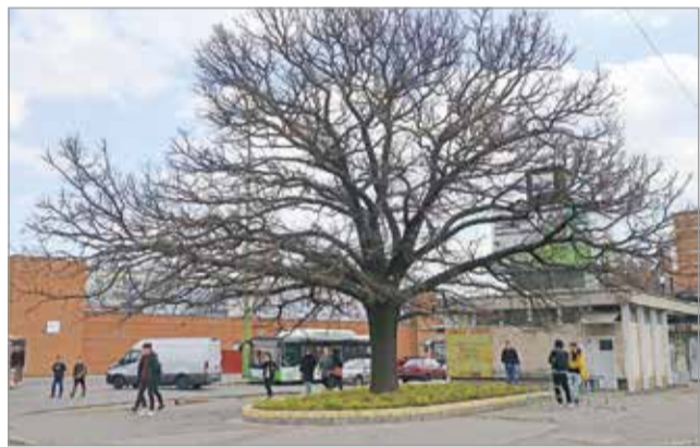
A munka civil kezdeményezésre valósult meg.