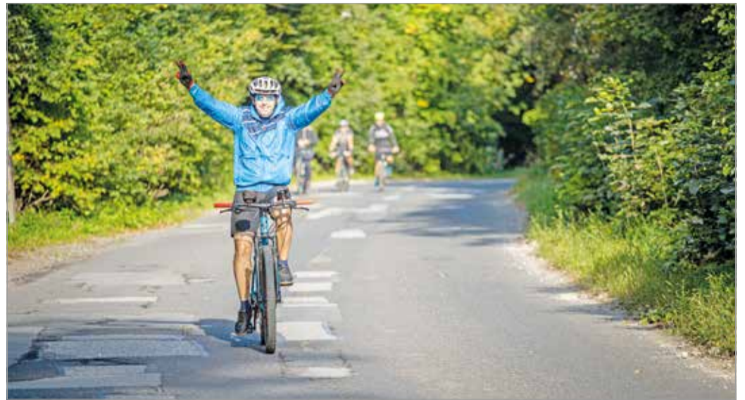
Az eseményen ezúttal is négy távon lehet majd indulni.

A szervezők ezért úgy döntöttek, hogy idén a harminc kilométeres táv útvonalát megfordítják, így aztán a Lusta-völgyön kell majd felfelé tekereni, míg a Jávorkútól Lillafüredre vezető, nem túl jó, de