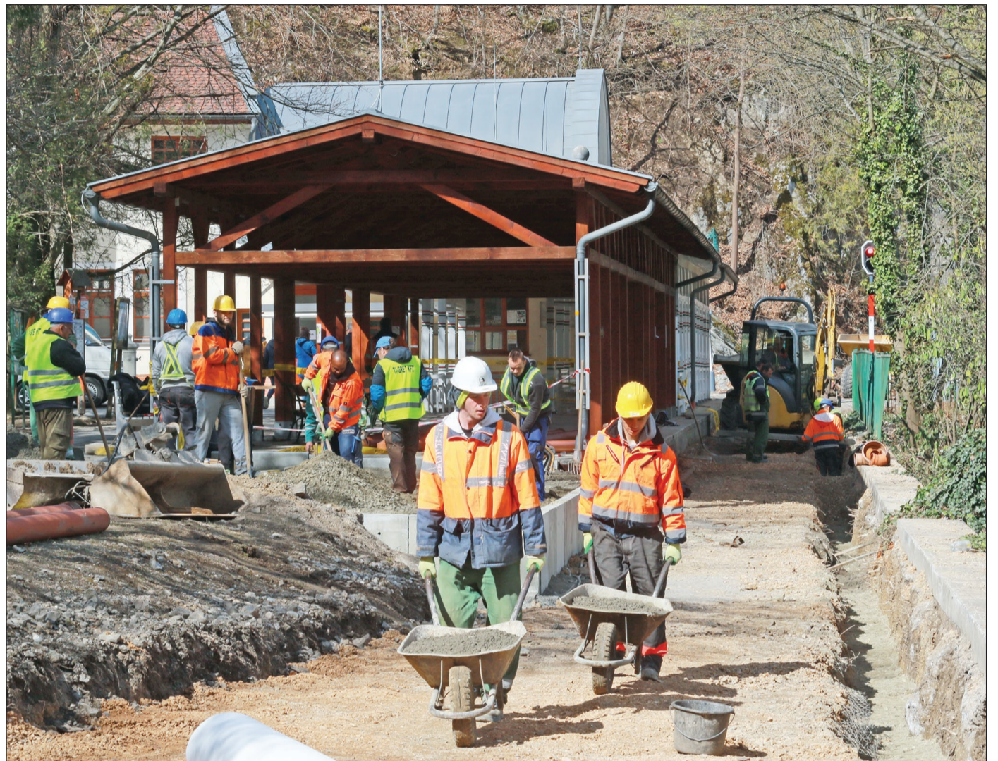
Jelenleg a görbehíd és a Jávorkúti elágazás között dolgoznak: előbb a vízelvezetést oldják meg, majd a vágányokat építik.