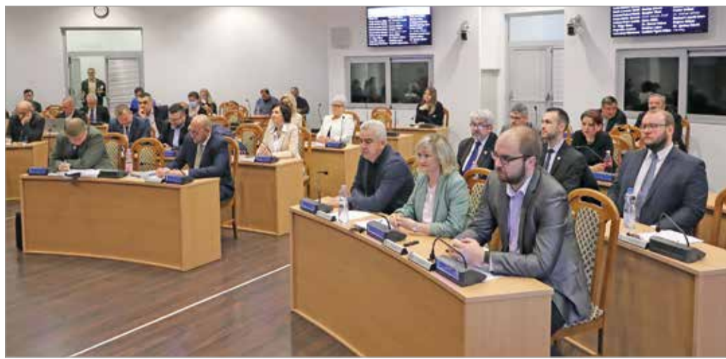
Az ülésen öt előterjesztést tárgyaltak meg a város vezetői.

A második napirendi pont arról szólt, hogy január 1- jén hatályba lépett a kóbor állatok befogásával, tulajdonjogának átruházásával, valamint elhelyezésükkel kapcsolatos feladatok ellátásának szabályairól szóló rendelet, melynek lényege: a kóbor állatok leadását jegyzői hatáskörbe adja, ő pedig ezt a Városgazdára ruhazza át.