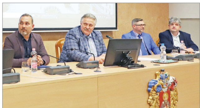
A közelmúltban mutatták be a hegygazdákat.

Az önkormányzat hegygazdákat állít az Avas élére, akik a problémák megoldásában és a javaslatok összegyűjtésében nyújtanak segítséget.