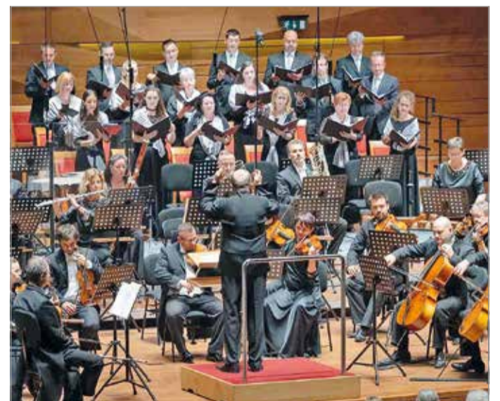
A Pannon Filharmonikusok is fellépnek Miskolcon

A Miskolci Nemzeti Színház sem marad ki a programhelyszínek közül. Április 21-én