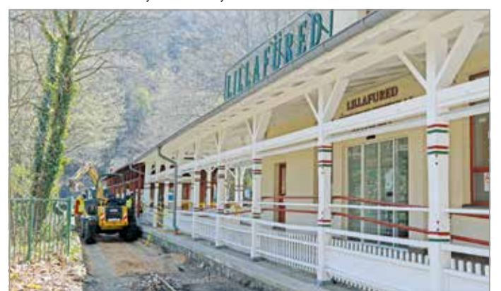
A lillafüredi végállomáson is megkezdődött a vágányok cseréje.