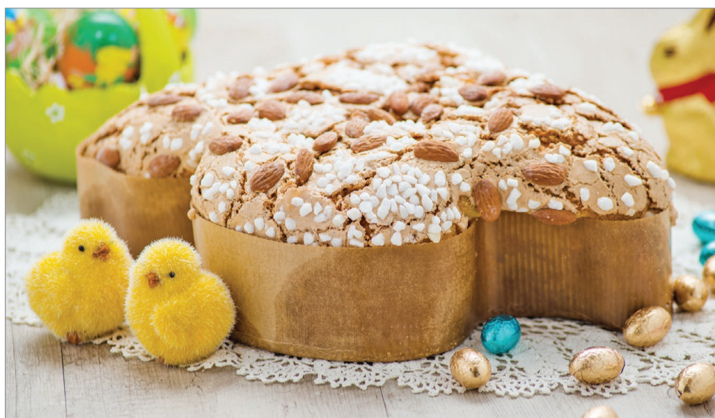
A colomba felülnézetből egy szárnyait kitérő galambra emlékeztet

Azt érdemes leszögezni, Itáliában a húsvét a legfontosabb ünnep, jelentőségében lekörözi nálunk a karácsonyt is. Bár a nagypéntek nem szabandnap, így kevesebb idő jut a bevásárlásra, a húsvét hétfő így is a család ünnepe, aminek fénypontja a közös ebéd. Ezt a 40 napos bójt után felszabaduló hústíllalom határozza meg: a főfogás természetesen a sült bárány, ám ezt „könnyed” reggeli előzi meg, többnyire szalámmal, sertés hasfalából készült fűszeres szalonnával – ez a pancetta – és különböző kenyerekkel.