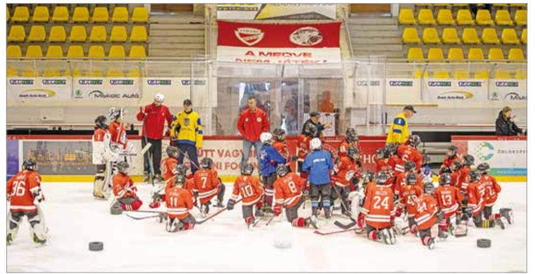
Nagyon élvezték a közös munkát a fiatalokkal.

– Ezek a fiatalok az első menekülthullámmal, az anyukáikkal érkeztek Ukrajnából, azóta nálunk edzenek. Hamar