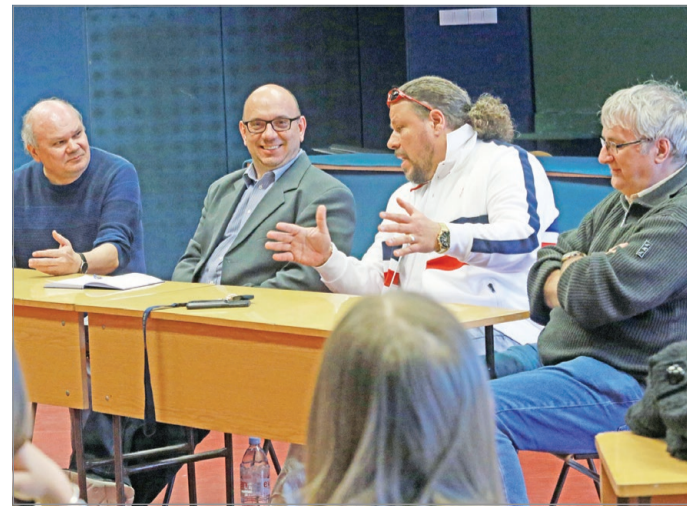
Konszenzus és vita – egy asztalnál a Miskolci Egyetem oktatói.