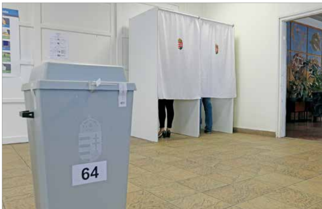
Vasárnap reggel hattól este hétig adhatjuk le szavazatunkat a kijelölt választóköri körökben.

– Az előző időszakban – nem túl szerencsésen – a városrészek szétszabdalásával kerültek kialakításra az önkormányzati választókerületek. Például Hejőcsaba és a belváros vagy Miskolctapolca és a belváros egy önkormányzati választókerületbe tartozik. Az is előfordul például, hogy egy hatlépcsős panelépület három lépcsőháza az egyik, három pedig egy másik választókerületbe tartozik. Ezekhez sajnos igazodni kellett a szavazókörök felülvizsgálata során.