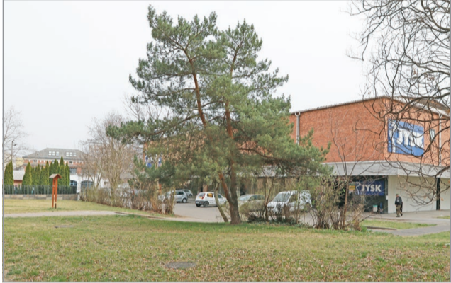
A nyár folyamán megvalósul az átalakítás.