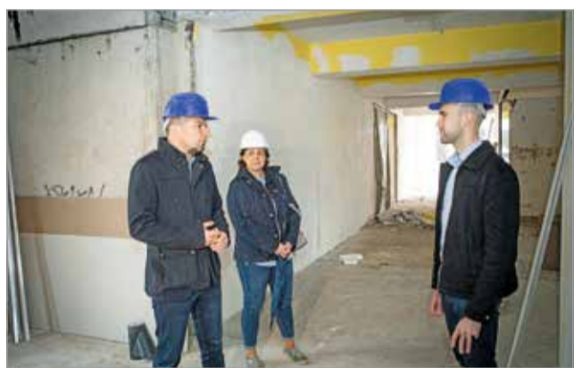
A vasbeton szerkezetes épület a következő hónapokban teljesen megújul.

A vasbeton szerkezetes épület a következő hónapokban teljesen megújul: elvégzik a teljes gépészeti és energetikai felújítást is – hangsúlyozta Bazin Levente.