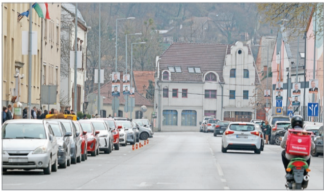
A Dayka Gábor utcát meghosszabbítják a Meggyesalja utcáig.