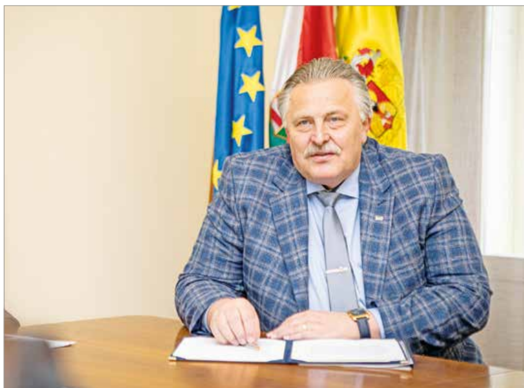
„A legfontosabb siker az, hogy a város működik, de azért van ennél több is.”

– Hát ez egy nehéz kérdés. Megtehettem volna, hogy ki-