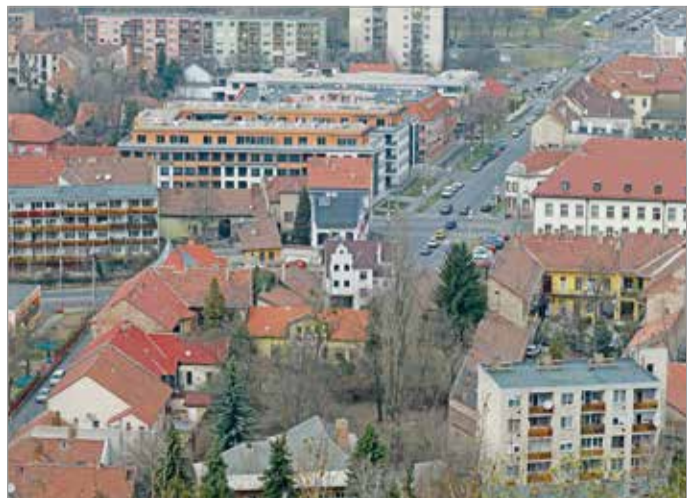
A munkaterületet várhatóan április közepén adják át a kivitelezőnek.