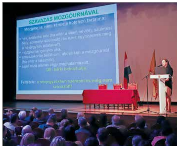
Kedden és szerdán oktatták a szavazatszámoló bizottság tagjait.

2022-ben ismét választ az ország: vasárnap reggel hattól este hétig adhatjuk le szavazatunkat a kijelölt választóköri körökben. Nemcsak az dől el, hogy a következő ciklusban melyik pártok irányítják majd Magyarországot, hanem az országgyűlési képviselők személyéről és a voksolás napjára kiírt „gyermekvédelmi” népszavazás kapcsán is döntés születik. Miskolcon 129 szavazókörben lehet majd voksolni. Kedden és szerdán oktatták a szavazatszámoló bizottság tagjait, akik letették esküjüket is.