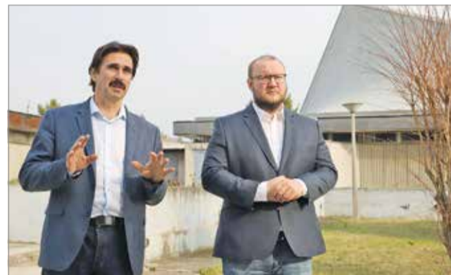
A beruházás kétszázötven millió forintos keretösszegeből valósul meg.