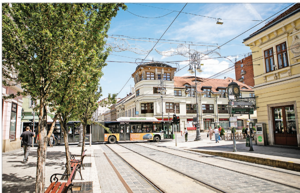
Bár a lámpákat már elektronikus rendszer irányítja, a kereszteződés neve maradt Villanyrendőr.

Már a háborút követő években szükségessé vált a megnövekedett forgalom szabályozása, ezért a négy sarkon jelzőlámpákat helyeztek el, melyeket egy vezérlőszekrényen el-