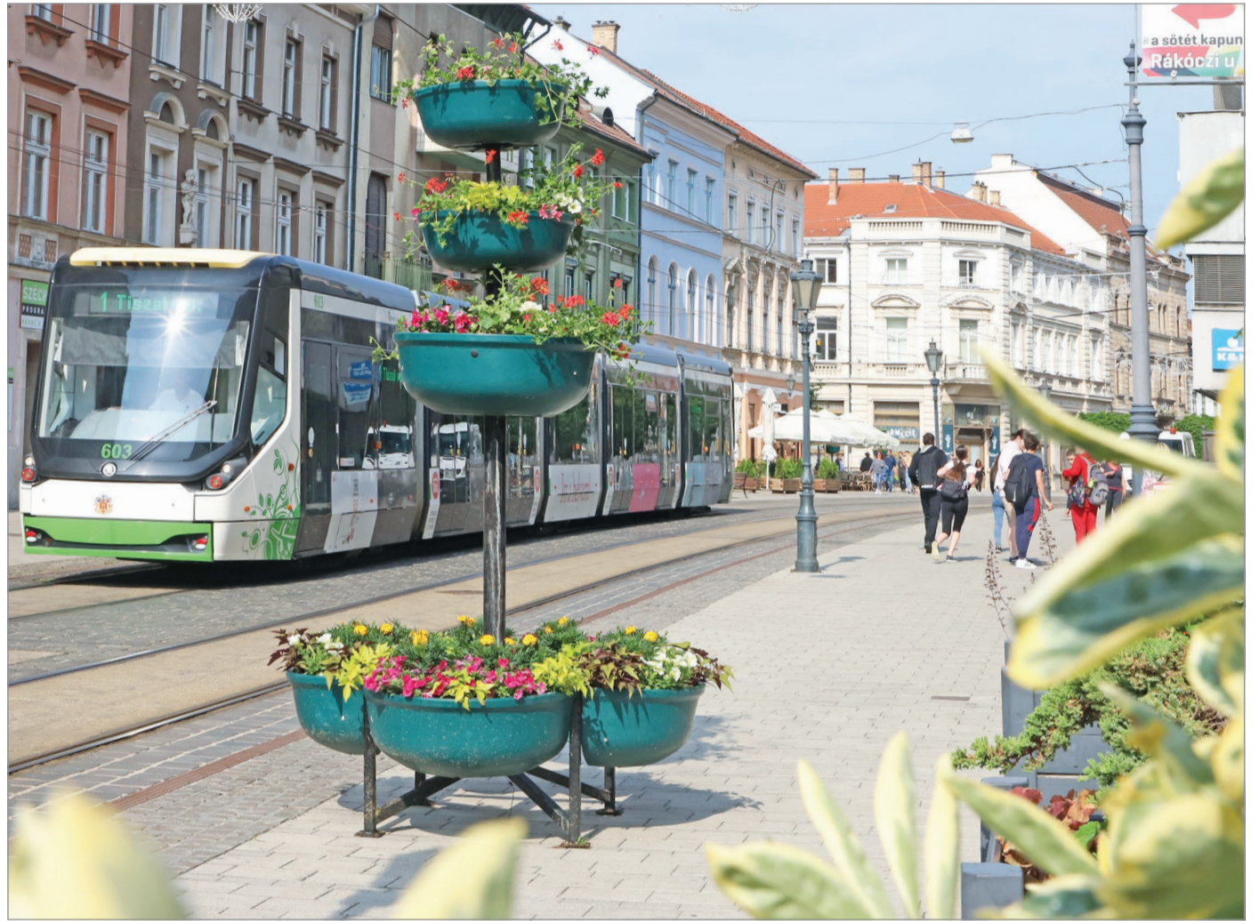
Színesek, üdék és egész nyáron a főutca díszei lesznek a virágfák.

A Városgazda munkatársai szerdán hozták a régről ismert – és a tavaly nyárig már szinte elfeledett – virágfák kihelyezéséhez.