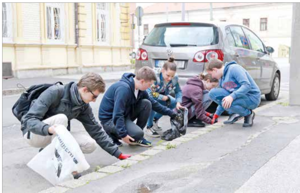
Egy korábbi szemétszedő akción, a Lévy gimnázium környékén.