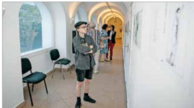
Pető János emlékkiállítására sokan voltak kíváncsiak.