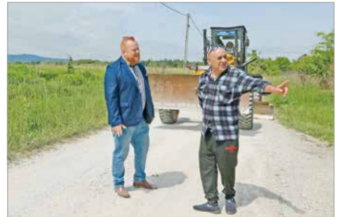
Az itt élők szerint nagy szükség volt a felújításra.