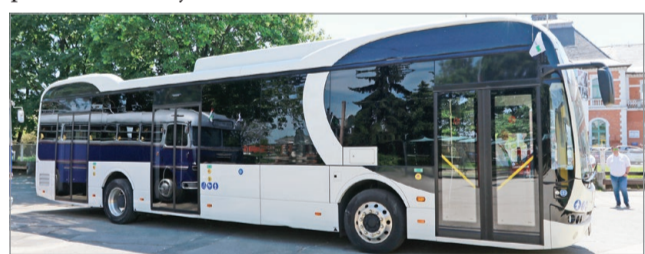
A tesztbusz már jár, az elektromos járművek ősztől közlekednek