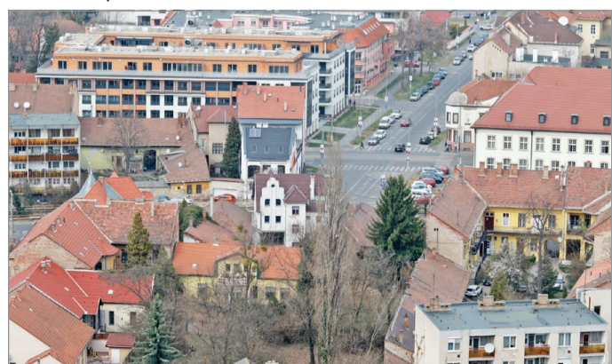
Bontással kezdődik a Dayka Gábor utca meghosszabbítása.