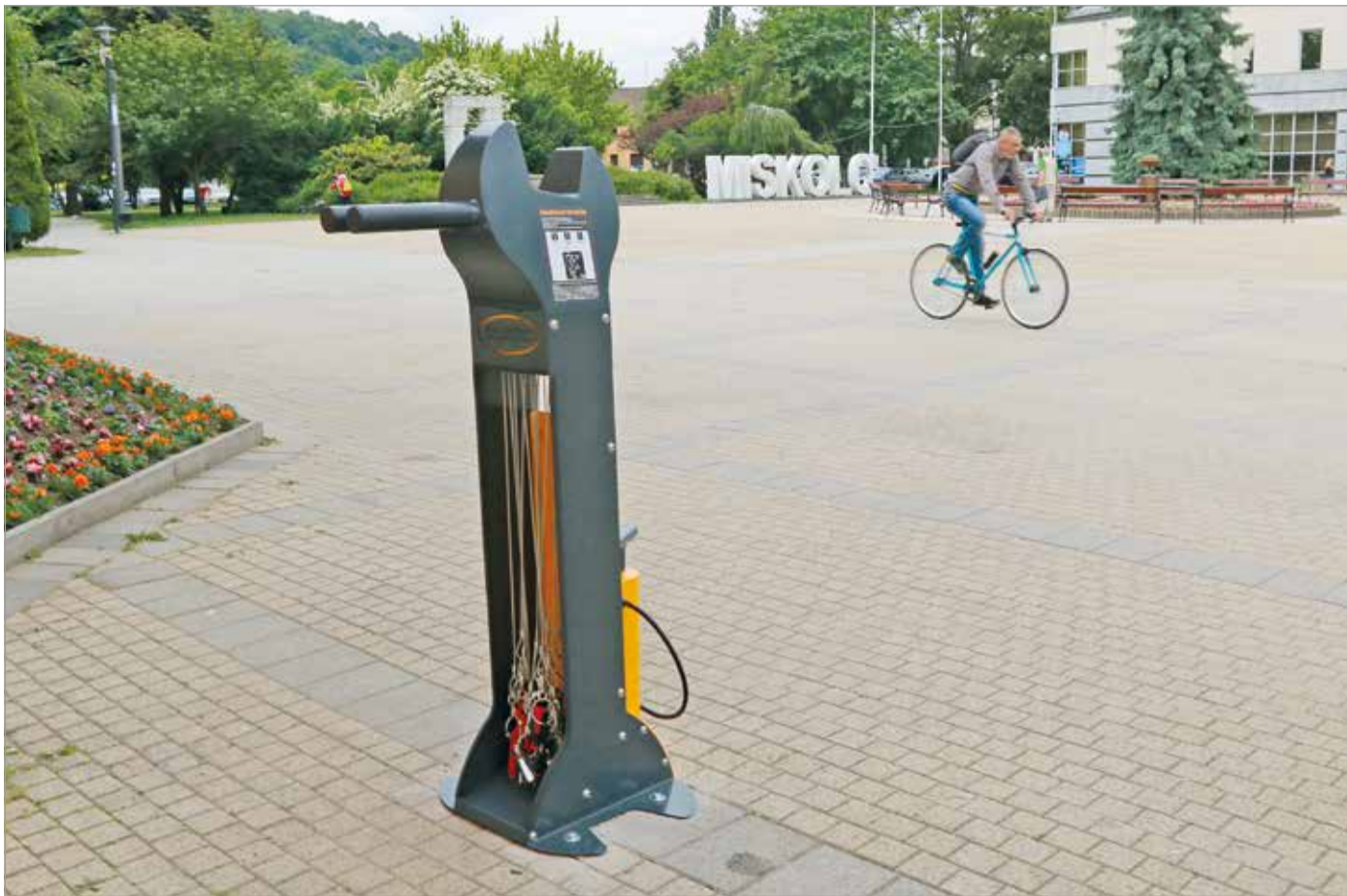
A Szent István téren kívül még kilenc szervizpont lesz városzerte.

A következő két hétben összesen tíz önkiszolgáló kerékpárszervizt telepítenek Miskolcon.