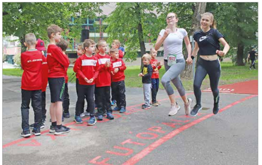
Kellemes belvárosi környezetben röhögtek a köröket.

„Utóbbi célja, hogy felhívjuk a figyelmet a sport és a mozgás fontosságára, az egészséges