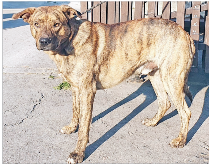
(5903). Rovent Bekerülés helye: Miskolc, Forrásvölgy

Ezen a héten Rovent (5903.), a Miskolci Állategészségügyi Telep egyik lakóját mutatjuk be. Az állat korának megfelelő oltásokkal, féregtelenítéssel és SPOT-ON cseppekkel ellátva kerül az új gazdihoz. Érdeklődni a +36 (30) 339-6549-es telefonszámon lehet hétköznap 8:00 és 15:30 között.