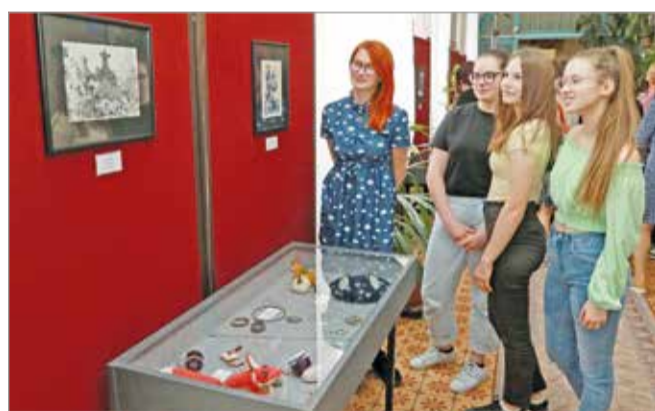
A tárlaton többek között természetfotókat, festményeket, verseket, sőt még ékszereket is felvonultattak.

Természetfotók, festmények, futurisztikus rajzok, versek, gyöngyfűzött ékszerek, különleges játékok és még sok érdekesség várta a megnyitón a diákokat. Ugyanakkor a célcsoport nem korlátozódott