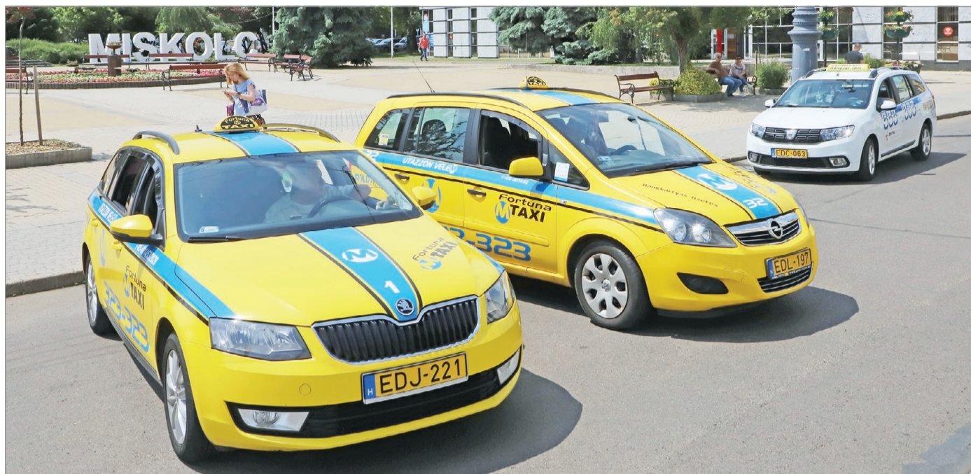
Az árak emelkedését a taxisok is megérik.

A szervízdíjak „iszonyatosak”, fogalmazzott, az alkatrészek pedig ma már dupla annyiba kerülnek, mint akár csak egy éve. A leghűsbavágóbb azonban: 10 évesnél idősebb autót nem használhatnak, az újak most nagyon drágák, a szintén sokba kerülő