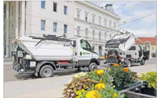
Olyan helyekre is eljuthatnak, ahová nagyobb társaik nem.