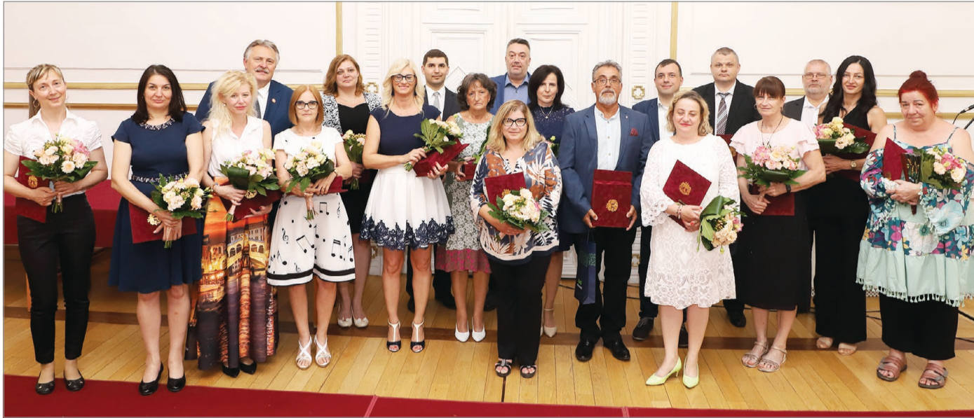
A kitüntetettek és a kitüntetőik.

A polgármesteri hivatal közszolgálati tisztviselőit ünnepelték csütörtökön, közel húszan vehettek át munkájukért valamilyen elismerést a városháza dísztermében.