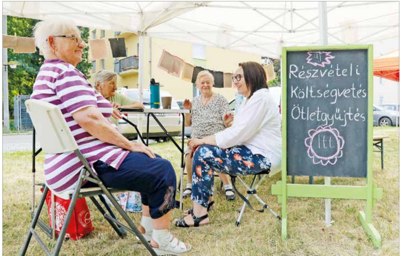
A Részvételi Iroda munkatársai segítenek az ötletbennyújtásban.

A kategóriákat úgy határozták meg, hogy azok minél több embert érintsenek, megmozgassák a közösségeket. Emellett az is szempont volt, hogy az állampolgárok reális ötleteket nyújthassanak be, tehát például ne igényeljen bonyo-