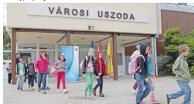
Sokan megfordultak a négy évtized alatt az uszodában.