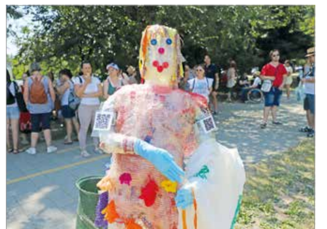
Bolygónk megmentéséről szól a kiállítás.