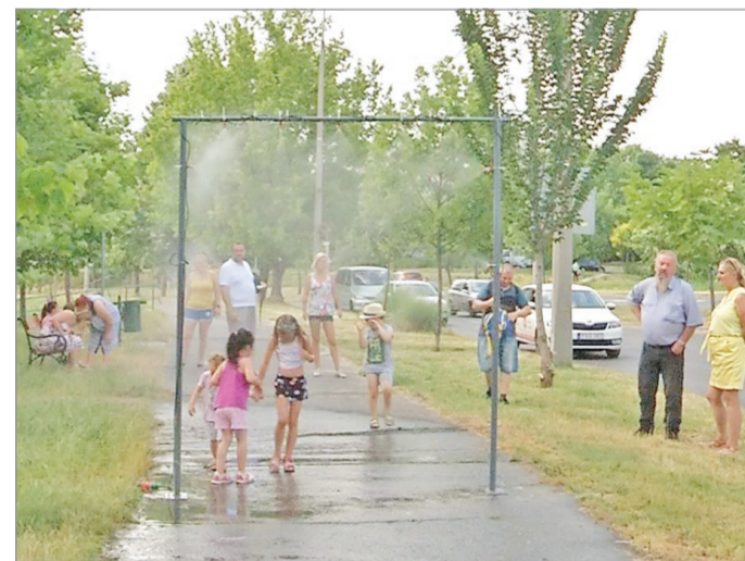
Enyhítik a hőséget a városunkban felállított párapapuk