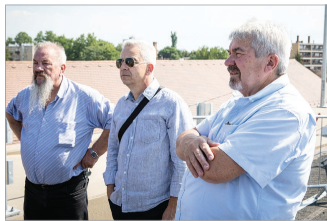
A miskolci városatyák megtekintették az Y-hídat.

– Reméljük, minél hamarabb át tudják adni a hidat a miskolciaknak, már nagyon