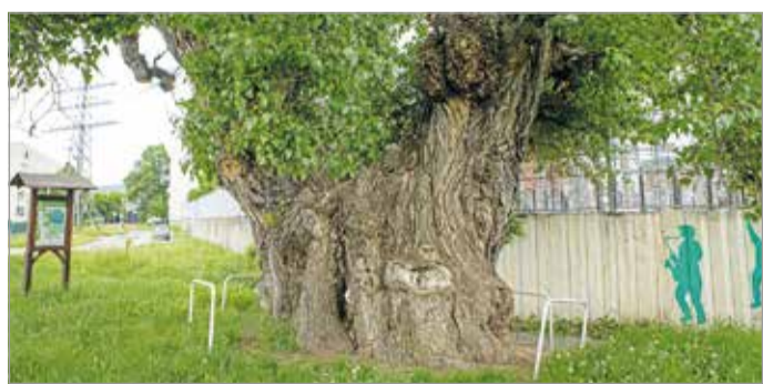
A törzskerülete több mint 10 méter

A bulgárföldi fekete nyárfa 11 másik különlegességgel kel versenyre, melyek a következők: