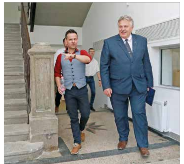
Veres Pál polgármester megtekintette az új művészeti központot.

– A földszinten pedig egy melegtárolóház és étkezőt alakítottak ki, amit a Miskolci Közintézmény Működető Központ fog üzemeltetni, ami mintegy háromszáz gyerek étkeztetését fogja itt biztosítani – mondta el lapunknak a polgármesteri hi-