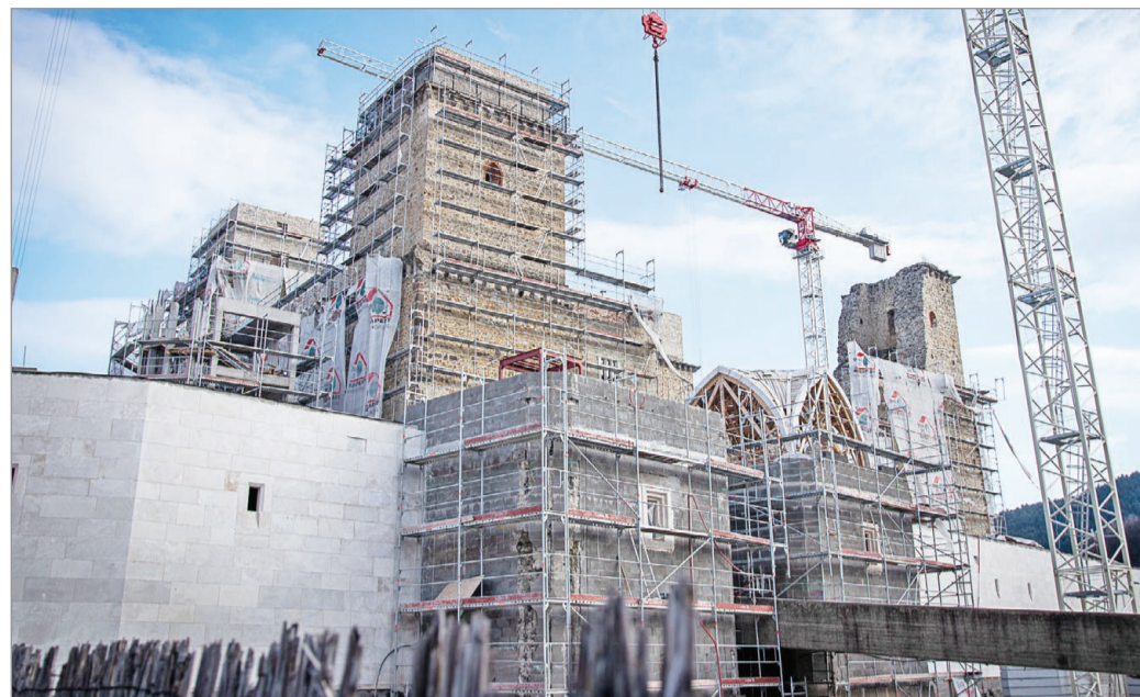
Sokaknak nem tetszik a látvány...

Történt ugyanis, hogy a kormányzat által 2015-ben indított Modern Városok Programon