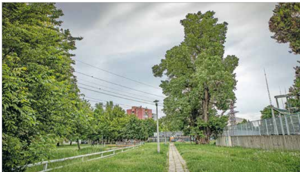
A közel 31 méter magas matuzsálem egy igazi csoda.

Az Év fája versenyt úgy hirdeti meg minden évben a szervező