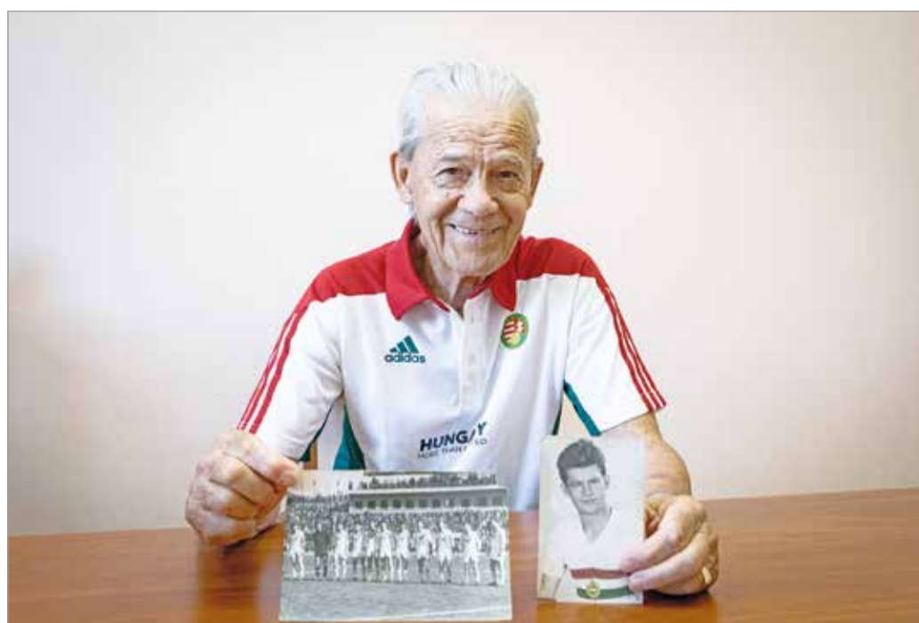
Mustos, kezében a becses relikviákkal.

– Egy ponttal előttünk álltak az ózdiak az 1962/63-as sze-