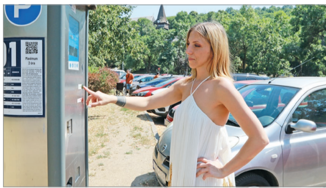
A parkolás 440 forint lesz óránként.

Többre kerül majd a parkolás augusztus 1-jétől Miskolcon, de a megemelt árak még így is jelentősen alacsonyabbak nálunk, mint például Debrecenben vagy Győrben. A többletbevételből új, modernebb eszközökkel frissülhet a parkolási rendszer a megyeszékhelyen.