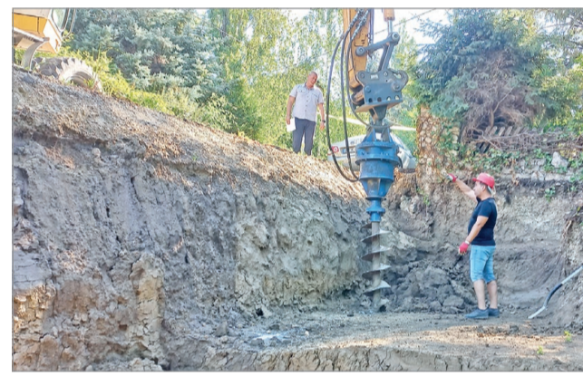
A talaj előkészítésével kezdődtek a munkálatok.