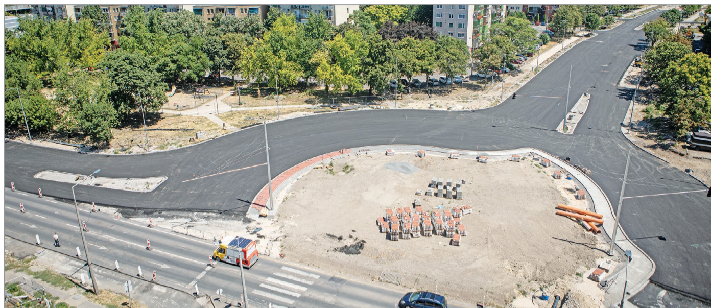
A Vörösmarty–Király utcák kereszteződésében változásokra kell számítani.

A csomópont nyugati oldalát lezárják, a forgalmat a keleti, az elmúlt hónapokban elkészült fél körpályára terelik át.