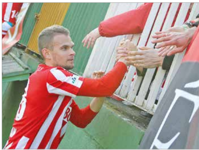
Koman Vladimirt mindig is szerették a szurkolók.

Akkor egy rozoga stadionunk és csak egy-két edzőpályánk volt, ma pedig már tényleg minden feltétel adott ahhoz, hogy a legjobbak között szerepeljen a klub. Most az a legfontosabb, hogy mielőbb kialakuljon egy jó társaság, egy jó csapat, egy jó közösség, mert az mindig viszi előre az embert. De nagyon nagy szükségünk van a szurkolótáborra is, hiszen most mindenkinek egy irányba kell eveznie. Nagyon fontos, hogy megkapjuk a lelátóról a támogatást, főleg az itthoni mérkőzéseken. Úgy tudom, hogy a csapat 3/4 része fiatal játékosokból áll, ezért is nagyon nagy szükség lesz a drukkerék támogatására. Nehéz bajnokság vár ránk, de egyértelműen fel kell jutnunk.