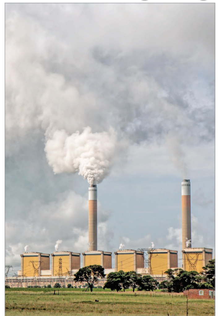
Nem mindenütt figyelnek a környezetre.

A „száz város misszió” kapcsán július 12-én délelőtt tartott online megbeszélésen a budapesti, pécsi és miskolci szakemberek nemcsak a távlati célokról ejtettek szót, hanem a három magyar város közötti együttműködés lehetőségeiről is. Az egyeztetések folyamatosak, a tervek szerint jövő héten is folytatódnak majd. Az, hogy Miskolc beke-