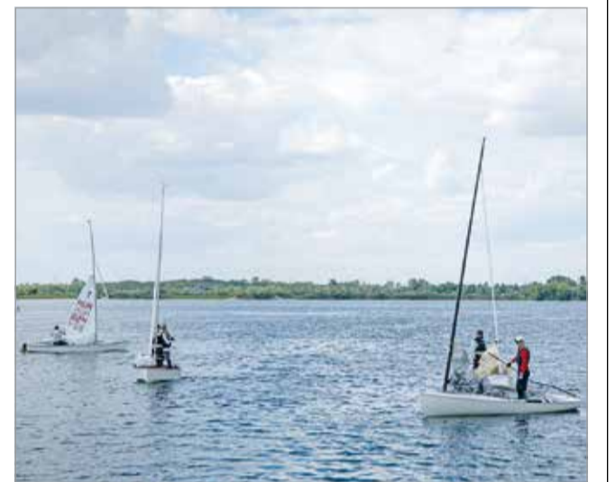
Csak az első nap kedvezett a vitorlásoknak.