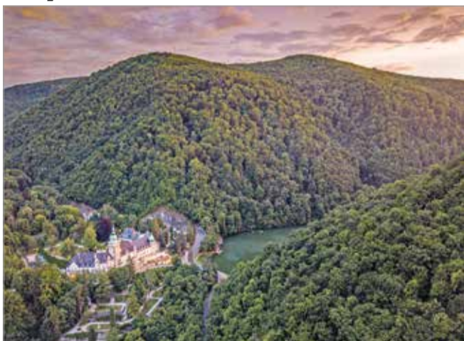
Új turisztikai imázsfilm és megújult weboldal csábítja Miskolcra a turistákat

Új turisztikai imázsfilm mutatja be Miskolc sokszínűségét. Miskolc nyári turisztikai kampánya élmények gyűjtésére buzdítja az utazókat. Az imázsfilm mellett fotósorozat és új weboldal is segíti az érdeklődőket abban, hogy minél könnyebben felfedezhessék Miskolc értékeit.