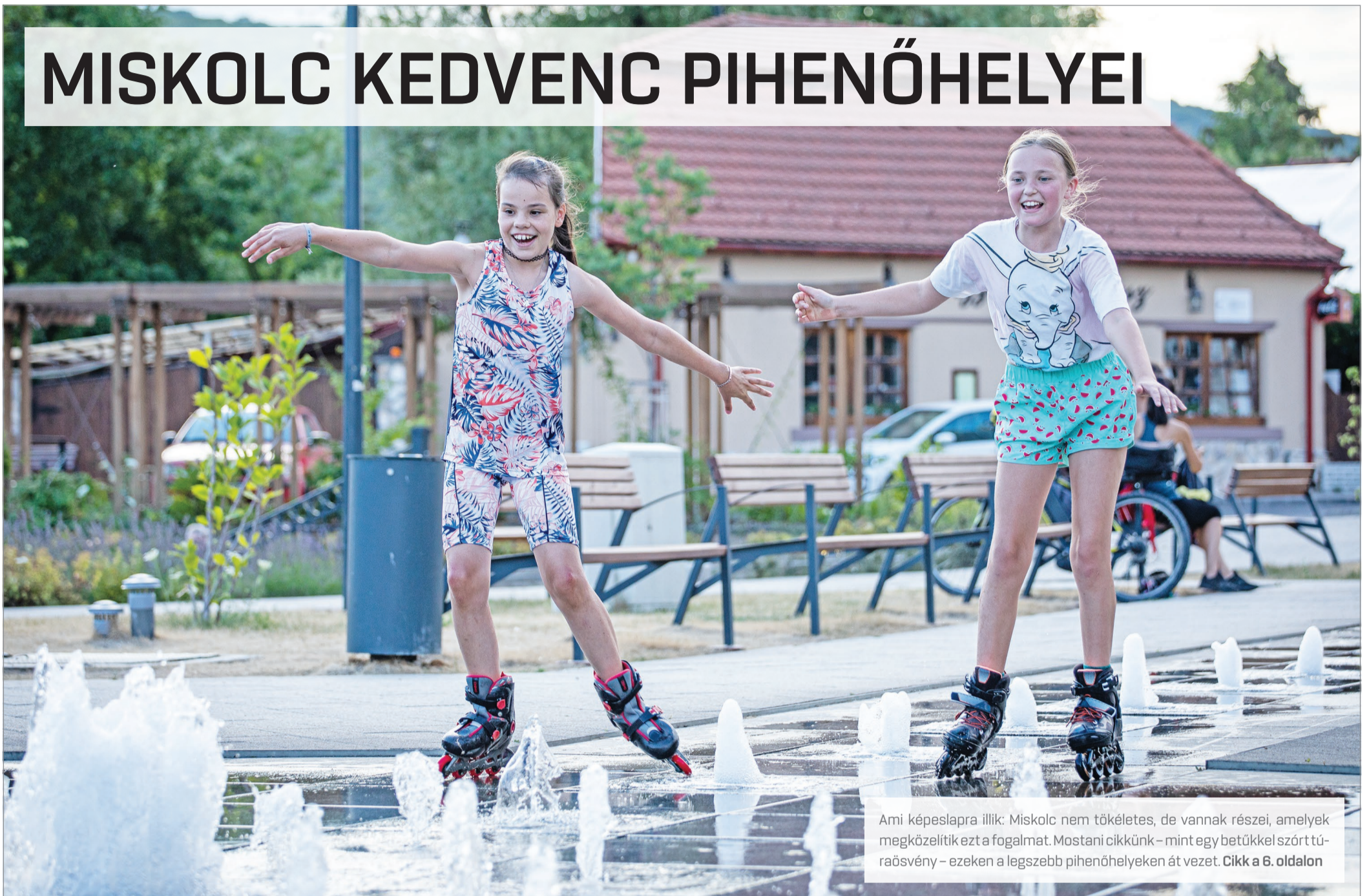
Ami képelepra illik: Miskolc nem tökéletes, de vannak részei, amelyek megközelítik ezt a fogalmat. Mostani cikkünk – mint egy betűkkel szórt túraösvény – ezeken a legszebb pihenőhelyeken át vezet. Cikk a 6. oldalon