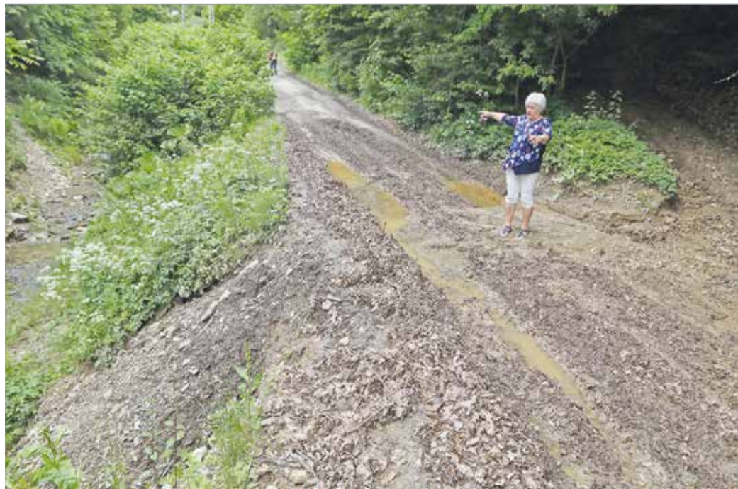
Szeptember végére befejeződhetnek a munkálatok.