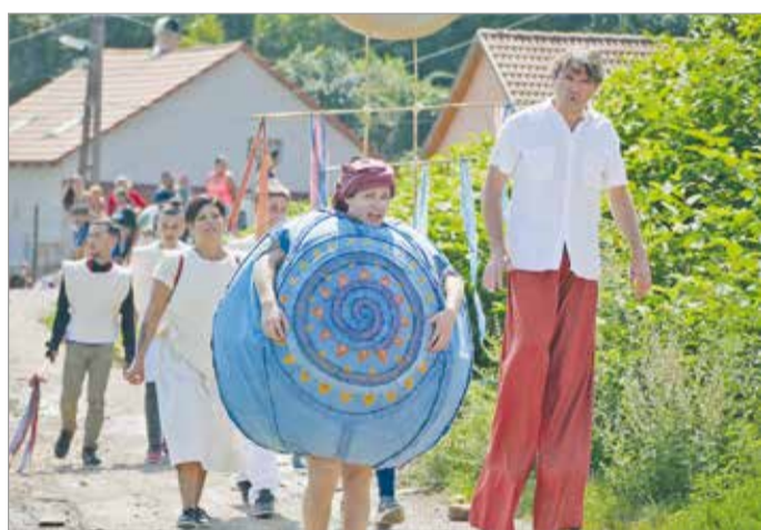
Egy sikeres tavalyi rendezvény.

Olyan gyűjtésről van szó, ami a magyarországi roma művészeti szcéna egészét szeretné bemutatni. Ezt a szerepet idén a fesztivál mégsem tudja betölteni, ennek pedig főként anyagi gátjai vannak. Az esemény a társadalom egészéhez képes eljutni, a források hiánya azonban nagymértékben hat a tervekre. Az augusztus 3-a és 5-e között Baktakékre, Alsóvadászra, Kázmárkra, Fügödre, Szakácsiba tervezett programokat már felfüggesztették. A fesztivált szervező Utcaszínházi Alkotóközösség (UtcaSzak) szerint szelle-