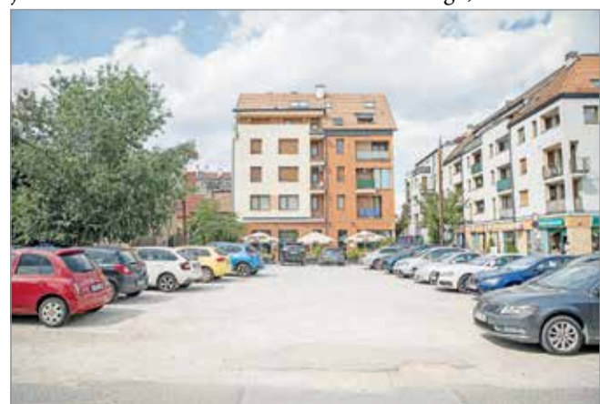
Változásért kiált minden...

Mindemellett – részletezte a beruházó cég képviselője – azért, hogy a környéken lakók és a terület használói megbarátkozhassanak az újonnan kialakult helyzettel, az elkerítéssel járó munkálatokat csupán augusztus közepétől kívánják megkezdeni. Folytatás a 2. oldalon.