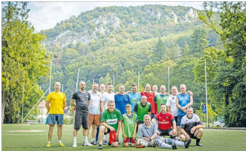
A legutóbbi kalandparki derbi labdarúgói.