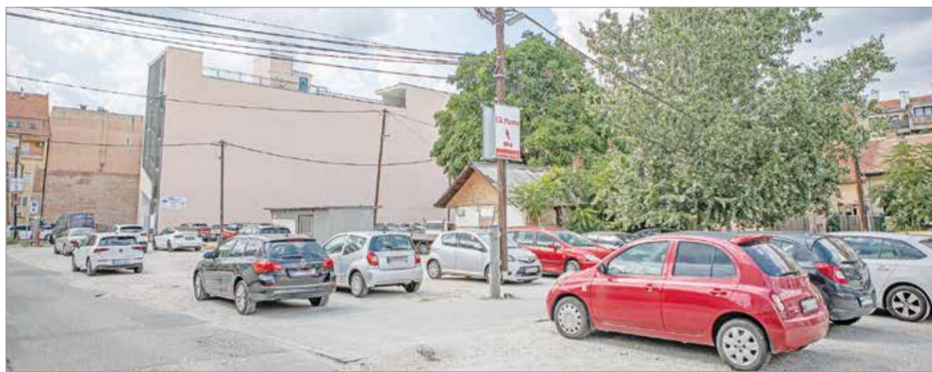
A beruházás teljes ideje meghaladhatja a kettő esztendőt.