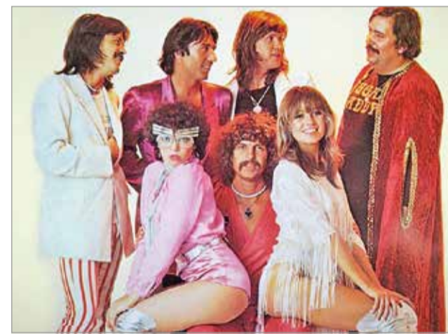
A régi Neoton.

Repertoárjuk főleg a régi nagy Neoton-slágerekből tevődik össze, a Santa Mariától a Kétszázhusz felettig, amit a koncert végére garantáltan velük énekel majd a közönség, Dj. Dominique pedig a jobbnál jobb retro slágerekkel tevert remek hangulatot.