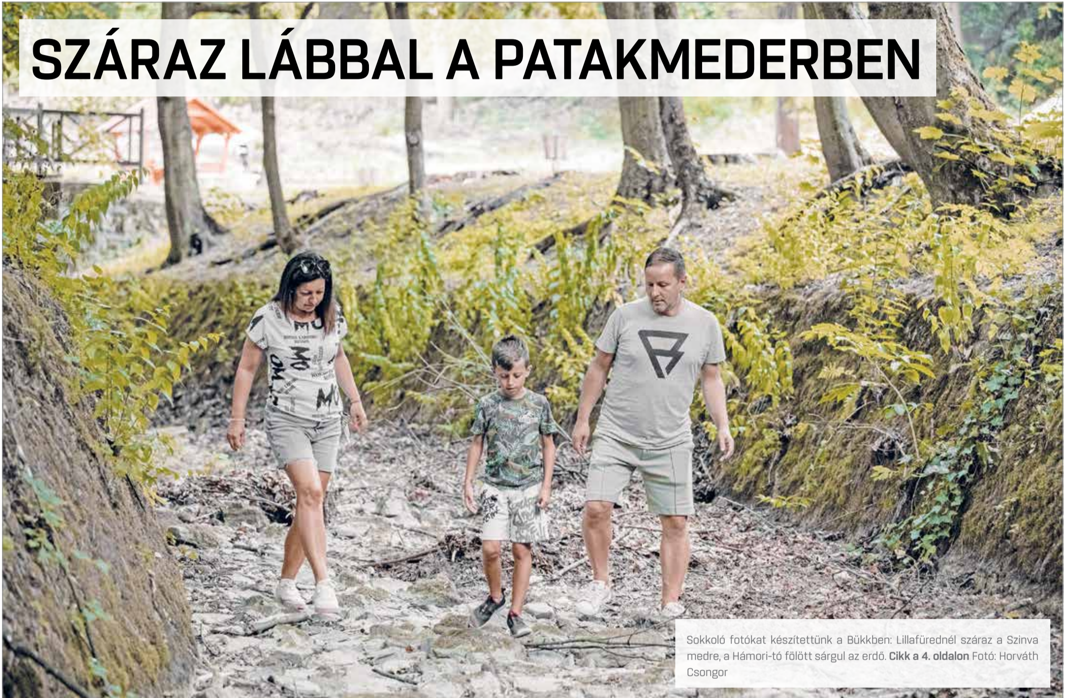
Sokkoló fotókat készítettünk a Bükkben: Lillafürednél száraz a Szinva medre, a Hámori-tó fölött sárgul az erdő. Cikk a 4. oldalon