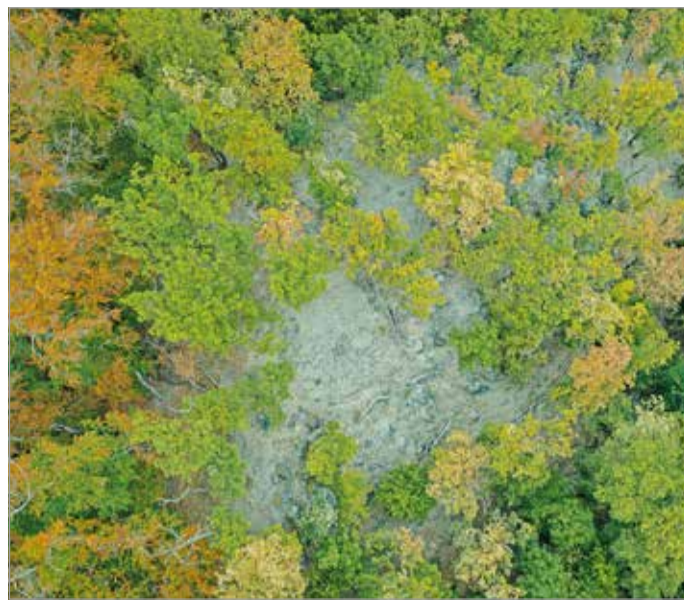
Megzavarodott a természet: korai színesztézia.

– A külföldi és a hazai víztározás jótékony hatásaként a Tisza, a Bodrog és a Hernád természetesen lefolyó mennyiségénél nagyobb vízkészletekkel rendelkezik – mutatnak rá, hozzátéve: a téli csekély hófelhalmozódás és a tartós csapadékhiány a karsztos területeket