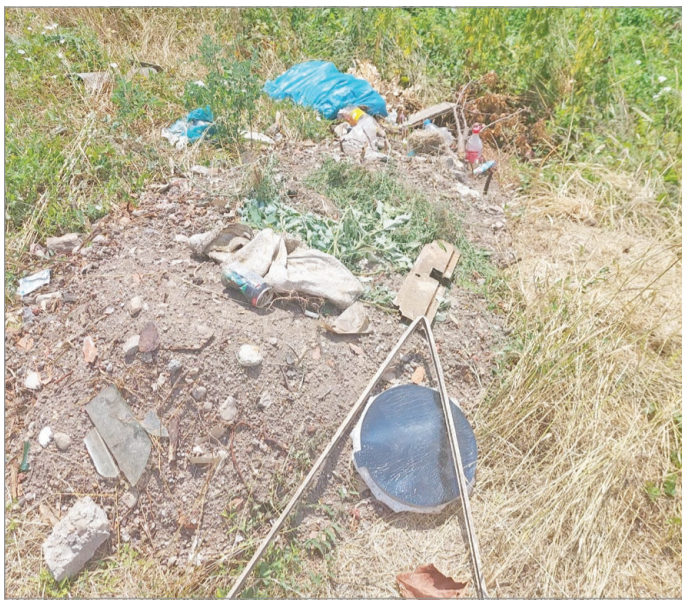
A kamerafelvételek segítségével elfogják a renitens hulladéklerakó állampolgárokat.

A rendszek sokszor a járőrök észlelése nyomán vagy a kamerafelvételek segítségével elfogják a renitens hulladéklerakó állam-