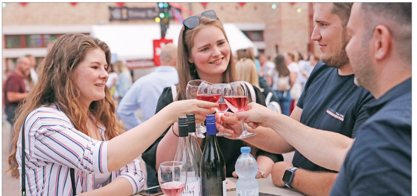
A GasztroPLACC a Lovagi tornák tere is nagy sikernek örvend.

Az elmúlt években már megszokott GasztroPLACC Extra és a Miskolci Illés Emlékzenekar koncertjének fúziója várja a Lovagi tornák terére látogatókat augusztus 12-én.