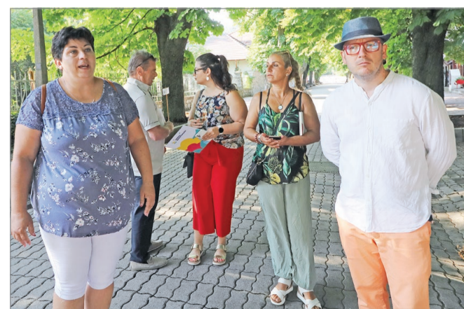
Jól látszik, mennyi teendő van egy ilyen kincs megőrzésével.