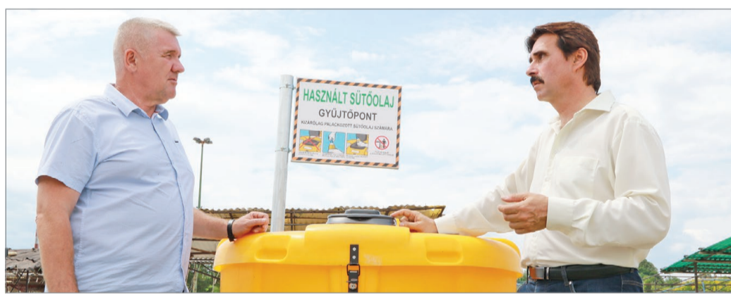
Eszmecsere a használt étolaj megmentéséről.

Ha a WC-be, csapba öntjük, a közműveinket tesszük vele tönkre, a talajban pedig az élővilágot és az ivóvizünket itéljük halálra.