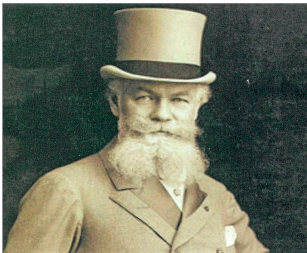
Munkácsy szívesen gondolt miskolci gyermekéveire