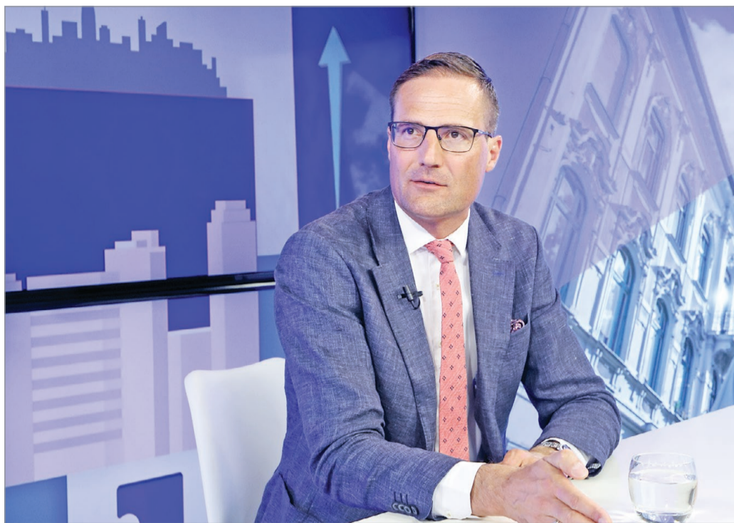
Gyöngyösi Márton, a Jobbik elnöke.

– Elsőként csatlakozni kellene az Európai Unióhoz. Ez a szervezet tavaly június 1-jén állt föl. Azért jött létre, hogy visszazorítsa az EU-s pénzekkel való