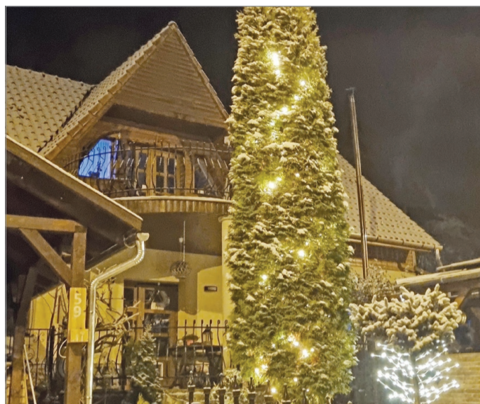
Az idei karácsonykor már a drasztikusan megemelt számlákkal szembesülhetnek a tulajdonosok.

Részletfizetési kedvezmény, illetve fizetési haladék egy éven belül egy alkalommal igényelhető. Ha a fogyasztó nem tartja be a megállapodást, és nem teljesíti a megjelölt határidőre, úgy a részletfizetési megállapodás hatályát veszti, és a lejárt esedékességű