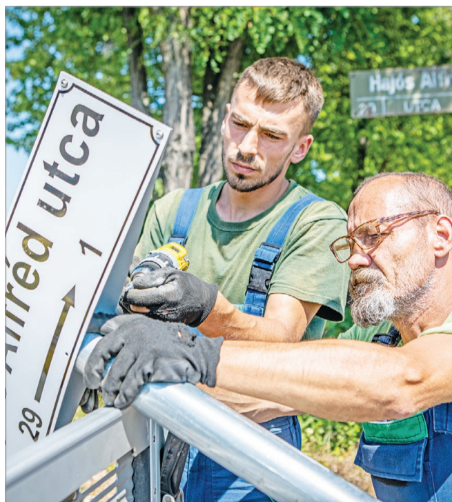
Megkönnyítik az Avásra látogatók tájékozódását.

zetője elmondta, az eszközök cseréjének célja nemes egyszerűséggel a megfelelő tájékoztatás, hogy „minden-