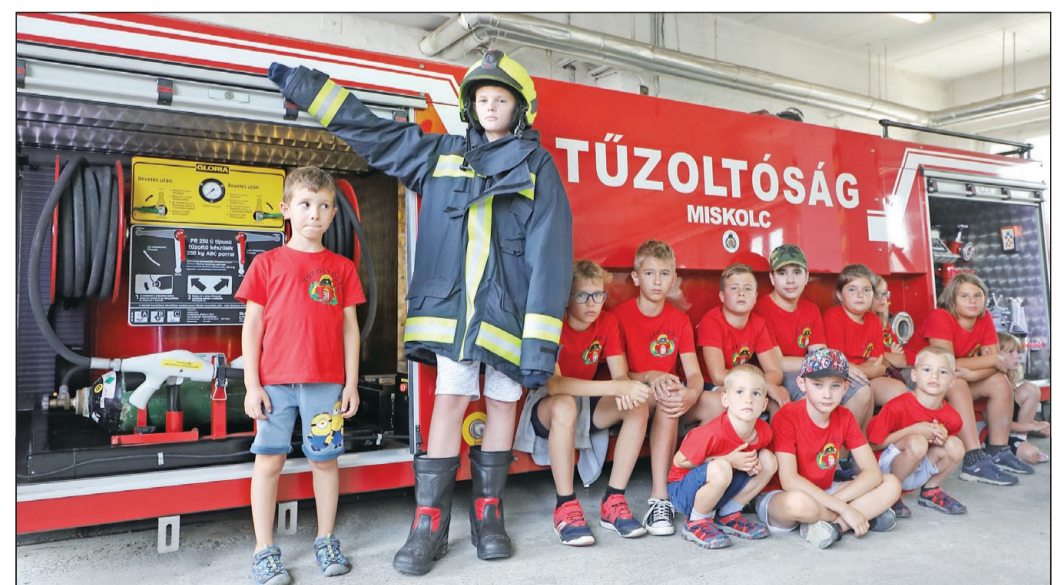
ISMERKEDTEK A LÁNGLOVAGOK MUNKÁJÁVAL. Csaknem félszáz gyerek látogatta meg szerdán a Miskolci Tűzoltóságot. A szervezet által megrendezett testvérvárosi tábor részeként érkeztek városunkba. A fiatalok között voltak magyar és német anyanyelvűek is, egy azonban közös volt bennük: valamennyiüket érdekelte a lánglovagok munkája.