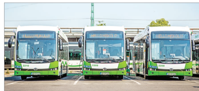
Az új buszok a legtöbb vonalon feltűnnek majd.