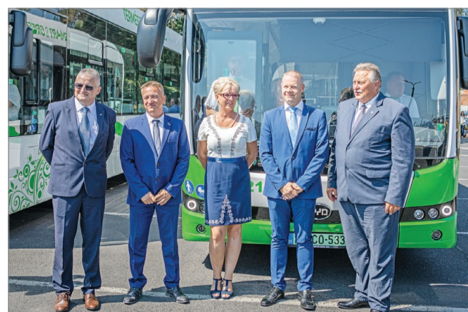
Az első tíz elektromos autóbusz átadóünnepségén.