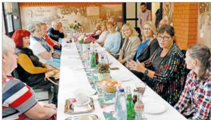
DK fórum a Vigadóban.

A DK-elnök imponálónak nevezte a Veres Pál által vázolt miskolci terveket, de – tette hozzá – ezek megvalósításához stabil többségre van szükség a városi közgyűlésben.