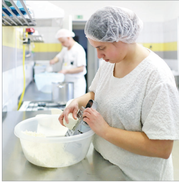
Életkép a Baráthegyi Majorságból.

A Baráthegyi Majorságban található nappali intézményük és konyhájuk egy fűtési körön működik, ide faelgázósító kazánt szereltek be. A Baráthegyi Lakóotthonba szintén rendeltek egyet, folyamatban van a gépészeti terv készítése és a kazánház építése. Terveik szerint még a tél előtt elkészülnek vele. A martinkertvárosi lakóotthonukba is szeretnék beszerezni egy ilyen kazánt, itt azonban