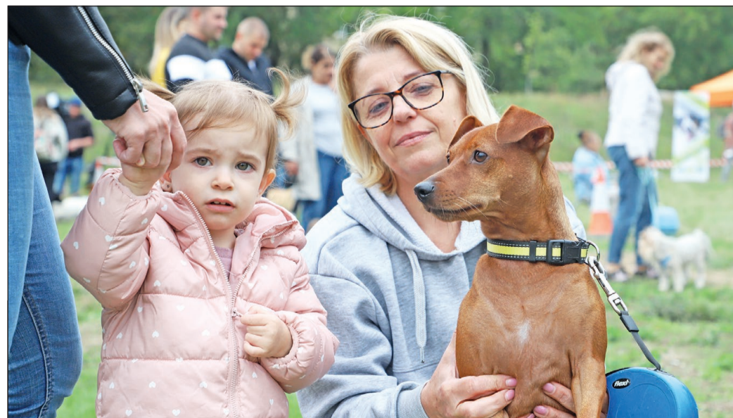
A LEGSZEBB KUTYÁT KERESTÉK. Az Avas Szépe kutyaszépségversenyt szeptember 17-én rendezték meg a városrészen. A cél az is volt, hogy a kutyások közössége erősödjön, és a kulturált, felelősségteljes tulajdonosi viselkedés alapelvei is terjedjenek. Mivel a lakótelepen szép számmal élnek kutyatulajdonosok, a szervezők úgy gondolták: a kis kedvenceknek kiírt szépségversennyel szöjtik meg őket.

Miskolc 3. számú egyéni választókerületének utcanévsora a minap.hu -n megtalálható. A szavazókörök listáját a valasztas.hu Helyi önkormányzati választások aloldalán, a szeptember 25-ei dátum alatt keressék. MN