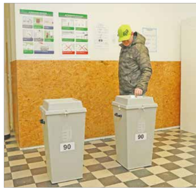
Ismét az urnák elé járulnak a szavazók.