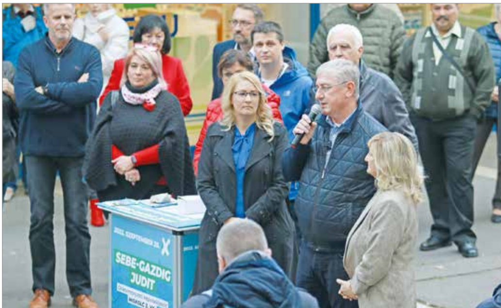
Gyurcsány Ferenc, a DK elnöke az avasi utcafórumon.

Márpedig szükség lenne erre – folytatta –, hiszen most fognak szembesülni a magyarok a magas számlákkal. Egy fórumozó hangosan meg is jegyezte, neki 23 ezer forintról 66 ezerre nőtt a gázszámlája.