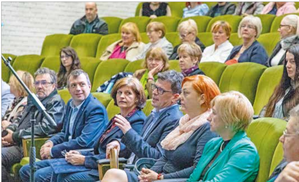
Nagy érdeklődés kísérte az jubileumi könyvtári ünnepséget.