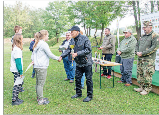
Az ünnepélyes díjátadó.

Az ünnepélyes eredményhirdetés után Széles Ernő nyugalmazott dandártábornok, a MATASz elnöke zárta be a viadalt. BGY