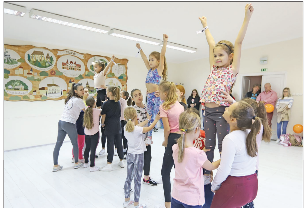
A NAGY TÁNCVÁLASZTÓ. Az Ady Endre Művelődési Ház adott otthont a rendezvénynek, ahol a klasszikus balett, latin táncok és a történelmi társastáncok alapjai is megismerhetők voltak. A „Válassz egy táncot!” szlogennel meghirdetett ingyenes program célja, hogy a térítésmentes táncórákkal elérhetővé tegye gyermek, junior, ifjúsági, felnőtt és senior korosztályok számára a választás lehetőségét.

Az átszervezés eredményeként körülbelül 100 millió forintos rezsiköltség-takarításra lehet számítani.