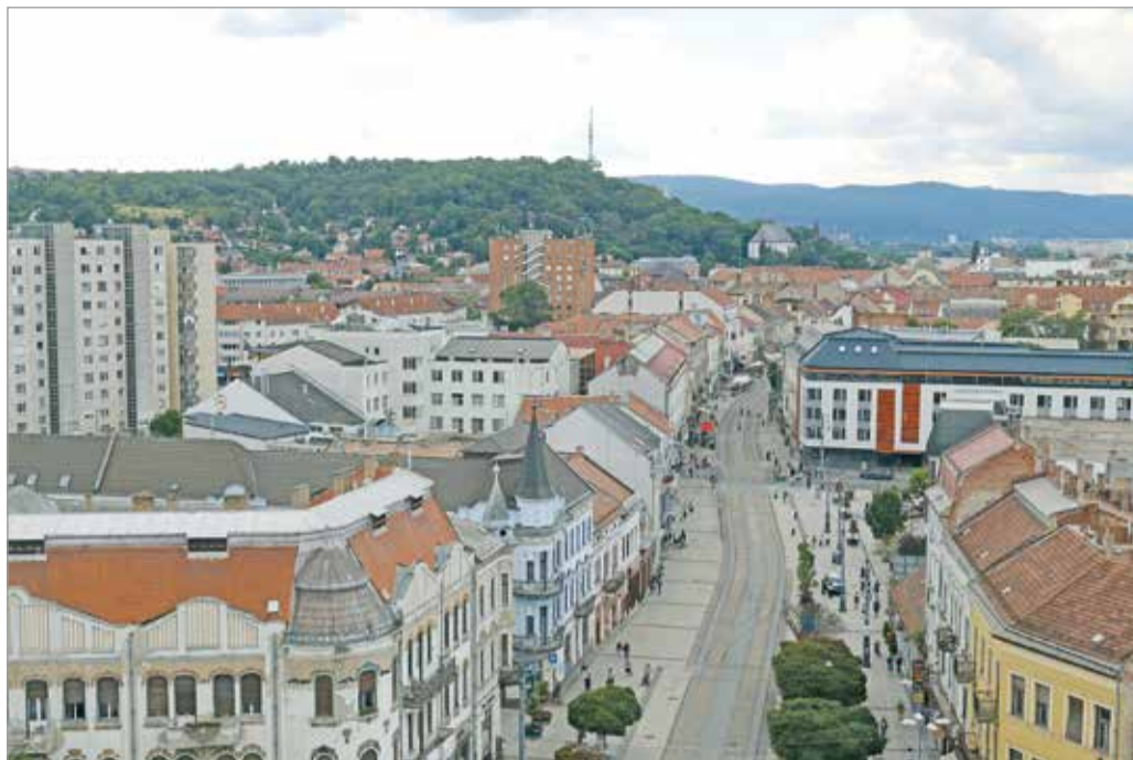
A fő kérdés az lesz: meg tudja-e fizetni a magas energiaárakat a lakosság?