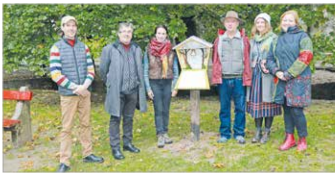
A hét állomásból álló szabadtéri tanösvényt csütörtökön adták át.

Újabb látványossággal bővült, és még inkább mesébe illő helyé vált Lillafüred.