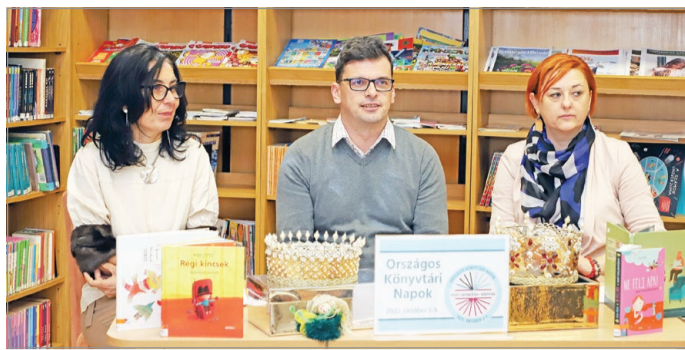
A könyvtár vezetői a sajtótájékoztatót.

Az Országos Könyvtári Napok – amelynek mottója idén az „Esély – Egyenlőség – Könyvtár” – részeként idén október 3. és 9. között várják az intézmények a látogatókat különleges programokkal. Minderről sajtótájékoztatót számoltak be a II. Rákóczi Ferenc Megyei és Városi Könyvtár munkatársai kedden. Az idei programsorozat a párhuzamosan futnak majd a magyar megyei könyvtárak működésének 70. évfordulóját ünneplő akciók is. Ezek egyike, hogy október 3-ától „70 év – 70 érv” címszó alatt hívják Miskolcon párbeszédre a könyvtárak látogatóit. „Kifejthetik véleményüket a könyvtárakról, érveket vonulathatnak fel a működéssel kapcsolatban” – fejtette ki Varga Gábor, a II. Rákóczi Ferenc Megyei és Városi Könyvtár igazgatója. Az e-mailben is beküldhető válaszokat október 26-áig várja az intézmény, ezt követően közzéteszik az összesített véleményeket. Emellett régi vendéglátogatókat is átböngésznek majd