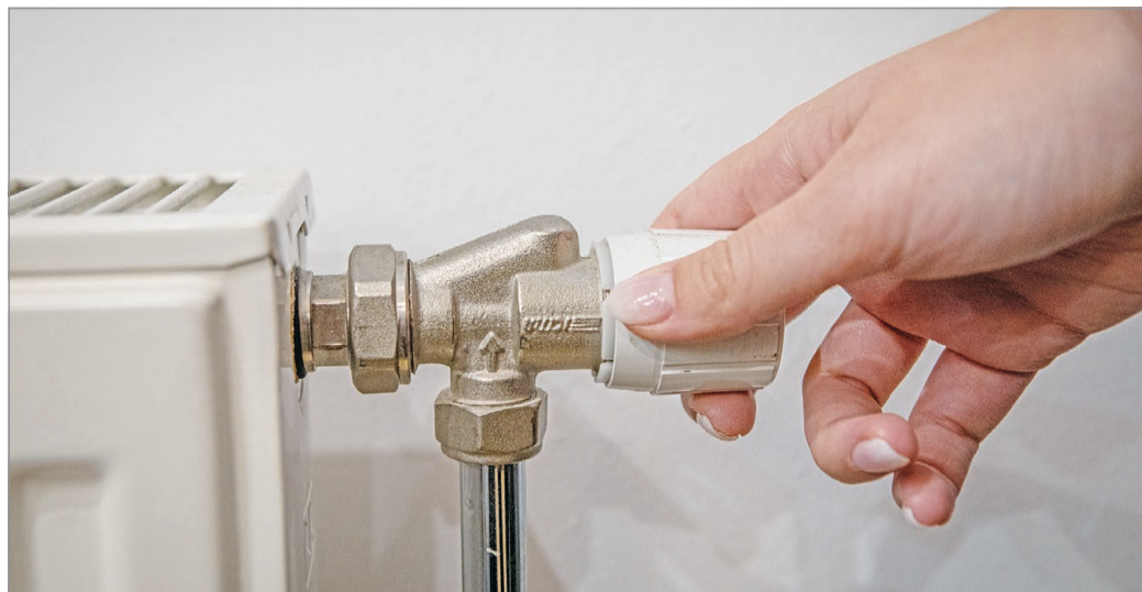
Hosszú távon a kormány programot indít a lakások fogyasztásmérővel való felszerelésére.

Egyfajta megoldás lenne a tarifák emelése, ám sok lakásban