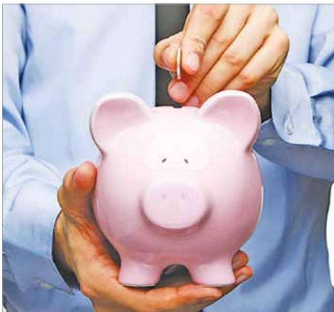
Nincs ingyenes csodamódszer

A Főgáznál a főszabály (és egyébként országosan is): minden lakossági mérőóra évi 63 645 megajoule, vagyis átszámítva körülbelül 1729 köbméter földgáz jut kedvezményes áron. Amit e fölött fogyasztunk, azt már a nemrégiben bevezetett lakossági piaci áron kell fizetni. Aki átalánydíjjal fizet, annak ez nem jelent gondot, a bediktáló fogyasztóknál viszont más a helyzet: itt az évi 1729 köbmétert leosztják hónapokra, de nem egyenletesen, hanem a szolgáltató szerinti időszaki átlagfogyasztás alapján. Tehát