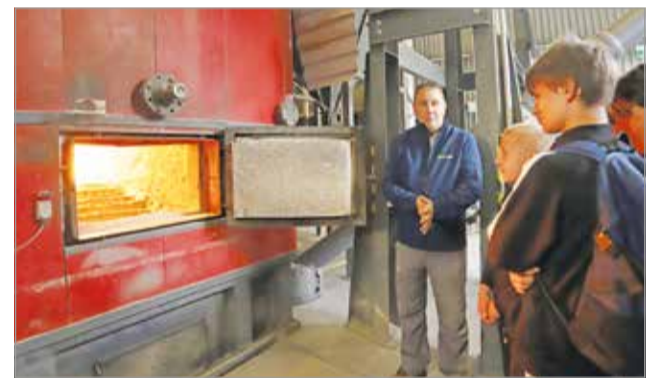
A diákok érdeklődéssel hallgatták a tájékoztatót.