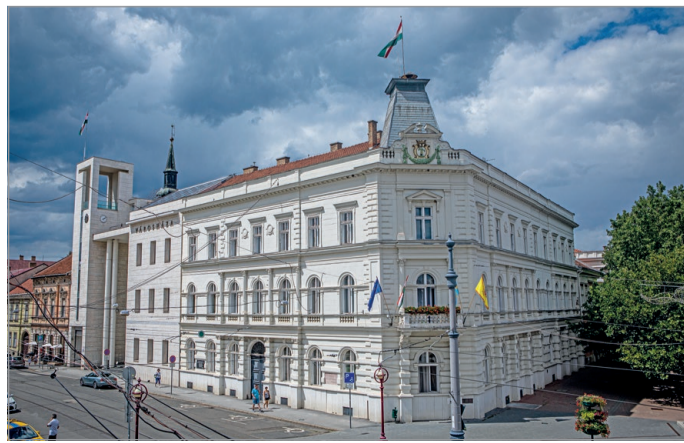
A Városvédelmi Egyeztető Testület minden szerdán ülészik.

A Városvédelmi Egyeztető Testület, amit Veres Pál, Miskolc MJV polgármesterének kezdeményezésére hoztak létre, minden szerdán ülészik, és ha kell, döntéseket hoz, hogy biztosítsa a város működését a brutálisan megemelkedett energiaárak ellenére is.