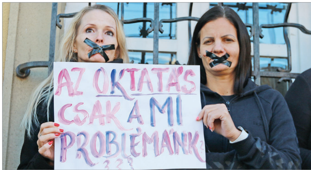
Úgy tűnik, a pedagógussztrájk nem fullad ki.

– Nagy a felelősségük, hiszen nemcsak ismereteket adnak át, hanem formálják is a diákok