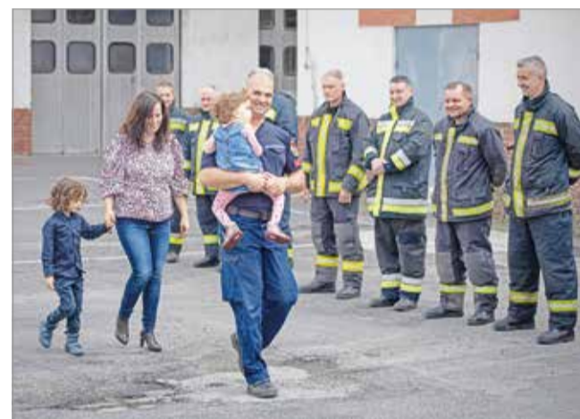
Janka és családja az adományátadáson.

A szükséges gyógykezelésre többek között egy igen sikeres, mintegy nyolcszáz embert megmozgató jótékonyági futással is gyűjtöttek. Az elért összeget végül a kislányt támogató Supersum Alapítvány kerékítette fel ötmillió forintra, amely így remények szerint akár több évnyi terápiát fedez majd. A család számára is váratlan nagyságú adományt október tizenegyedikén, az Alapítvány és a Miskolci Katasztrófavédelmi Kirendeltség szervezésében az édesapa munkahelyén, a Miskolci Hivatásos Tűzoltó-parancsnokság laktanyaudvarán adták át.