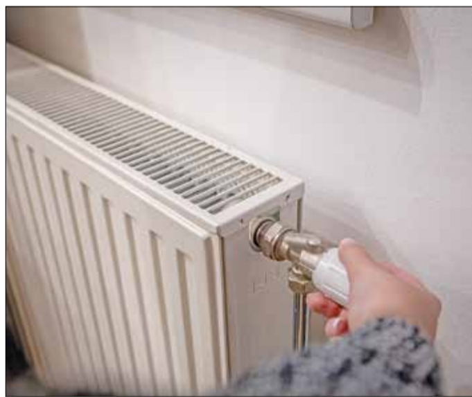
A kulturális intézményeknek is súlyos gond a számlák kifizetése