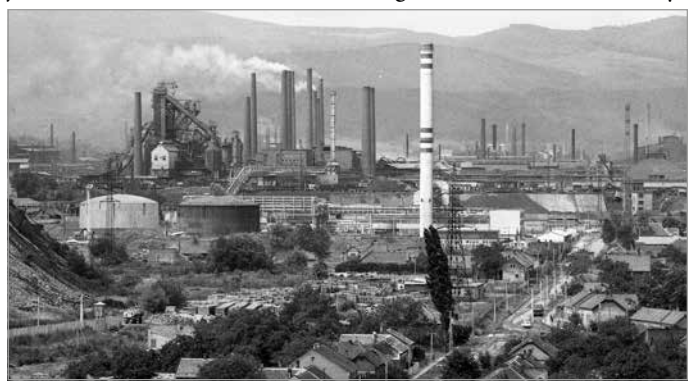
Lenin Kohászati Művek (1978).

Az emlékmű felállításának egy részét a művész ajánlotta fel, a fennmaradó összeget pedig közadakozásból finanszírozná a Miskolc Város Közoktatásáért Közalapítvány. A szervezet a „Kohászati Emlékműért” néven elkülönített bankszámlaszámra várja az adományokat: 11734004-25959499 (OTP Bank). Szükség esetén adományigazolást is adnak.