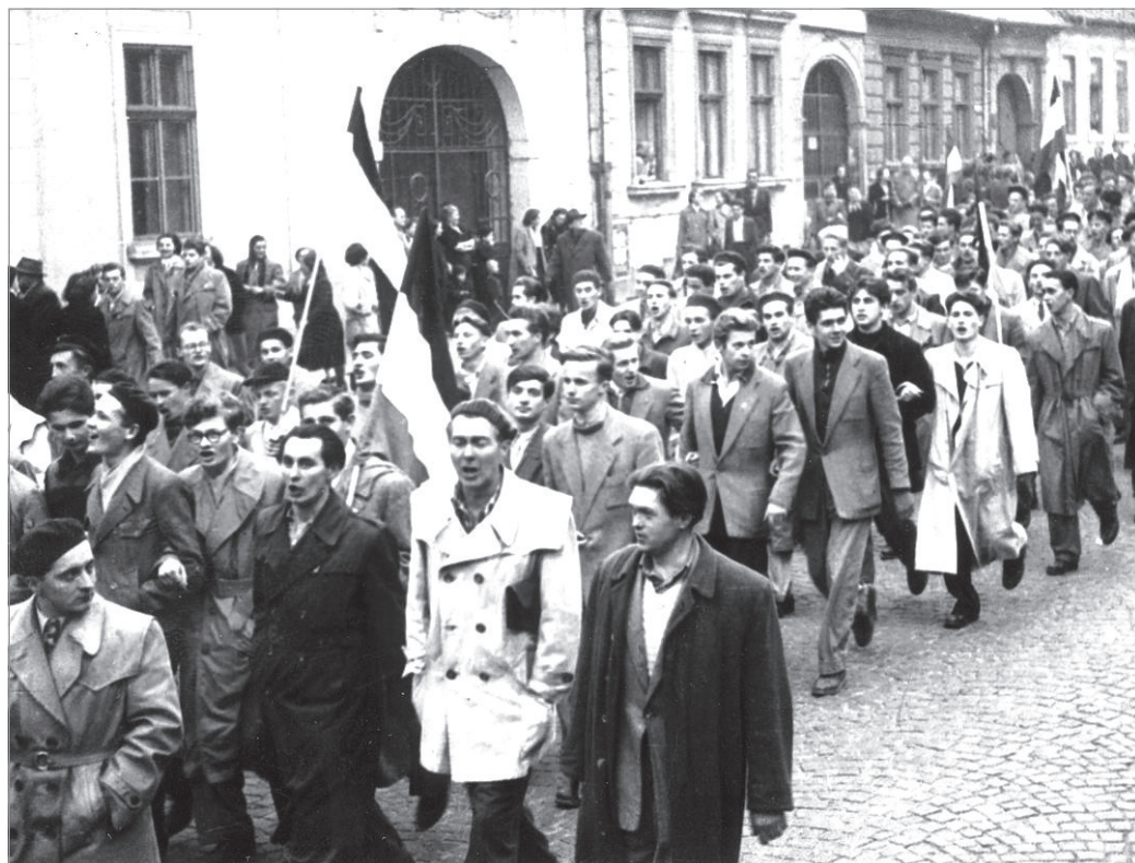
Tüntető Miskolc belvárosában 1956 októberében.

Azóta ismét harminchárom év telt el úgy, hogy már méltó módon emlékezhetünk 1956-ra, felkelésnek nevezhetjük a felkelést, forradalomnak a for-