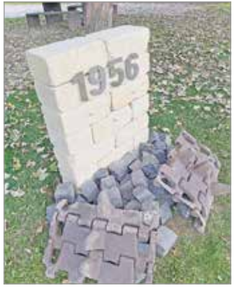
Oktober 23-án avatják az emlékhelyt Görömbölyön

– Bár az 1950-ben Miskolchoz csatolt Görömbölyön nem történt említésre méltó esemény a miskolci megmozdulás során, de a tömegben, mind Görömbölyön élő vasgyári munkások, mind egyetemisták ott voltak, ahogy erről többen szemtanúként meséltek nekem. Nem az akkori rendet, hanem a rezsim haszonélvezőit, a pártelitet, az orosz fennhatóságot akarták végleg felszámolni az akkori tüntetők. A megmozdulásnak és a megtorlásnak voltak áldozatai, sokan olyanok is, akik önkaratukon kívül kerültek a vérzivarba. „Imádkozunk halottainkért, nyújtunk ki kezünket emléküik tisztaságáért!” –invitálja a megemlékezőket az em-