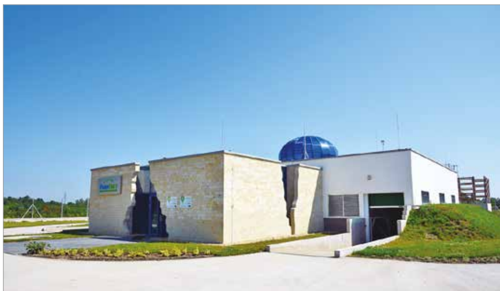
A geotermia részarányának további növeléséhez a PannErgy részéről új kutak fúrására lenne szükség

Az Index cikke azt is állítja: Miskolc vezetése úgy döntött 2020-ban, hogy eladja része-