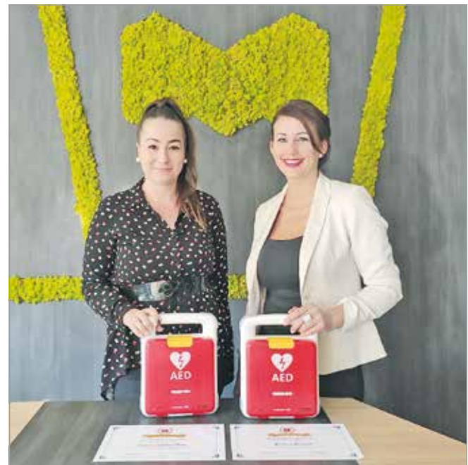
Újraélesztési oktatásban is részesültek a munkatársak

hoz mind a 15 helyszínen újraélesztési oktatásban is részesültek a kijelölt munkatársak. MN