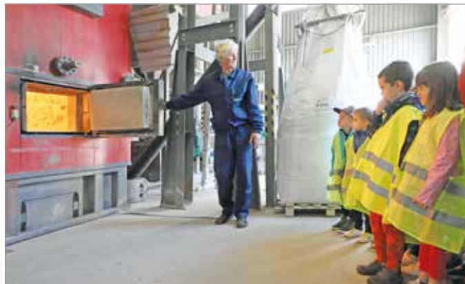
Már óvodás csoportok is jelezték, hogy részt szeretnének venni.

Miskolcon az idei évben több létesítményt is felkereshetnek az érdeklődők, hogy teljeskörűen megismerjék a város energiaellátásának folyamatát. Megnyitja kapuit az érdeklődők