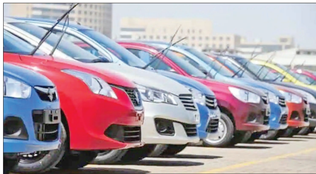
A tavaszi kínálatához képest most sokkal több az eladásra felkínált jármű

Ezt egyébként már megtapasztalhatták, hiszen a pandémia alatt konkrétan megszűnt az értékesítés, de még gyakorlatilag az érdeklődés is a használtautó-kereskedőnél. Most