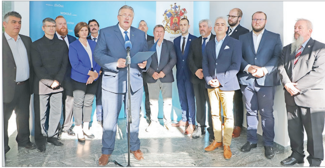
Veres Pál, Miskolc polgármestere sajtótájékoztatót tartja.

A polgármester elmondta, október 19-én Balla György miniszteri biztossal tárgyalt, ahol bemutatták az intézkedéseiket és a nehézségeket is. Igazán támogatást nem kaptunk, csupán annyit, hogy ha valóban veszélybe kerül az alapszolgáltatások ellátása, a kormány be fog avatkozni, de azt nem tudjuk, hogy milyen mértékben. Miskolc városa, hasonlóan más nagyvárosokhoz, nagyon nehéz helyzetben van. Azt gondoljuk, hogy a mi intézkedéscsomagunkkal elmentünk a falig, ezen túl már csak a teljes bezárások történ-