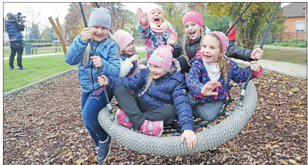
NYITVA AZ ARANYKAPU A GYEREKEK ÖRÖMÉRE. Átadták Miskolc diósgyőri városrészének legújabb közparkját, amely az Aranykapu kert nevet kapta az itt élőktől. A park része egy új játszótér is, amit az átadón jelenlévő gyerekek azonnal ki is próbáltak, és birtokba vettek. Nagy zsvajjal és sok nevetéssel tesztelték le a különböző játszoeszközöket. Az új attrakció a „Diósgyőr városközpont integrált rehabilitációja” című TOP pályázatos projekt szerves részeként készült el.

A városvezető személyesen is tárgyalta Schmidt Ádám sportért felelős államtitkárral, de részletes adatszolgáltatással is élt az államtitkárság felé. Ennek eredménye, hogy Schmidt Ádám csütörtökön levélben köszönte meg a városvezetőnek az adatszolgáltatást, és egyeztetésükre hivatkozva arról tájékoztatta a polgármestert, hogy a Kemény Dénes Városi Sportuszoda év végéig felmerülő közüzemi költségeihez közel 70 millió forintos támogatást kap Miskolc.