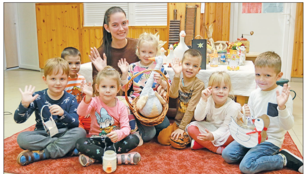
MÁRTON-NAPI LIBASORBAN. A felsőlőszolcai óvodában játékos formában ismertek meg a gyerekek Szent Márton püspök életétörténetével, a személyét övező különböző mesés történetekkel, a nevéhez fűződő népszokásokkal és hiedelmekkel. Márton-napi lámpás felvonulást tartottak a gyerekek a Felsőszőlő Napköziotthonos Óvodában, ahol az elmúlt napokban minden a hagyományokról szólt. Kirakós játékok, sorversenyek és ügyességi feladatok is várták a kicsiket. Mindezt persze mindenféle nehezítéssel színezték.

sítményű traktor multifunk- cionális. A fűnyíró szezon követően a járművek a lehu- lalt falevelek összeszedésére is használhatók, így jelenleg ös- zesen 8-10 géppel tudják egész Miskolc területén összegyűj- teni az avart.