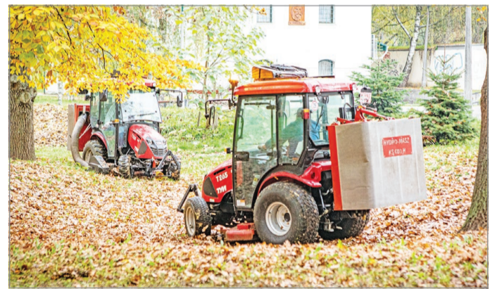
Idén jóval hatékonyabban dolgozhatnak.

A tavasszal átadott multi- funkcionális, nagy teljesít- ményű traktorokkal ezúttal nem a fűvet nyírják, hanem a lehullott faleveleket gyűjtik össze városzerte a Városgaz- da munkatársai.