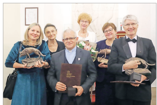
Üzv. Demján Sándorné társaságában a megyei díjazottak.