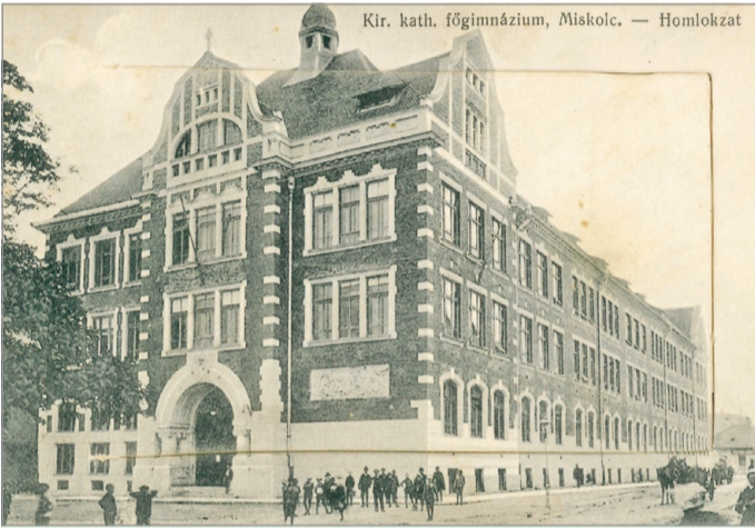
Kir. kath. főgimnázium, Miskolc. — Homlokzat

Koronakönnyítésekkel, visszavágásokkal, seb- és odúkezelésekkel kezdődött meg a héten a Vár utcai gesztenyefasor még meglévő huszonnyolc matuzsálem vadgesztenyefájának ápolása. Az önkormányzat még tavasszal minősített favizsgálót bízott meg, hogy minden egyes fáról szakvéleményt készítsen, a szakértő megállapította, hogy a vadgesztenyefasor fái gondozást és egészségügyi beavatkozást igényelnek. A vizsgálatok eredményét az összes egyednél táblákon jelölték, emellett az önkormányzat egy minden részletre kiterjedő favizsgálati, valamint faápolási jegyzőkönyvet is kapott, és az eredményekről egy fórumon a lakosságot is tájékoztatta. Az önkormányzat közlése szerint a munkák november 30-áig befejeződnek.