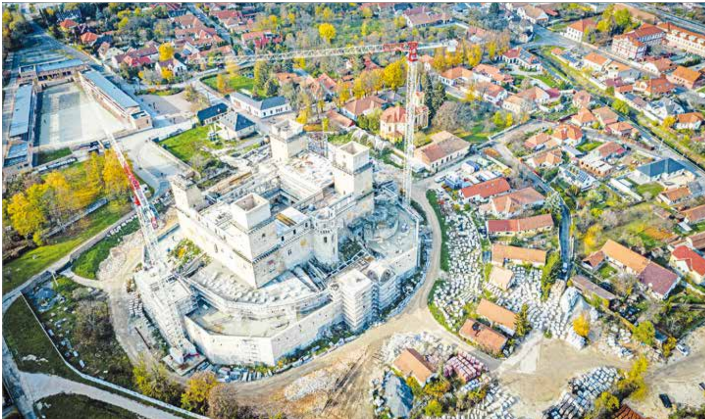
Egyelőre minden bizonytalan...

A kormány immár négy éve, 2018-ban kormányhatározatban biztosította az önkormányzatnak a közel 10,2 milliárd forintot a vár teljes kiépítésére. A forrást végül két részletben kapta meg az önkormányzat: hatmilliárd forintot még 2020-