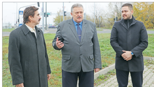
A tábla már kint van, a megújult kerékpárút jövő tavaszra készülni fog.