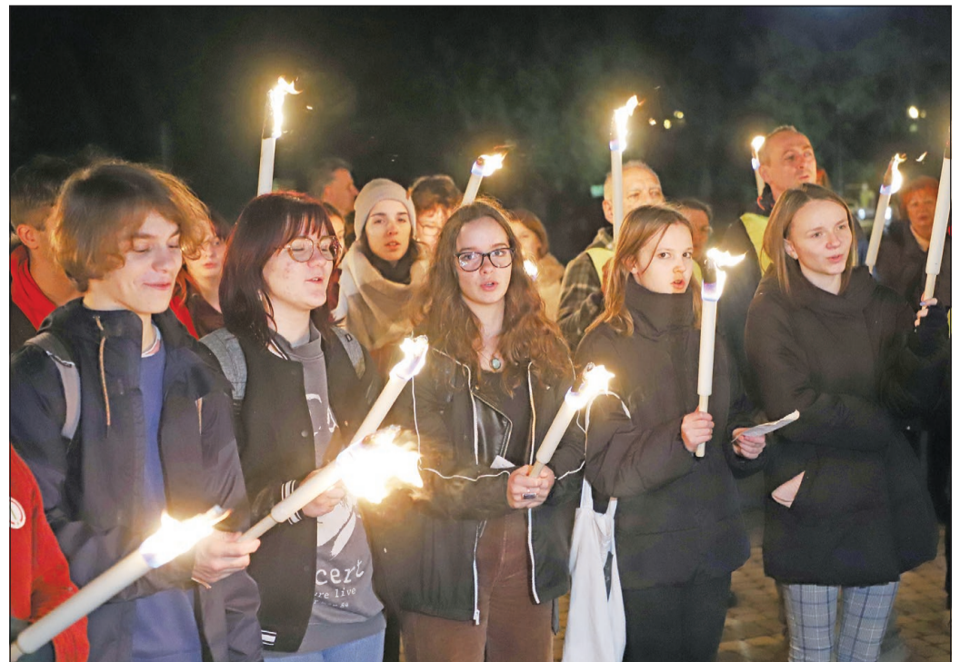
FÉNYT AZ OKTATÁSBA! – ezzel a címmel szerveztek demonstrációt november 17-én. A miskolci esemény fátylas felvonulással kezdődött, a menet két irányból, a Földes Ferenc Gimnáziumtól és a Herman Ottó Gimnáziumtól indult a város főterére. A Szent István téren a két csoportosulás egyesült, és megformálták a szolidaritás jelképét, a nyitott körben álló felkiáltójelet.

A miskolci adventi programokról a 11-es oldalon olvashatnak.