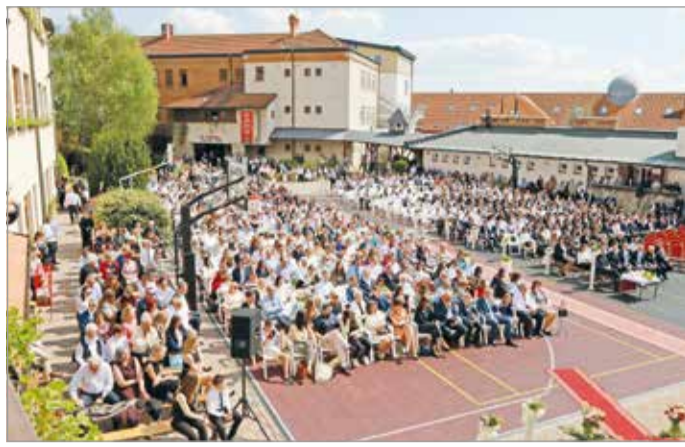
Nyolc év elegendő idő a személyiségfejlődésre.

A középiskolák központi írásbeli felvételijére történő jelentkezési határidő hamarosan lekegyeg. December másodikával azonban nemcsak a kamaszok, hanem a tinédzser éveiket épphogy megkezdők jövője is eldőlhethet. Három érintett miskolci intézményt is megkerestünk, hogy megtudjuk: mégis mivel nyújt többet a nyolcosztályos gimnáziumi képzés, mint a jól bevált négy.