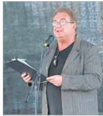
Turczai István.

Az ünnepi könyvhét programsorozatát Turczai István József Attila-díjas, Babérkoszorúdíjas és Prima Primissima díjas magyar költő, író, műfordító, szerkesztő nyitotta meg. Méltatta Supka Géza tevékenységét, majd kijelentette: a magyarok egyik „legértékállóbb”, kézzel fogható erőssége a magyar nyelv. – A jelenkor értelmezési és érzékelési káoszában, amikor nincsenek nagy szellemi iskolák, szétpat-