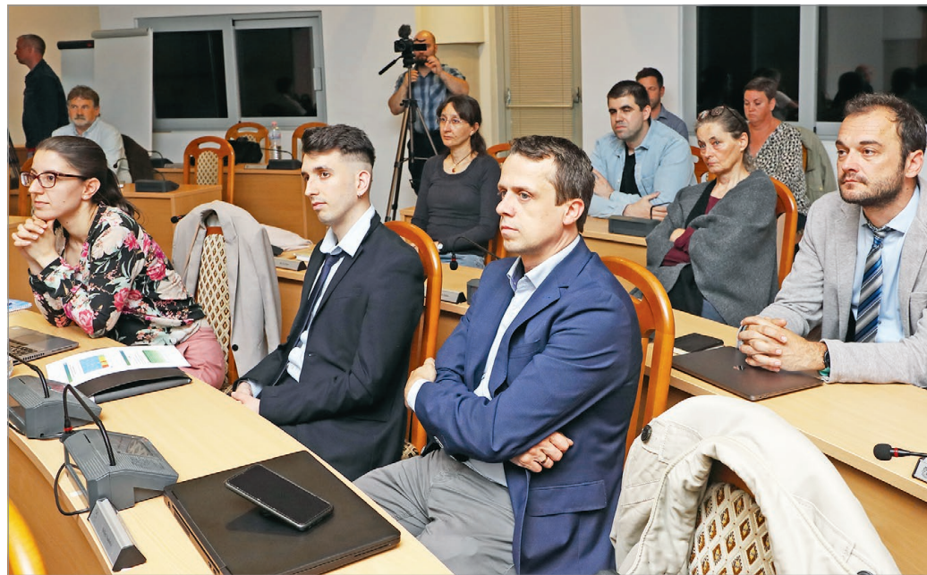
A fórum résztvevőinek egy csoportja.

A projekt egyik alapvetése, hogy a köz- és magánszféra közötti partnerségek kialakulása kulcsfontosságú ahhoz, hogy a települési szereplők összefogva eredményesebben tudjanak