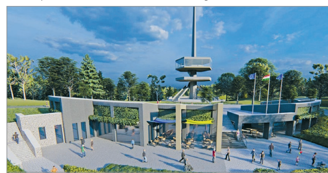
Az Avas-tető látványterve