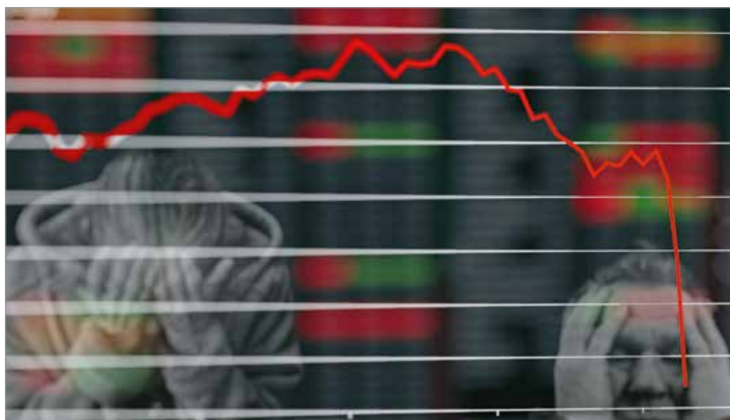
Továbbemelkedik az infláció, a lakosság bezárja a pénztárcáját

A fenti adatokat a Központi Statisztikai Hivatal (KSH) közölte. A gazdasági szakértők szerint a mutatók mögötti fő ok, hogy a hónapok óta Euró-