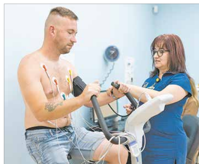
Az intézmény oktató és gyakorlati hely.