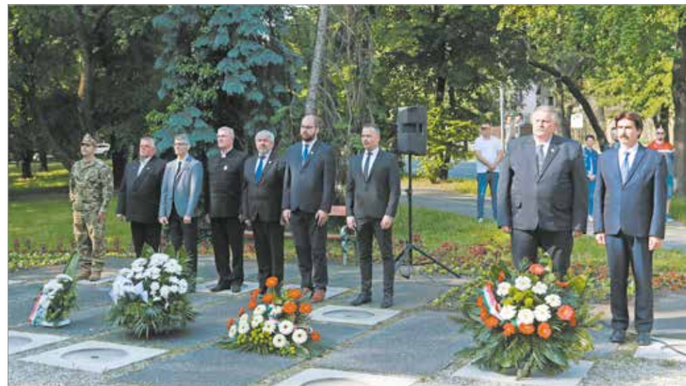
Megemlékezés a népkerti Országzászlónál.