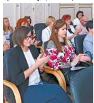
A résztvevők egy csoportja.

A Paktum partnerséget épít, támogatja a helyi váll-