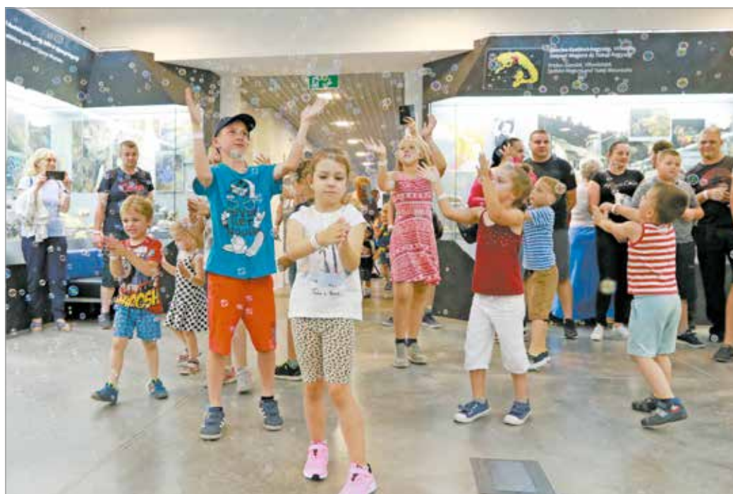
Tavaly is nagy siker volt a Múzeumok Éjszakája Miskolcon.