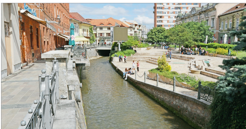
A Szinva terasz.