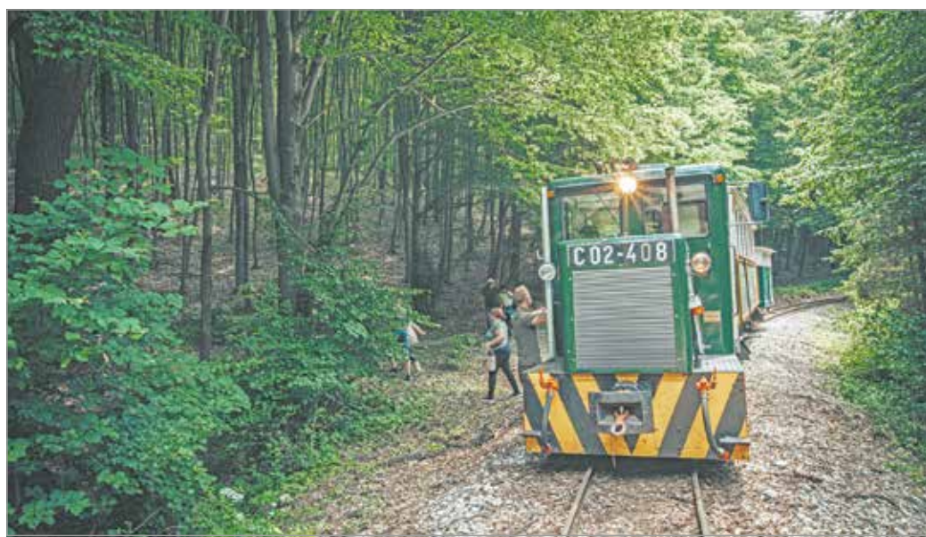
Kicsinyek, idősek kedvence a kisvasút.

Az első személyszállító vonat 1923. augusztus 20-án indult Miskolcra Lillafüredig, az utasok szállítását négy teherkocsival oldották meg úgy, hogy a kocsik platójára lócsákat helyeztek. A közben elröpült száz évben generációkat tett boldoggá az erdei vasút, gyerekek és felnőttek száz-ezreivel kanyarogva hegyen-völgyön át a bükk-erdőben.