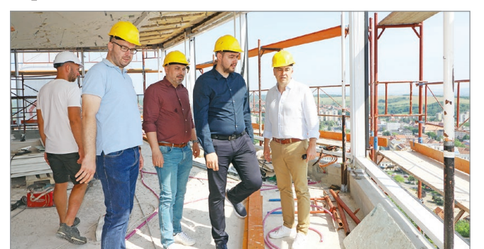
Terepszemle a kilátónál.

A munka a tervezett ütemben halad, erről győződtek meg a Velünk a Város-frakció tagjai a június 20-ai bejárásukon. Három projekt indult párhuzamosan az Avas fejlesztésének részeként; az Avasi kilátó és a Horváth-tető felújítása, valamint az Avastető fejlesztése. A városi képviselők által bejárt terület az utóbbi beruházáshoz kapcsolódik, amely a Mendi-kás út és a Perczel Mór utca között található déli domboldalon valósul meg. Miklós Viktor, a miskolci polgármesteri hivatal főosztályvezetője szerint az érvényben lévő szabályok miatt új nyomvonalakat nem lehet kialakítani, a régi járdákat, sétányokat újítják majd meg egy következő pályázattal, zömüket környezetba-