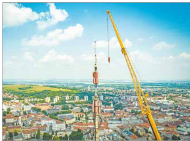
A munkálatok látványosan haladnak.