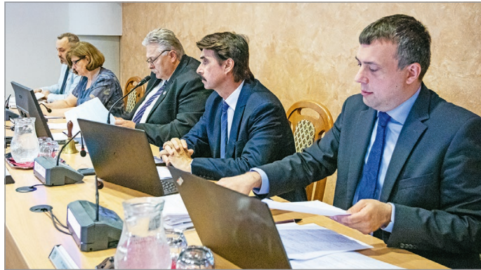
Munkában az elnökség.

A Fidesz-KDNP-frakció képviselői is benyújtottak egy előterjesztést, ami indítványozta, hogy a közgyűlés csatlakozzon az orosz-ukrán háború egyéves évfordulójáról szóló békepárti országgyűlési határozathoz. Néhány napirendi pont kapcsán számítani lehetett vitára, ám nem várt pástot is találtak maguknak a város politikai erői. Az első meglepő csörtére már a második előterjesztés kapcsán sor került. A rendeletmódosítási javaslatban az utcazenélést az engedély nélkül végezhető közterület-használatok közé kívánták