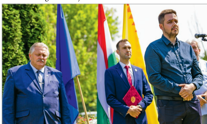
A perecesi projekt nyitó rendezvény résztvevői.