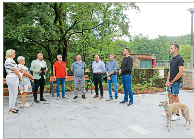
Közgyűlési tagok bejárása a tapolcai parkban.

– Képviselőtársaim részéről pozitív visszajelzések érkeztek, de pontosan tudjuk, hogy van még néhány elvégzendő feladat.