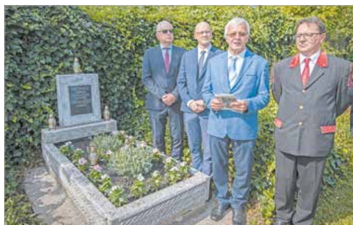
Tisztelegés Pazár István emléke előtt.