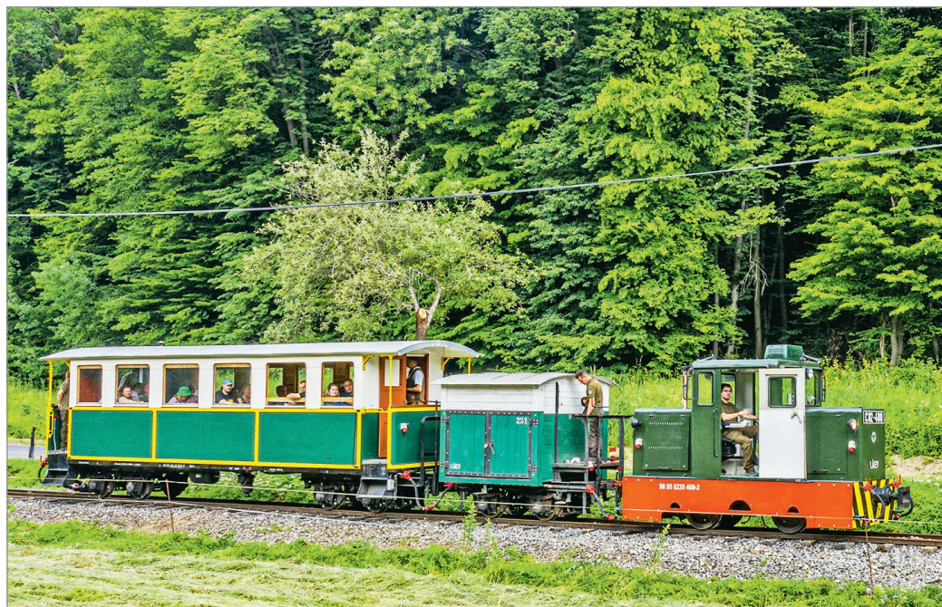
Nem olcsó mulatság a miskolci kisvonat sem.

Az előszezonra aztán kiderült: az áremelkedésnek meglett a következménye: a Magyar Szállodák és Éttermek Szövetségének becslése szerint akár negyven százalékkal kevesebb vendég fordulhat meg idén a Balatonon. Merthogy akinek van pénze, az ennyiért inkább külföldre megy, akinek pedig nincsen, vagy legalábbis nem nagyon van, az alternatív megoldások után néz.