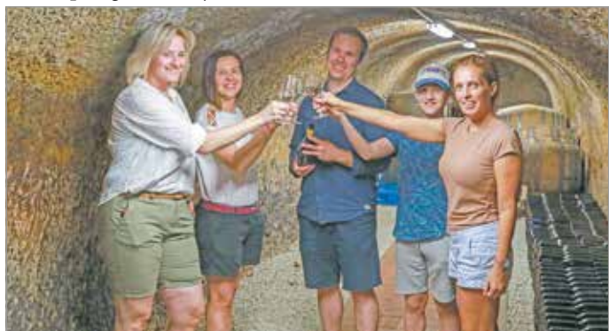
A pincékben mindig jó a hangulat.