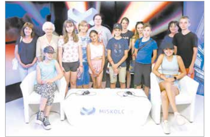
Diákok szerkesztőségünkben.