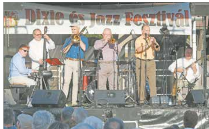
Igazi örömmel hallgathatunk a belvárosban.