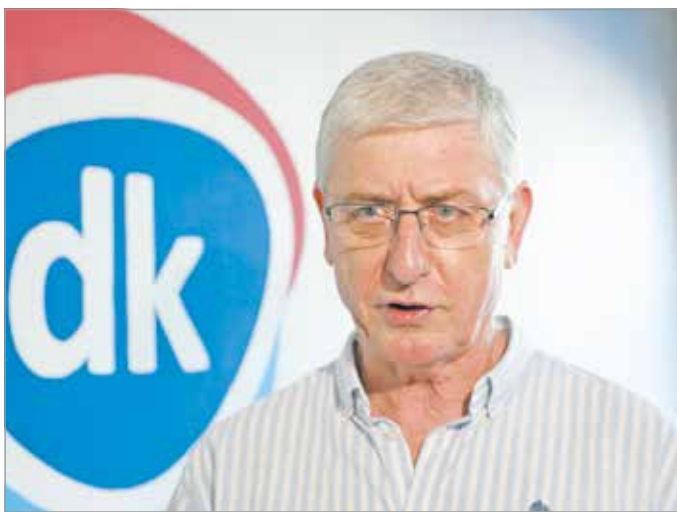
Gyurcsány Ferenc a DK miskolci irodájában.

– Készülni kell. Ha valamit sokáig nem csinálunk, megkopik abban a képességünk. Ez olyan, mint amikor abbahagyjuk a sportot, és hosszabb kihagyás után kezdjük csak újra. Az ellenzék 12 éve nem