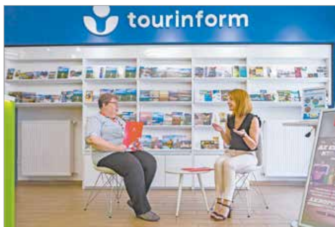
A siker mögött komoly munka van.