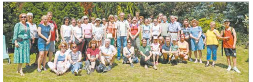
Az Avasi Arborétumban tett látogatás után egy pillanatra összeállt a csoport.

érdekességre is fény derült. A több mint egyórás séta az Avasi Arborétumnál végződött, ahol Adorján Eszter, az alapító dr. Adorján Imre unokája tartott szakvezetési sétát a csoport tagjainak.