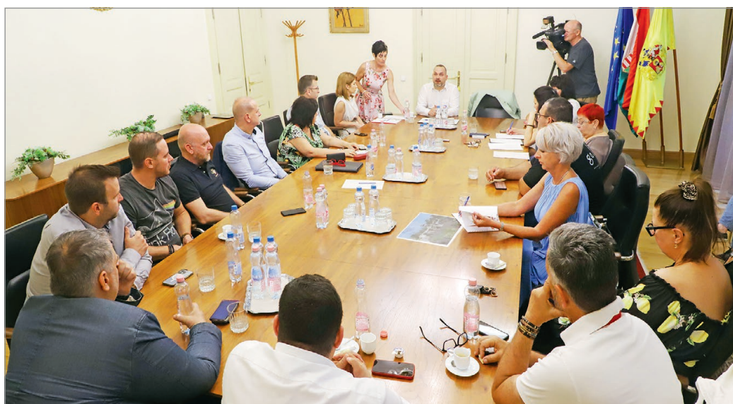
Új szereplők is voltak a turisztikai kerekasztal-beszélgetésen.

A kerekasztalhoz új szereplőként a bejegyzés alatt álló Bükk