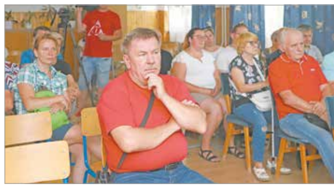
Csapadékvíz-elvezetési fórum.

A Lavotta utcán a csapadékvíz-elvezető utárok rekonstrukciója valósul meg a Harsányi út és a Szolártsik tér között. A fejlesztendő terület Görömböly városrész egyik gerincútja mentén húzódik. A Lavotta utca a Harsány felé vezető útról ágazik el a településrész központja felé. Az úttól nyugati irányban fekvő domb sűrűn beépített, családi házas övezet, melyről több meredek emelkedésű út csatlakozik rá. A megvalósításra kerülő csapadékvíz-elvezető árok hossza 670 m. A Vajár, az Aknász és a Bányamécs utca csapadékvíz-elvezetésének rekonstrukciója. A helyi adottságokat és az ottani vízgyűjtő terület figyelembe véve kerül kialakításra az újraméretezett csapadékvíz-elvezető árokrendszer az utcák mindkét oldalán a csapadékvíz rendezett elvezetése érdekében. A megvalósításra kerülő csapadékvíz-csatorna hossza: 1335 m.