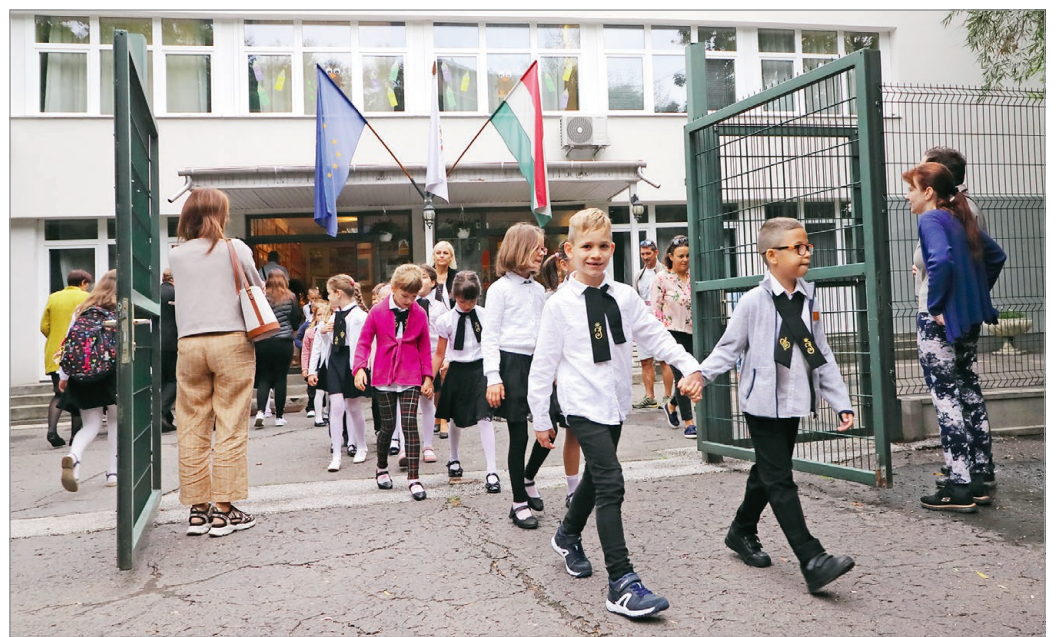
Az elsősök is lassan belerázódnak majd az új életbe.

Több mint egyéves, országos tiltakozási hullámot követően életbe lépett az új pedagó-