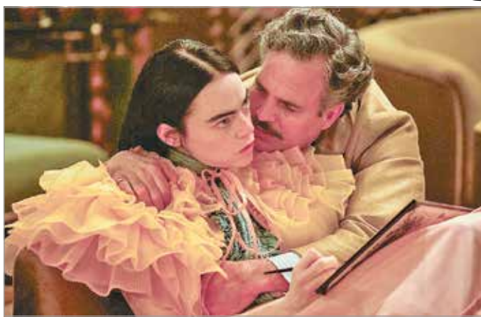
A Szegény párák című filmet Magyarországon forgatták

A Hulló levelek című finn mélabús, romantikus vígjátékban egy építőipari munkás