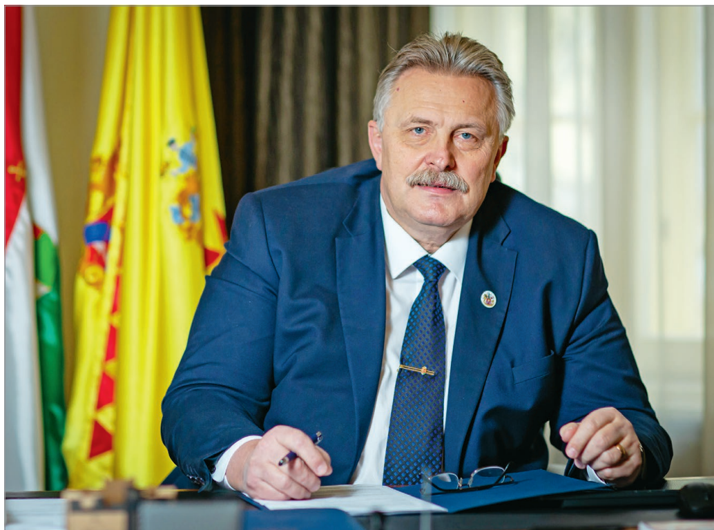
Veres Pál, Miskolc polgármestere újra megméretteti magát.

– Igaz! Akkor próbáljuk meg máshogy. A város nincs könnyű gazdasági helyzetben, sőt, ennek ellenére nyitva tudjuk tartani a tapolcai strandot, a Barlangfürdőt és a selyemréti strandot is. A fejlesztések rendben zajlanak, idén elkészül a Dayka utca és környéke, és átadjuk a megújult Avasi kilátót. A város működik, a buszok járnak, nem annyi, mint szeretnénk, de ennyi pénzből ennyi jut; folyik a víz a csapból, az alapdolgok működnek. Közben zajlik a kultúra éve, idén 50 éve zajlott Magyarország első rockfesztiválja Diógyóiban, pár napja ünnepeltük a nemzeti színházunk 200. születésnapját, 60 éves a kilátó, de megszerveztük minden idők legnagyobb és legsikeresebb Kocsonyafesztiválját, látogatórekordot döntött a Borangolás, rekordnévszámot produkált Azahria a Lovagi tornák terén, szeptemberben pedig CineFest, Szinva Örökség Napok, Ars Sacra és Miskolci Piknik gasztronómiai fesztivál lesz a belvárosban. Mindemellett dolgozunk a 2030-ig tartó fejlesztéseken, és folyamatosan keressük és csábítjuk a városba