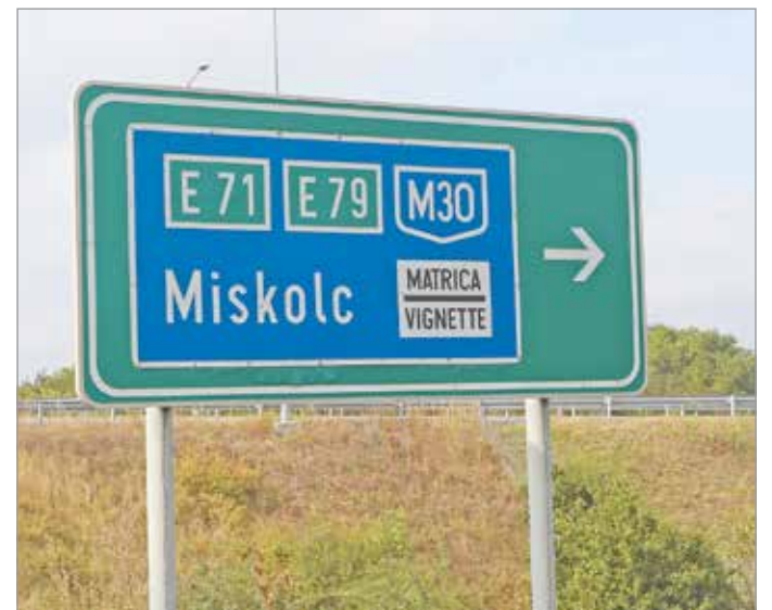
Nagy a tiltakozás az M30-as fizetősé tétele miatt.