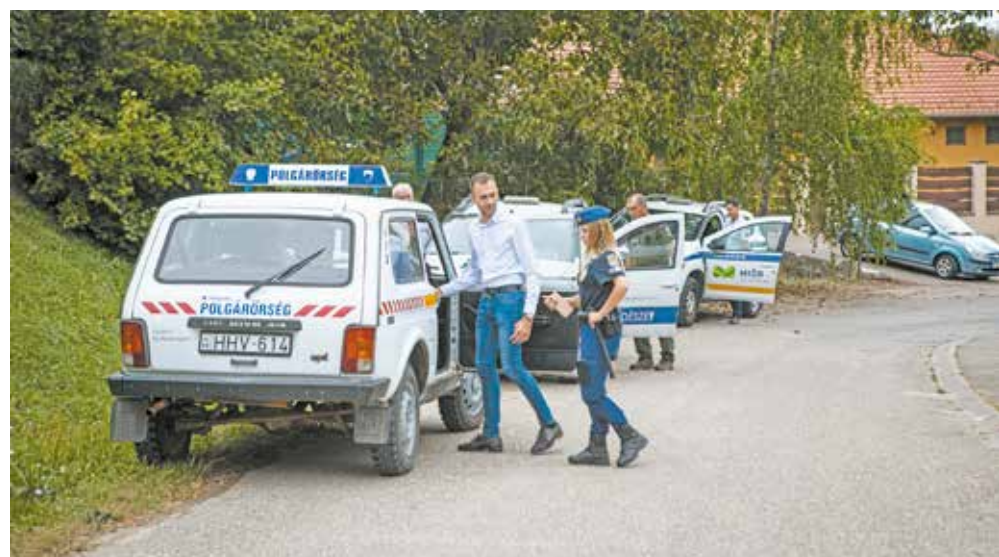
A közös járőrözés hetente más-más időpontban lesz.