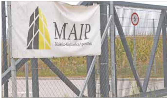
Egy hónap múlva állítólag gépek állnak majd odabent.

Az Andrada vezetői hangsúlyozták, hogy az újrahasznosítás egy rendkívül modern, biztonságos, zárt rendszerű ipari folyamat. Ezután felidéztek, hogy Szijjártó Péter külügyminiszter is örömmel fogadta a céget. Ezt követte a második, már erősebb fűzőzés.