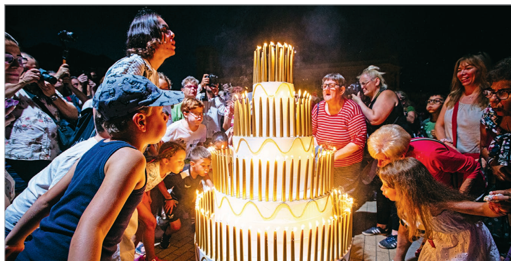
A tömeg együtt fújta el a színház születésnapi tortáján lévő 200 gyertyát.

– Amit az előbb. Hogy ez a város, a miskolciak sikere. Ebből a város profitál, akinek dolga van ezzel, az a munkáját végzi. Ha egy kormány túltámogat egy várost, ugyanúgy hibát követ el, mint amikor alultámogat – nincs különbség. Természetesen minden városvezető a saját városáért lobbizik, én is ezt teszem. És akkor járok el helyesen, ha azokra a területekre helyezük a hangsúlyt, ahol sikerre van esélyünk. Ahogy már korábban is mondtam, minél többféle szektor meglepül a városban, annál jobb, mert akkor több lábunk állunk, annál stabilabb a város gazdasága. És én ilyennek szeretném látni Miskolcot, egy több lábunkon álló, fejlődőképes, kiegyensúlyozott városnak.